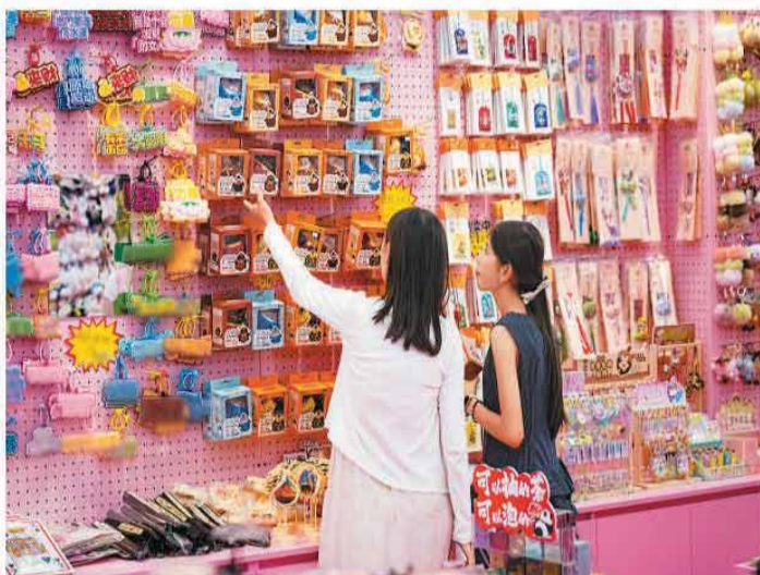
入夏以来，陕西省西安市打造“旅游+购物”多元场景，盘活当地文旅资源、激活夜间消费活力，为城市经济发展注入新动能。图为7月4日，游客在西安市某商圈的文创店内选购商品。

国家发展改革委表示，将会同有关部门，督促指导各方抓紧推进项目建设，强化全过程闭环管理，加快形成更多实物工作量，充分发挥中央资金使用效益。