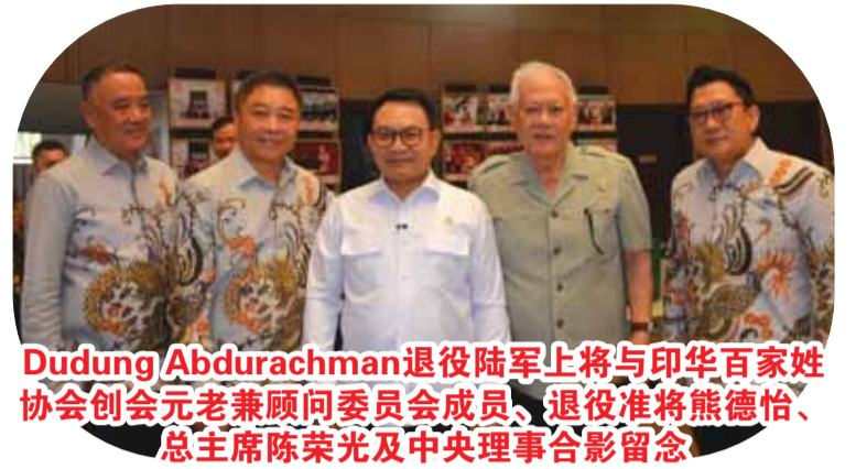
Dudung Abdurachman退役陆军上将与印华百家姓协会创会元老兼顾问委员会成员、退役准将熊德怡、总主席陈荣光及中央理事合影留念

【雅加达讯】总统办公厅主任、退役陆军上将Dudung Abdurachman于2026年7月6日应邀出席在雅加达印尼缩影公园(TMII)印尼客家博物馆举行的联谊交流活动，与印华百家姓协会(PSM-TI)中央领导层举行战略对话。双方就国家经济、法治建设及全球局势等问题深入交换意见，旨在进一步加强政府与华社之间的沟通合作，共同支持国家建设发展。