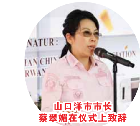
山口洋市市长蔡翠媚在仪式上致辞