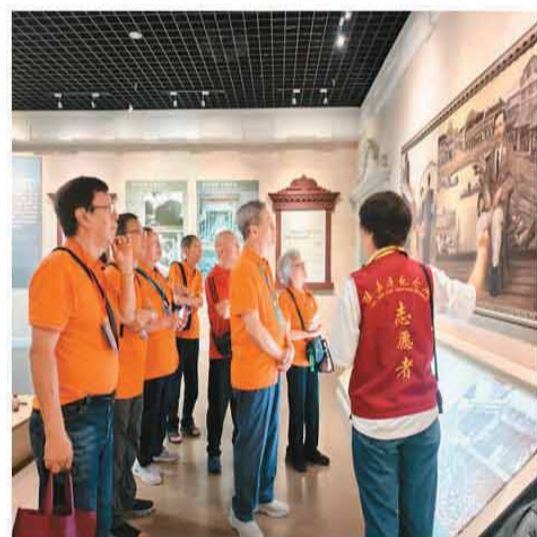
集美学校校友在陈嘉庚纪念馆聆听“嘉庚故事”。

“集美侨校”即集美华侨学生补习学校,由爱国侨领陈嘉庚先生倡议并主持创办,于1953年经中央批准正式筹建并招收首批学生,是新中国早期专门接收海外华侨子弟归国求学的特色院校。至上世纪90年代初,集美侨校先后培养侨生2万余人,校友遍布世界各地,被誉为“侨生摇篮”。1997年,集美侨校改制并入华侨大学,现为华侨大学华文学院,学院现有在读学生2300余人,生源覆盖亚洲、欧洲、美洲、非洲等70余个国家和地区。