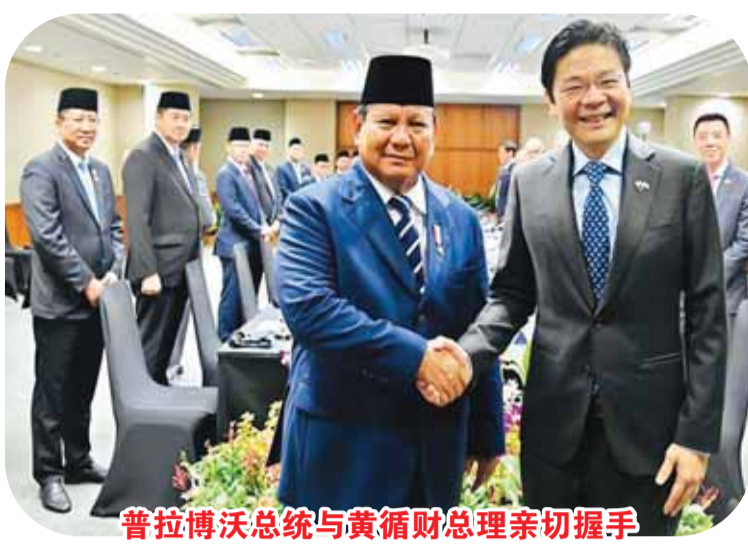
普拉博沃总统与黄循财总理亲切握手

加坡-印尼领导人年度峰会。这是两位国家领导人举行的第二次年度峰会。 此次年度峰会再次体现了两国长期以来密切的双边关系,以及双方政府进一步深化双边合作的共同承诺。 两国领导人在会晤期间将探讨进一步加强双方共同关心且互利领域合作的各种机遇,以促进新加坡与印尼之间