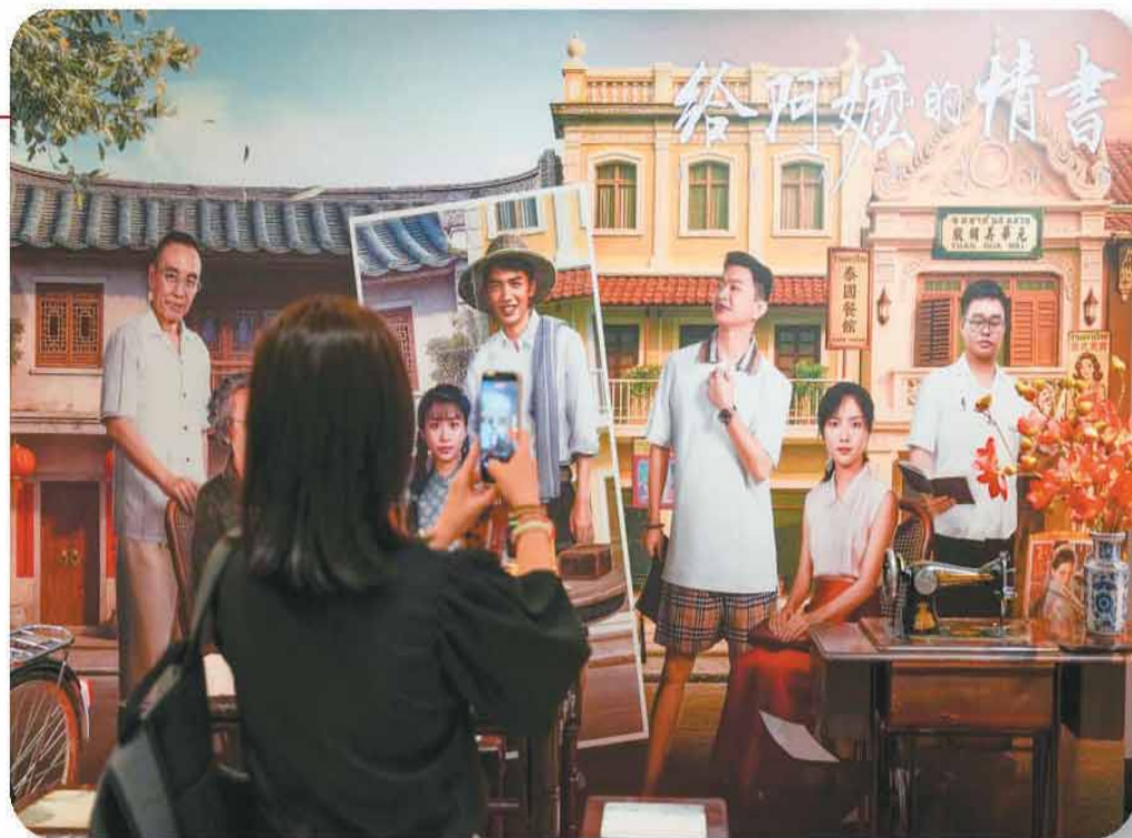
6月15日,在马来西亚首都吉隆坡,观众在电影《给阿嬷的情书》特别展映活动现场拍照。

马来西亚侨团组织侨胞包场观影,年轻一代华人在社交平台自发推荐,“看《给阿嬷的情书》了吗?”成为华人聚会寒暄的话题……从银幕前的含泪观影到餐桌上的热烈讨论,从电影中的故事情节到记忆里的家族经历,《给阿嬷的情书》在马来西亚华人观众中引发深深共鸣。