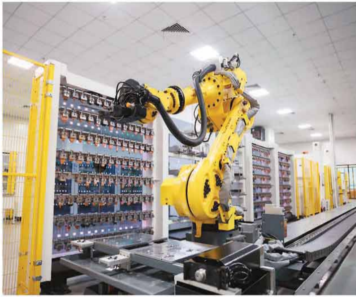
在广东省东莞市一家企业的智能工厂数字化车间，工业机器人进行生产作业。