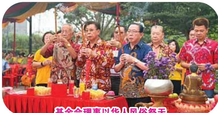
基金会理事以华人风俗祭天

承诺以公开透明、循序渐进的建设方案，祈愿高中部校舍顺利建成，尽快投入使用，培育本地人才，服务社会。