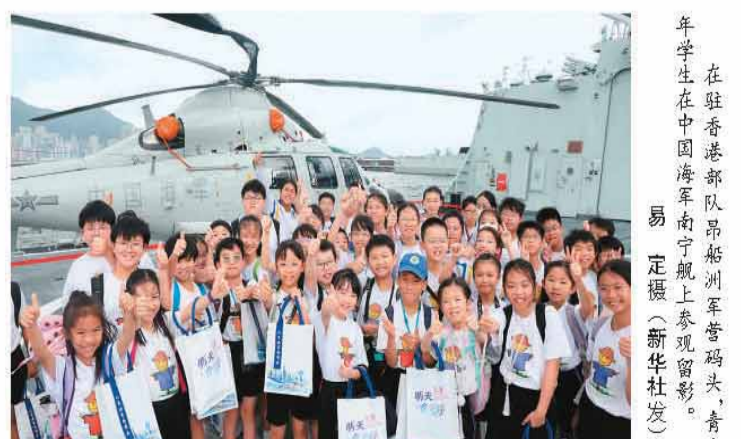
在驻香港部队昂船洲军营码头，青少年学生在中国人民解放军南宁舰上参观留影。