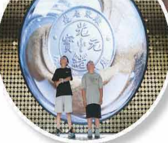
位于广东省广州市白云区均禾街的平和和押是目前广东省发现保存最完整、规模最大的的一座当铺旧址,建于

1917年。目前,广州市白云区通过对平和和押及周边区域进行深度的历史文化挖掘与创意改造,打造集文化展馆群落、金融产业街区与文化旅游于一体的历史文化创意街区,展示岭南文化。