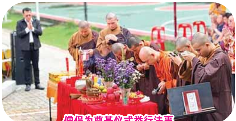
僧侣为奠基仪式举行法事