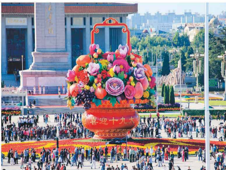
二〇一七年国庆节前夕，天安门广场，人们喜迎十九大。

2017年10月24日，党的十九大胜利闭幕，习近平总书记发表重要讲话，激荡会场，传遍神州。