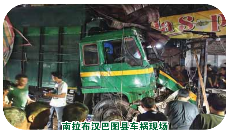
南拉布汉巴图县车祸现场

【本报讯】7月4日,北苏门答腊(苏北省)南拉布汉巴图县(Labuhanbatu Selatan)科塔皮囊乡(Kotapinang)的苏迪尔曼大街发生了涉及13辆车辆的连环撞车事故。这起致命事件导致2人死亡,另有13人受伤。 这起事故也在社交媒体上迅速传播。@jayalabusel Instagram账号上的视频显示,事发现场气氛紧张且慌乱。汽车、摩托车等多辆车被毁坏并四分五裂。不仅如此,现场附近的