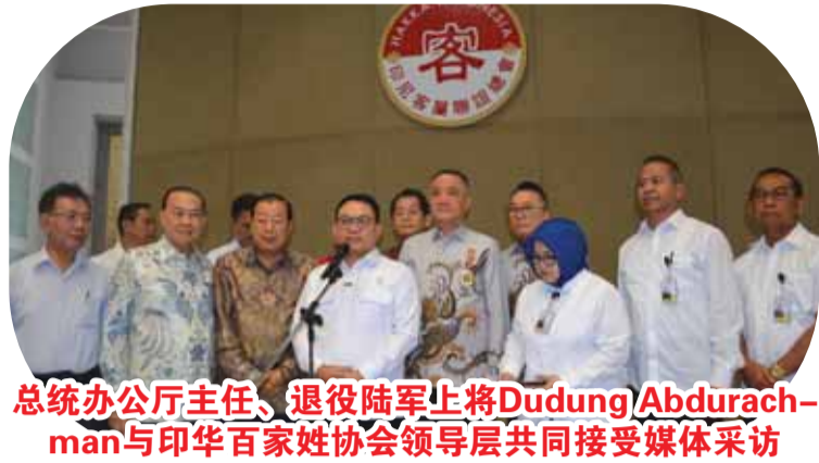
总统办公厅主任、退役陆军上将Dudung Abdurachman与印华百家姓协会领导层共同接受媒体采访