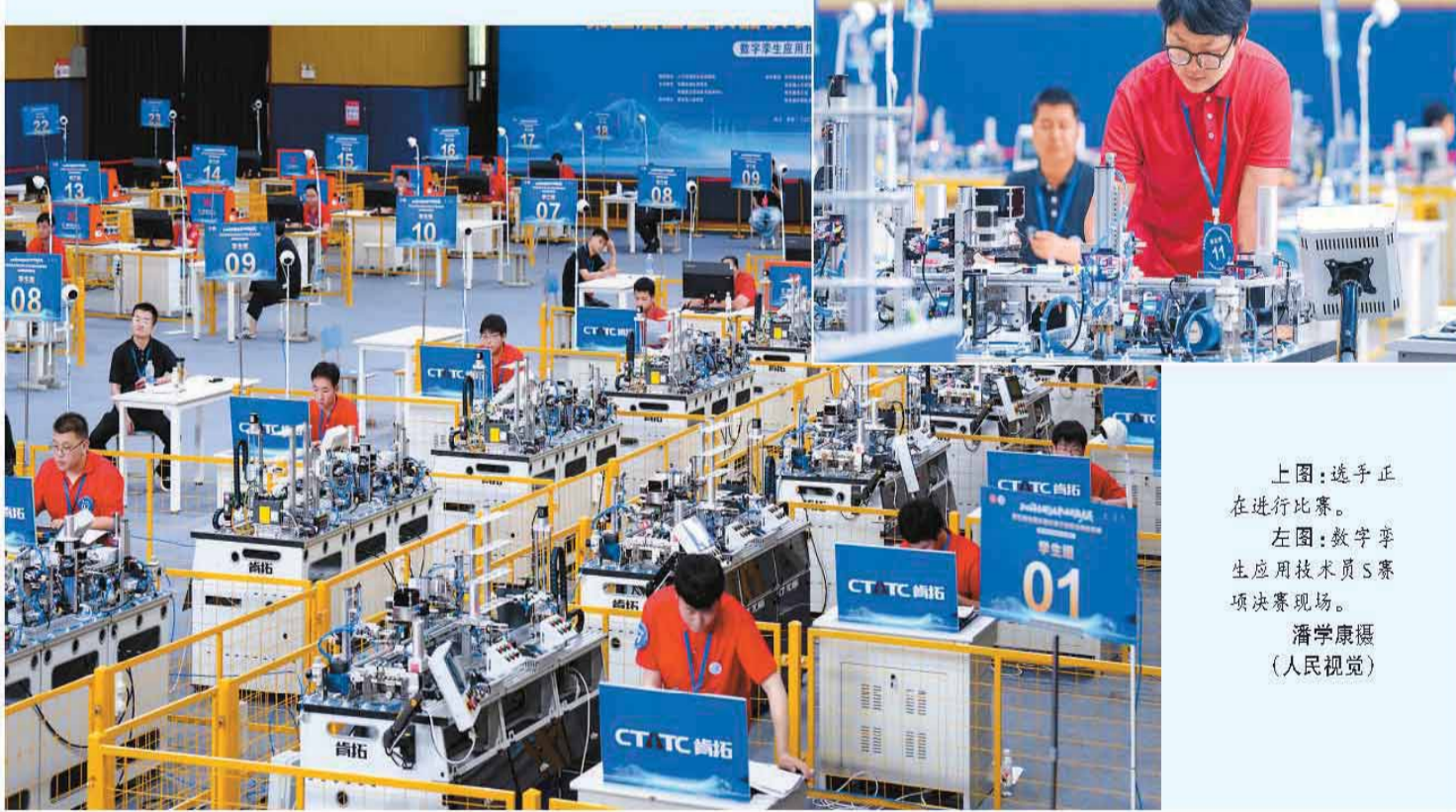
上图：选手正在进行比赛。 左图：数字孪生应用技术员S赛项决赛现场。

近日，第五届全国仪器仪表行业职业技能竞赛数字孪生应用技术员S赛项决赛在浙江省湖州市安吉技师学院举行。本次决赛聚焦数字孪生技术在智能装备领域的创新应用，共有来自全国各地的131名选手参赛。