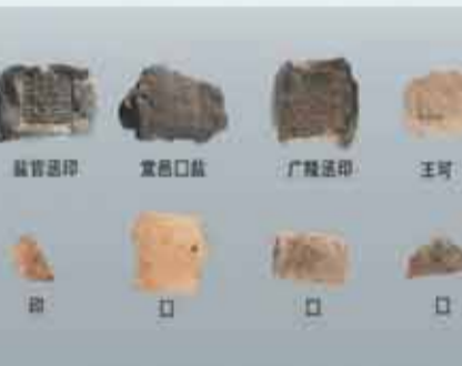
江苏盐城沙井头遗址出土的汉代盐官封泥等。

叙事，增添了海盐这一事关生计的资源背景。值得关注的是，遗址群还首次揭示出舟山群岛自新石器时代晚期以来以海盐产业为主导的地域文化特色，实证了岛屿地区在中华文明多元一体形成过程中具有重要的战略地位。