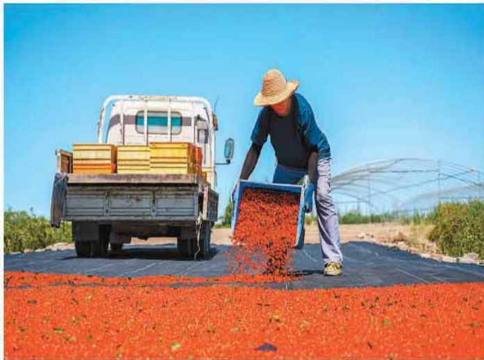
近年来，甘肃省酒泉市金塔县西坝镇依托订单农业发展规模化枸杞种植，不断拓宽产销渠道，推动产业提质增效。图为工人在西坝镇千亩枸杞连片种植基地晾晒枸杞。