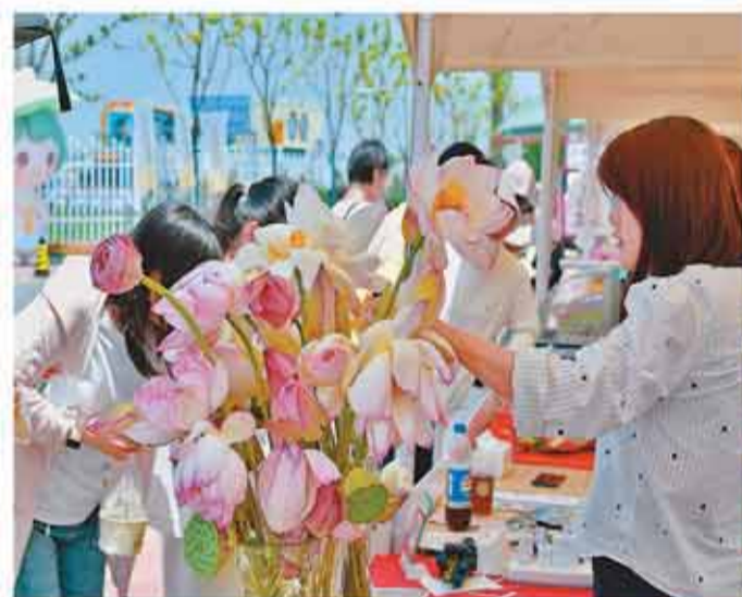
近年来，江苏省如皋市城北街道平园池村因地制宜发展特色农文旅产业，丰富旅游新场景和消费新空间，为乡村振兴注入动力。

《意见》提出到2030年和2035年两个阶段发展目标。到2030年，新型基础设施实现规模化部署，建设5万张工业5G专网，打造5个左右具有国际影响力的综合型平台，融合应用实现207个工业中类全覆盖，培育一批分级分类、特色鲜明的5G工厂，重点行业规模以上工业企业安全分类分级普及率达到80%。工业互联网技术、标准、产品供给不断完善，企业实力和跨界合作水平显著提升，核心产业增加值突破2.5万亿元。到2035年，建成全球领先的工业互联网基础设施体系和国际先进的技术产业体系，融合应用实现国民经济重点行业领域广泛深度覆盖，全面形成对新型工业化的支撑能力。