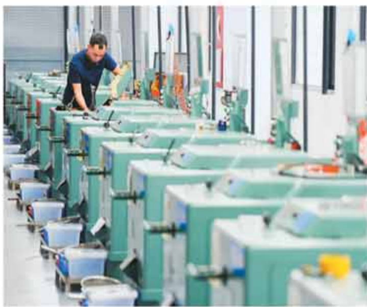
位于四川天府新区眉山片区的一家精密部件生产企业车间内，工人在生产线上赶制订单产品。

从结构看，高技术制造业PMI为53.5%，比上月上升0.6个百分点，明显高于制造业总体，高端制造发展持续向好，引领作用进一步增强；装备制造和消费品行业PMI分别为52.5%和50.2%，比上月上升0.4个和