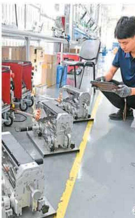
图①：在湖北省宜昌市秭归县，技术人员正在操作管道检测机器人，为地下排水管网开展“全身体检”。