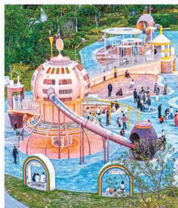
江苏省近年来打造起诸多“口袋公园”，成为周边居民就近休闲、亲子出游好去处。图为宿迁市宿城区一处“口袋公园”。

城市数字基础设施不断升级，中国已建成全球规模最大、技术领先的移动通信网络，5G移动电话基站数量快速增长，截至2025年底我国5G基站数达483.8万个，是2020年的6.3倍。