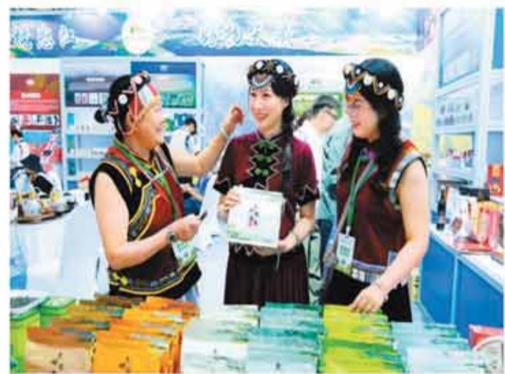
近日，第四届乡村特色产业高质量发展大会在北京全国农业展览馆举行。本次活动吸引500余家企业携粮油果蔬、畜禽特产、非遗文创等乡村好物参展，各地采购商到会场洽谈。图为工作人员在展会现场展示特色农产品。

2025年底，全国持证供电企业共2889家。其中，国家电网所属供电企业约占70%，南方电网所属供电企业约占13%，内蒙古电力集团及其他地方供电企业约占8%，增量配电网企业约占9%。全国共有供电所（站）2万个，供电营业厅、便民服务站等城乡供电服务网点9.9万个，供电服务从业人员56.5万人，遍布城乡的基层服务力量持续夯实筑牢。绿色出行网络快速拓展。全国电动汽车充电设施数量突破2000万个，山东、湖南、云南等19个省（区、市）实现充电设施“乡乡全覆盖”。有关部门全年累计为21万个充电桩提供“三零”接电服务，节省办电投资超4亿元，覆盖小区超7万个。