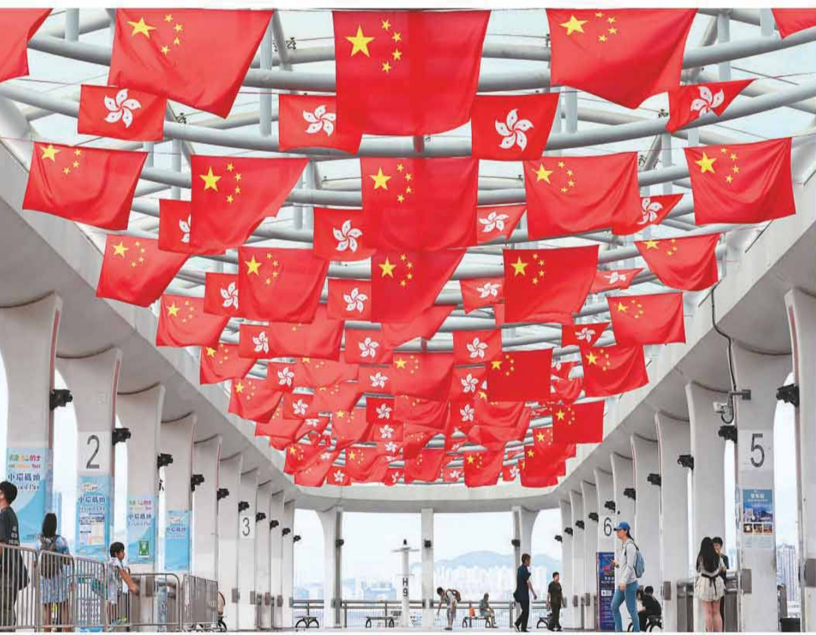
6月30日,香港中环九号码头,国旗与区旗高高悬挂,迎风飘扬,欢庆香港回归祖国29周年。

据新华社澳门电(记者付敏)以“雅韵和声·两岸连心”为主题的第十八届海峡论坛·海峡两岸音乐交流季近日在福建厦门举办。两岸知名音乐家、艺术从业者及青年人才等近300人聚首厦门,共同探讨两岸音乐交流合作。