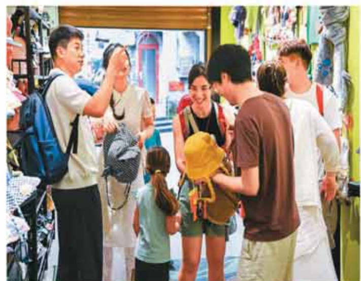
近年来，广西壮族自治区多地深入挖掘本土文化资源，不少企业和创作团队把绣球、壮锦、舞龙醒狮等技艺融入背包、鞋帽、服装等文创产品，吸引不少消费者选购。图为游客在广西桂林一家文创店选购商品。

据了解，《国务院关于对外投资的规定》于7月1日施行。王一斐表示，规定的出台回应了广大出海企业对统筹发展和安全、推进对外投资高质量发展的迫切需求。对于保护企业合法权益、维护国家主权安全和发展利益意义重大。规定提出“要统筹贸易等领域服务资源，为投资者提供服务保障”，并明确“贸易投资促进组织按照章程提供与对外投资有关的服务”，为更好服务企业对外投资提供了法律依据和行动指南。