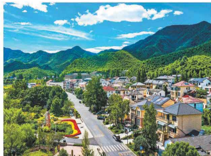
“两山”理念诞生地浙江安吉县余村村。

巍巍太行，层峦叠嶂。河北阜平骆驼湾村，满眼浓绿、好山好水，吸引了众多游客前来“打卡”。曾经“石头缝里难挣钱”的地方，如今山上林果飘香、山下菌棒生金，还成为精品旅游线路上的景点。