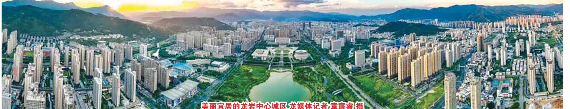
美丽宜居的龍岩中心城区

主要流域16个国控断面优质水比例首次实现100%、中心城区空气质量综合指数全省第二、PM2.5浓度连续三年全省最低.....一组组亮眼数据,展现出2025年龍岩生态环境保护的丰硕成果。