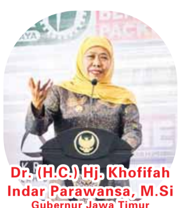
Dr. (H.C.) Hj. Khofifah Indar Parawansa, M.Si Gubernur Jawa Timur

本届展会共有90多家企业参展，其中包括10家中小微企业 (UMKM)。参展商展示了包装、印刷、食品饮料加工、制药、物流及制造业等领域的创新产品与解决方案。与此同时，东