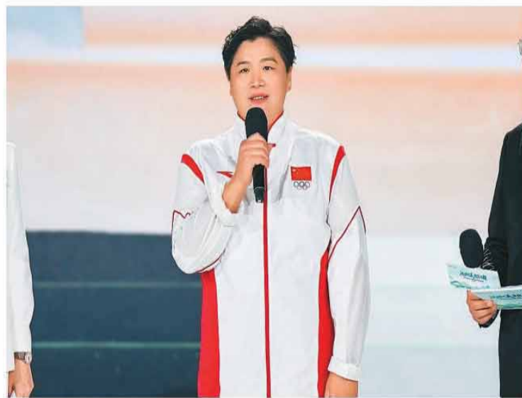
奥运冠军巩立姣在展演活动中。

2023年，国家体育总局启动“中华体育精神颂”系列活动，并以此为依托，加强运动项目文化规范化、系列化、品牌化建设。国家体育总局副局长崔剑表示，期盼运动项目文化建设进一步扎根基层、贴近群众，与非遗传文化、旅游产业、城市地标等要素有机融合，期待各地继续大胆探索、各展所长，在运动项目文化的创造性转化和创新性发展中贡献更多“地方经验”。