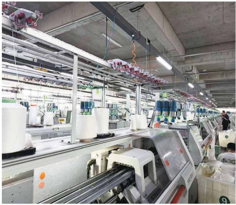
河北新华羊绒制品有限公司的生产车间内，机器正加足马力赶制订单。

邢台市工业和信息化局党组成员、副局长董南星介绍，近年来，邢台市自行车产业规模持续扩大，平乡县自行车童车上游相关企业数量已达5200余家，年产自行车达2000万辆、童车5000万辆、智能玩具6000万台套，零配件组装能力2500万辆，市场占有率达50%以上。