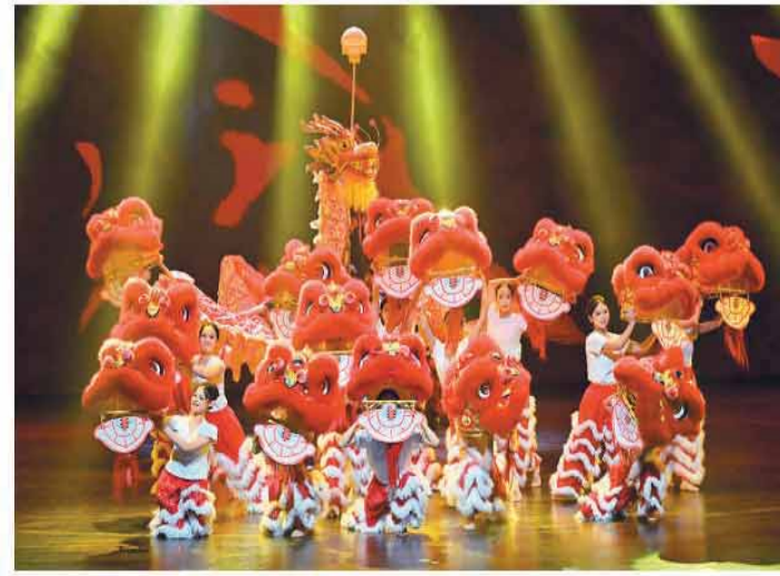
第二届海峡两岸民俗文体汇之“客韵同音·两岸同源”海峡两岸民俗文化交流晚会近日在广东河源举办。两岸艺术家同台献艺,以客家山歌、非遗展演、书法互赠等多元形式,共叙血脉亲情。图为龙狮舞《龙狮欢腾》。

此前,驻香港部队已于6月20日至21日在昂船洲军营举办了“七一”军营开放活动。据悉,今年驻香港部队共开放昂船洲、石岗和新围3个军营,总计5.8万余人营参观。