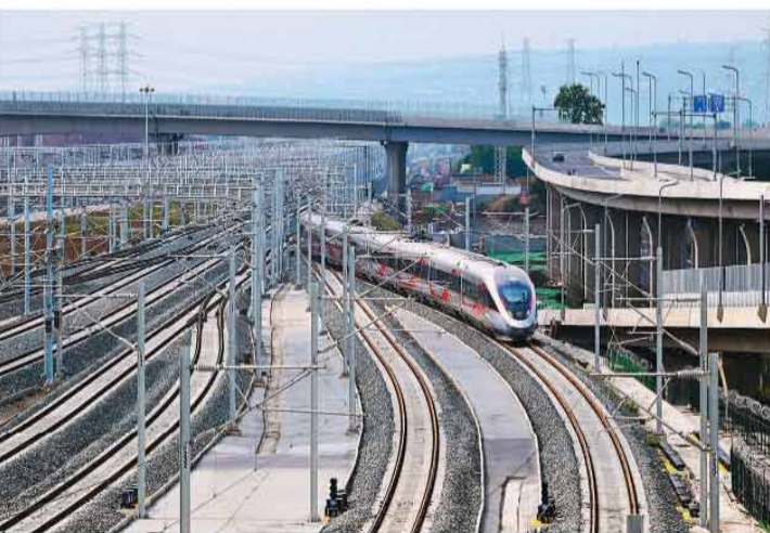
6月30日，陕西西安，G3966次列车驶出西安东站。

国铁集团组织各参建单位加大科研攻关力度，优质高效推进工程建设。西十高铁衔接“八纵八横”高铁网主要干线通道，是西部高铁网的重要组成部分，北接西延高铁，南连汉十高铁，经联络线接入西安北站，东西衔接徐兰、西成、银西、大西高铁，路网地位十分重要。西十高铁开通运营后，蓝田、山阳、郧西等县迈入高铁时代，将进一步优化区域路网布局，密切关中平原城市群与长江中游城市群联系，提升区域互联互通水平，极大便利沿线人民群众出行，对于促进区域经济社会发展、助力新时代西部大开发形成新格局具有重要意义。