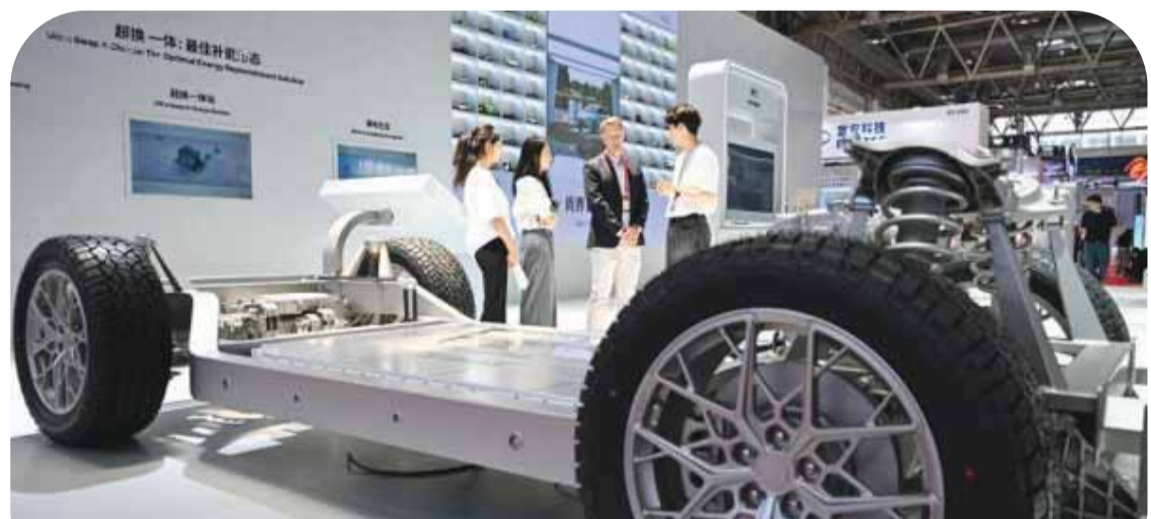
6月23日,在北京举行的第四届中国国际供应链促进博览会上,应用于增程/混动智能汽车的动力电池平台吸引外国观众。

(中新社北京6月25日电 记者 徐文欣)6月22日至26日,第四届中国国际供应链促进博览会(简称“链博会”)在北京举行。多位与会华商接受中新社记者采访时表示,从泰国榴莲到中国餐桌,从印尼雨林到中国工厂,从AI赋能到产业共建,链博会正推动供应链合作从“看与谈”走向“接与落”,让中国市场与工厂更好链接世界。