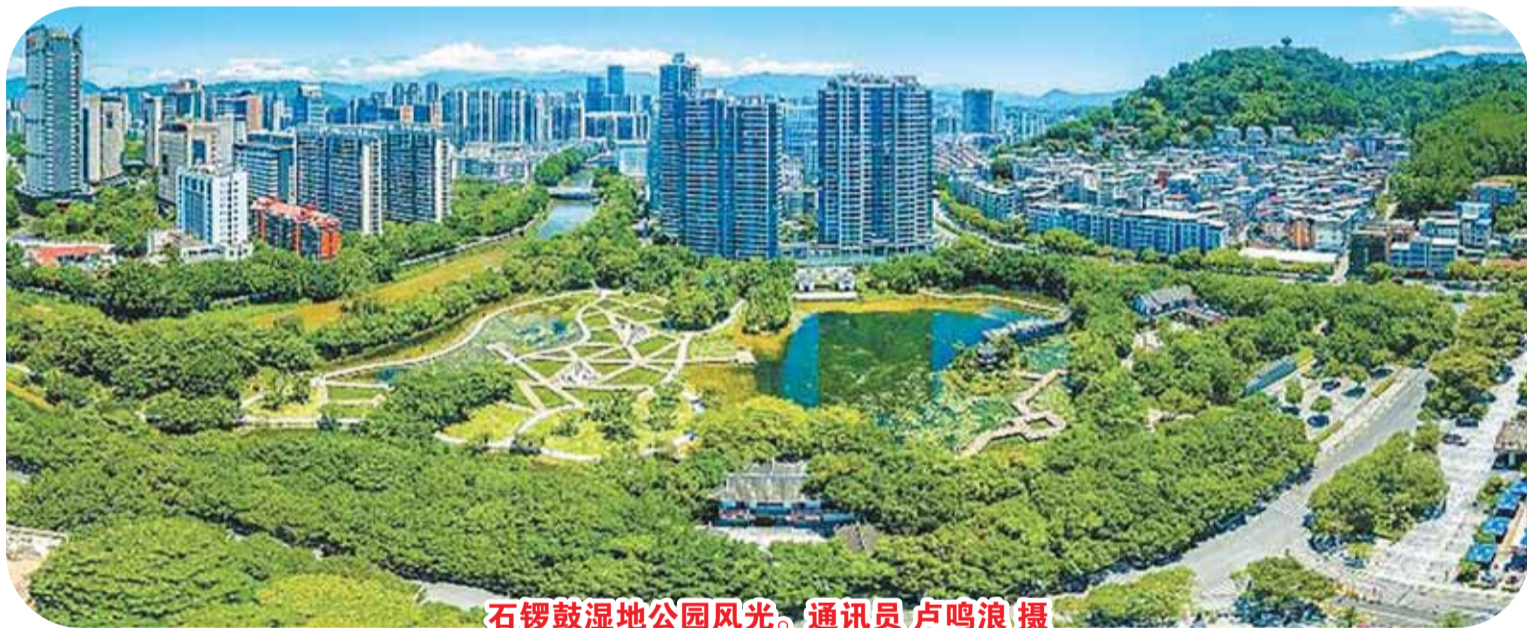
石陂鼓湿地公园风光。

坚决打好污染防治攻坚战,大力实施水环境污染治理、养殖业污染治理、督察整改等攻坚任务,落地生态环境治理项目147个;深入实施蓝天工程、碧水工程和净土工程,完成12条水泥生产线有组织超低排放改造和67台锅炉深度治理,扎实推进