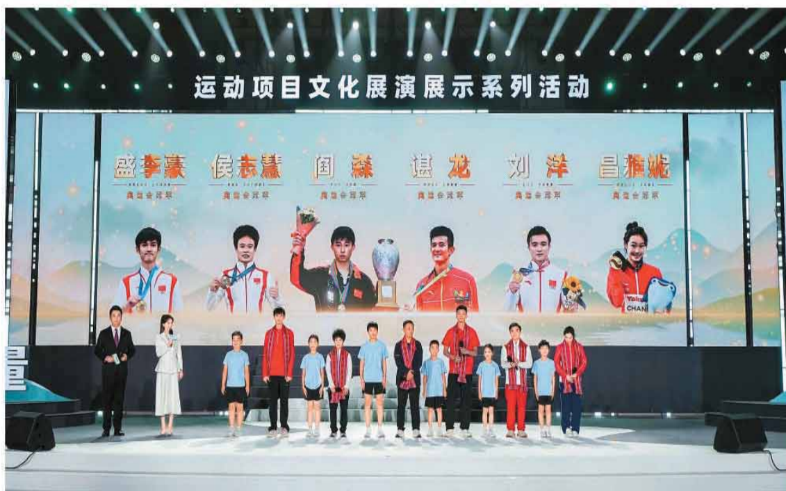
奥运冠军盛李豪、侯志慧、阎森、谔龙、刘洋、昌雅妮在展演活动中。

当晚，中华体育精神颂“运动之美 文化之韵”运动项目文化展演展示系列活动在丽水举行，包括郭崎琪在内的10余名奥运冠军和世界冠军来到现场，分享他们对不同运动项目文化内涵和精神品格的理解。