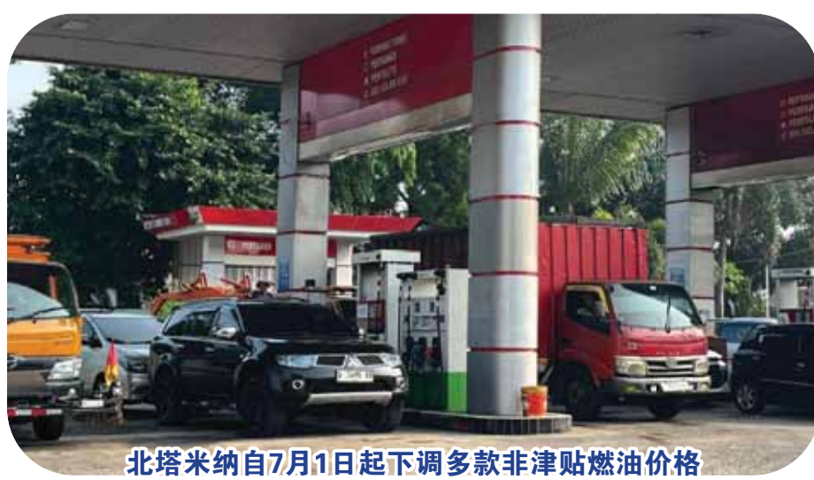
北塔米纳自7月1日起下调多款非津贴燃油价格

球石油市场价格的动态，并遵循适用的法规或机制。当然，这一调整步骤已与政府进行协调了。 北塔米纳表示，价格评估考虑了世界油价的发展、财政状况、人民购买力和国家经济状况。根据最新的机动车燃油税5%地区