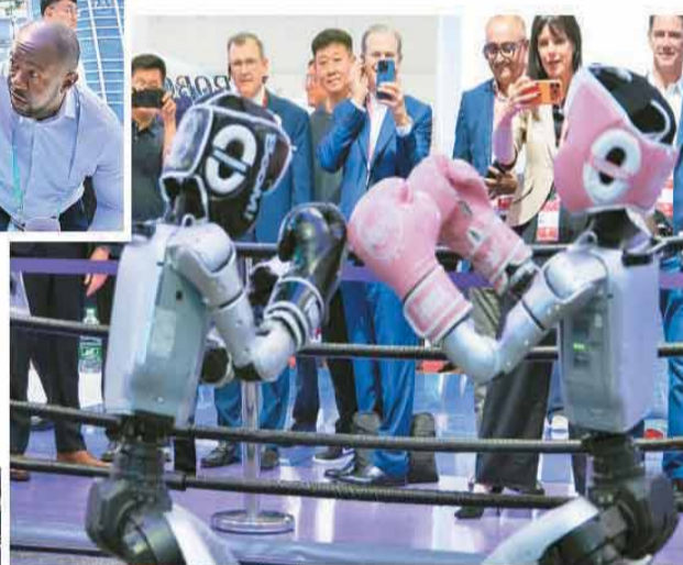
▲观众在第四届链博会上观看人形机器人拳击比赛。