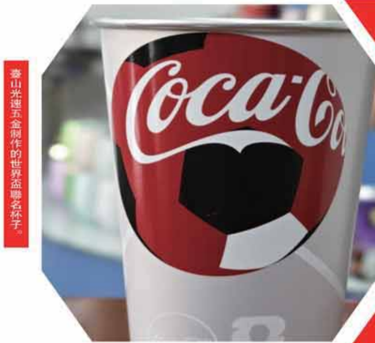
臺山光速五金制作的世界盃聯名杯子。