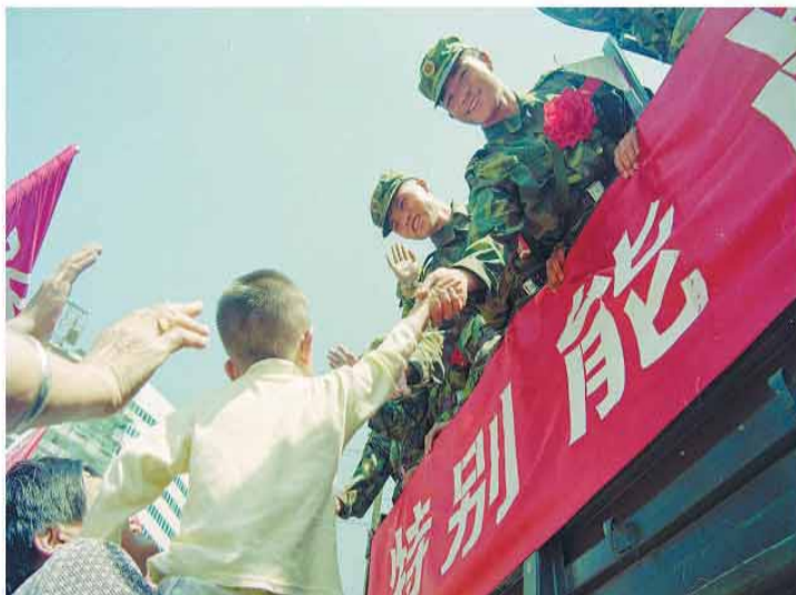
1998年9月15日,完成任务的抗洪官兵陆续从江西省九江市撤离,当地群众热情欢送人民子弟兵。(资料照片)