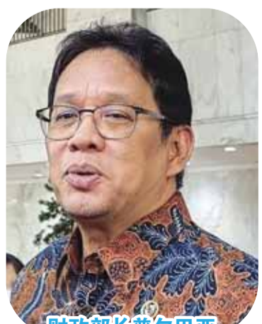
财政部长普尔巴亚

【本报讯】财政部长普尔巴亚(Purbaya Yudhi Sadewa)揭示税务官员操弄退还税款,即退