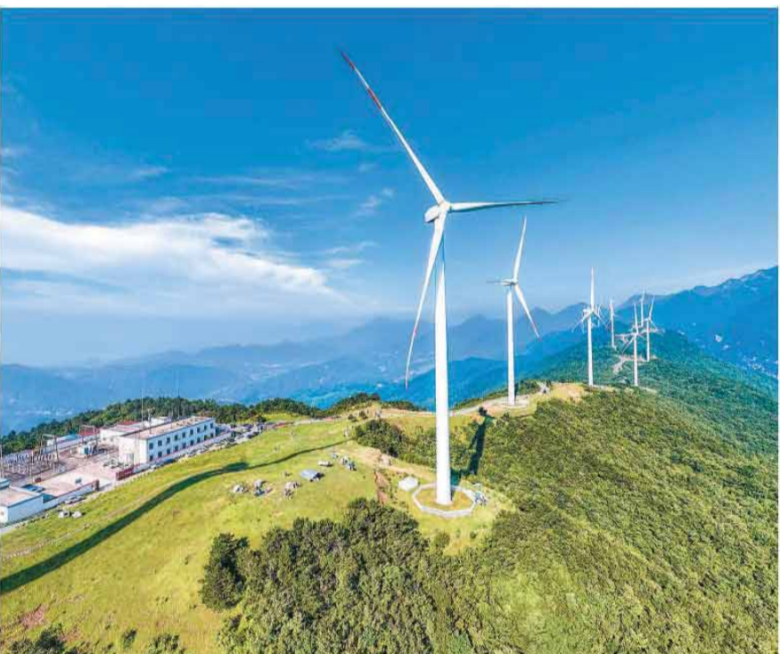
6月28日,安徽省安庆市岳西县青天乡牛草山风电场,风电机组随风转动,与群山草地、蓝天白云、碧管基地交相辉映,构成一幅生态画卷。当地近年来立足山区生态资源禀赋,有序推进风电、光伏等清洁能源项目落地投产,把高山资源转化为可持续发展优势。

今年是中国共产党成立105周年,也是“十五五”开局之年。当前,树立和践行正确政绩观学习教育正在全党深入开展,广大党员干部坚持为人民出政绩、以实干出政绩,努力创造经得起实践、人民、历史检验的实绩,为推进中国式现代化凝聚磅礴力量。