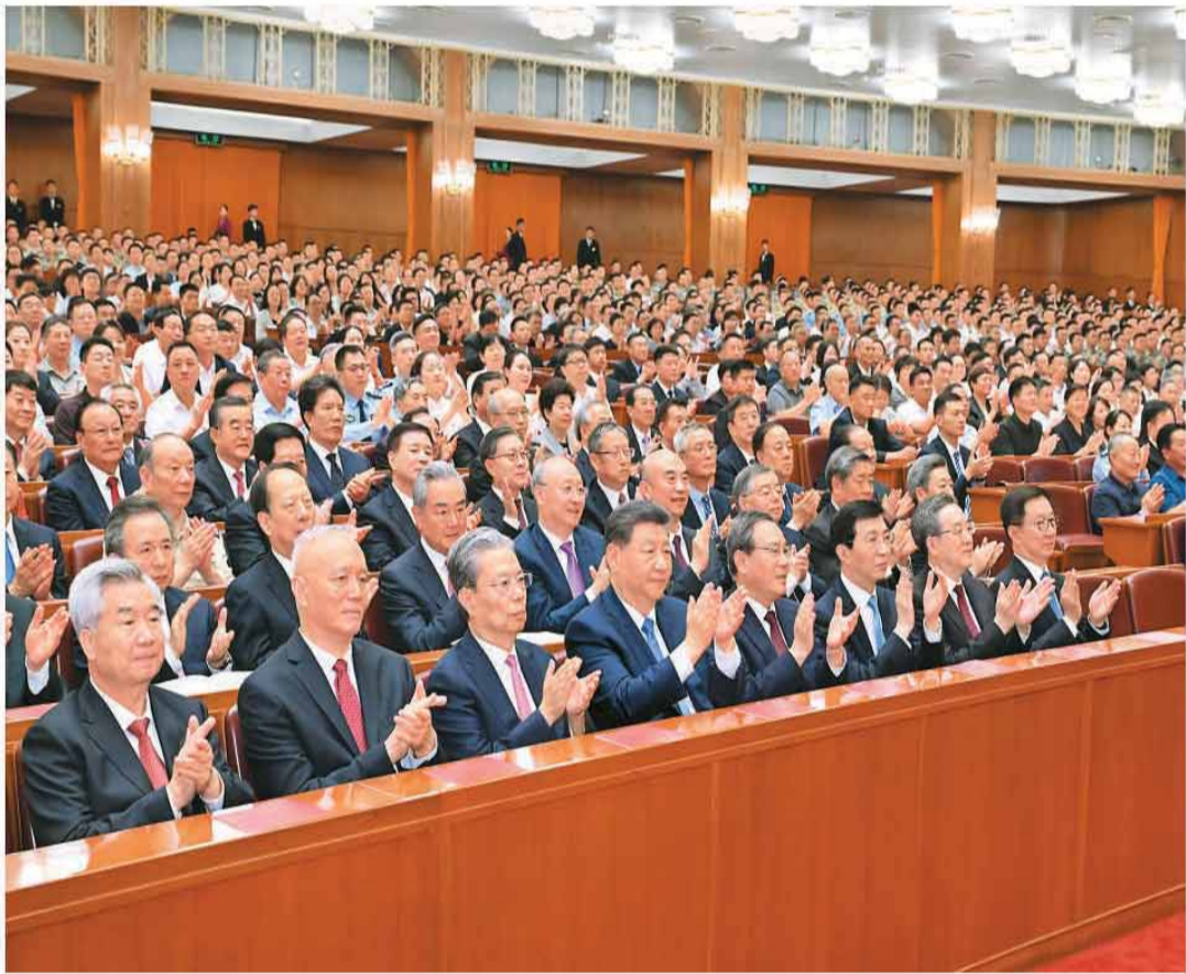
6月29日晚,庆祝中国共产党成立105周年音乐会《人民至上》在北京举行。习近平、李强、赵乐际、王沪宁、蔡奇、丁薛祥、李希、韩正等党和国家领导人,同约3000名观众一起观看演出。

本报北京6月29日电(记者王洲)深情乐章致敬辉煌历程,嘹亮歌声唱响人民史诗。庆祝中国共产党成立105周年音乐会《人民至上》29日晚在京举行。习近平、李强、赵乐际、王沪宁、蔡奇、丁薛祥、李希、韩正等党和国家领导人,同约3000名观众一起观看演出,共同庆祝这个光辉的节日。 人民大会堂灯火璀璨,洋溢着喜庆的气氛。19时55分,在欢快的乐曲声中,习近平等党和国家领导人来到音乐会现场,全场响起热烈的掌声。 “唱支山歌给党听,我把党来比母亲……”伴着清脆的童声合唱,音乐会拉开帷幕。演出分为五个乐章,文艺工作者们以精湛的演奏、动人的歌声,表达对党的无限热爱,唱响民族复兴的时代强音。 一曲《红旗颂》恢弘奏响,雄浑旋律激荡赤子情怀,管弦乐《致先辈》抒发对革命先烈的深切缅怀和崇高敬意。《映山红》《八月桂花遍地开》《黄河颂》《解放区的天》重温革命战争年代军民同心、众志成城的壮阔图景,传递亿万群众跟党走、迎新生的欢欣喜悦。由《杨柳青》《运河谣》《蝴蝶泉边》《洗衣歌》《春到田间》《我为祖国献石油》《阳