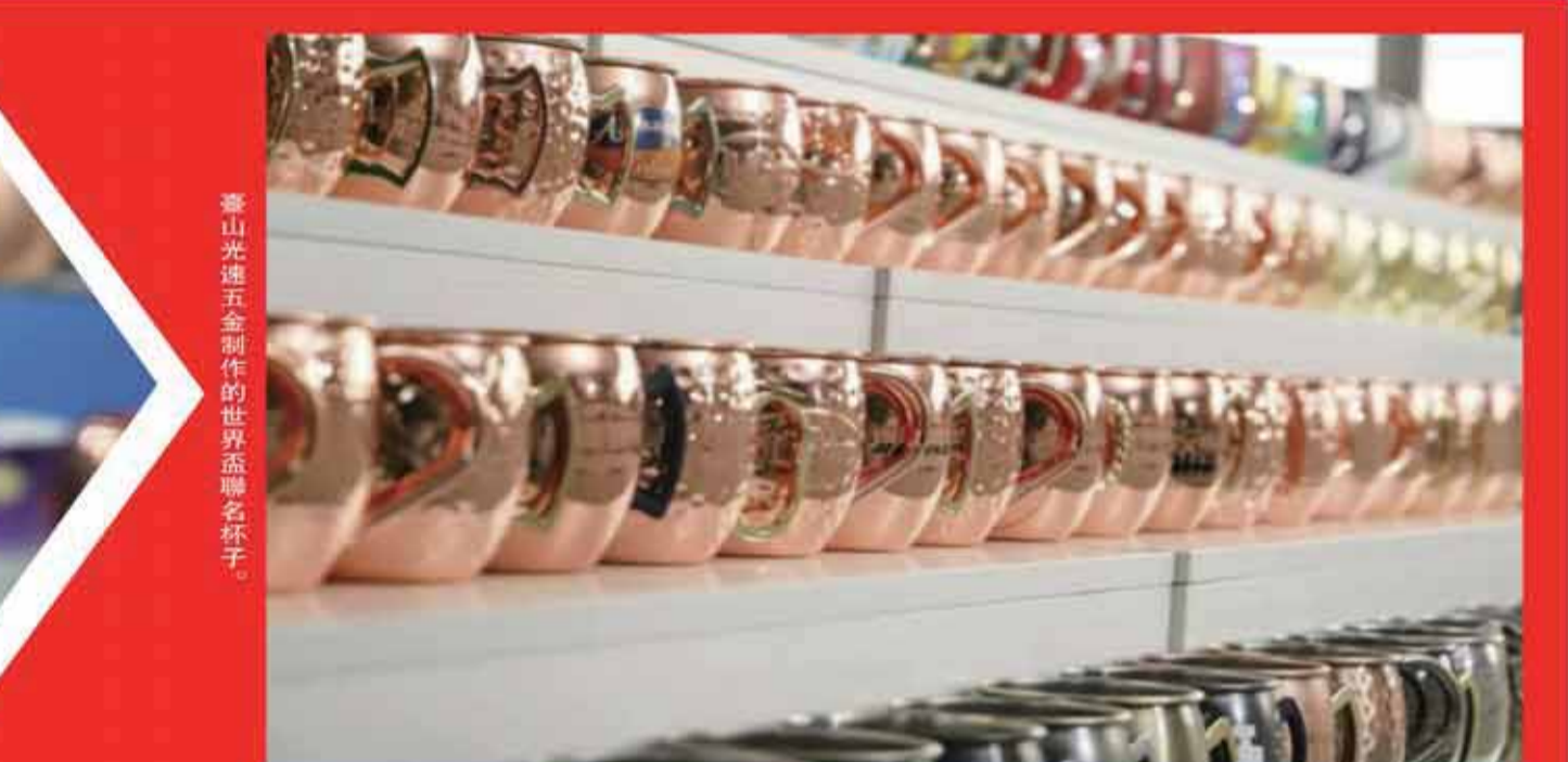
臺山光速五金制作的世界盃聯名杯子。