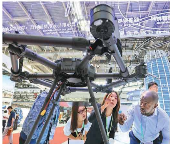
▲外国客商在第四届链博会上了解碳纤维复合材料种植保无人机。

先进材料的突破不仅让机器人“力大无比”，更让中国高端制造实现极致的“轻量化”。在折叠屏手机、无人机等领域，每减重1克都意味着不菲的研发投入。现场，中化展示了一款新研发的结构硅胶，让人机外壳无需螺丝即可牢固粘接，极大减轻了机身重量。“有些消费电