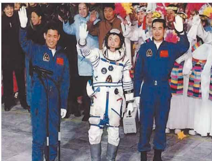
2003年10月15日,中国第一位航天员杨利伟(中)在首飞梯队成员聂海胜(左)、翟志刚(右)陪同下参加出征仪式。(资料照片)

2007年10月,党的第十七次全国代表大会召开。大会通过的报告全面阐述科学发展观的科学内涵、精神实质和根本要求,明确科学发展观第