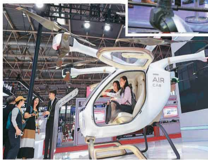
▲参观者在第四届链博会上体验高空飞行器。

子领域的产品，能轻一克、两克，就已经是产品迭代了。”李龙锐说，高端制造很多时候不是卡在技术，而是卡在材料。