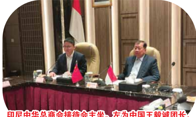
印尼中华总商会接待会主坐。左为中国王毅诚团长，右为印尼张锦雄总主席