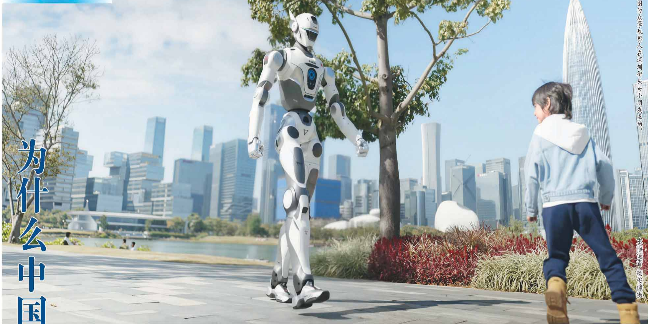
图为众擎机器人在深圳街头与小朋友互动。