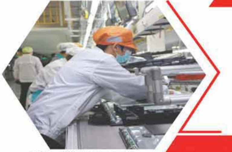
▲ 海信江門基地生產的液晶電視機“閃進”美加墨世界盃。