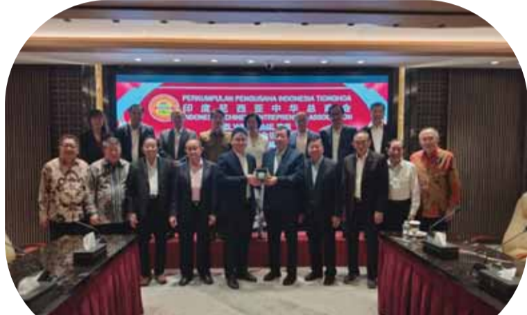
印尼中华总商会接待中国南宁东博会代表团会后合影