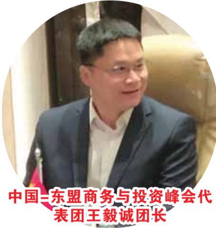
中国-东盟商务与投资峰会代表团王毅诚团长