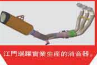
▲ 江門瑞躍實業生產的消音器。