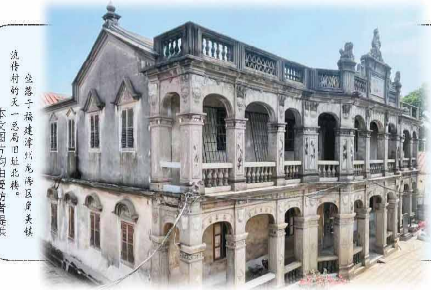
坐落于福建漳州龙海区角美镇流传村的天一总局旧址。