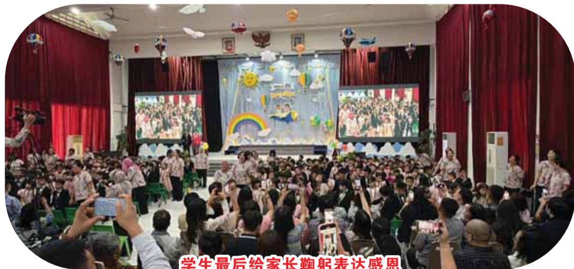
学生最后给家长鞠躬表达感恩