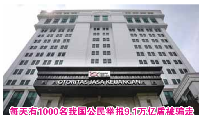
每天有1000名我国公民举报9.1万亿盾被骗走

【本报讯】金融服务权威机构(OJK)公布至少432,637起公众投诉报告的数据，这些报告均由全国反诈骗中心成功收集。对此，当局也采取了坚决措施，封锁了超过397,000个被认定可疑的账户。