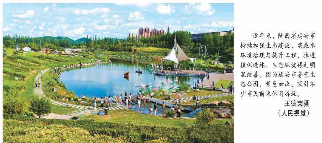
近年来，陕西省延安市持续加强生态建设，实施水环境治理与提升工程，推进植树造林，生态环境得到明显改善。图为延安市晋艺生态公园，景色如画，吸引不少市民前来休闲游玩。