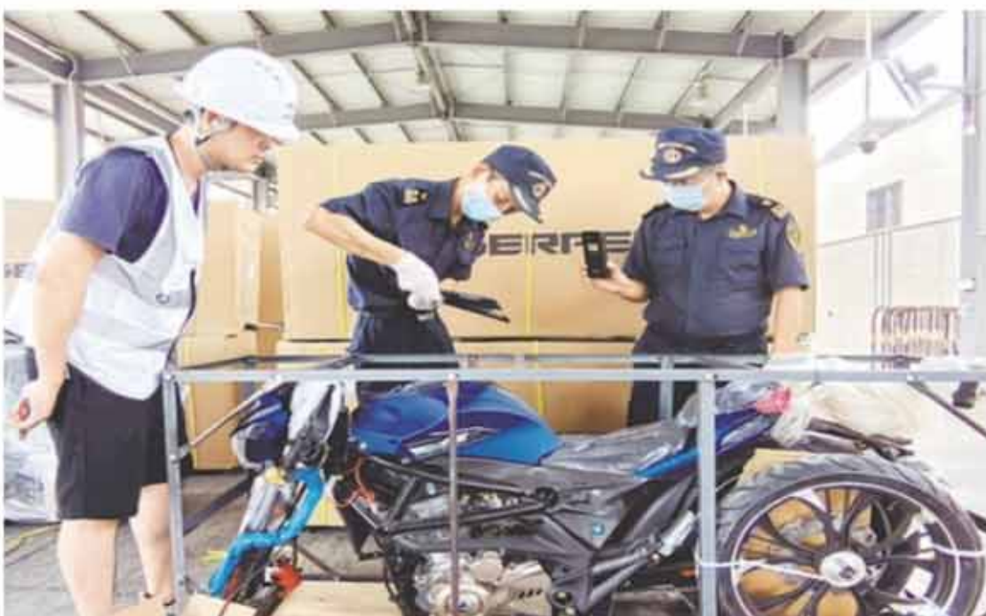
今年以來，江門市摩托車出口實現較快增長。圖為江門海關所屬外海海關關員對出口摩托車開展查驗。

江門市作為全國三大摩托車生產基地之一，出口規模連續多年位居全國地級市首位。江門海關創新實施“智護摩企·鏈通全球”專項護航項目，從助企破壁、品牌護航、通關提速三個維度精準發力，全力推動江門摩托車產業高質量發展。