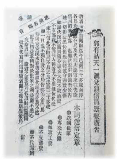
一九一八年《暨南杂志》上刊载的《郭有品天一总局銀信局緊要廣告》。

严谨的制度之外，还有乡里乡亲的深厚情谊。在天一总局旧址，至今仍保留着不少房间——那是当年为远途取信的侨眷准备的歇脚处，遇到天气不好或路途遥远，便可留宿一夜。偶有信用可靠而款项不便的侨民，信局也乐于先行垫付。遇到不识字的侨眷，批脚（即送信人）也从不敢怠，他们会帮助侨眷请来乡邻中识字的人当面确认银信信息，确保银信送到正确的收信