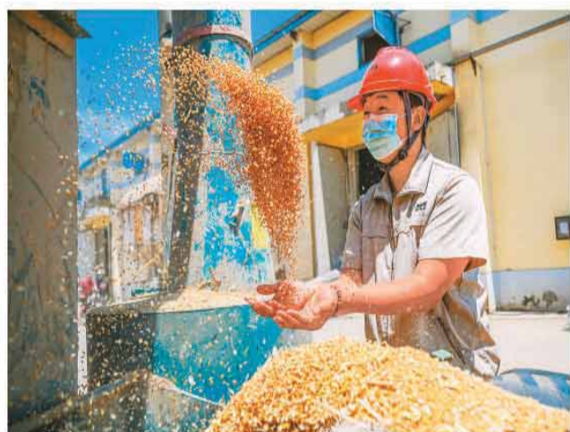
河南省商丘市会亭镇,河南世通谷物有限公司直属库工作人员进行小麦入库作业。

国家粮食和物资储备局粮食储备司司长罗守全表示,各级储备企业有序开展轮换收购,各类加工和贸易企业、饲料企业积极入市,市场购销较为活跃。目前,主产区小麦收购均价每斤1.21元左右,优质品种小麦售价比市场价高出0.1元左右,以质论价、优质优价特征明显。