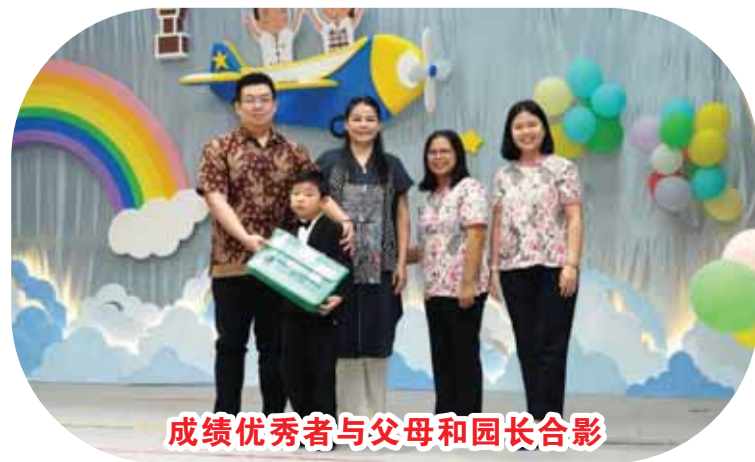
成绩优秀者与父母和园长合影