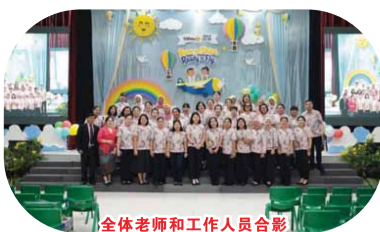
全体老师和工作人员合影