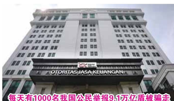
每天有1000名我国公民举报9.1万亿盾被骗走

【本报讯】金融服务权威机构(OJK)公布至少432,637起公众投诉报告的数据，这些报告均由全国反诈骗中心成功收集。对此，当局也采取了坚决措施，封锁了超过397,000个被认定可疑的账户。