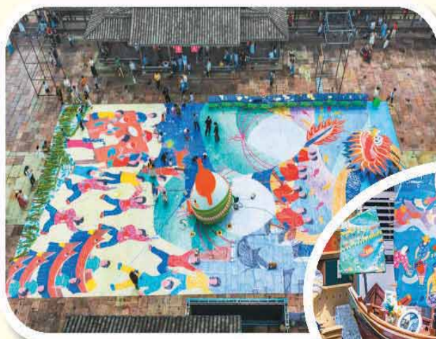
浙江省宁波市镇海区澉浦镇十七房景区，市民和游客共同绘制主题农民画。

近日，浙江省宁波市镇海区澉浦镇十七房景区内，800平方米巨幅画布铺开，百余名市民游客和当地农民画艺人用麦穗、香囊等元素创作龙舟、农耕等端午主题农民画。