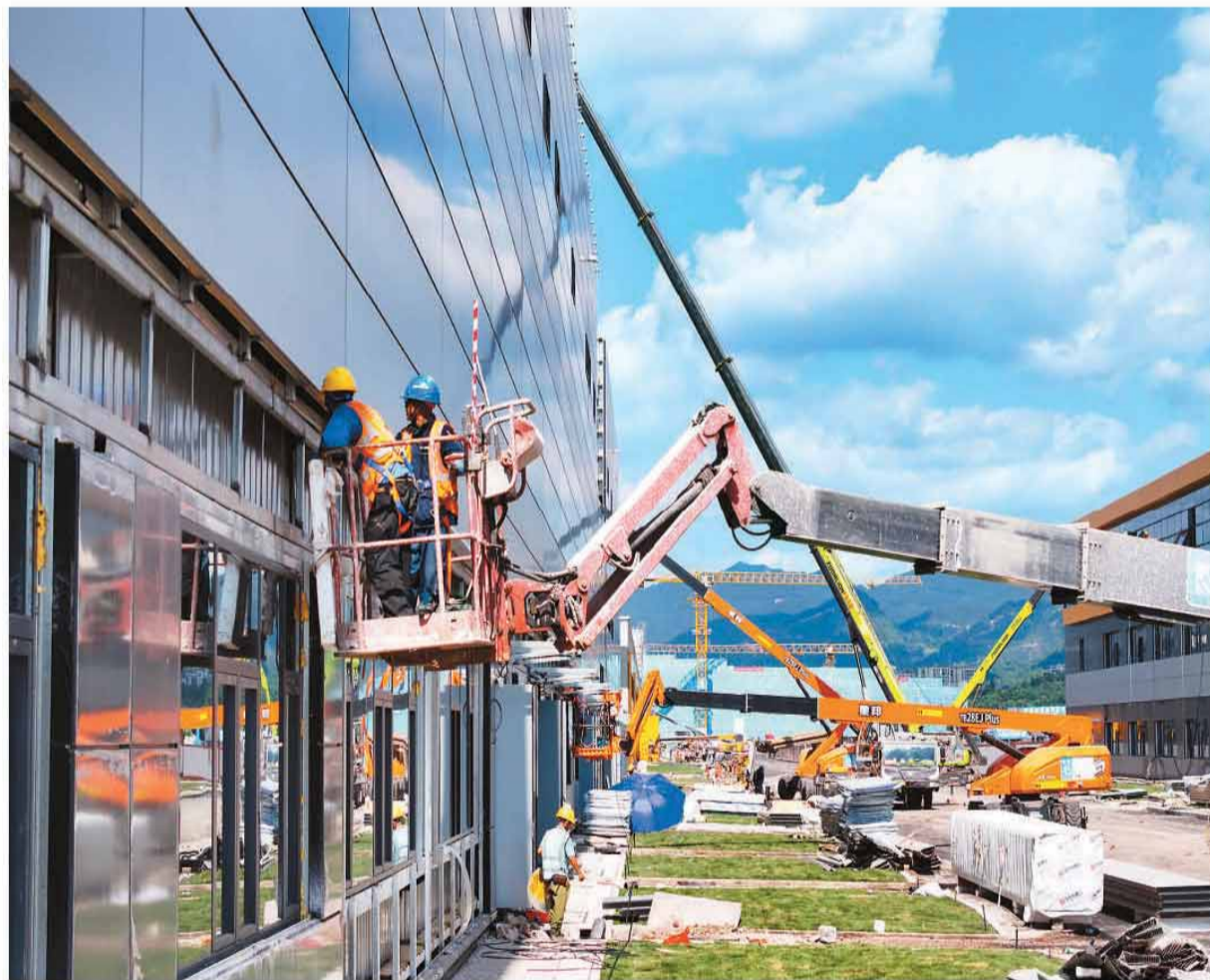
近日,重庆梁平无人驾驶飞行器制造产业园建设正酣。该产业园项目集飞行器研发、制造、试飞于一体,填补了重庆大中型无人机整机制造领域“空白”。投产后,将带动上下游配套企业协同发展,为重庆低空经济产业链补链、强链注入强劲动能。图为工人在项目现场施工。