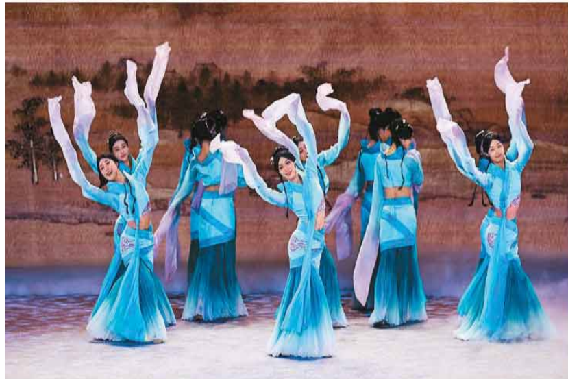
舞蹈《采薇》。——第十八届海峡论坛大会上表演

今年4月，中共中央台办受权发布十项促进两岸交流合作的政策措施。本届论坛期间，十项促进两岸交流合作的政策措施对接签约会在厦