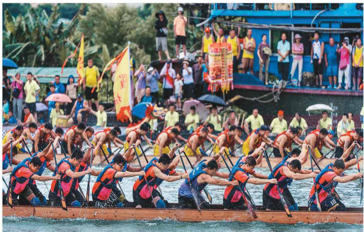
近日，南海雅瑶龙舟盛会在广东省佛山市南海区雅瑶水道举行。该活动是广佛地区极具影响力的传统龙舟赛事之一，融合了竞技性与深厚的乡土民俗文化。图为活动现场。