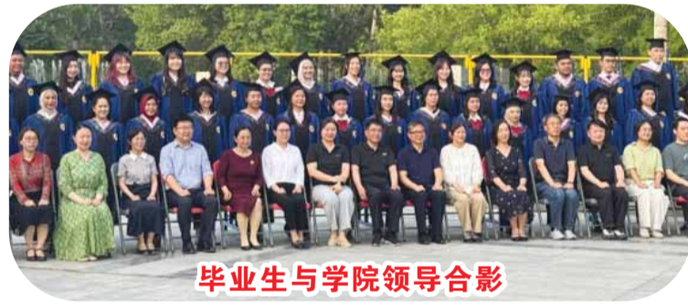
毕业生与学院领导合影