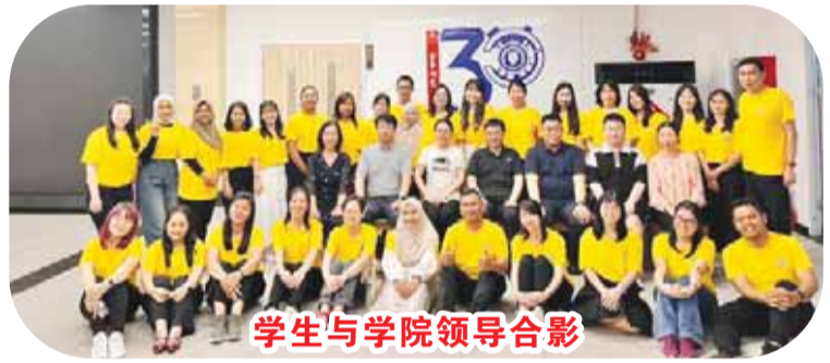
学生与学院领导合影