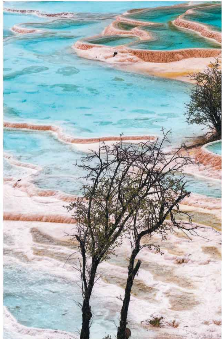
图为四川省松潘县黄龙风景名胜区的天然彩池。

在亿万年地质奇观里、千年桫欏古树下、高原瑶池彩池边，他们这样守护全人类的财富——