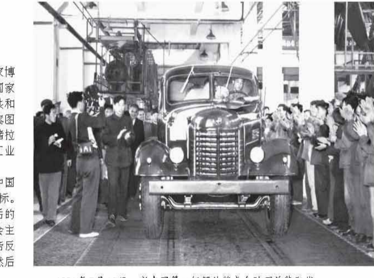
1956年7月13日，新中国第一辆解放牌卡车驶下总装配线。

点击手机屏幕进入中国国家博物馆的数字展厅，可以看到原国家计划委员会印制的《中华人民共和国第一个五年国民经济计划草案图表》，大红色封面，把人们的思绪拉回到新中国向社会主义过渡和工业化建设起航的激情岁月。 在中国实现社会主义，是中国共产党创立时就确定的奋斗目标。但在中国这样经济文化十分落后的半殖民地半封建国家，实现社会主义必须分两步走，首先取得反帝反封建的新民主主义革命胜利，然后才能转入社会主义革命。