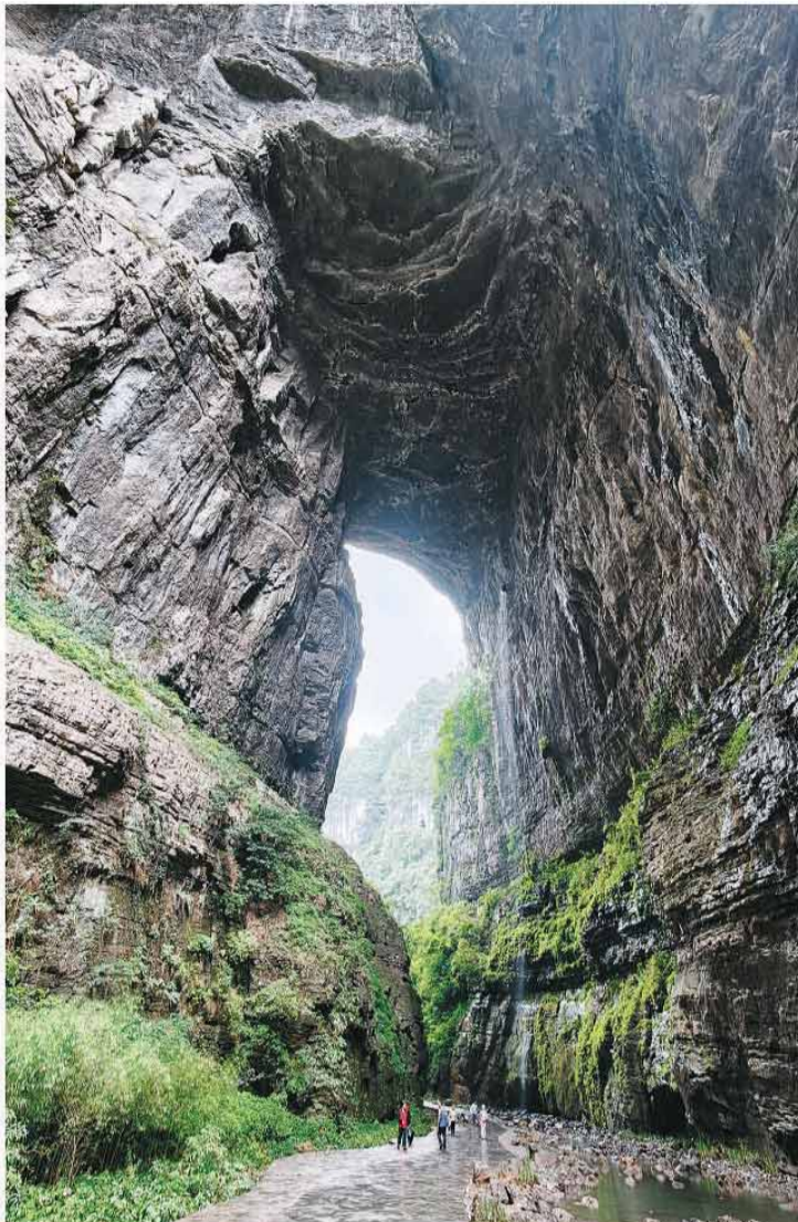
图为重庆市武隆区“天生三桥”之一的天龙桥。