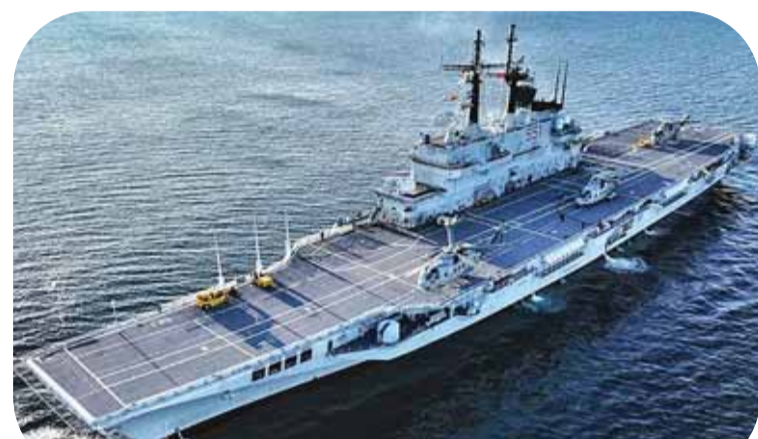
前海军参谋长称我国首艘航母最好部署在纳杜纳水域

【本报讯】6月22日，前海军参谋长阿德·苏潘迪退役海军上将(Ade Suupandi)评估说，意大利捐赠的朱塞佩·加里波第号航母如果部署在纳杜纳(Natuna)水域是最理想的选择。我认为，这一举措被视为确认国家在海上边境地区实体存在和绝对主权的战略举措。军舰在我们心中有一种教义，即当军舰在该区域时，国家的存在就展示于该区域。与陆地设有静态安全哨所不同，我认为，国家在海