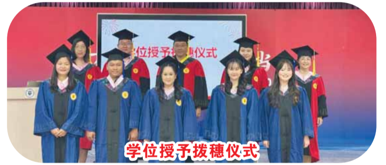
学位授予拨穗仪式