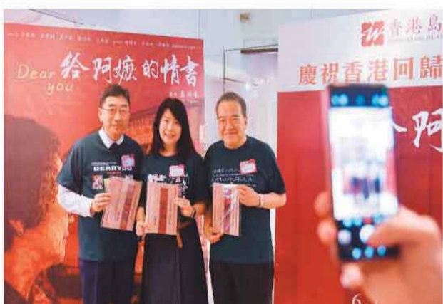
《给阿嬷的情书》专场电影观赏会主办方人员手持复刻“侨批”道具合影。

中阿嬷包容坚韧、勤俭善良、心系后辈、默默守望的美好品格，是千千万万中华女性的生动缩影，也是妇联组织长期倡导、传承弘扬的优良家风。身为潮汕媳妇，她对影片的乡土温情、人情暖意感触至深、共鸣强烈。