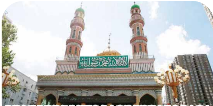
坐落在现代建筑间的新疆乌鲁木齐洋行清真寺是乌鲁木齐市维吾尔族、哈萨克族、塔塔尔族、乌孜别克等民族的伊斯兰教主要活动场所。