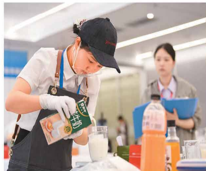
6月22日,贵阳贵安2026年职业技能大赛在贵州省贵阳市举行。本次大赛采用主赛区+分赛区联动办赛方式进行,设置人工智能工程技术、新式茶饮调制制作等赛项,共吸引57支代表队、685名选手参赛。图为6月22日,参赛选手在比赛现场制作赛项指定饮品。

昆明海关表示,将立足职能定位,持续推进制度创新和监管模式创新落地见效,畅通贸易“毛细血管”,提升跨境贸易便利化水平,助力区域经贸合作高质量发展。