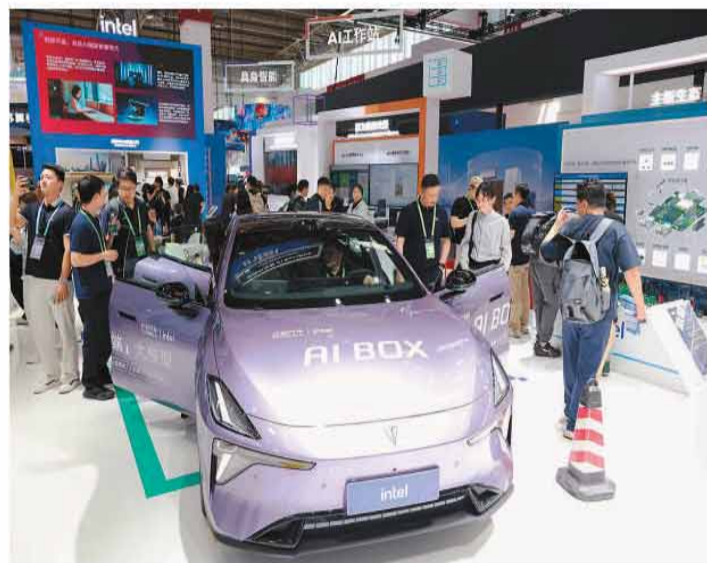
参观者在链博会数智科技链人工智能专区英特尔展位参观。

低空经济专区集结30余家企业,飞行器、核心零部件、物流救援应用一站式看全;清洁能源链,“风光储氢”技术集群、零碳园区模型、智能电