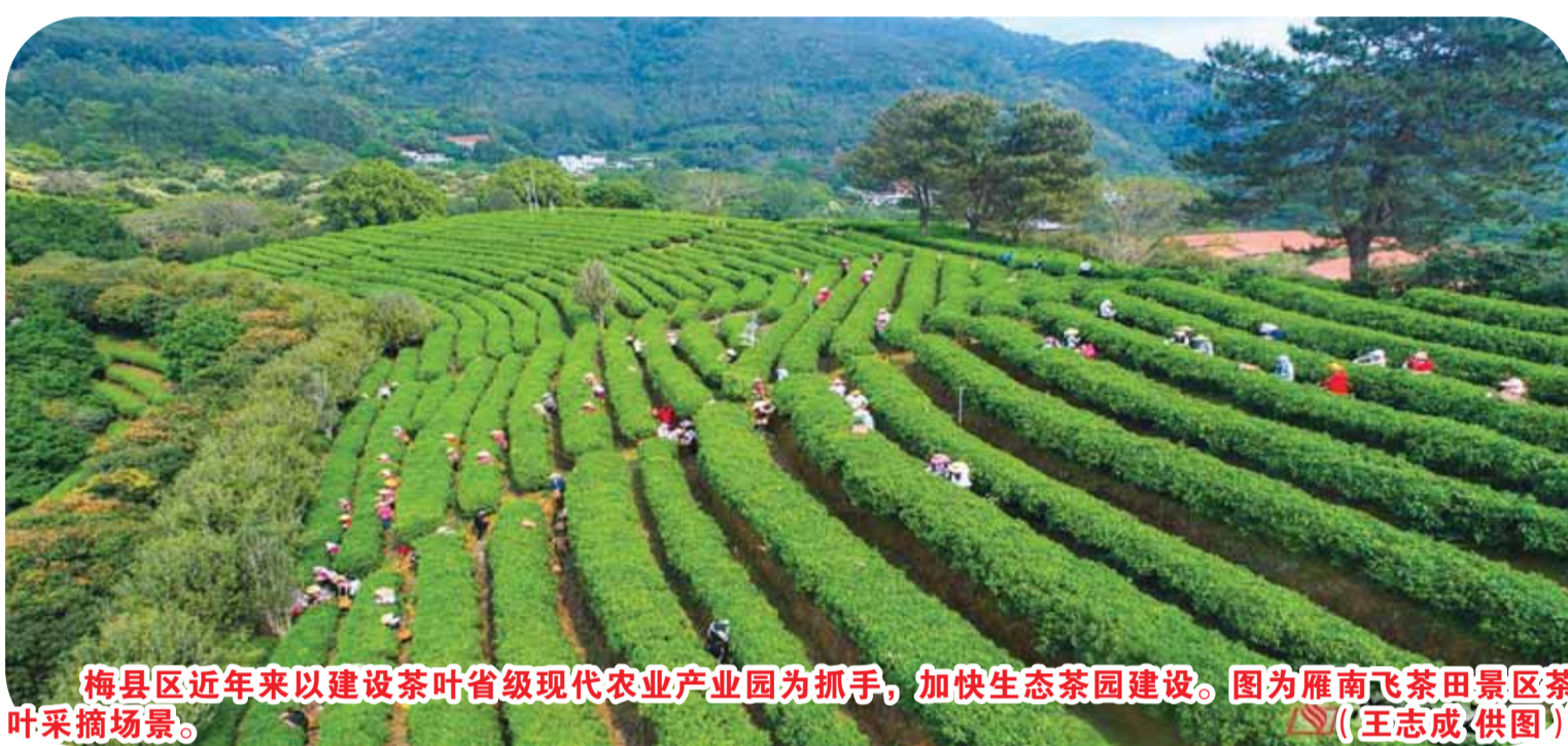
梅县区近年来以建设茶叶省级现代农业产业园为抓手，加快生态茶园建设。图为雁南飞茶田景区茶叶采摘场景。