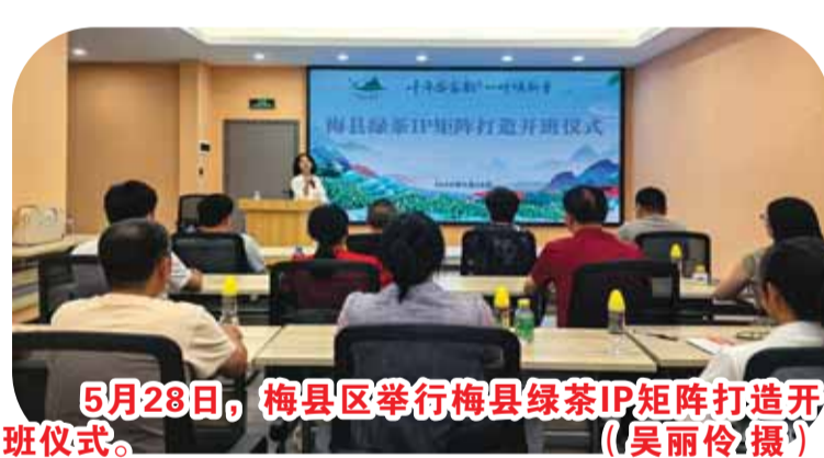
5月28日，梅县区举行梅县绿茶IP矩阵打造开班仪式。

走进梅州市珍宝金柚实业有限公司生产车间，淡淡的茶香和麦芽发酵的气味扑鼻而来。“茶饮料和茶啤酒区别于普通酒水饮料的地方在于茶的