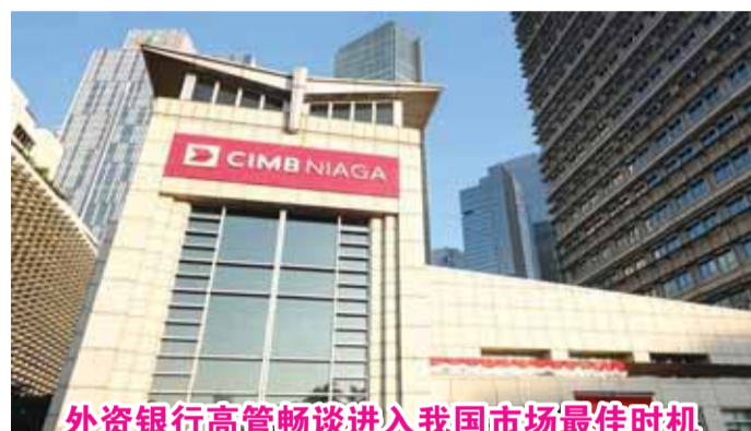
外资银行高管畅谈进入我国市场最佳时机

【本报讯】马来西亚金融巨头联昌国际集团日前声称，在全球投资者的担忧情绪高涨之际，却看到了我国的巨大机遇。联昌国际集团首席执行官诺凡(Novan Amirudin)表示，盾币价值跌至历史最低点正是进入印尼市场的最佳时机。现在盾币价格很低，因此，对于看到印尼潜力的投资者来说，现在当然是进入市场的最佳时机。但我们不是短期投资者。联昌国际集团是那里的长期运营商。众所周知，联昌国际集团在印尼的业务实体是Bank - CIMB Niaga (BNGA) 上市公司，这是印尼第二大私人银行。关于全球投资者对我国政府政策不确定性的担忧，诺凡重申了联昌国际集团作为长期投资者的地位，并重申了对印尼的承诺。诺凡指出，我们相信印尼的长期潜力。印尼拥有巨大的