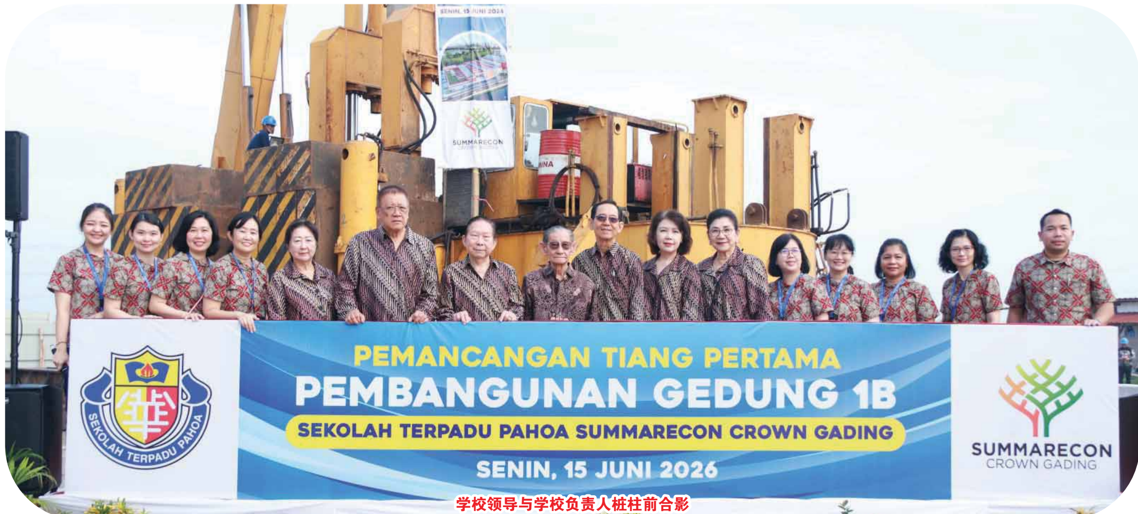
学校领导与学校负责人桩柱前合影