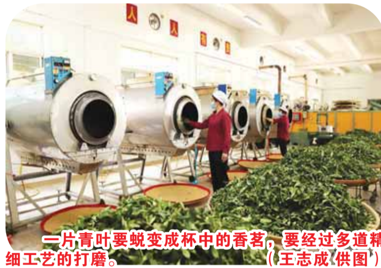
一片青叶要蜕变成杯中的香茗，要经过多道精细工艺的打磨。

发展，梅县区目前茶叶种植面积达2.44万亩，年产值6.36亿元，已形成梅南、石坑、雁洋三大核心产区，培育引进单丛、金牡丹、金萱等优质茶树品种，构建起标准化种植、精细化加工、品牌化运营的完整产业体系。目前，“梅县绿茶”已获国家地理标志产品认定，是全国名特优新农产品，阴那山金螺春斩获广东名优茶特等金奖，雁南飞茶园获评“岭南最美茶园”，26家茶企获评“两品”认证。