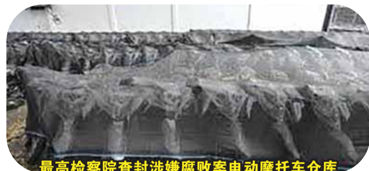
最高检察院查封涉嫌腐败案电动摩托车仓库

【本报讯】最高检察院日前查封位于西爪哇省森图尔(Sentul)的一座属于国家营养局的电动摩托车仓库。副总检察长特别犯罪调查主任苏莱曼(Syarief Sulaeman Nahdi)表示，查封是与2025-2026年免费营养餐项目治理腐败案件有关。我们确保查封并不意味着仓库内所有电动摩托车都会被没收。最高检察院还将逐步访问雅加达西区市达安莫戈(Daan Mogot)地区的其他电动摩托车仓库。查封是为了计算仓库内剩余的电动摩托车数量。这样以后它们就不会易手，并且它们的存在仍由官员监督。只