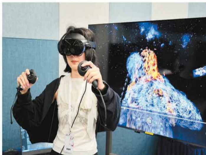
近日，“SURREALITY·幻实之境”数码艺术展在香港科技大学举办。展览展出了一系列结合虚拟现实（VR）、混合现实（MR）及人工智能（AI）技术创作的艺术作品，让观众感受科技与艺术的融合之美。图为工作人员在演示VR艺术作品。

贸发局迎来60周年首场庆祝活动是由贸发局旗舰零售平台“香港·设计廊”举办的“香港·设计廊走动全城”活动，在全港10多个地点展出共36个香港品牌的产品，让更多市民及旅客认识这些本地品牌的独特故事。其他活动还包括将于香港书展期间举行的“60张书展超级书证大放送”“社区共创艺术”和“香港贸发局60周年展览”等。