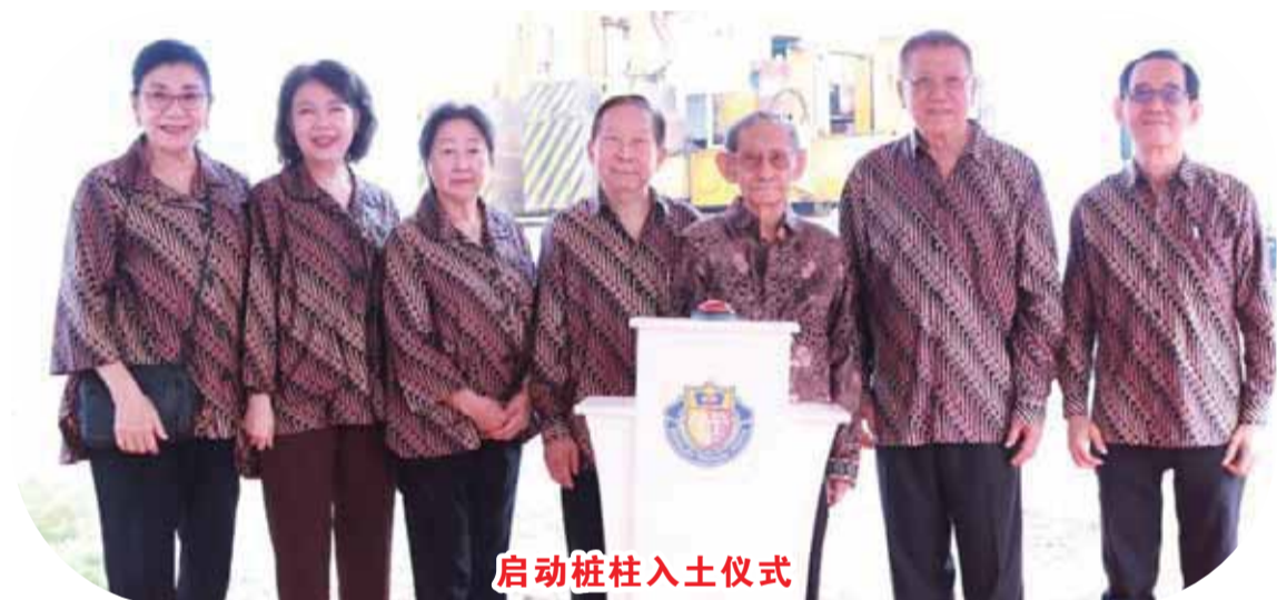
启动桩柱入土仪式