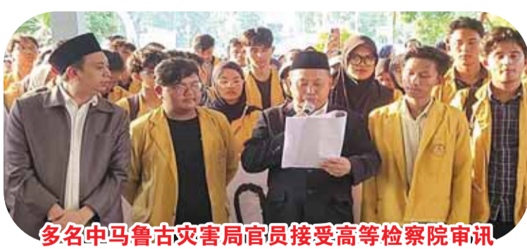
多名中马鲁古灾害局官员接受高等检察院审讯

建设的腐败行为，除了五名官员和前中马鲁古县地方灾害管理局官员外，调查人员还对七名参与调查的人员进行了讯问。6月22日，马鲁古高等检察院法律信息与公共关系科主任阿