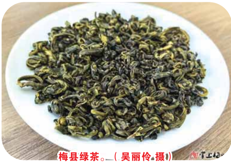
梅县绿茶。