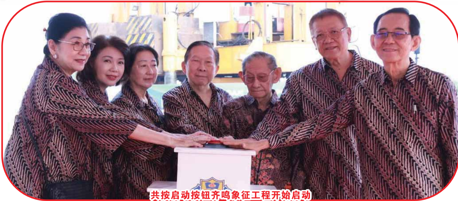
共按启动按钮齐鸣象征工程开始启动

二期工程预计于2027年4月竣工,并在2027-2028学年正式投入使用。随着新设施的落成,八华Summarecon Crown Gading分校将进一步丰富其学习环境,