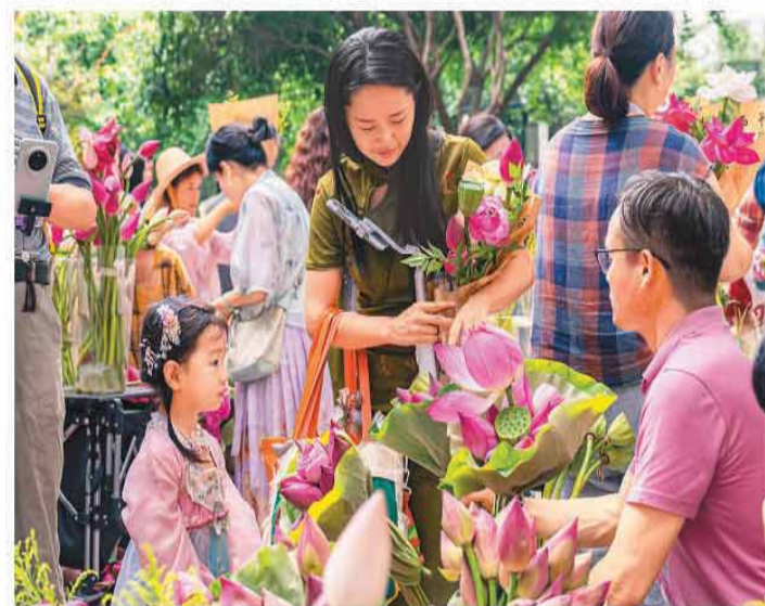
近日,江苏省苏州市白塔公园荷花市集开市。市集探索本地花农自产自销模式,打通荷花产品从荷塘到市场的产销通道,助力花农增收。市集将持续至7月31日。图为人们在白塔公园荷花市集选购荷花。

从来源地看,沙特阿拉伯、马来西亚、瑞士、美国实际对华投资分别增长285.5%、108.6%、49.4%、17.3%(含通过自由港投资数据)。