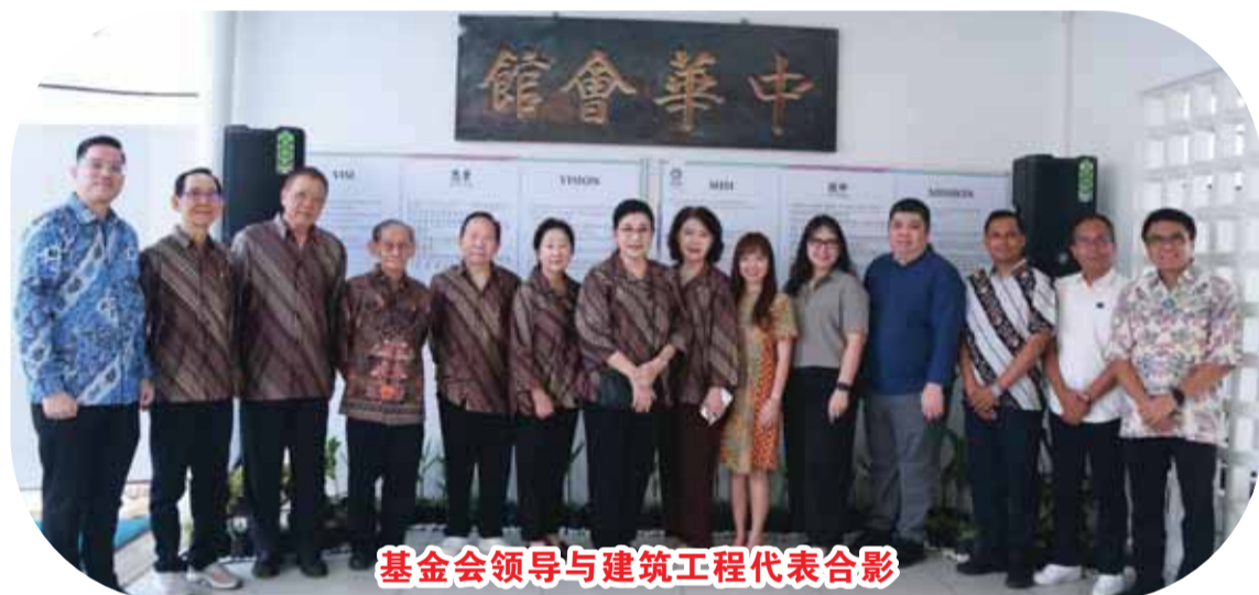
基金会领导与建筑工程代表合影