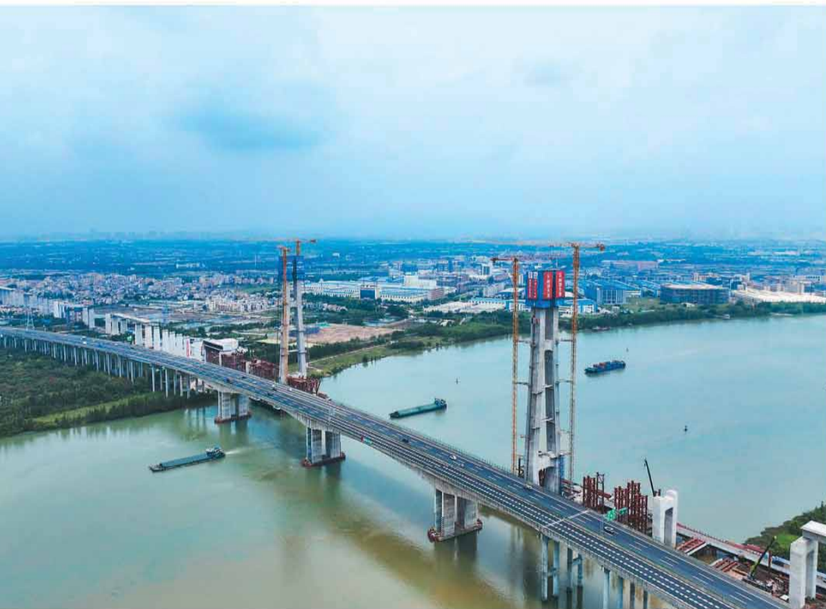
近日，由厦深铁路广东有限公司建设、中铁二十五局承建的深江铁路广中江特大桥跨虎跳门水道斜拉桥双主塔完成封顶。至此，深江铁路全线5座斜拉桥全部完成主塔封顶，项目建设取得突破性进展。图为位于广东江门的深江铁路广中江特大桥跨虎跳门水道斜拉桥施工现场。

“总体来看，外国环境虽有风险，但也创造了新机遇。”余伟文告诉记者，香港必须把握好这些变化和机遇，积极对接国家“十五五”规划，为国家金融发展贡献香港力量。