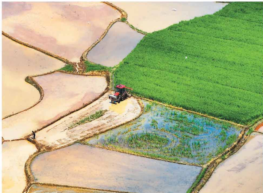
六月二十一日，江西省吉安市泰和县沿溪镇渡溪村，农民驾驶农机正在水田里翻耕整地，准备种植水稻。