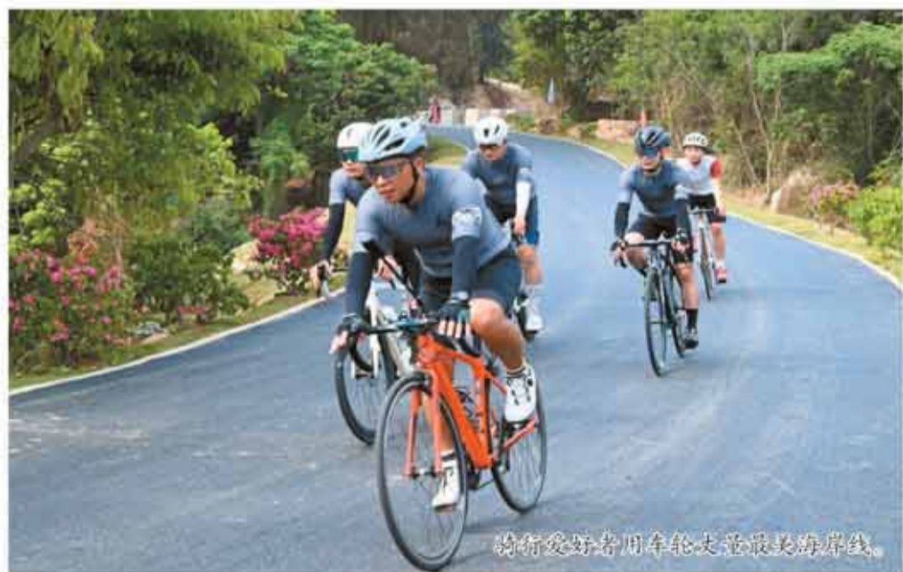
骑行爱好者用车轮丈量最美海岸线。