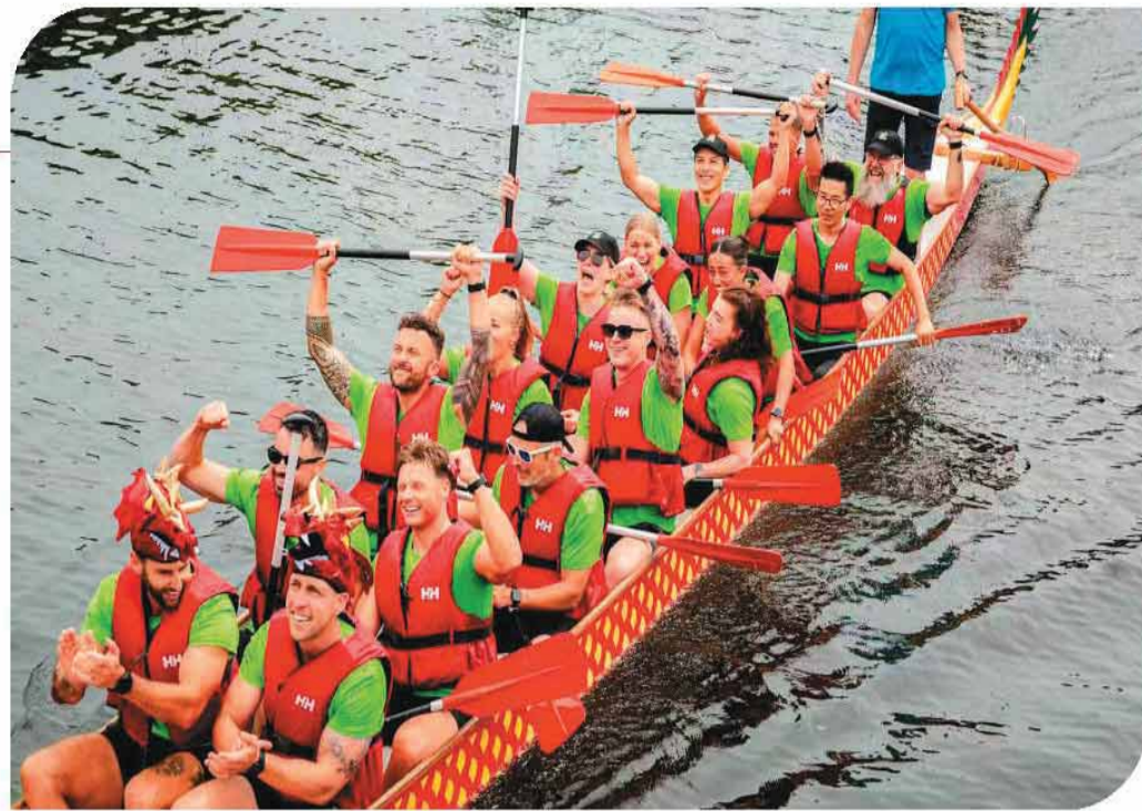
在第二届荷兰华人龙舟邀请赛上，中外选手一起欢畅划龙舟。

华侨华人全力筹备，海外友人热情参与，赛龙舟、吃粽子、中华文化表演、中华美食分享……一艘艘龙舟成为传播中华文化的载体，端午节也成为中外文化交流的窗口。