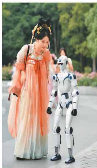
近日,人形机器人亮相浙江省湖州市“湖畔有艺市”,与游客互动。

非遗手作展览、汉服体验等多元业态,本地农户、特色商户集中亮相,观赛游客顺路打卡消费,带动本地特色农产品、手工文创销量提升。