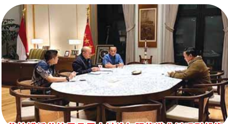
普拉博沃总统召见罗山讨论加强旅游业以吸引投资

德迪表示,希望能更好地管理国家资产,为人民创造更大利益。6月21日,普拉博沃·总统在雅加达克尔塔内加拉私邸接待了投资与下游产业部长/达南塔拉投资局首席执行官罗山。会议讨论了加速国企转型和加强推动国家经济增长的新领域。旅游业也出席了会议。