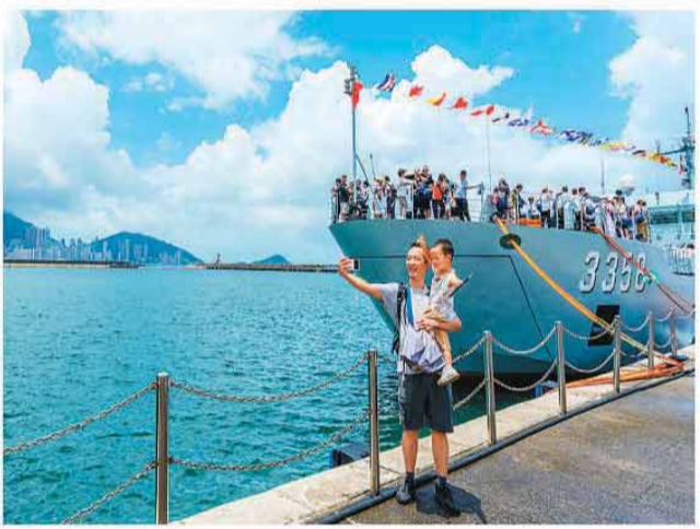
图为香港市民在军营开放活动中拍照留念。