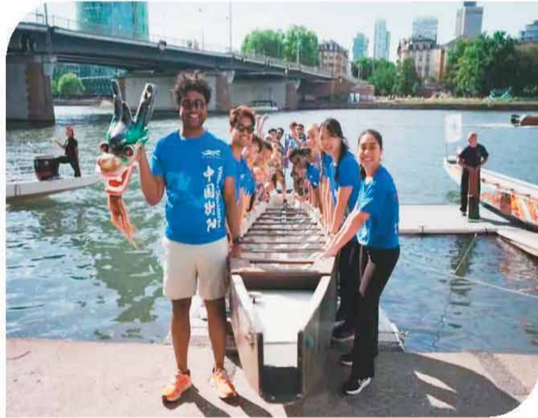
第三届“红旗杯”法兰克福国际龙舟节上，龙舟船员身穿活动文化衫合影留念。