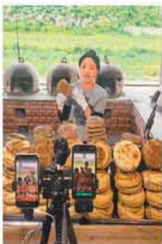
通过直播电商平台推介焜锅馍。海正焜锅馍馍产业基地，主播正在直播推介。