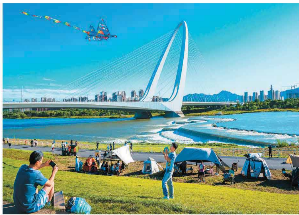
近年来,北京持续推进河湖生态修复与水系连通,织密城市生态水网。永定河已连续6年通水,如今水清岸绿,成为市民、游客亲近自然的热门打卡地,图为人们在永定河畔休闲游玩,乐享端午假期。

各地生活必需品市场供应充足,价格总体平稳。商务大数据显示,节日期间,全国200家大型农副产品批发市场库存充足,粮油、肉类、水果价格与节前(6月18日)基本持平,鸡蛋、蔬菜价格分别下降0.7%和0.3%。