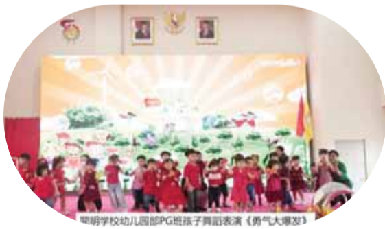
開明学校幼儿园PG班孩子舞蹈表演《勇气大爆发》