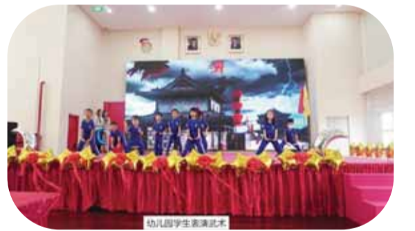
幼儿园学生表演武术