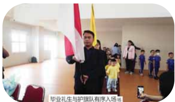
毕业礼生与护旗队有序入场