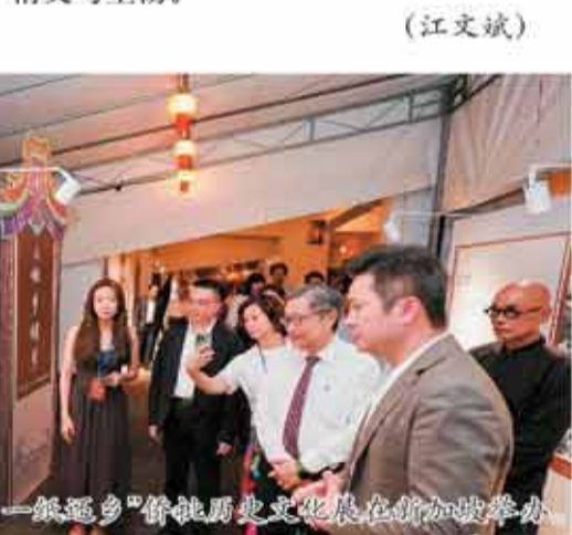
2025“三江出海一纸还乡”侨批历史文化展在新加坡举办

如今,侨批出海已成为一封“情书”里的国际传播新范式,既唤醒了全球华侨华人的集体乡愁记忆,也让海外不同文化背景