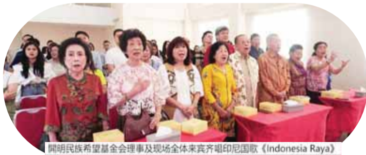
開明民族希望基金会理事及现场全体来宾齐唱印尼国歌《Indonesia Raya》

示热烈祝贺，寄语孩子们永葆好奇与勇气，带着热爱奔赴下一阶段的成长之路，同时也对辛勤付出的教职工、全力支持校园工作的家长们