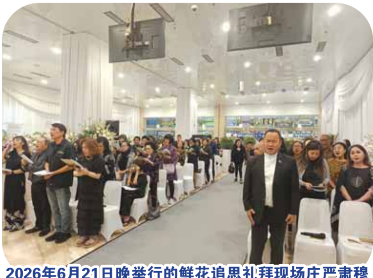
2026年6月21日晚举行的鲜花追思礼拜现场庄严肃穆