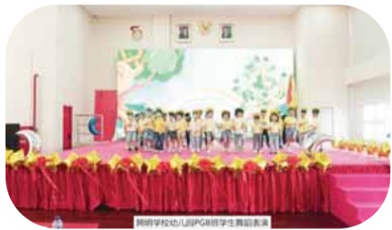
開明学校幼儿园PG班学生舞蹈表演