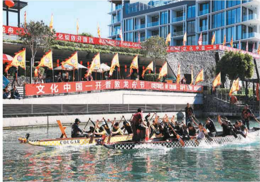
第四届“文化中国—开普敦龙舟节”现场。