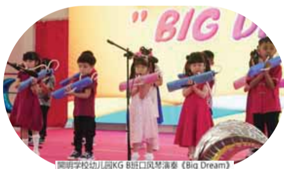
開明学校幼儿园KG B班口风琴演奏《Big Dream》