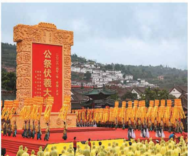
2026(丙午)年公祭中华人文始祖伏羲大典在甘肃天水举行。

2014年，两岸首次实现共祭伏羲。此次活动由新北市三重先啬宫主办、台湾中华伏羲文化学会筹备处协办。