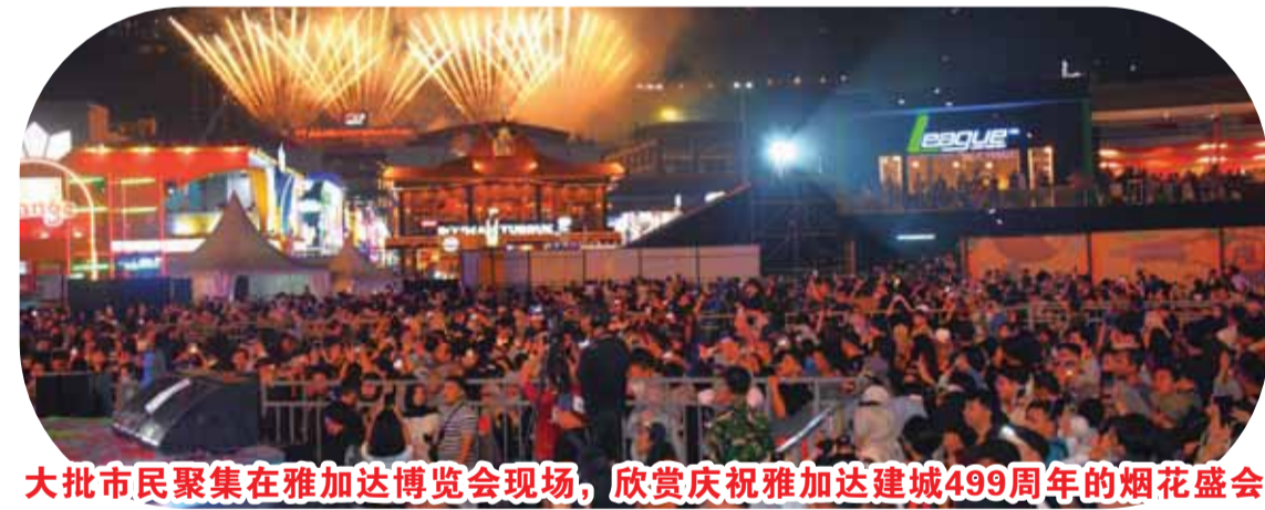
大批市民聚集在雅加达博览会现场，欣赏庆祝雅加达建城499周年的烟花盛会