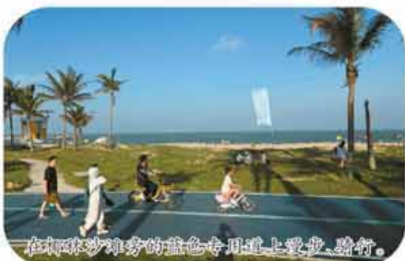
在绿草如茵的蓝色专用道上散步、骑行。