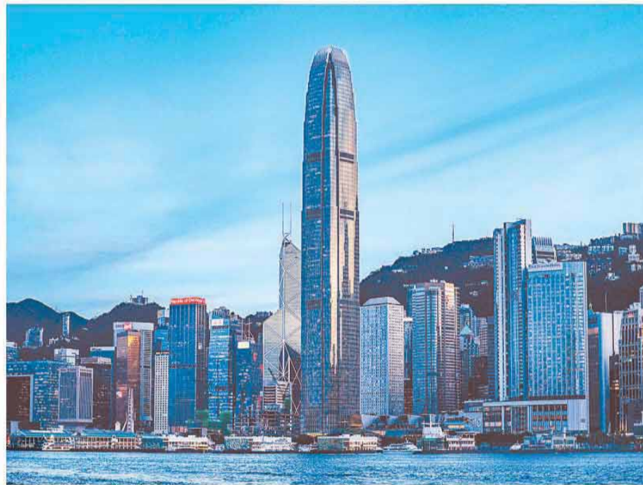
图为高楼林立的香港维多利亚港。