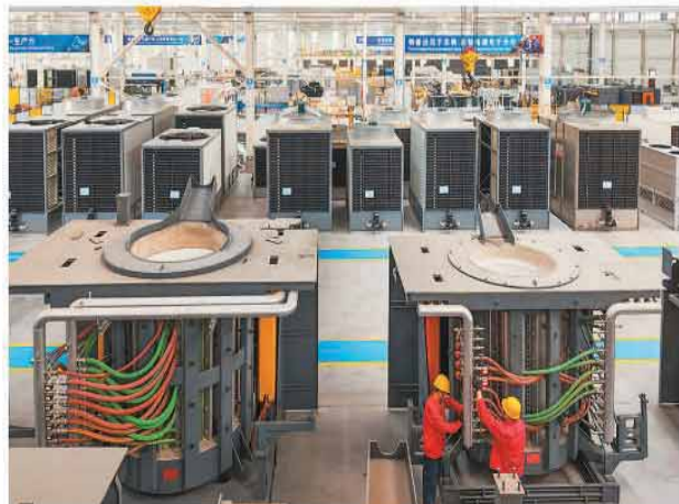
智能设备生产企业在位于河南省洛阳市汝阳县的一家工厂内，工人正在进行设备调试。