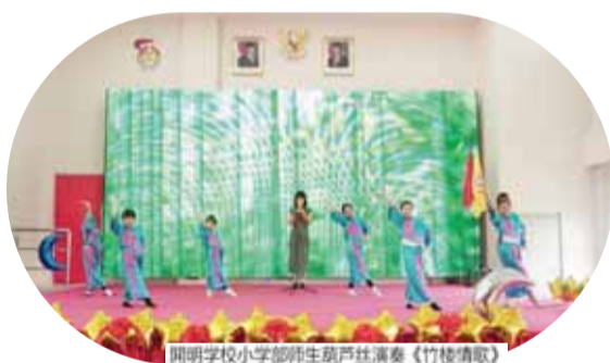
開明学校小学部师生葫芦丝演奏《竹楼情歌》