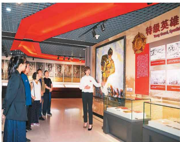
群众在辽宁沈阳抗美援朝烈士纪念馆参观。