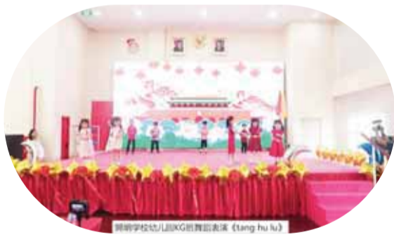
開明学校幼儿园KG班舞蹈表演《Ang hu hu》