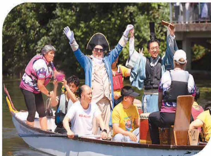
第四届法国国际龙舟嘉年华上的《屈原邂逅拿破仑》龙舟实景演出。

从美国旧金山梅西德湖40余支队伍、近千名龙舟赛选手的奋楫争先，到巴西圣保罗、里约热内卢多地龙舟赛上此起彼伏的加油助威声，从巴基斯坦喀布尔河上来自不同行业的龙舟赛“业余选手”，到斯里兰卡络绎不绝在龙舟前拍照的游客，龙舟唤醒了海外侨胞的端午记忆，也点燃了当地民众沉浸式体验中华文化的热情。