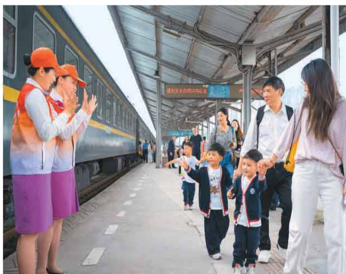
四川内江站，孩子们准备登上S611次“慢火车”，体验新中国成立后建成的第一条铁路干线。

新时代，“杨根思连”官兵将“三个不相信”英雄宣言转化为敢打必胜的信念，出色完成国际军事比赛、实兵演习、国际维和等重大任务。英雄气概，在一茬茬官兵心中激荡。