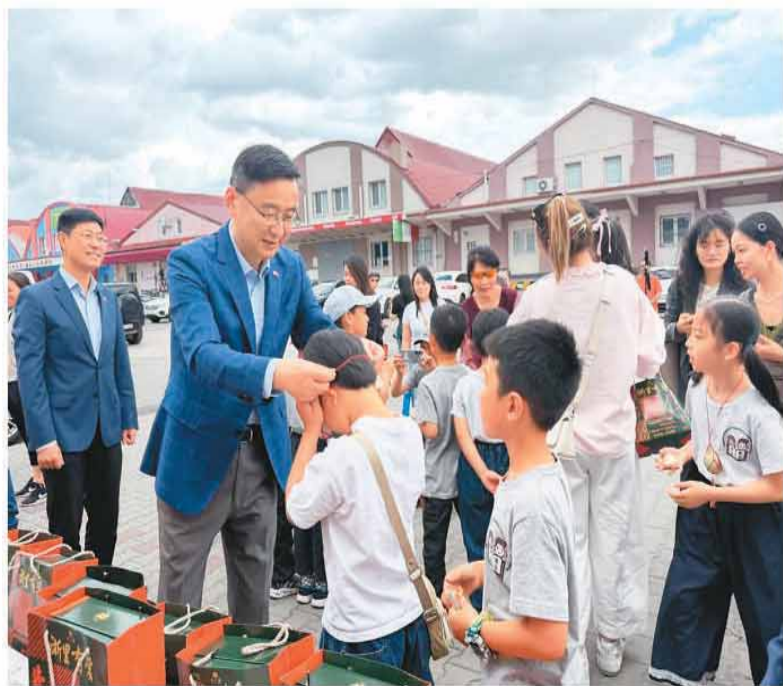
在斯洛伐克，当地侨团分发来自家乡的粽子礼盒，参与活动的嘉宾为现场表演的孩子们佩戴端午彩蛋。

端午佳节，粽叶飘香。海外各地的华侨华人向本报分享，端午期间他们或收到家乡寄送的粽子礼盒，或相聚一堂亲手包制粽子，并以此为契机开展了一系列分享与庆祝活动。