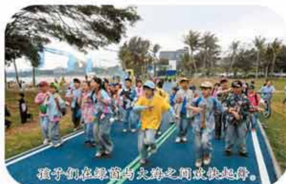
孩子们在绿茵与大海之间欢快起舞。