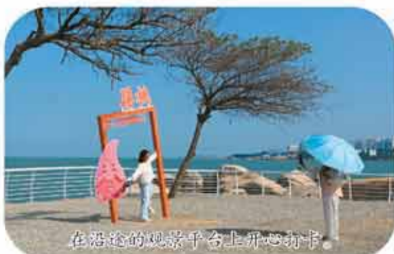
在沿途的观景平台上开心打卡。