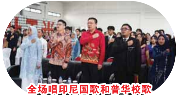
全场唱印尼国歌和普华校歌

大学等顶尖国立大学。普华一贯重视语言教育，绝大部分毕业生均在高中阶段取得了满意的HSK和雅思成绩，学生们具备了相应的语言和学术能力与宽阔的国际视野，为国际升学做好了充分准备。