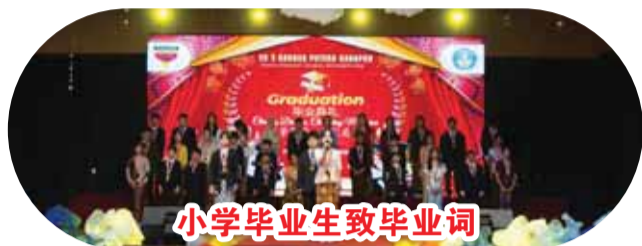
小学毕业生致毕业词