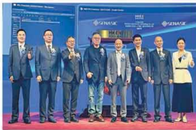
瑤捷電子科技首掛表現亮眼，大升1.27倍，一手賺4668元。

至於印尼上市的金礦商Merdeka（6228）昨日至下周二（23日）招股，計劃全球發售8966.86萬份銷售