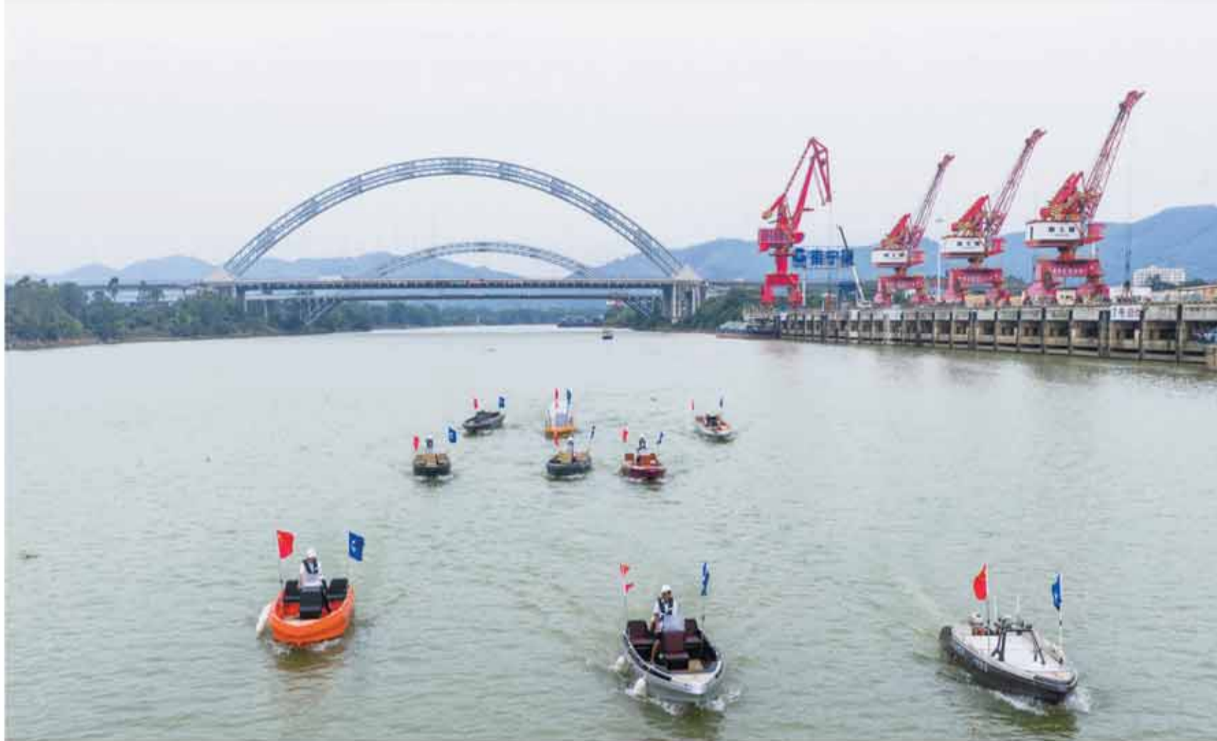
中技船舶首批九艘新能源船舶集中試航。

6月20日，中技船舶首批九艘新能源船舶集中試航儀式在廣西南寧港舉行，標誌港股上市企業中國技術集團(01725.HK)旗下中技船舶正式邁入標準化量產交付階段。本次批量船舶交付，既是桂港經貿合作落地的標誌性成果，也為平陸運河產業場景應用提供示範樣本，為全球內河、淺海領域的綠色智能航運打造國產化實踐範本。 蔡寧 李麗芳