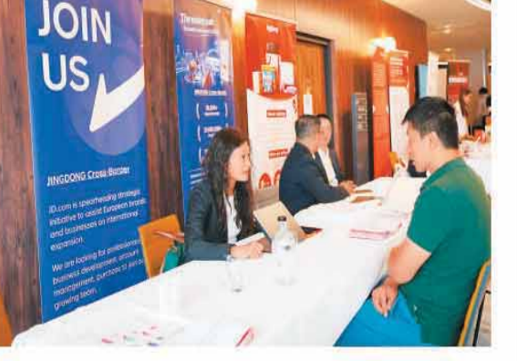
第六届中欧(法国)跨境电商论坛的京东展区。

本届论坛的主论坛由中国(杭州)跨境电商电子商务综合试验区、浙江省杭州市商务局、杭州市侨联、人民日报海外网、欧洲杭州联谊会(总商会)联合主办；分论坛由杭州国际传播中心、临平区国际传播中心主办；新欧洲集团、人民日报海外网法国融媒体中心承办，中国南方航空公司为独家合作伙伴，中国贸促会驻法国代表处予以支持。