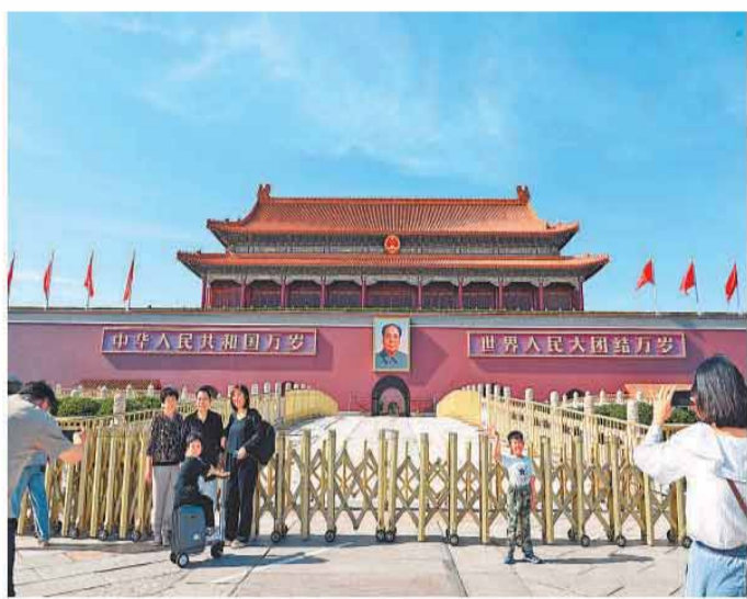
游客在天安门城楼前拍照留念。

北京，长安街，晨曦微露，雄壮的国歌声中，五星红旗冉冉升起，人们肃立注目，天安门广场迎来新的一天。