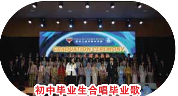
初中毕业生合唱毕业歌