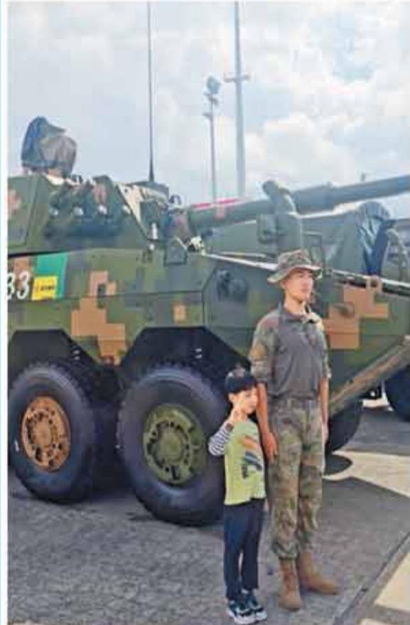
為慶祝香港回歸 29 周年，解放軍駐港部隊一連兩日開放昂船洲軍營。

【香港商報訊】記者鍾柏汶、張宏斌報道：為慶祝香港回歸祖國暨中國人民解放軍進駐香港 29 周年，解放軍駐港部隊連續兩個周末開放 3 個軍營。昨今兩日率先開放昂船洲軍營，讓已預約的公眾人士參觀，石崗和新圍軍營將於下周六及周日開放。