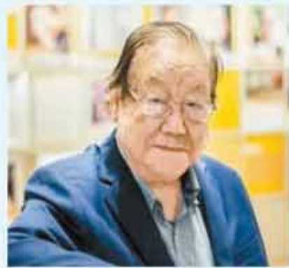
書法展以「故鄉」為主題。

金耀基在1935年出生於浙江天台，是香港中文大學社會學系講座教授、新亞書院前院長及香港中文大學前校長。並於1994年當選為台灣中央研究院院士。他畢生潛心於中國現代化研究與高等教育事業，學貫中西，著作等身，其學術思想影響深遠。在學術研究之外，金耀基於翰墨一道亦有極深造詣。他將畢生學養、人生閱歷與家國情懷熔鑄於筆端，落墨沉穩瀟灑，行筆舒展從容，構成了獨具