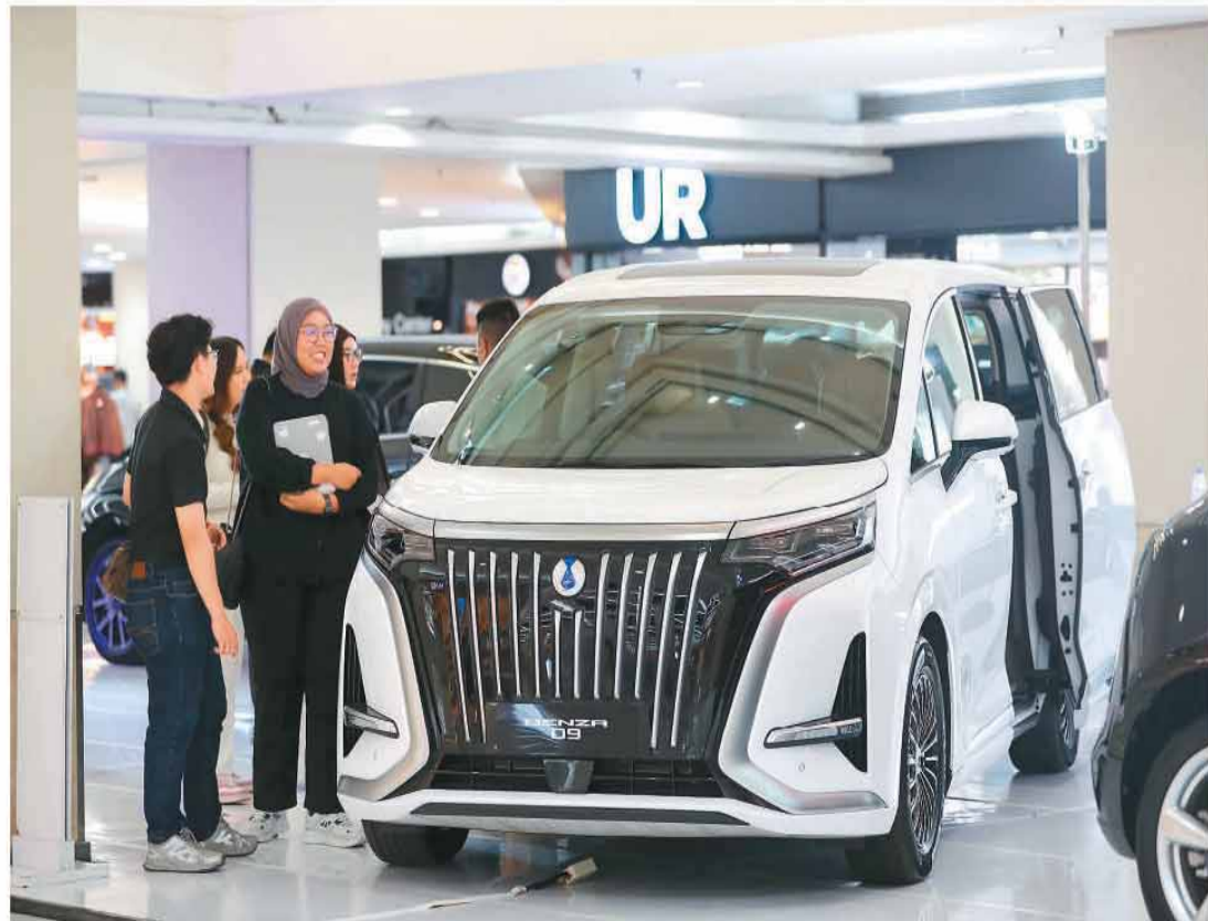
在印度尼西亚雅加达，顾客选购中国品牌电动汽车。