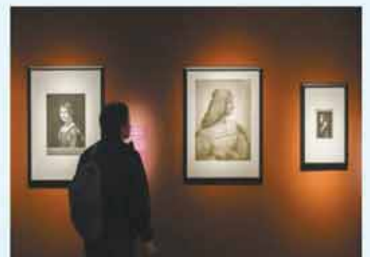
展覽現場可細看多幅肖像作品。