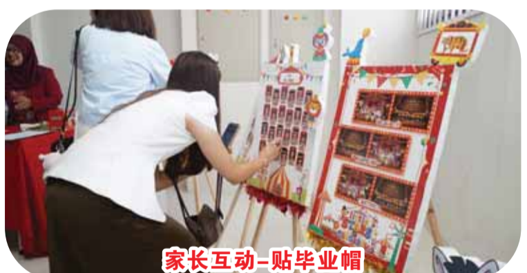
家长互动-贴毕业帽