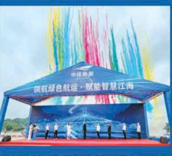
中技船舶首批九艘新能源船舶集中試航啓動。