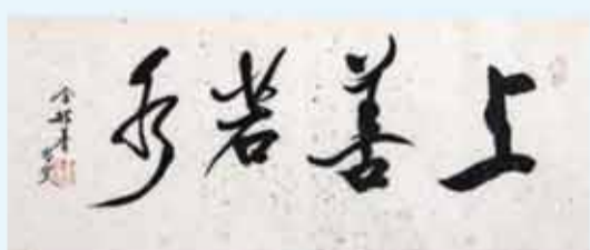
金耀基作品《道德經》句，2025。

與學術館開館同步啓幕的「金耀基故鄉書法展」，展出近百幅書法精品。作品涵蓋了他歷年精品力作，更有多幅專為此次展覽書寫的天台詩詞名篇。其中包括書寫《道德經》句、王勃《杜少府之任蜀州》詩句，以及唐李鄴《重遊天台》、宋林和靖《送僧遊天台》等詠讀家鄉的佳作。