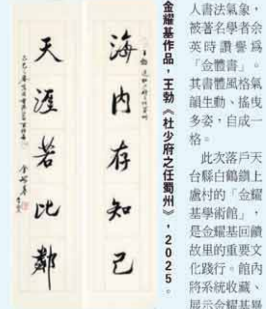
金耀基作品，主軸《杜少府之任蜀州》，2025。

日期：即日起至7月27日 時間：星期一至三至五上午10時至下午6時；星期六、日及公眾假期上午10時至晚上7時 地點：沙田文林路1號香港文化博物館1樓專題展覽館三、四及五