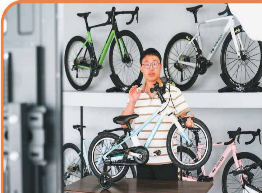
在位于河北邢台经济开发区的冀货出海共享直播基地，主播向海外用户直播介绍自行车产品。

从赛场走向大众，瑞豹坚持竞技反哺民用，把奥运级空气动力学与轻量化技术下沉，应用到民用自行车产品上，让普通骑行者也能享受高端“中国智造”。如今产品远销欧洲、东南亚，近千家门店提供一站式服务。截至目前，瑞豹年产20万辆碳纤维自行车，占据国内民用市场三分之一份额。