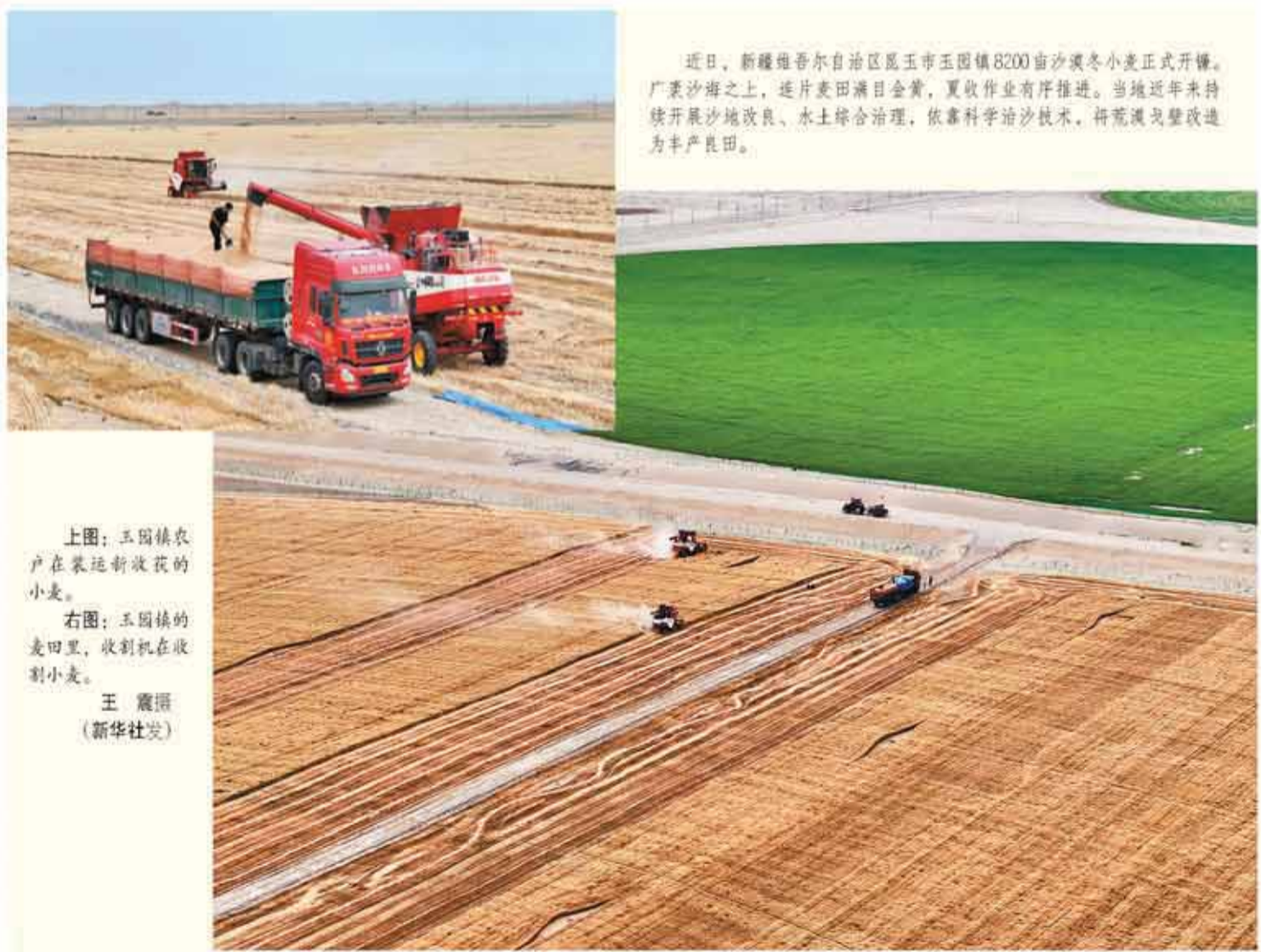
近日，新疆维吾尔自治区昆玉市玉田镇8200亩沙漠冬小麦正式开镰。广袤沙漠之上，连片麦田满目金黄，夏收作业有序推进。当地近年来持续开展沙地改良、水土综合治理，依靠科学治沙技术，将荒漠戈壁改造为丰产良田。