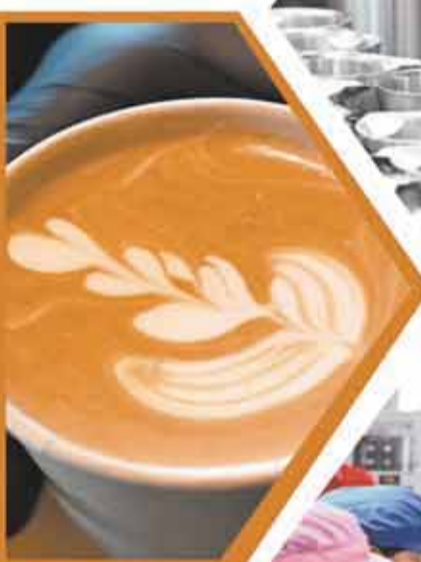
▲ 這是5月26日在江門漫野部落拍攝的現場制作的咖啡。