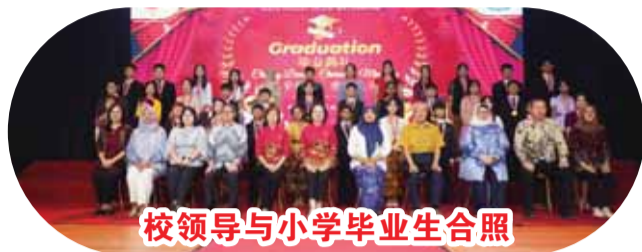
校领导与小学毕业生合照