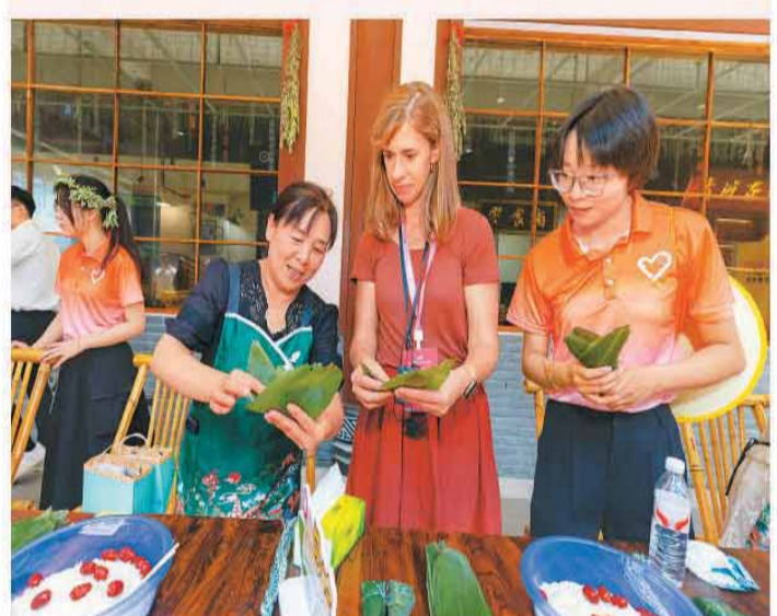
6月19日,湖北省宜昌市秭归县,参加2026国际青年领导人研修交流营活动的外宾体验包粽子。