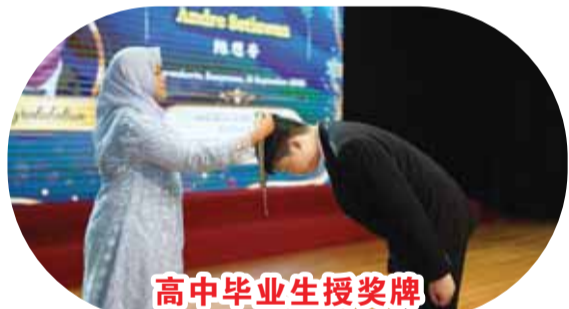
高中毕业生授奖牌