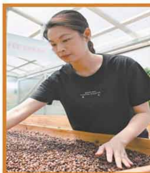
▲ 5月26日，在江門誠品咖啡觀光工廠，工作人員在翻曬咖啡生豆。