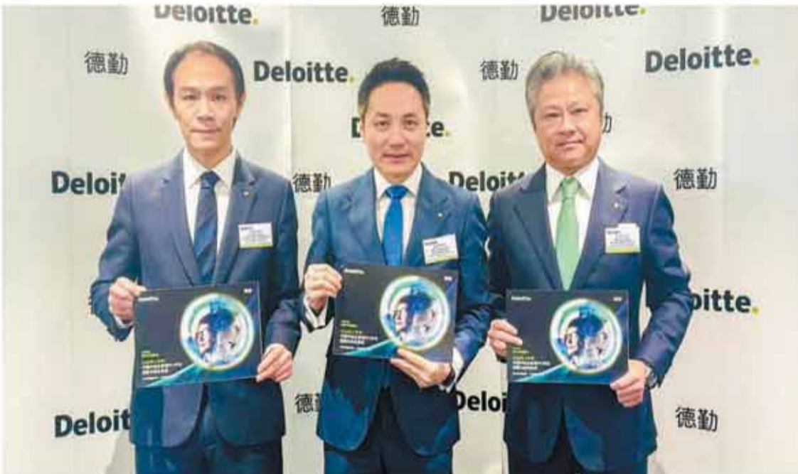
德勤預計，今年香港將有約160隻新股上市融資3000億元。

【香港商報訊】記者韓商報導：昨日，德勤中國資本市場服務部發布今年中國內地和香港新股市場的中期回顧與展望。隨着史上最大規模新股SpaceX上市，2026年上半年全球新股表現超越2025年上半年，融資金額增近5倍。受惠於SpaceX上市，納斯達克位居榜首。港交所（388）緊隨納斯達克之後，而紐約證券交易所位居第三。