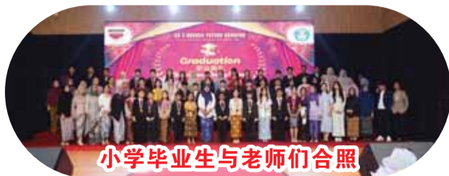
小学毕业生与老师们合照