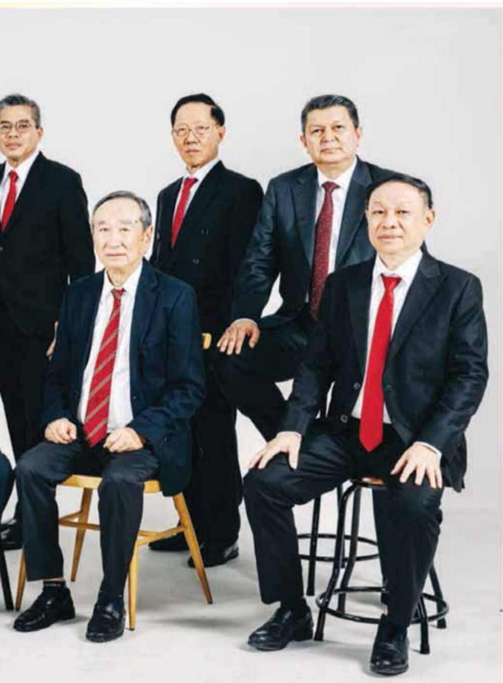
Tbk. 董事部暨經理部合影