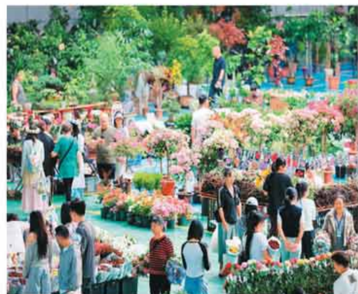
近年来，云南高原特色农业已逐步成长为拥有千亿级规模的优势特色产业群，花卉、茶叶、咖啡等优势产业各具规模、特点鲜明，成为该省乡村产业发展的有力支撑。图为市民在云南昆明斗南花卉交易市场购买鲜花。

余晓晖说，下一步，各方应以《行动方案》实施为基点，着力构建一个开放共享、多元合作、创新活跃的平台经济发展体系，让大企业在能力开放中获得生态活力，让中小企业在要素流通中释放创新潜能，让人、技术、数据在公平有序的规则下共同创造价值，形成价值共创、互利共赢的良性循环，推动平台经济发展水平迈上新台阶。