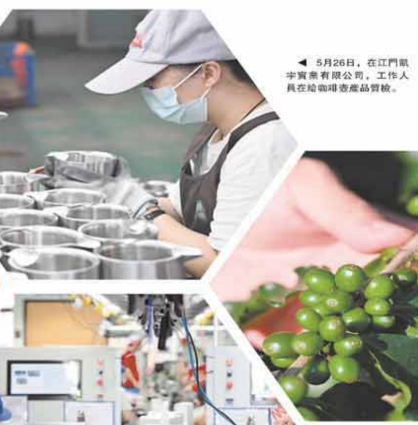
▲ 5月25日，在江門開平市森源咖啡莊園，採在枝頭的咖啡果實。