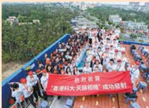
科大師生一同觀看火箭升空情況。