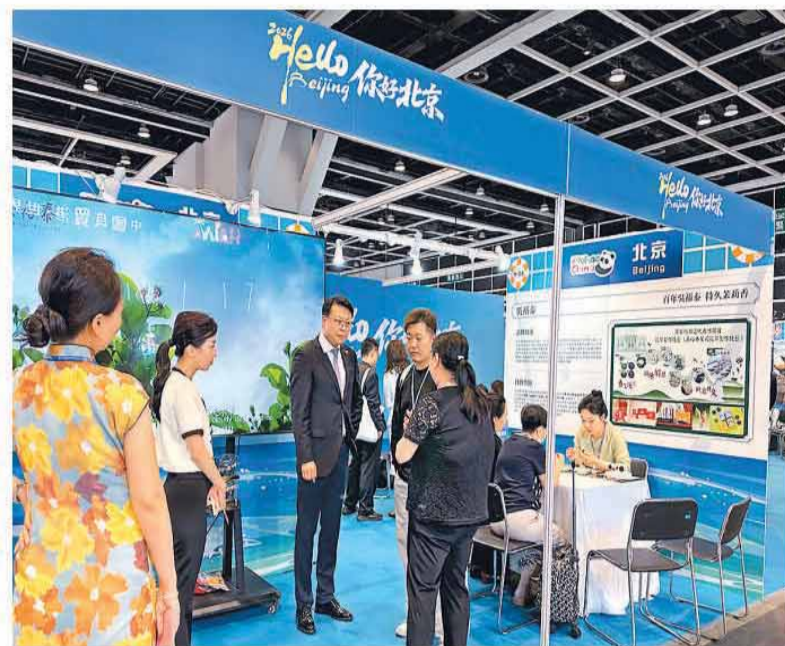
▲香港国际旅游展现场，市民在展位前驻足咨询。

中国旅游研究院院长戴斌以一组数据举例表示，当前游客对香港的评价中，“经典”“繁华”等传统印象依然占据重要位置，但与智慧旅游相关的关键词还不算突出。他认为，香港在保持传统吸引力的同时，正迎来以科技刷新体