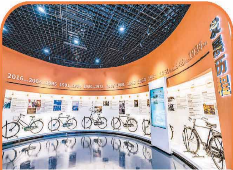
位于天津市西青区的飞鸽品牌文化展馆展出的飞鸽牌自行车。

自行车，过去是代步工具，现在正逐渐成为健身、社交与生活方式的象征。2025年，中国自行车全行业总产量超1.1亿辆，出口4893.9万辆。全3D打印钛合金车架、新材料骑行装备、人工智能骑行数据与定制化生产……一系列硬核装备和技术加速落地，中国自行车产业正从“跟跑”走向“领跑”，开启技术创新和品牌升级之路。