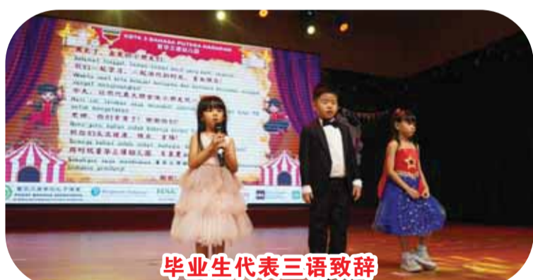
毕业生代表三语致辞