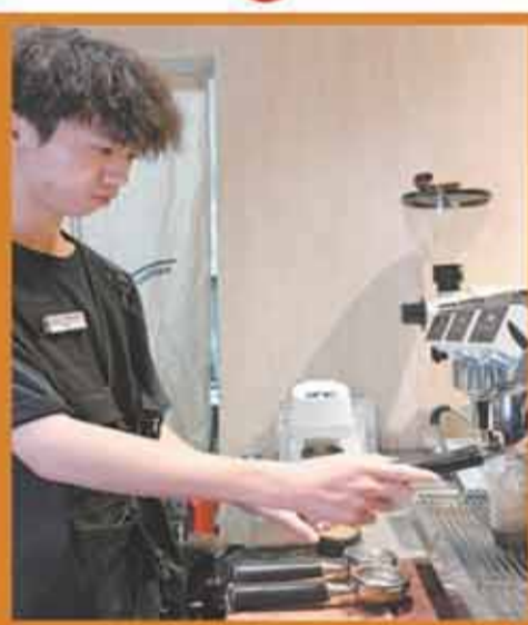
▲ 5月25日，在江門Add Coffee，工作人員在制作冰美式咖啡。