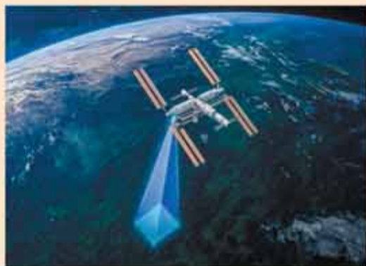
天韻相機從太空軌道對溫室氣體排放源進行高精度成像，精準定位排放位置。