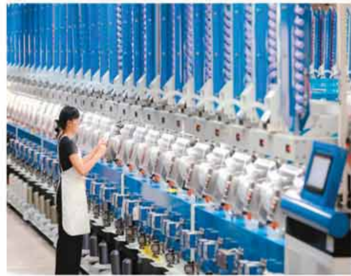
浙江省近年立足数字经济先发优势，以数智赋能推动传统产业焕新升级，通过数字化、智能化改造升级激发传统制造业新活力，为制造业高质量发展注入新动能。图为近日，位于浙江省湖州市德清县新安镇的一家企业智能化车间内，工人对全自动纺纱机生产线进行巡检。

李超表示，国家发展改革委将会同有关部门，持续推动政策红利更加公平、便捷、规范地直达消费者，更好释放“两新”政策效能。一是有序安排资金下达。二是加强项目和资金监管，持续完善链条监管机制，严厉打击“先涨后补”、骗补套补等违法违规行。三是做好跟踪问效，组织开展“两新”政策实施效果评估，做好政策接续预研储备。