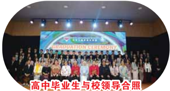
高中毕业生与校领导合照