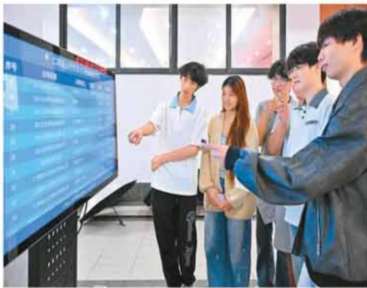
近日，四川省眉山市仁寿县人社局在四川科技职业学院举办“公共就业服务进校园”专场招聘会，吸引了众多学生前来求职应聘。图为学生们正在了解岗位信息。

今年以来，各地区各部门加大稳就业力度，推动就业形势保持总体稳定。5月份，全国城镇调查失业率为5.1%，比上月下降0.1个百分点，其中30—59岁劳动力主体人群、外来