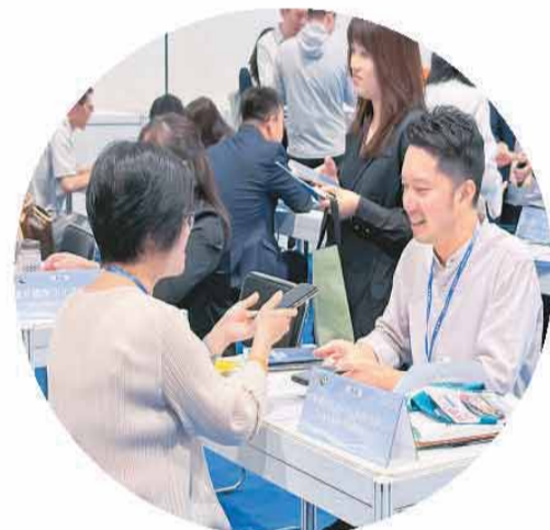
▲香港国际旅游展洽谈区内气氛热烈。