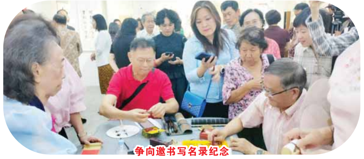
爭向邀書寫名錄紀念