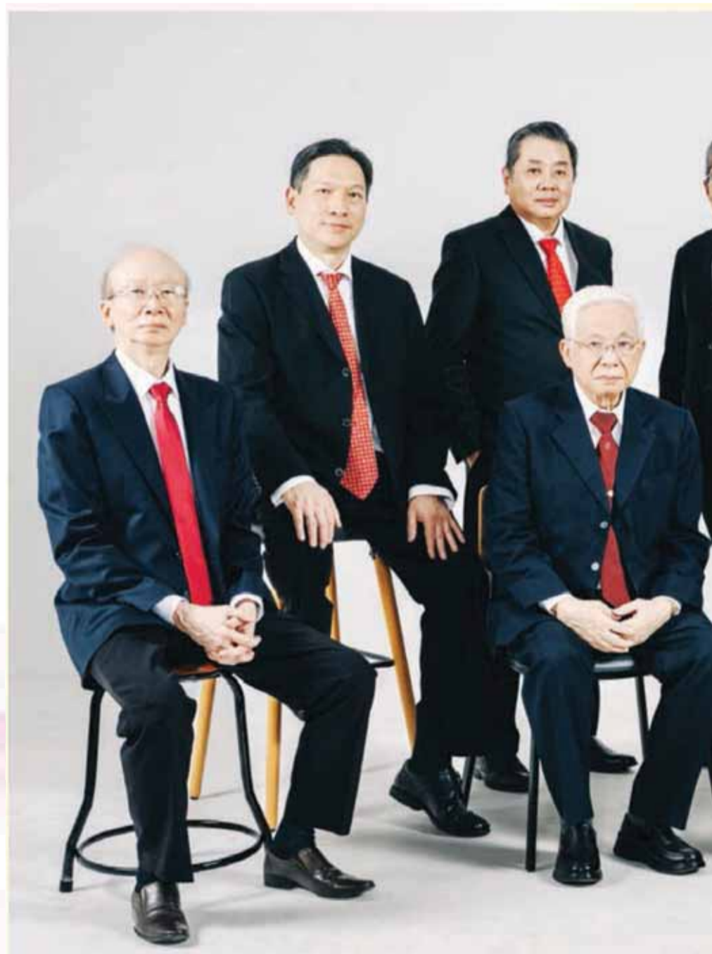
PT. Niramas Utama Tbk