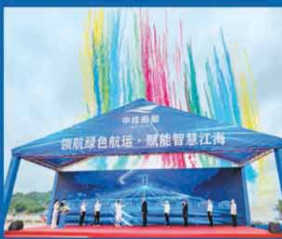
中技船舶首批九艘新能源船舶集中試航啓動。