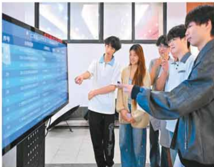
近日，四川省眉山市仁寿县人社局在四川科技职业学院举办“公共就业服务进校园”专场招聘会，吸引了众多学生前来求职应聘。图为学生们正在了解岗位信息。

今年以来，各地区各部门加大稳就业力度，推动就业形势保持总体稳定。5月份，全国城镇调查失业率为5.1%，比上月下降0.1个百分点，其中30—59岁劳动力主体人群、外来