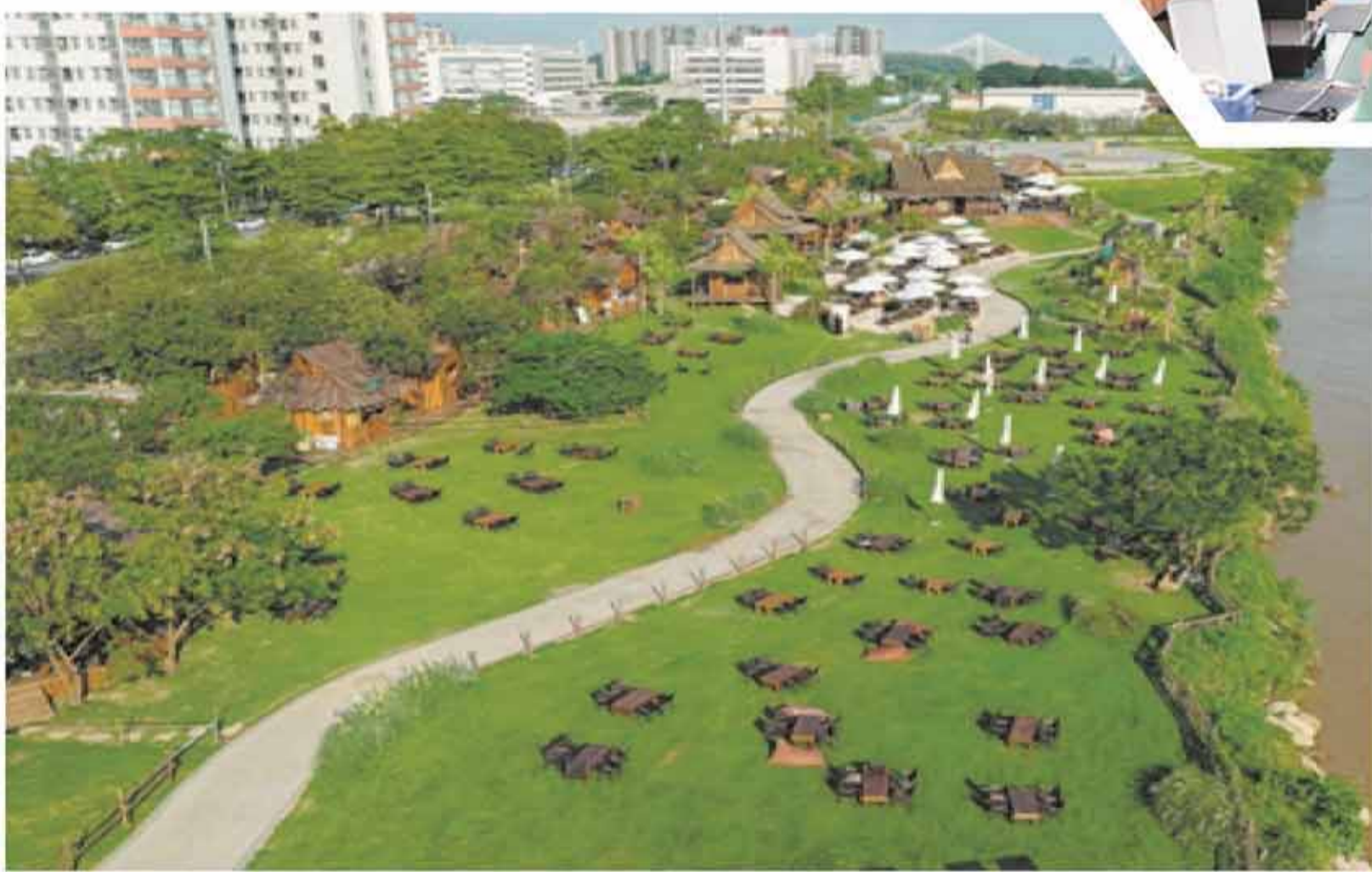
▲ 這是5月26日拍攝的江門漫野部落，它以都市微度假為定位，咖啡茶飲、戶外休閒為特色（無人機照片）。

江門與咖啡的緣分正是源于遍布海外的華僑。改革開放後，地緣相近、人緣相親的港澳咖啡企業將目光投向江門。依托僑鄉遍及全球的網絡，江門匯聚了巴西、埃塞俄比亞、哥倫比亞等主要產地的300多種精品咖啡生豆，年進口額超3000萬元。江門是內地最早的咖啡烘焙基地之一，全市擁有21家獲證烘焙