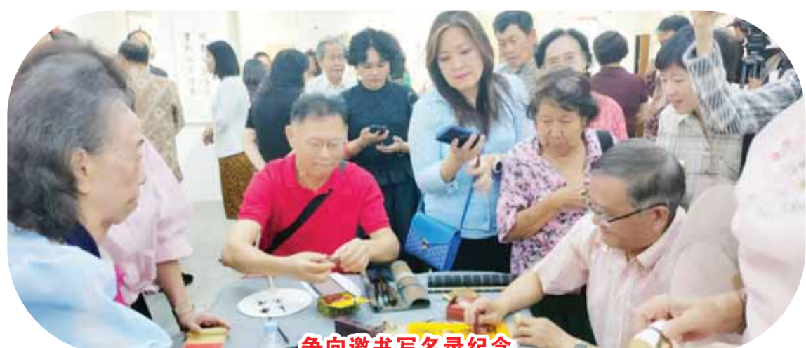
爭向邀書寫名錄紀念