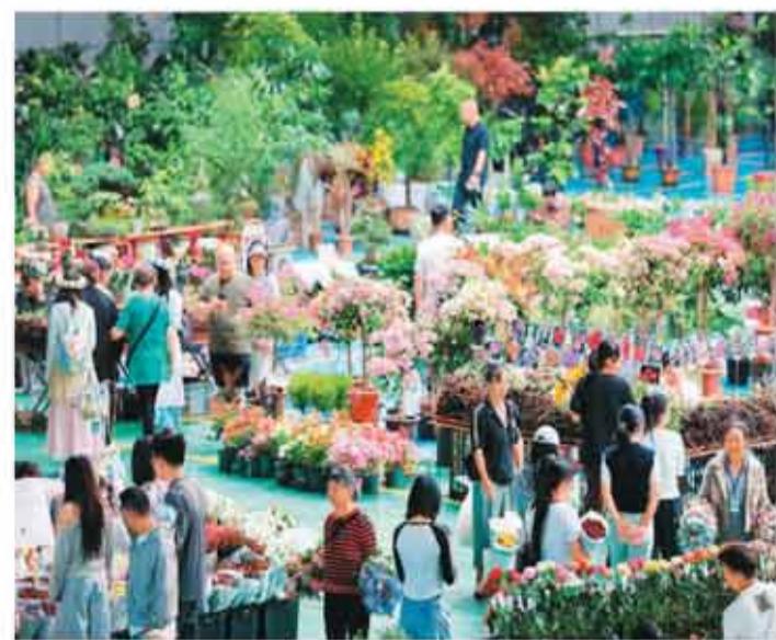
近年来，云南高原特色农业已逐步成长为拥有千亿级规模的特色产业集群，花卉、茶叶、咖啡等优势产业各具规模、特点鲜明，成为该省乡村产业发展的有力支撑。图为市民在云南昆明斗南花卉交易市场购买鲜花。

余晓晖说，下一步，各方应以《行动方案》实施为基点，着力构建一个开放共享、多元合作、创新活跃的平台经济发展体系，让大企业在能力开放中获得生态活力，让中小企业在要素流通中释放创新潜能，让人、技术、数据在公平有序的规则下共同创造价值，形成价值共创、互利共赢的良性循环，推动平台经济发展水平迈上新台阶。