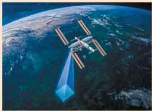
天韻相機從太空軌道對溫室氣體排放源進行高精度成像，精準定位排放位置。