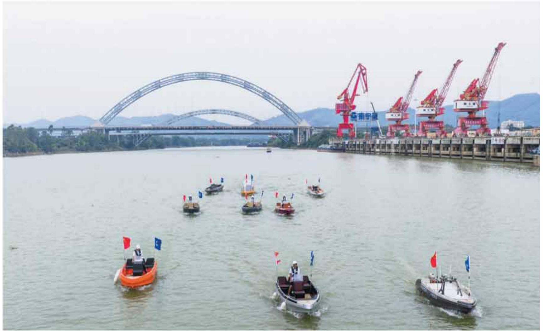
中技船舶首批九艘新能源船舶集中試航。

6月20日，中技船舶首批九艘新能源船舶集中試航儀式在廣西南寧港舉行，標誌港股上市企業中國技術集團(01725.HK)旗下中技船舶正式邁入標準化量產交付階段。本次批量船舶交付，既是桂港經貿合作落地的標誌性成果，也為平陸運河產業場景應用提供示範樣本，為全球內河、淺海領域的綠色智能航運打造國產化實踐範本。 蔡寧 李麗芳