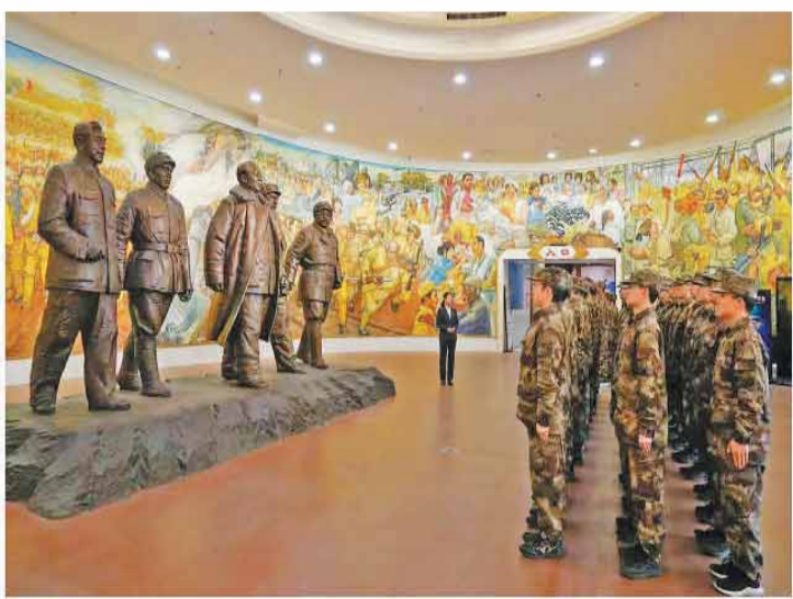
入伍新兵代表来到平津战役纪念馆参观。

津沱河畔，松柏苍翠。河北平山县西柏坡中共中央旧址，几间低矮的土坯房里摆着斑驳的木桌，质朴而厚重。