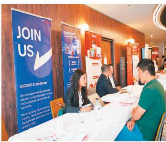
第六届中欧(法国)跨境电商论坛的京东展区。

本届论坛的主论坛由中国(杭州)跨境电商电子商务综合试验区、浙江省杭州市商务局、杭州市侨联、人民日报海外网、欧洲杭州联谊会(总商会)联合主办；分论坛由杭州国际传播中心、临平区国际传播中心主办；新欧洲集团、人民日报海外网法国融媒体中心承办，中国南方航空公司为独家合作伙伴，中国贸促会驻法国代表处予以支持。