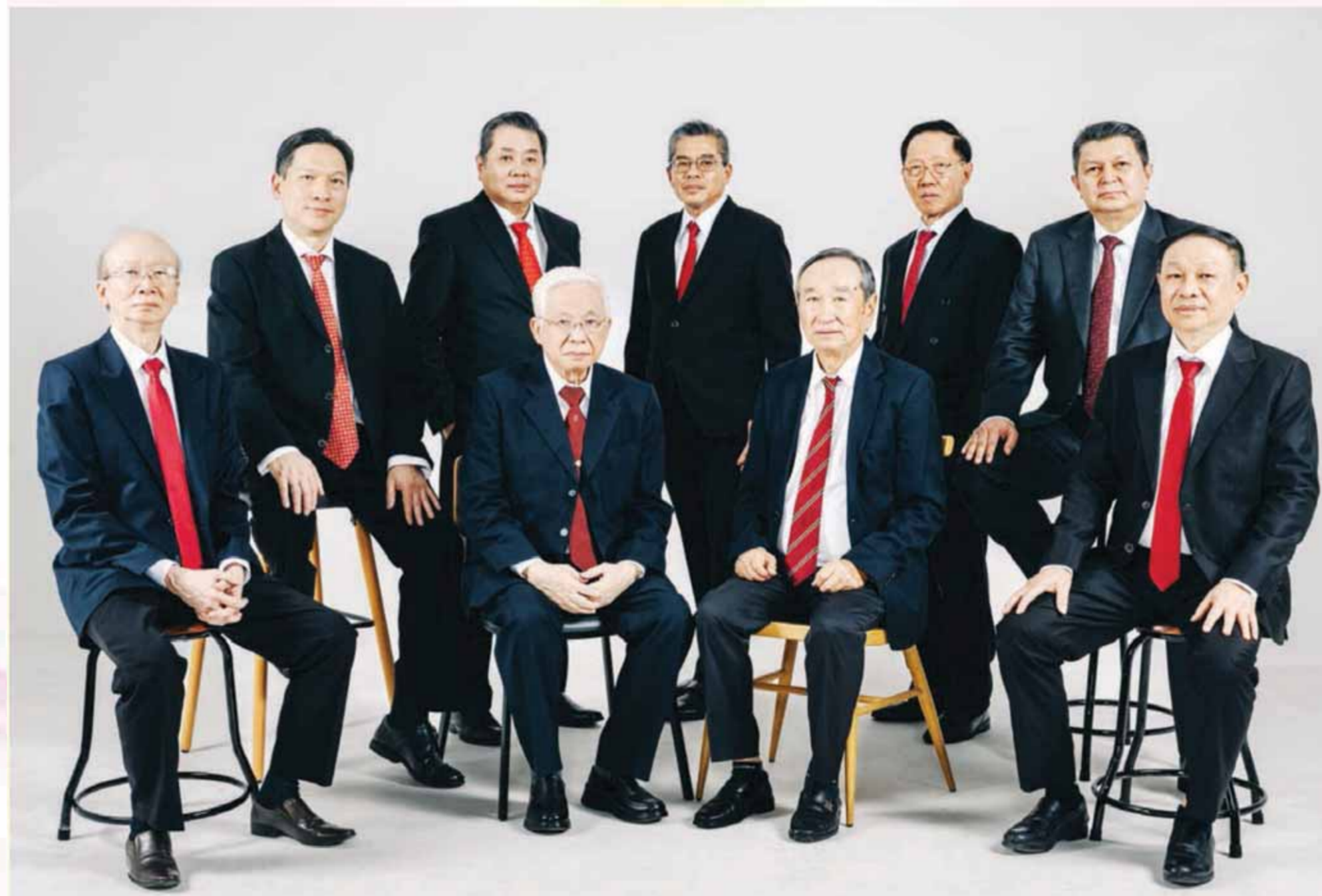
PT. Niramas Utama Tbk. 董事部暨經理部合影