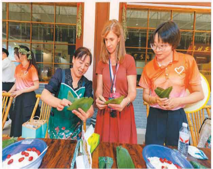
6月19日,湖北省宜昌市秭归县,参加2026国际青年领导人研修交流营活动的外宾体验包粽子。