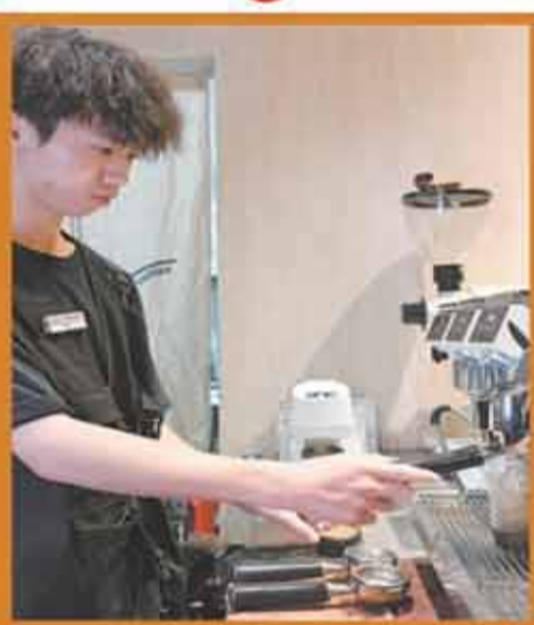
▲ 5月25日，在江門Add Coffee，工作人員在制作冰美式咖啡。