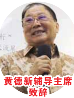
黃德新輔導主席 致辭