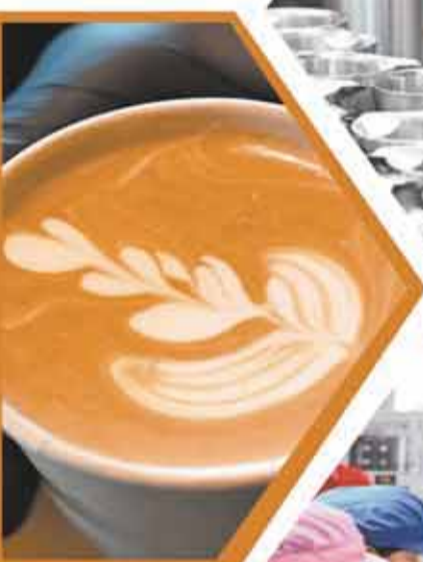
▲ 這是5月26日在江門漫野部落拍攝的現場制作的咖啡。