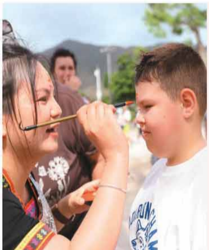
6月19日,海南省三亚市南山文化旅游区端午节活动中,工作人员为外国小朋友点粽黄。