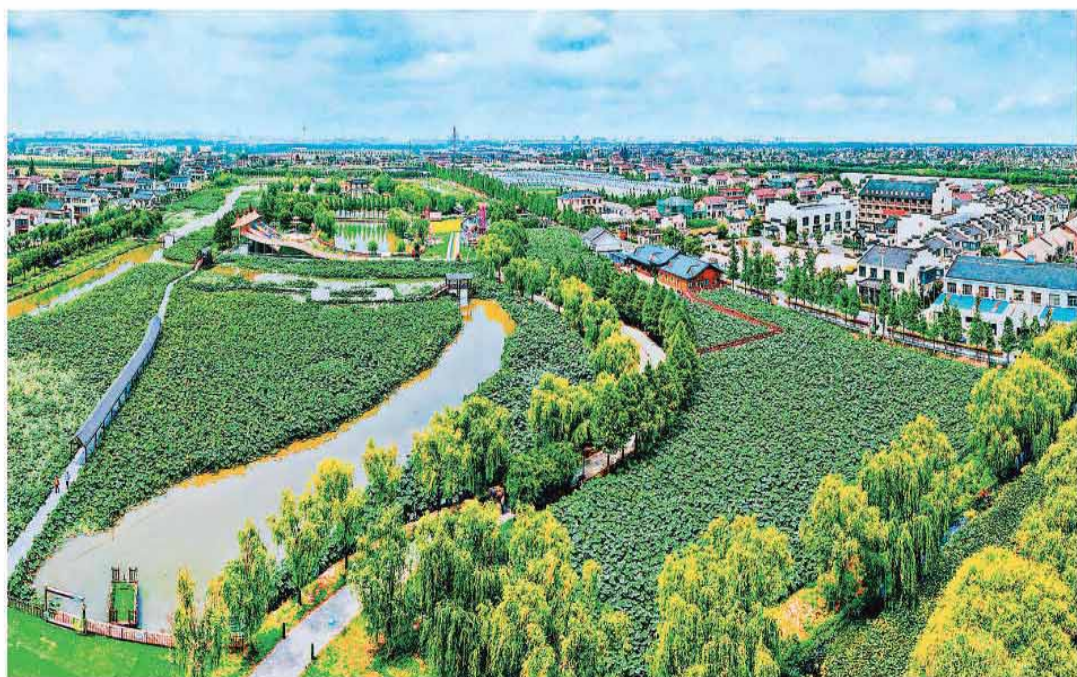
近日,江苏省如皋市城北街道平园池村,荷塘荷花竞相绽放,与民居相映成趣,构成一幅夏日和美乡村画卷。

能商品首发首展。在服务消费领域,实施意见围绕居家、养老、文旅、住宿餐饮、教育五大场景,提出多项务实举措。包括研究将智能家居及服务应用纳入“好房子”建设指南;指导养老服务机构运用人工智能技术,配备智能护理机器人、康复机器人等产品;推动人工智能赋能旅游,与行程规划、票务办理、导游导览、酒店预订等全链条深度融合;在机关、学校、医院等推广“智慧食堂”等。