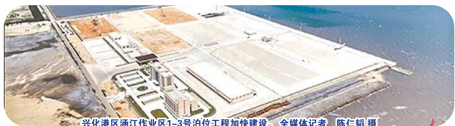
兴化港区涵江作业区1-3号泊位工程加快建设。

作为兴化港区涵江作业区开发的主力军，涵江港口建设发展有限公司紧扣港口岸线收储、港航基建、仓储物流、码头经营、多式联运等全链条主业，全力推进1—3号泊位工程建设收官，并引进全省首个规模化海工装备制造基地。