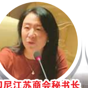
印尼江苏商会秘书长