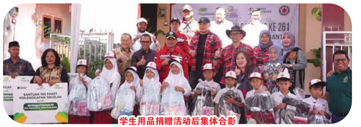
学生用品捐赠活动后集体合影

【梭罗讯】2026年6月6日至7日，由印尼梭罗客家公会 (Perhakkas Solo) 及梭罗客家青年团 (Paprika) 联合举办的“客家梭罗联谊营 (Hakka Solo Connect)”在风景秀丽、气候凉爽的达旺芒古 (Tawangmangu) 顺利举行。活动吸引了53位参与者，其中51位来自梭罗客家公会，2位来自三宝垄客家团体，涵盖儿童、青年、中年及长者等不同年龄层，现场气氛热烈融洽。