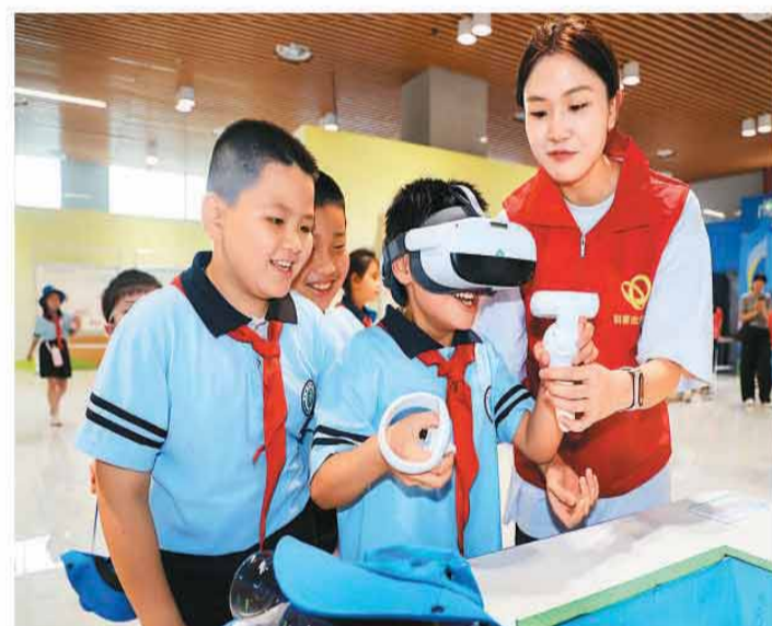
6月16日，广西流动健康科普馆(贺州站)正式启动，向公众免费开放，通过机械互动、机电体验等形式，让群众在趣味体验中掌握实用健康知识。图为小朋友们在贺州市科技馆体验VR眼镜。