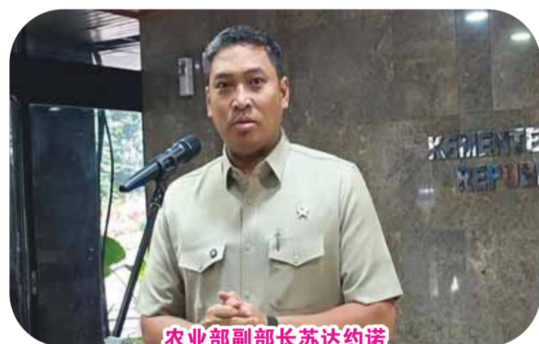
农业部副部长苏达约诺

【本报讯】政府开始加快步伐让仍然依赖进口的大蒜能够自给自足。其中一项措施是拨款近4000亿盾,用于增加国内大蒜种子的产量。