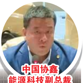
中国协鑫能源科技副总裁