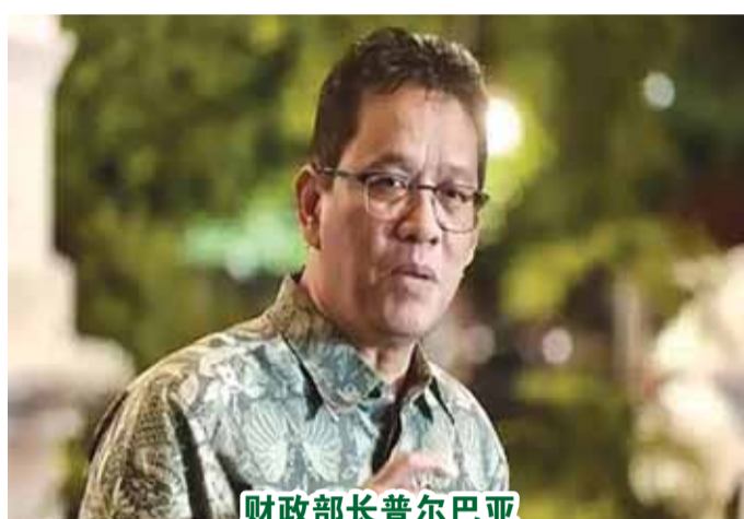
财政部长普尔巴亚

【本报讯】6月16日,财政部长普尔巴亚前往中国,向中国投资者发行以人民币计价的政府有价证券,称为熊猫债券。