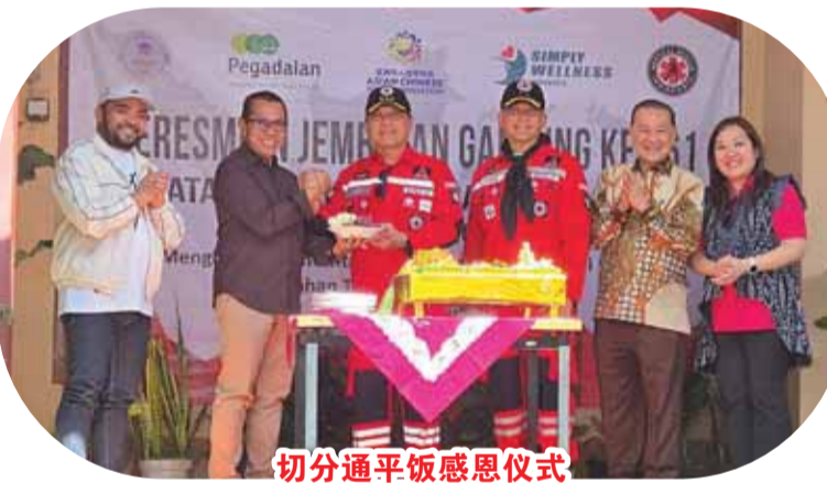
切分通平饭感恩仪式