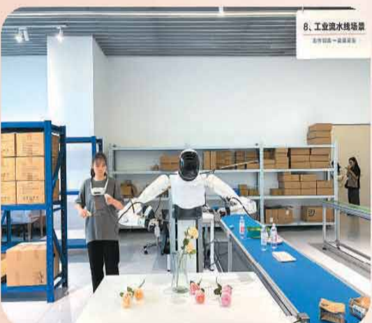
工业流水线场景里，人形机器人正在学习插花。