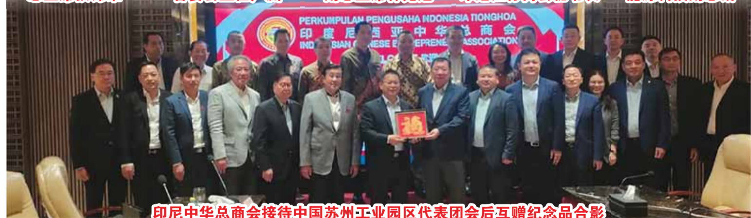
印尼中华总商会接待中国苏州工业园区代表团会后互赠纪念品合影