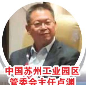
中国苏州工业园区管委会主任卢渊