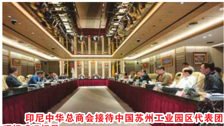
印尼中华总商会接待中国苏州工业园区代表团现场盛况