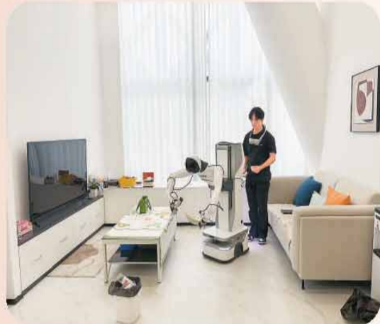
家居场景里，训练师正在教人形机器人收拾客厅。