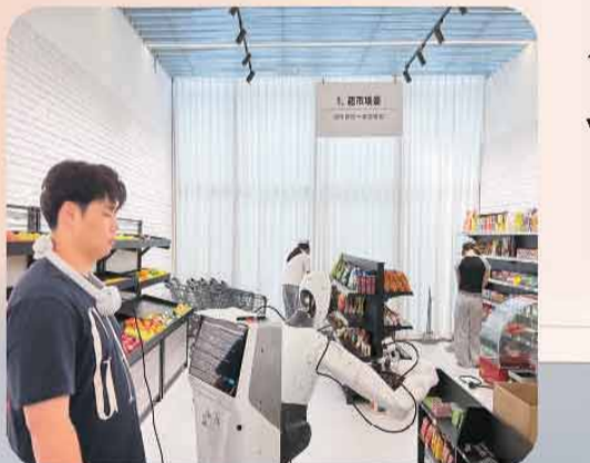
超市场景里，人形机器人正在学习抓取货物。