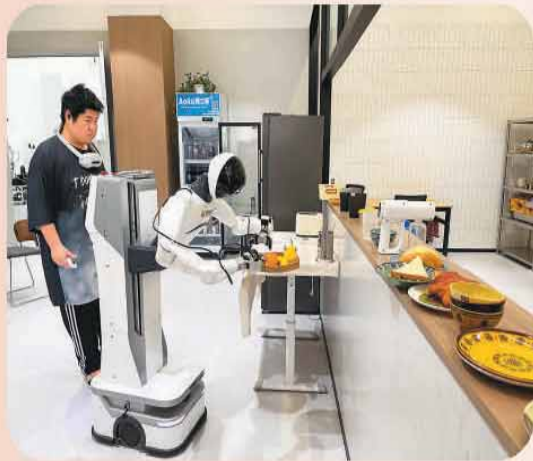
餐厅场景里，人形机器人在学习端送果盘。