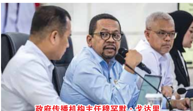
政府传播机构主任穆罕默·戈达里

的提供营养服务单位、每月600万盾的提供营养服务单位激励,以及重点关注最贫困群体的目标免费营养餐受益者。戈达里声称,同时关注偏远地区的提供营养服务单位未来发展,使这些最脆弱群体能够获得最大利益。作为管理免费营养餐的国家营养局目前正在评估学校假期期间的