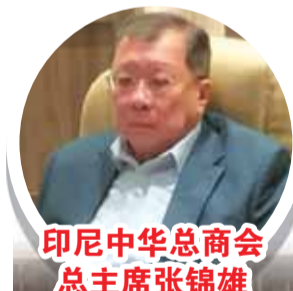
印尼中华总商会主席张锦雄