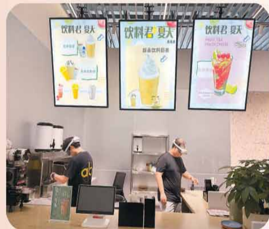
饮品店场景里，训练师头戴VR设备进行操作以收集动作数据。