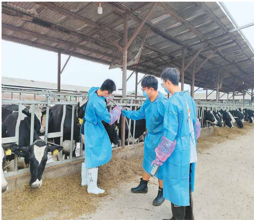
学生正在进行日常工作。

“我们希望通过科技小院，引导学生在牛场里发现问题、解决问题，推动科研成果走出实验室，直达生产一线。”刘国世教授说。