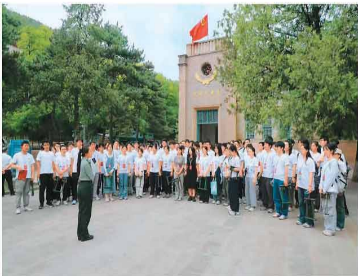
青年们在杨家岭中央大礼堂参加研学活动。