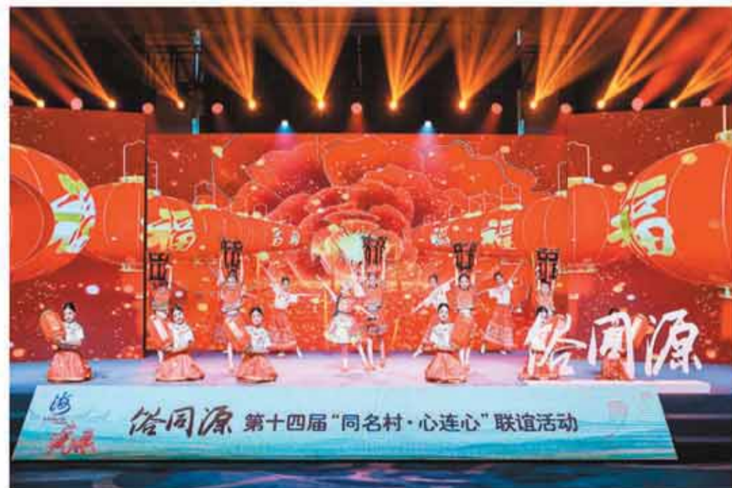
图为开场舞蹈《灯照两岸》。