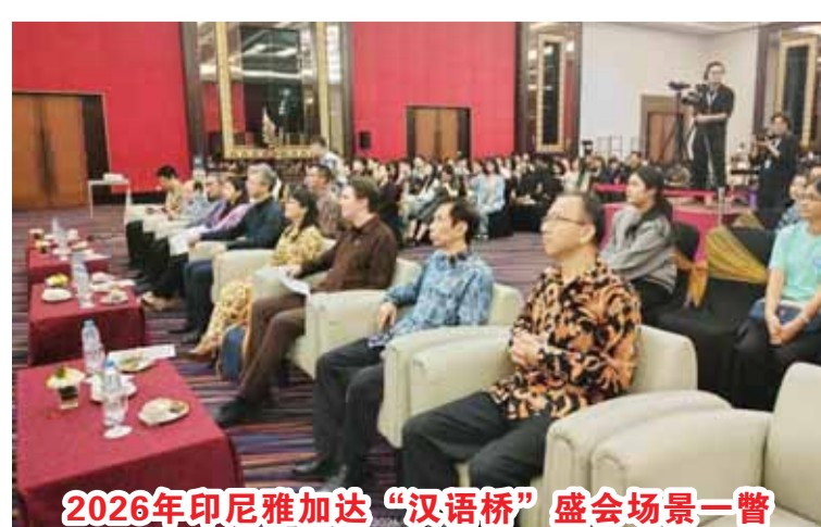
2026年印尼雅加达“汉语桥”盛会场景一瞥