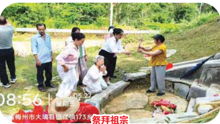
梅州市大埔县银江镇173乡祭拜祖宗

异于大海捞针。往后许多年，一家人始终小心翼翼守护着这份遗愿，却始终找不到头绪。直到凯特外祖父逝世67周年，祭拜先辈时，祖辈的漂泊经历、母亲的毕生遗憾再次涌上心头，凯特下定决心，无论再艰难，也要完成几代人的夙愿。