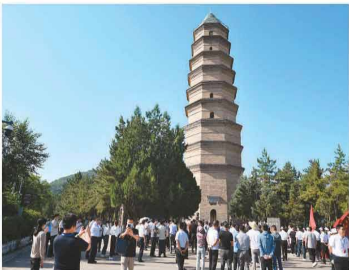
游客在延安宝塔山参观。