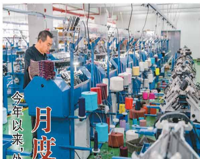
今年以来，外贸保持良好运行态势

“当前，全球人工智能、绿色低碳转型等产业需求旺盛，带动相关产品贸易增长，我国出口动能持续向新向好发展。前5个月，机电产品出口拉高我国整体出口11.1个百分点，锂电池、风力发电机组等绿色产品出口增长四成左右。”吕大良说。 北京大学经济学院教授苏剑表示，从5月当月数据