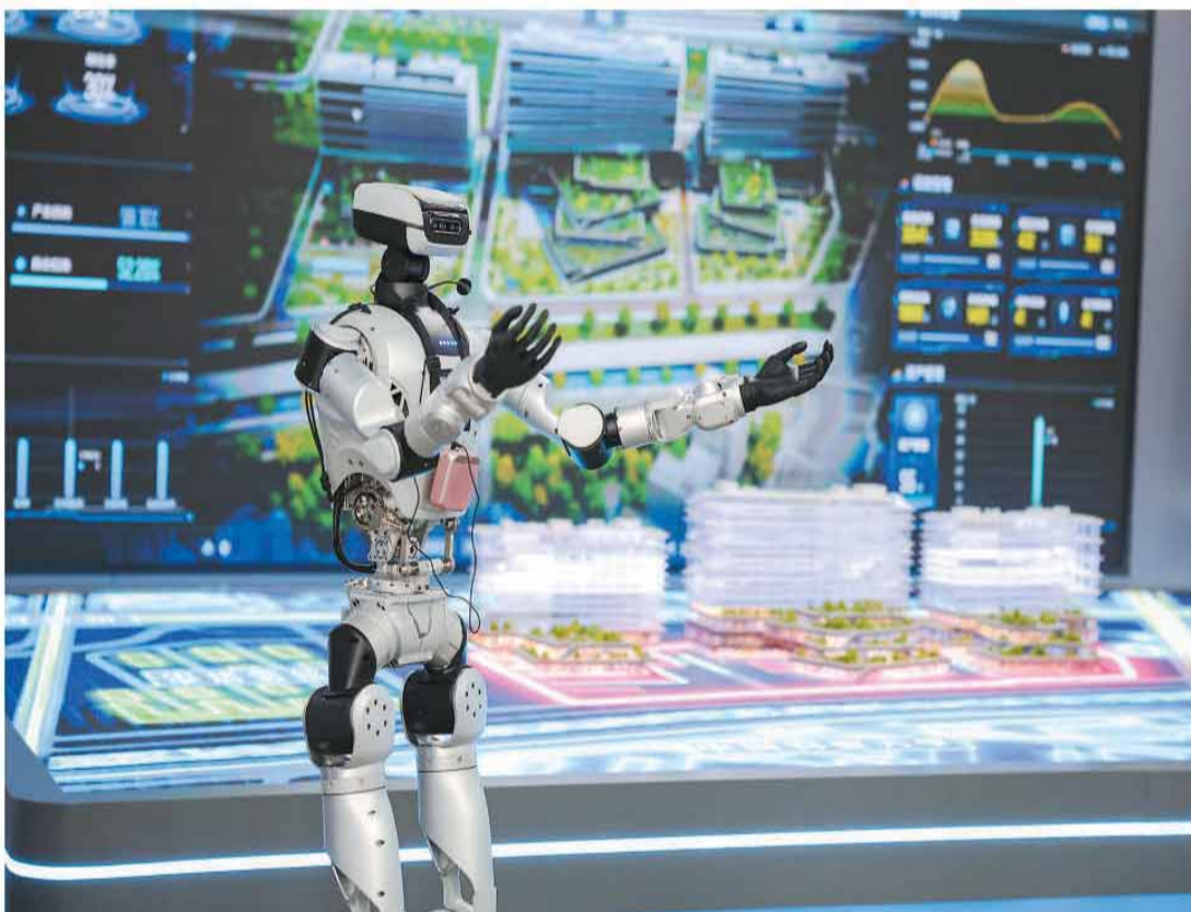
6月13日，在北京中关村（海淀）具身智能创新产业园展厅，机器人讲解员向来访者介绍园区情况。

据悉，工业和信息化部、国务院国资委还将建立常态化跟踪评估机制，动态掌握工作进展和阶段成效，组织行业专家开展实地指导，协调打通推进过程中的难点堵点。