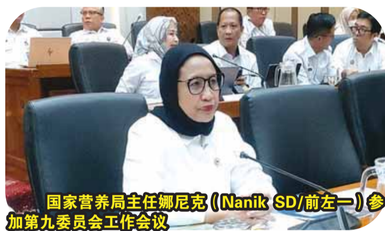
国家营养局主任娜尼克(Nanik SD/前左一)参加第九委员会工作会议