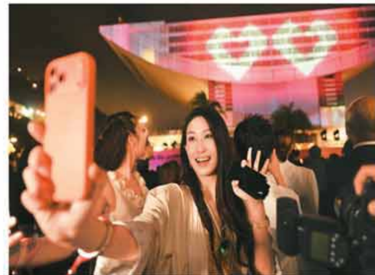
“汇映山”大型沉浸式光影汇演近日在香港太平山顶凌霄阁上演。演出运用光雕投影技术，让观众沉浸式感受香港城市魅力。图为活动现场。

香港特区政府民政及青年事务局副局长梁宏正表示，特区政府将善用香港独特优势，致力于培育爱国爱港、具备国际视野和正向思维的新一代，鼓励青年更加主动融入国家发展大局。