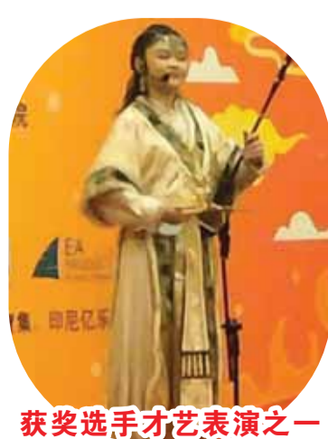
获奖选手才艺表演之一