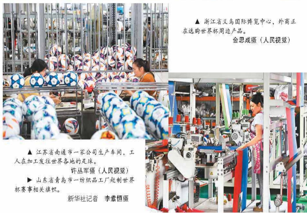
▲江苏省南通市一家公司生产车间，工人在加工发往世界各地的足球。