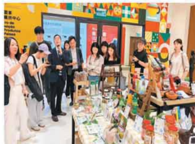
图为采访团在中国与葡语国家商贸合作服务平台展示馆参观。

本报澳门6月15日电（记者江琳、邹瑾）“机遇澳门”主题采访活动15日在澳门正式启动。