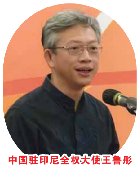
中国驻印尼全权大使王鲁彤