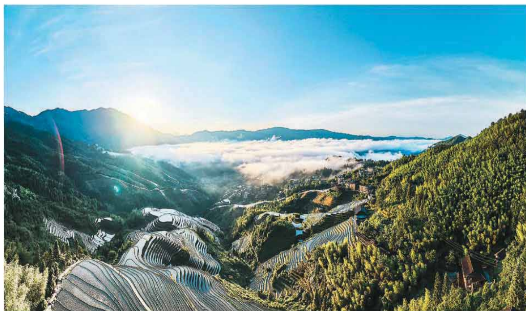
广西壮族自治区桂林市龙胜各族自治县龙脊梯田是全球重要农业文化遗产。近年来,当地在坚持农业生产的同时,加强对梯田的保护利用,大力发展文旅产业,促进群众增收。 图为龙脊梯田云雾景观。