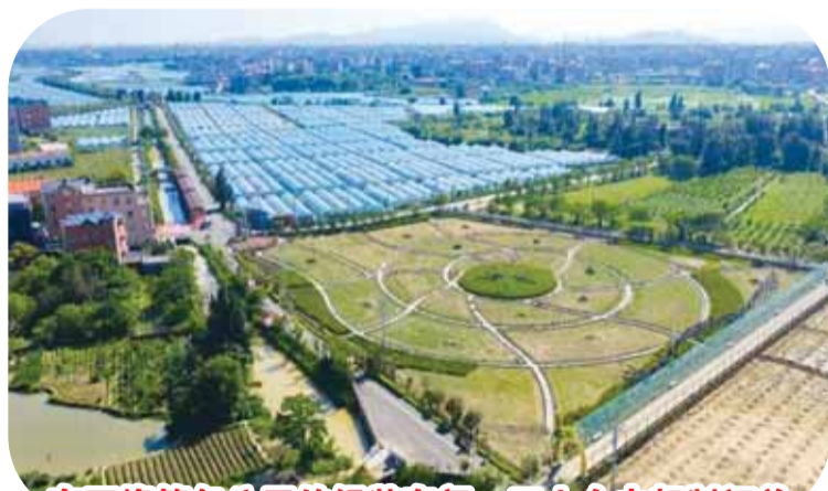
在万烽箱包公司的组装车间，工人全力赶制订单