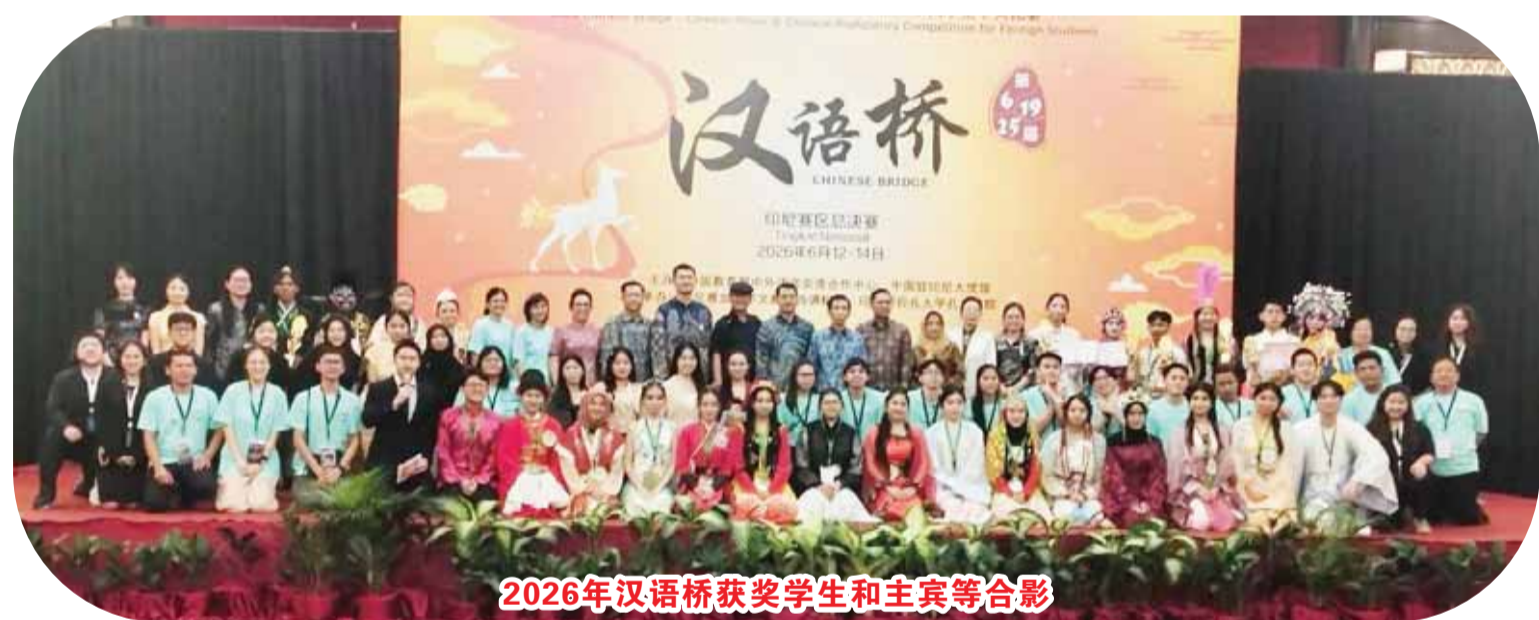
2026年汉语桥获奖学生和主宾等合影

“汉语桥”赛事多年来始终致力于推动国际中文教育的发展，促进印中青年文化交流，已成为印尼一项品牌活动。 据悉：这是第6届“汉语桥”世界小学生中文秀，第19届“汉语桥”世界中学生和第25届“汉语桥”世界大学生中文比赛迎来的总决赛。 本次总决赛汇集了印尼各省选拔出的顶尖中文选手参赛，为大家呈现一场精彩纷呈的语言文化盛宴，增添更多光彩，进一步深化印中两国