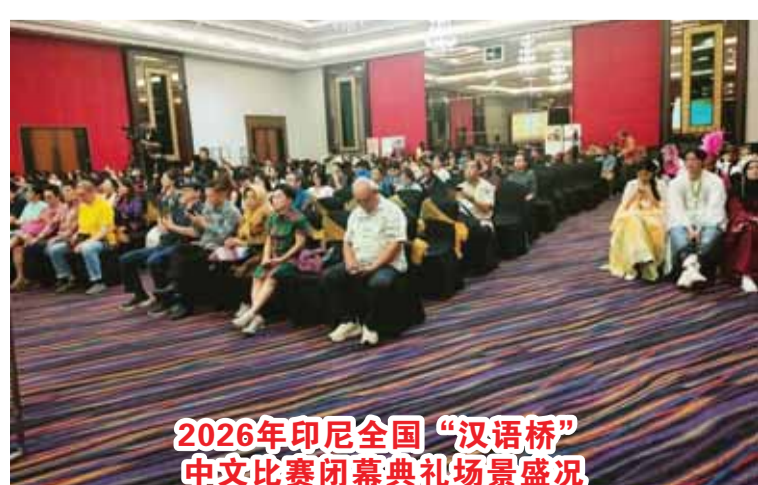
2026年印尼全国“汉语桥”中文比赛闭幕典礼场景盛况

们，多元文化并非隔阂，而是连接世界、促进团结的重要力量。 谨向各位获奖同学表祝贺，有望成为新起点，继续提升自身能力，同时始终保持谦逊和进取之心。 特别对即将参加国际比赛者，仅表更广泛为国家，以文明有礼的品德，开放友善和自信，向世界展现新时代印度尼西亚青年卓越与团结竞争力，相传将引以为豪青年使者。最后，衷心希望“汉语桥”持续挖掘和培养更多优秀人才，在国际舞台为国争光。 也听取中国清华大学Bartlomics Czech博士教授讲中国故事。还有印尼华文协调机构蔡昌杰执行主席及印尼阿拉扎大学孔子学院理事会理事沙菲克教授分别讲话。 也见证了获奖选手的才艺表演及颁发各奖状等，都吸引与会们的观赏。后明年再见！