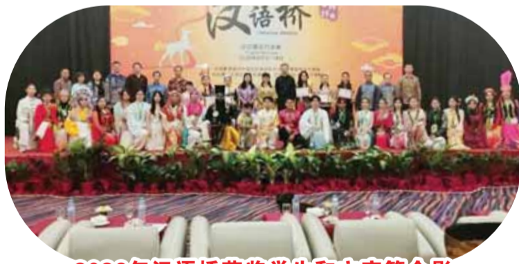
2026年汉语桥获奖学生和主宾等合影

的文化交流与合作。 中国驻印尼全权大使王鲁彤大使致辞讲述：语言是人际沟通与文化传播的仲介与载体，学习中文，使得更了解中国历史过程，从而体验中国时代的文明历程。 “汉语桥”有着印尼文化和教学特色，不仅为语言文化的传递，也体现社交的沟通平台。印中两国虽然地理隔海相距较远，但通过语言可系起两国更具紧密，使搭建更巩固情谊与互信。 印尼2026年“汉语桥”已步入尾声，谨代表中国驻印尼大