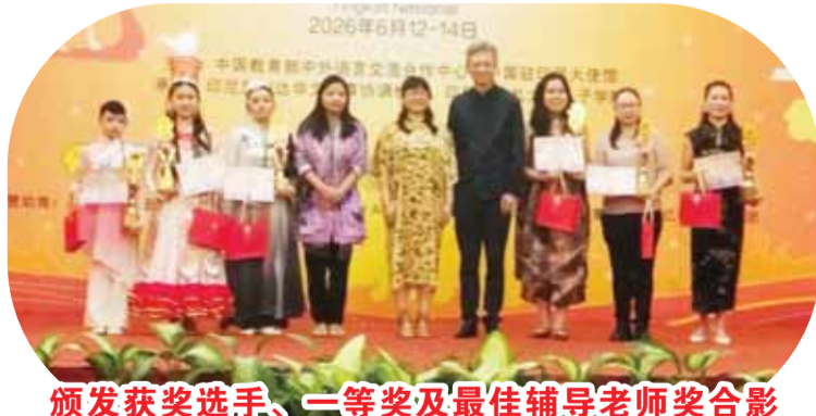
颁发获奖选手、一等奖及最佳辅导老师奖合影