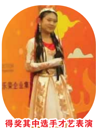
得奖其中选手才艺表演