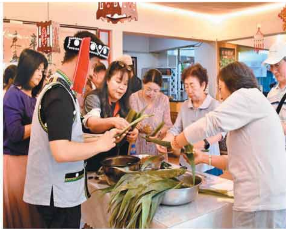
在云南昆明“两岸‘粽’动员，一起嗨端午”活动中，两岸同胞体验包粽子。

“端午节是两岸共同的文化记忆，借着这个契机，两岸同胞像家人一样聚在一起，共同体验传统民俗活动，希望大家开开心心过端午。”在云南昆明举办的“两岸‘粽’动员，一起嗨端午”