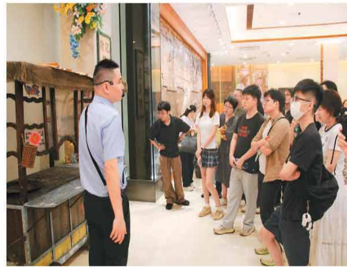
图为台湾学生在广州华侨博物馆参观《给阿嬷的情书》电影道具专题展。

广东省台湾同胞联谊会有关同志表示，未来将持续深耕两岸青年交流领域，推出更多贴合台青需求、兼具文化温度与时代意义的交流活动，吸引更多台湾青年扎根广东、深耕大湾区。