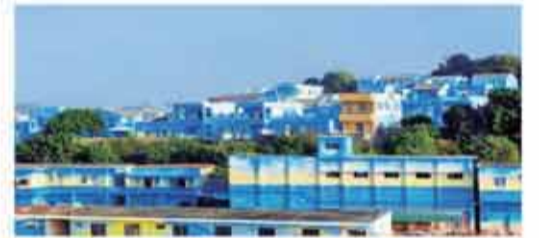
臺山市廣海鎮鯤鵬村。