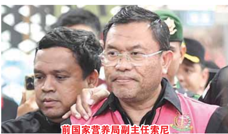
前国家营养局副局长索尼

透露更多涉嫌参与免费营养餐腐败案的人物名单，仅表示，涉案人员来自行政、司法和立法各级机构。不仅如此，克里斯纳指出，索尼提交给调查人员的名单也只是其中一部分，后续名单可能还会增加。总之，来自行政、立法和司法。最多是立法，总人数是26个，可能会增加，这只是其中一部分。此前，国家营养局