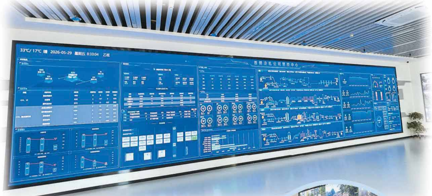
▲首钢冷轧管控中心的大屏幕上，实时显示生产线上的各项数据。

北京首钢冷轧薄板有限公司（简称“首钢冷轧”）用了4年时间，走通了这条智能化之路。近日，本报记者走进首钢冷轧，探访这家钢铁企业的创新转型故事。