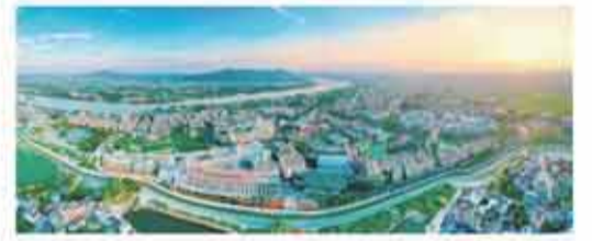
開平市“世遺風韻”鄉村振興示範帶成爲極具地域文化標識度的樣板片區。