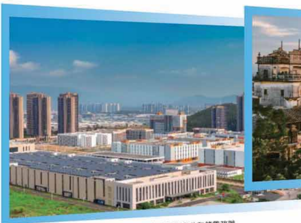
▲ 鶴山工業城園區俯瞰圖。