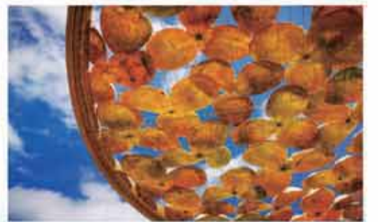
新會陳皮總產值達261億元。