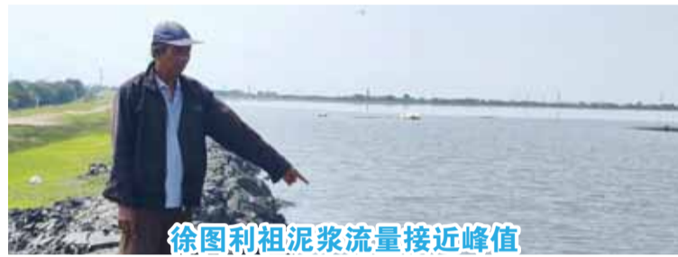
徐图利祖泥浆流量接近峰值

【本报讯】东爪哇省徐图利祖(Sidoarjo)泥浆处理中心在徐图利祖县波龙镇区(Porong)的锡灵乡(Siring)与唐古兰金镇区(Tanggulangin)的凯塔邦乡(Ketapang)交界处加筑了拉平多(Lapindo)泥浆挡土堤。当蓄水池水位和泥浆位上升至堤坝顶部附近后，采取了这一措施。