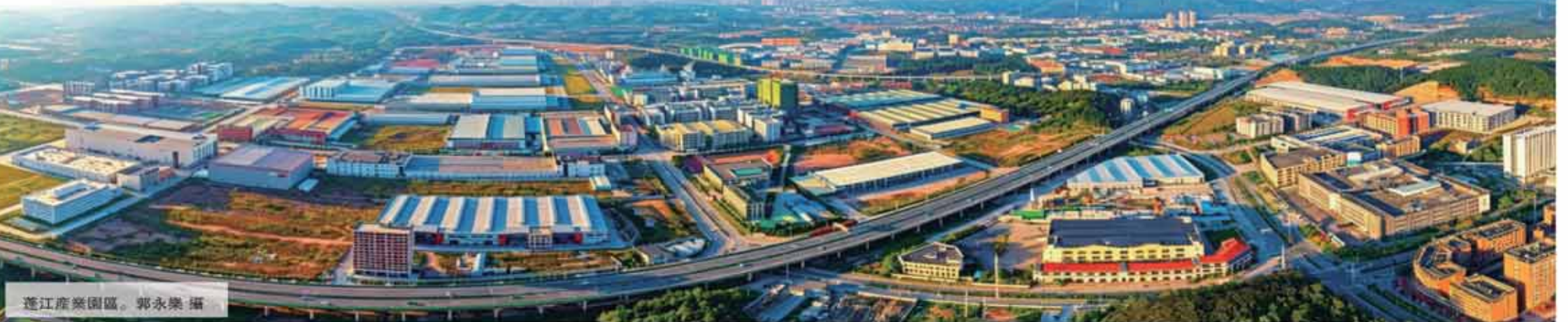
蓬江產業園區。