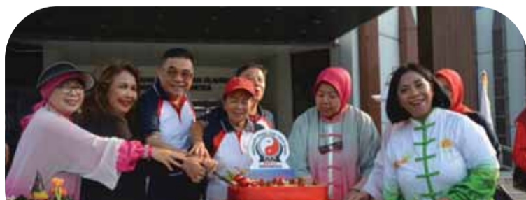
印尼东岳太极拳协会成立16周年庆典切生日蛋糕仪式

活动当天，印尼东岳太极拳协会中央理事会成员、各分会及练功站负责人，以及印尼青年与体育部代表齐聚一堂，共同庆祝协会成立16周年。