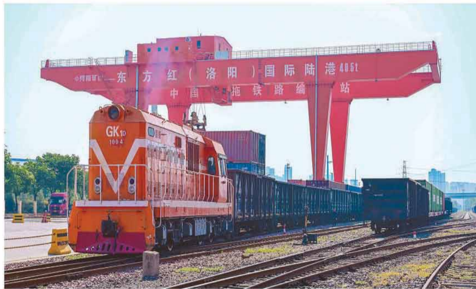
作为服务共建“一带一路”的重要平台，东方红（洛阳）国际陆港依托开行的中欧班列，推动更多产品走向全球。图为东方红（洛阳）国际陆港作业区一角。

近段时间以来，多个国际民调结果显示，中国全球信任度显著上升。在许多国家民众心中，中国是“值得信赖的国家”“可靠的伙伴”。受访专家认为，国际社会对中国的信任度、好感度攀升，源于中国持久的战略定力、清晰的发展规划与卓越的兑现能力。不断积累的信任度、好感度，是中国以实际行动回应世界之问、时代之问的见证。