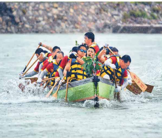
广东珠海“三灶海上龙舟赛”日前在全湾区三灶莲塘湾海域举行，8支参赛队劈波斩浪，共同角逐新一屆“海上龙王”。图为活动现场。

现场同步展出珠三角九市特色档案，从城市建设文书到重大活动影像，一份份独具地域特色的档案，串联起大湾区的坚实发展足迹。