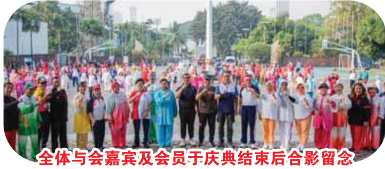
全体与会嘉宾及会员于庆典结束后合影留念

极十六载，同心共筑健康国民”不仅是一句口号，更是协会16年发展历程的真实写照。协会长期以来致力于推广简单易学、强身健体且惠及社会各阶层的太极拳运动。