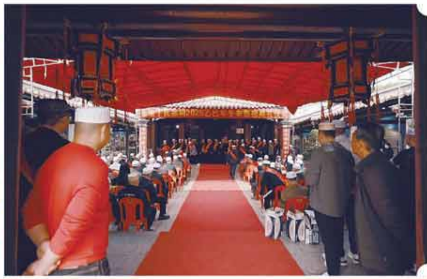
陈埭丁氏族人齐聚宗祠进行冬季祭祖。

年也不曾知晓妻子的家族源自海外。直到1996年，一篇关于泉州“世家坑”墓葬的报道打破了宁静。她拿出娘家的地契，向丈夫揭开了这个隐藏数百年的秘密。