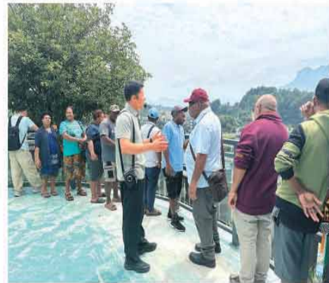
巴布亚新几内亚埃德武村村代表在许家冲村考察现场。

“这里非常现代化”“这里每个人都对村庄建设贡献力量”“我想把这种治理服务模式带回我们的村庄”……近日，湖北省宜昌市夷陵区太平溪镇许家冲村迎来了一批远道而来的客人——巴布亚新几内亚驻华大使塔德乌斯·坎巴内和巴布亚新几内亚埃德武村村民。他们在许家冲村边走边看、边听边问，深入了解移民安置、乡村治理、特色产业等发展等情况，还找到了不少“可以带回去的经验”。