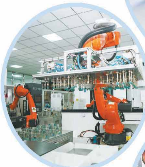
▲在智能质检中心，机械手臂自动作业。