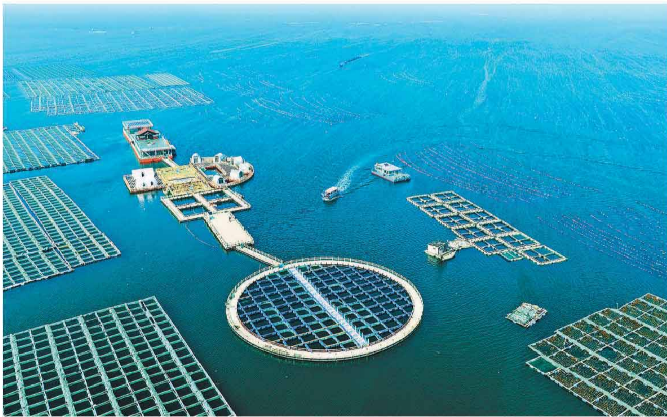
近年来，山东省荣成市依托得天独厚的资源优势，引导渔民大力发展休闲渔业，培植国家级海洋牧场示范区、休闲渔业示范区和休闲渔业示范基地，促进了渔业增效、渔民增收。