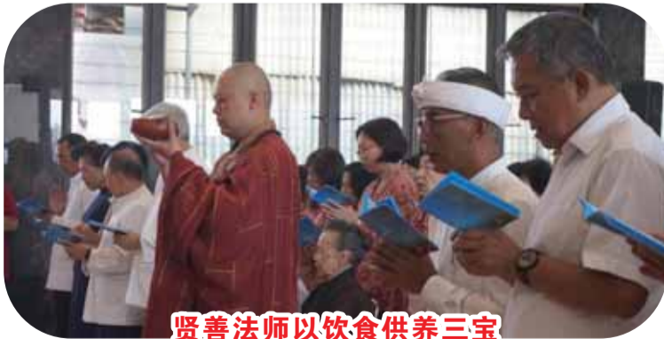
贤善法师以饮食供养三宝