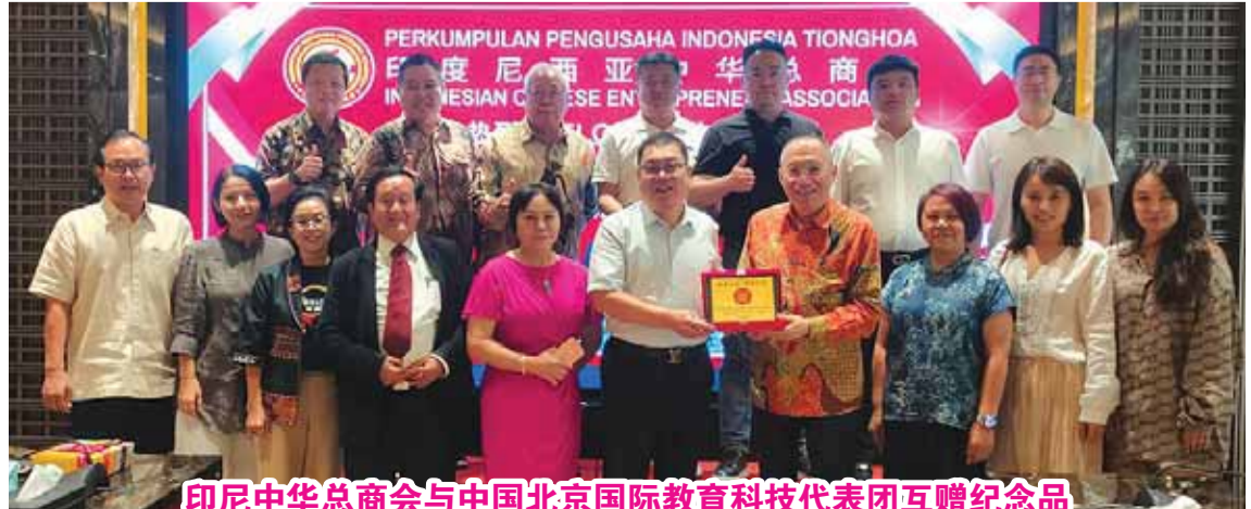
印尼中华总商会与中国北京国际教育科技有限公司互赠纪念品