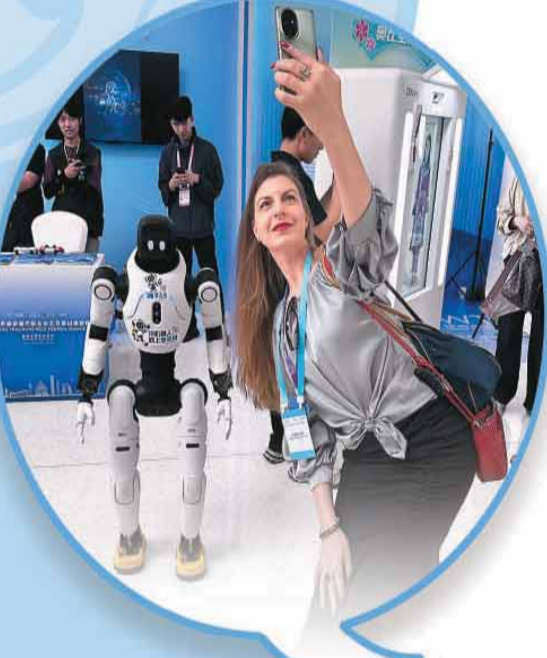
▲在中关村国际创新中心，与会嘉宾与人形机器人合影。