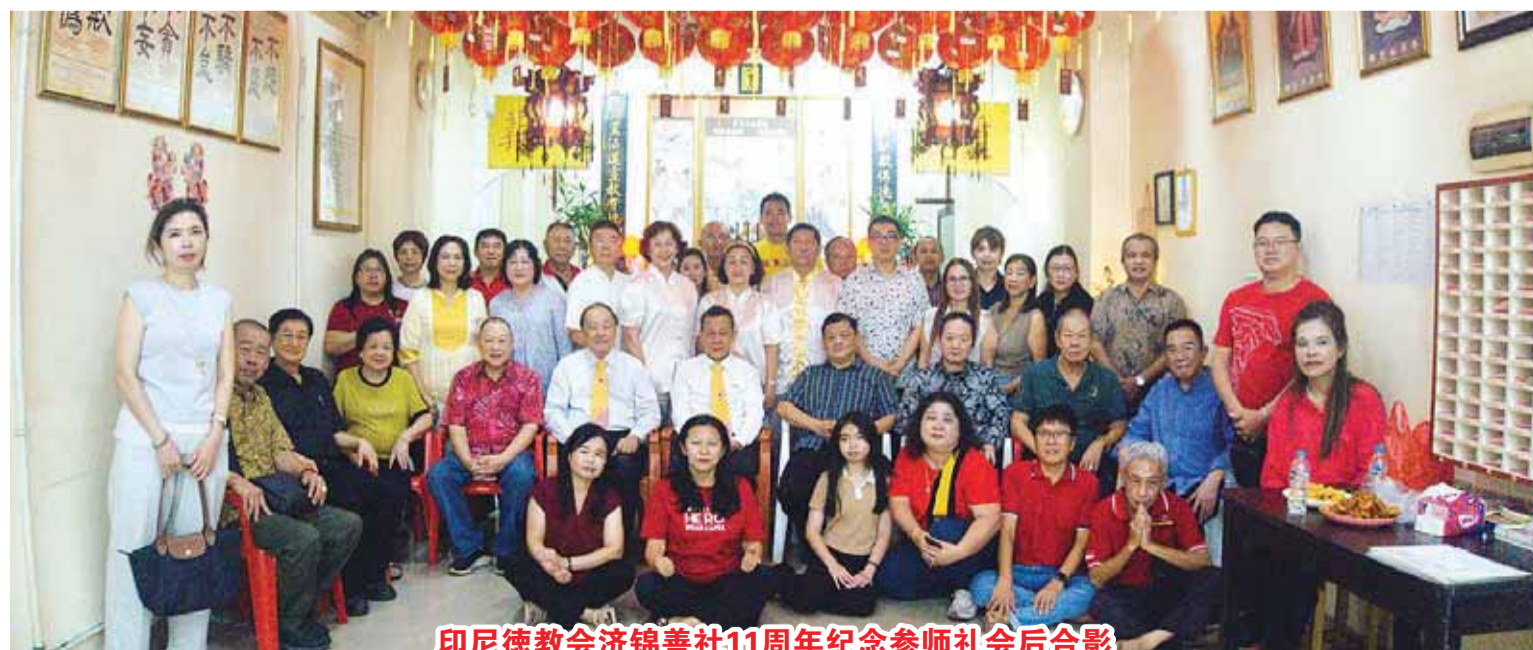
印尼德教会济锦善社11周年纪念参师礼会后合影

【本报讯】印尼雅加达德教会济锦善社座落雅京北区Pluit Karang Sari 15街D7东区105号会所，于6月7日举行例常公益活动。这次捐血活动是