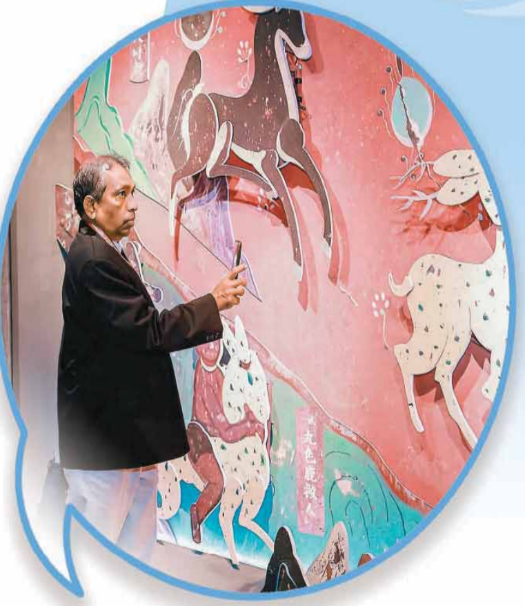
▲与会嘉宾在王府井艺云数字艺术中心参观。