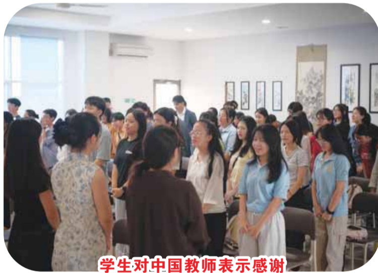
学生对中国教师表示感谢