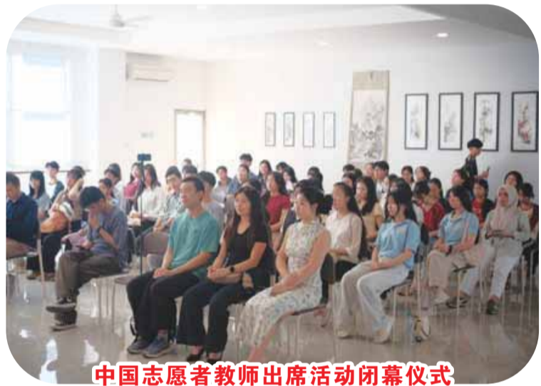
中国志愿者教师出席活动闭幕仪式