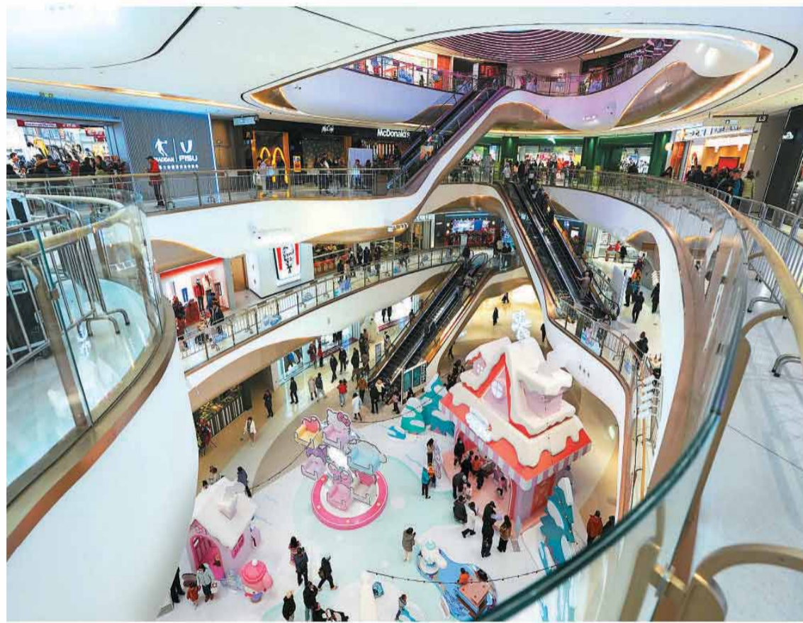
项目紧邻北京环球度假区，于去年底正式营业，为助力北京国际消费中心城市注入新动能。

在外贸重镇广东省广州市，今年4月15日至5月5日举办的第139届广交会也为当地拉动入境消费提供契机，让境外采购商享受