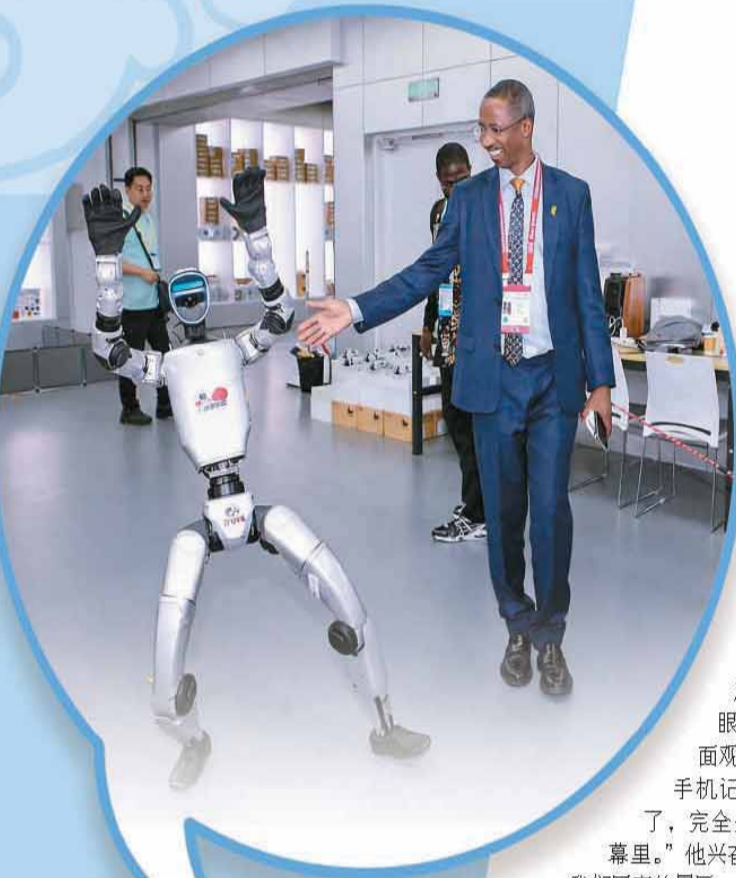
▲在北京坊数字综合体瑞境空间，与会嘉宾与机器人舞者互动。

“地方政府是非民间交流落地的关键载体，也是落实非中合作各项部署的重要抓手。”哈吉·萨尔·费耶说，“非洲城市可借鉴中国在城市规划、基础设施建设、数字化转型、产业升级等领域的成熟经验，推动城市可持续发展。”