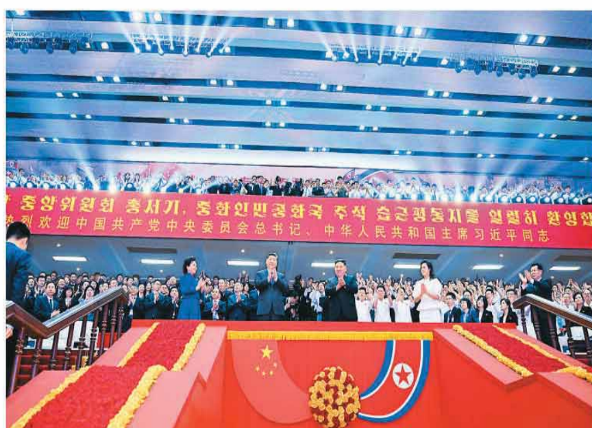
当地时间6月8日晚,中共中央总书记、国家主席习近平和夫人彭丽媛在朝鲜劳动党总书记、国务委员长金正恩和夫人李雪莹陪同下,在平壤体育馆同朝鲜各界群众一道观看专场文艺演出。