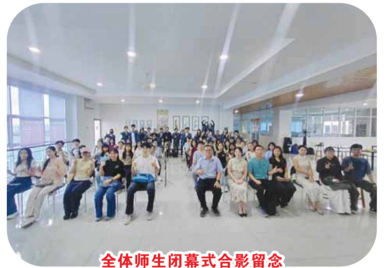
全体师生闭幕式合影留念