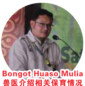
Bongot Huaso Mulia 兽医介绍相关保育情况