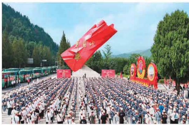
井冈山红旗广场上举行思政实践课。

井冈山革命博物馆第三展厅的一处展柜中，柔和的灯光落在《中国的红色政权为什么能够存在？》《井冈山的斗争》两本小册子上，吸引观众俯身细看。