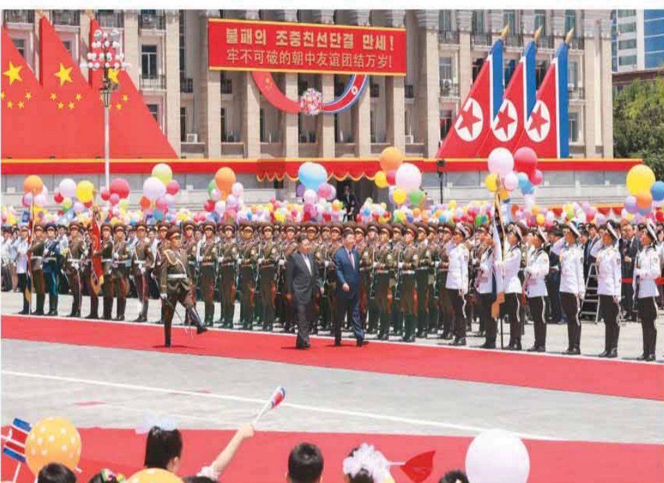
当地时间6月8日中午,朝鲜劳动党总书记、国务委员长金正恩在平壤金日成广场为中共中央总书记、国家主席习近平举行盛大欢迎仪式。这是习近平在金正恩陪同下,检阅朝鲜人民军三军仪仗队。