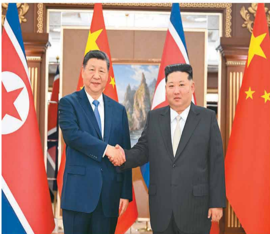
当地时间6月8日下午,中共中央总书记、国家主席习近平在平壤锦绣山迎宾馆同朝鲜劳动党总书记、国务委员长金正恩举行会谈。