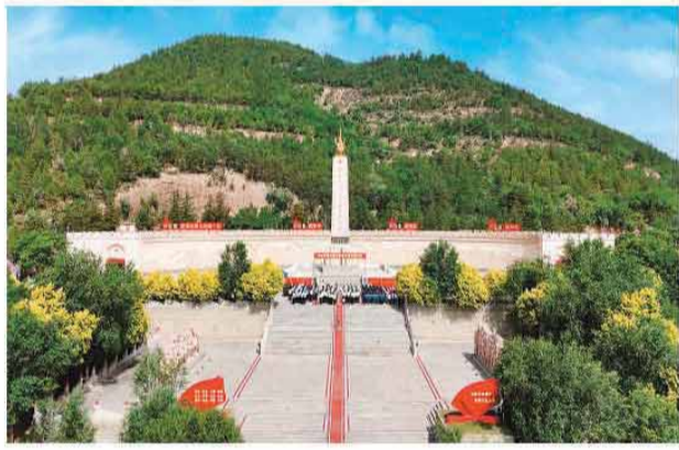
外景。中央红军长征胜利纪念馆。

陕北黄土高原，阳光洒在中央红军长征胜利纪念馆的墙面上。纪念馆展厅里，人潮涌动。展柜中，磨穿的草鞋、锈迹斑斑的马灯、泛黄的行军文件等，静静地诉说着历史。