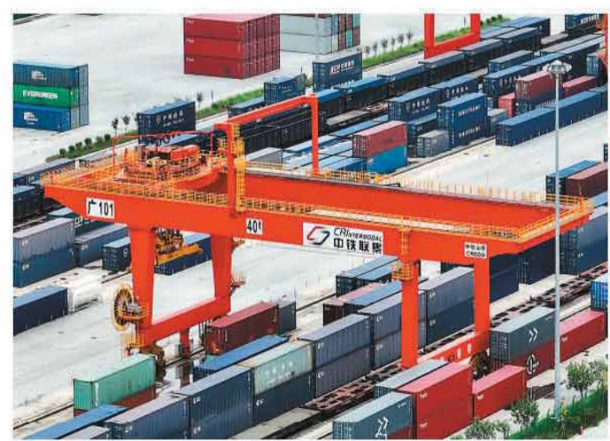
广州国际港门吊有序作业，集装箱规范码放，保障粤港澳大湾区国际班列顺畅运行。

国际班列还直接带动了沿线就业。增城西站周边，物流园、仓储区、加工车间陆续建起，不少村民实现了家门口就业。从叉车司机到调度员，从报关员到装卸工，班列的开行串联起一条就业链。近日在广州国际港，一批满载家用电器、智能家居的班列驶向欧洲，这些货物大多来自中小企业。班列越跑越快，物流成本越低，中小企业的国际贸易门槛就越低，消费者的选择就越丰富。