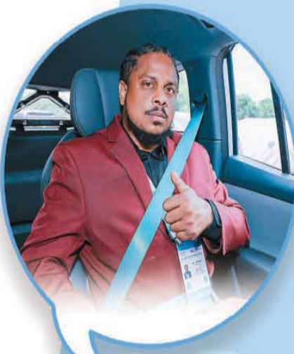
▲与会嘉宾体验萝卜快跑无人驾驶汽车。