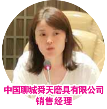
中国聊城舜天磨具有限公司 销售经理