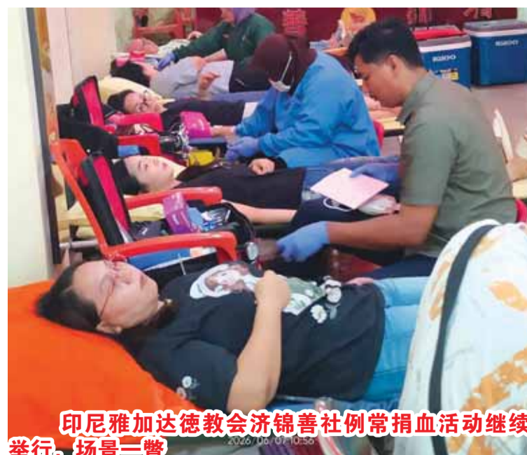
印尼雅加达德教会济锦善社例常捐血活动继续举行，场景三瞥

活动，还有其他善举繁多；捐赠义肢、赈灾、沿途颁发日常用品；每出动约15辆卡车，各赴预定区域沿路分发等等。最近举行11周年诞