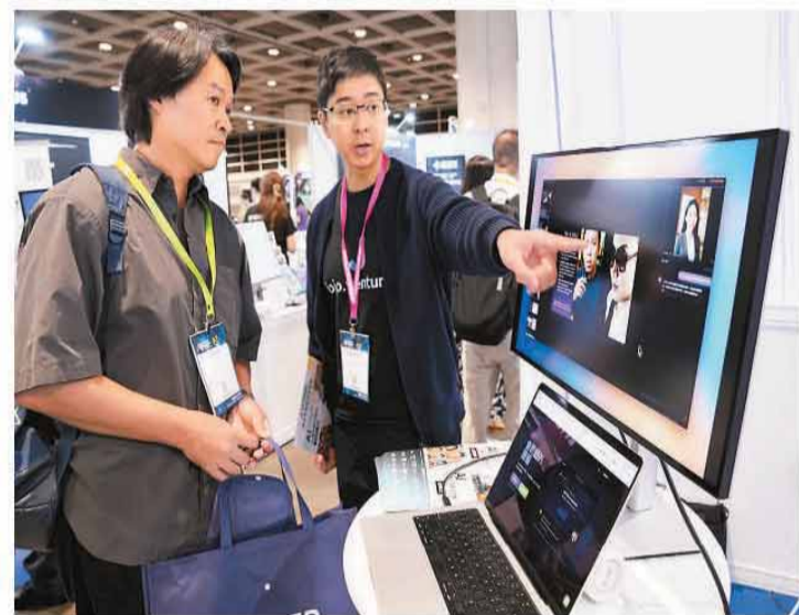
第六届人工智能应用展览及论坛“AI+Power2026”近日在港举行，近100家AI方案供应商携智慧办公、企业自动化及AI驱动协作等领域的AI解决方案亮相。图为展览现场。

陈茂波表示，今年将拨款3亿港元推动优化版“数码转型支援先导计划”，重点扶持中小企业利用市场现成的AI及网络安全数码方案，协助其预测消费趋势、优化市场推广、推动日常运作自动化等。