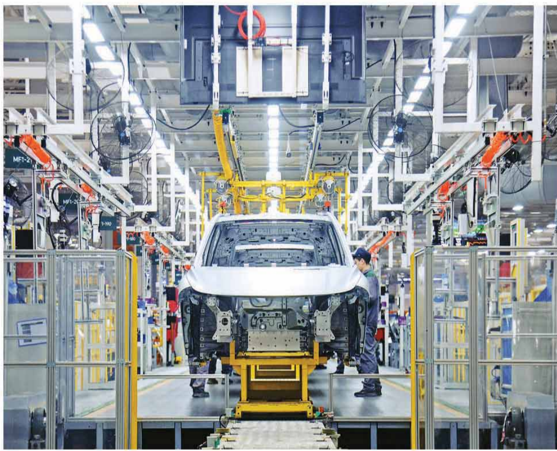
近日，在江苏省常州市武进区，一家车企的智能制造基地内，工人正在生产新能源汽车。

目前，市场上也出现了“越重越高端、越重折扣越少”的现象。根据“新能源车配置数据库”的统计，车型整备质量每增加1吨，指