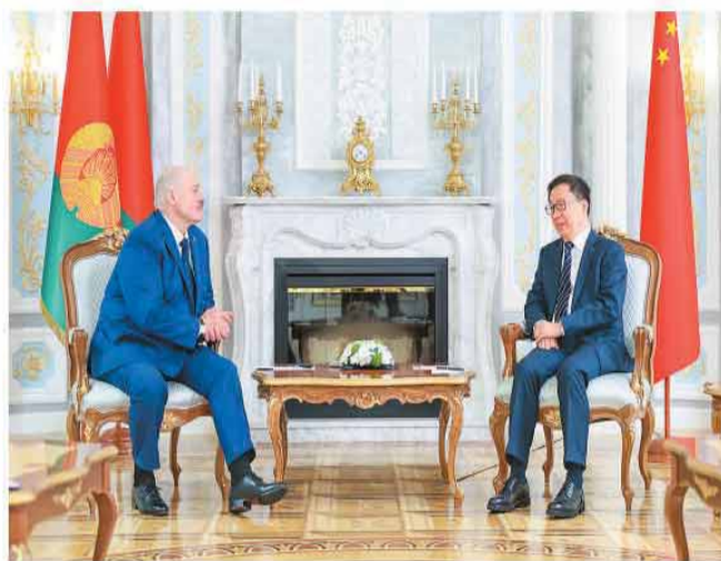
当地时间6月6日至8日，应白俄罗斯共和国政府邀请，国家副主席韩正访问白俄罗斯。这是6月8日，韩正在明斯克会见白俄罗斯总统卢卡申科。