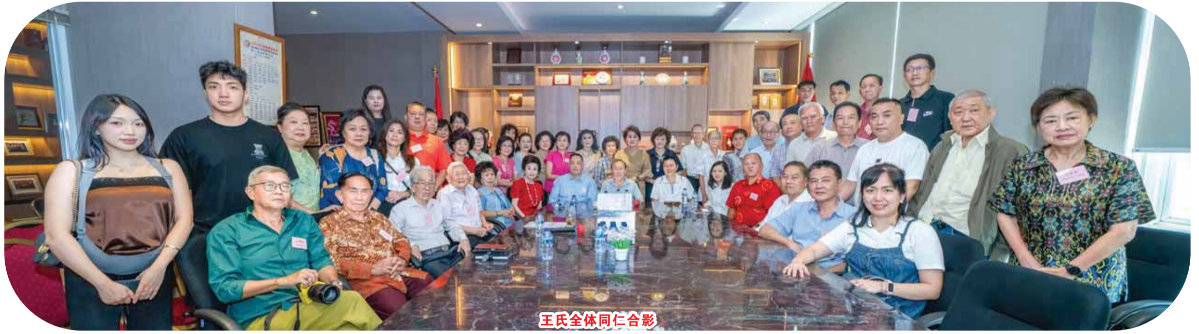
王氏全体同仁合影