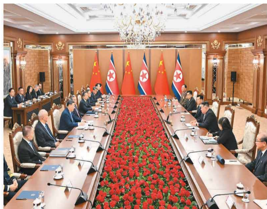
当地时间6月8日下午,中共中央总书记、国家主席习近平在平壤锦绣山迎宾馆同朝鲜劳动党总书记、国务委员长金正恩举行会谈。