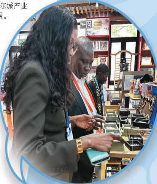
▲与会嘉宾在北京坊“北京礼物”集合店参观。