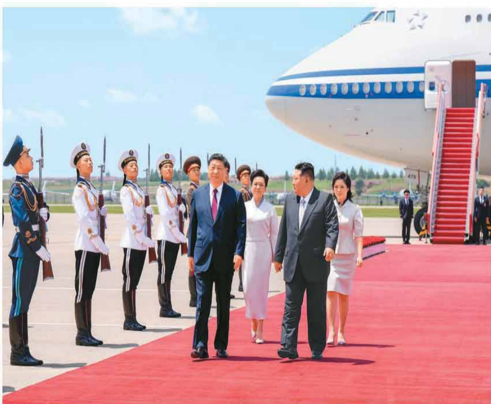
6月8日中午,中共中央总书记、国家主席习近平乘专机抵达平壤,开始对朝鲜进行国事访问。朝鲜劳动党总书记、国务委员长金正恩和夫人李雪莹到机场迎接习近平和夫人彭丽媛。