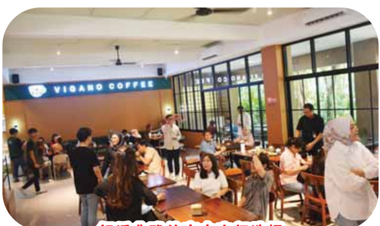
舒适典雅的室内空间选择