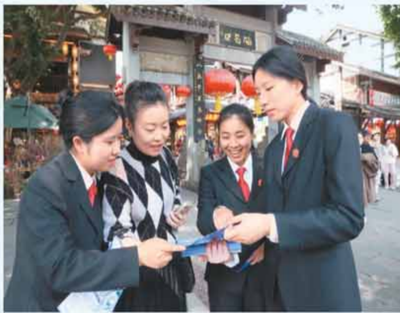
重庆市沙坪坝区磁器口古镇，法官向市民发放宣传资料、现场答疑、讲解消费维权知识。