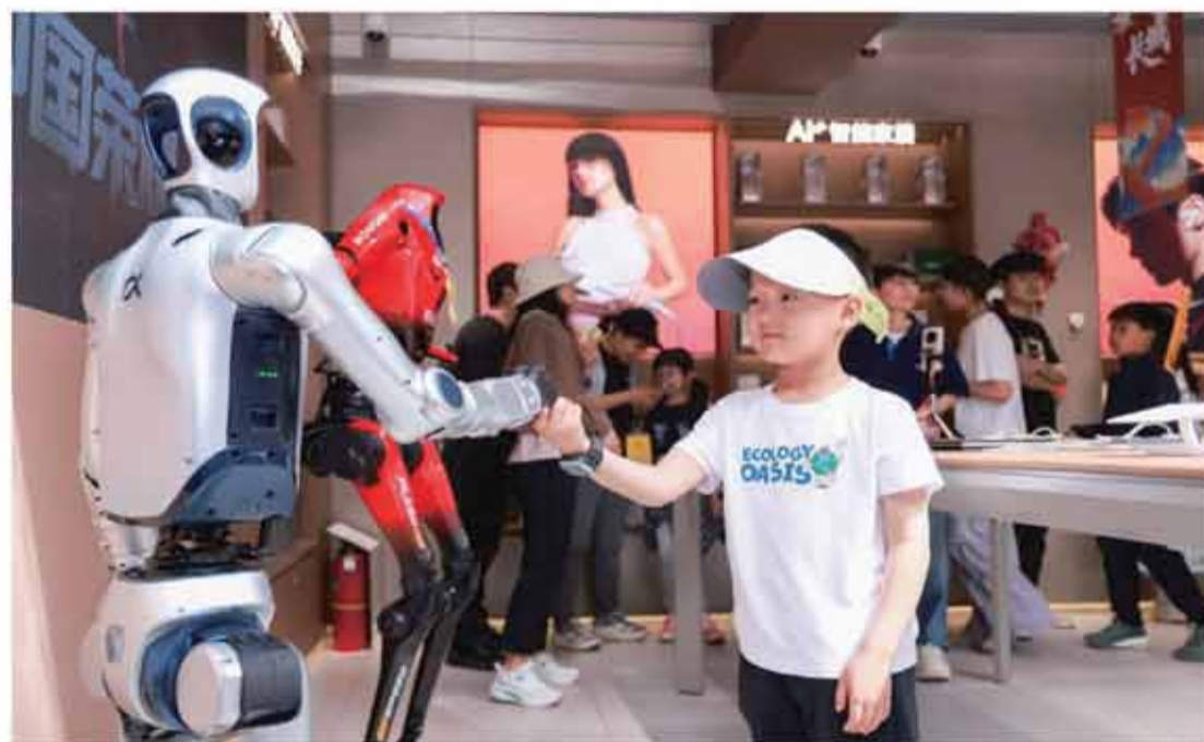
“元氣仔”現身線下門店，化身智能購物小助手。

【本報訊】“五一”假期，一群特殊的“打工人”悄悄地“卷”起來了。前不久那個在北京亦莊半程馬拉松賽上一騎絕塵的紅色身影——榮耀“閃電”機器人，化身“打工人”，成為深圳、廣州、成都、北京等城市核心榮耀門店裡，最吸睛的“賽博店員”。機器人還“卷”起了情緒價值。會跳舞、會比心、會說話，在半馬賽場上“最佳步態獎”得主榮耀“元氣仔”，化身智能購物小助手，出現在榮耀線下門店，給消費者帶來新的科技生活體驗。總部位於深圳的跨維智能也在“五一”期間宣布，自研具身智能大賦能的機器人商業服務小站正式進駐徐州方特樂園、深圳龍崗區、深圳K11購物藝術中心、桂林象山景區、陽朔西街等地，十餘家門店同步開業。如在深圳龍崗店，這些機器人可以為客人提供咖啡、精釀啤酒、霜淇淋、爆米花等多品類消費服務，在深圳K11購物藝術中心店，機器人主打現制咖啡智能服務，以智能體驗匹配高端商圍消費需求。不僅如此，這個假期，全球首家機器人6S店打造了首屆機器人勞動節，讓機器人擁有屬於自己的節日，讓未來生活提