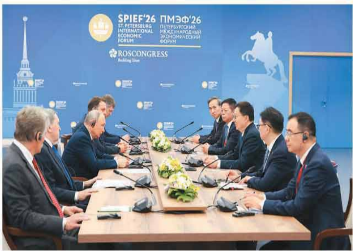
当地时间6月5日，国家副主席韩正在圣彼得堡会见俄罗斯总统普京。

新华社圣彼得堡6月5日电（记者胡晓光、王昭）当地时间2026年6月5日，国家副主席韩正在圣彼得堡会见俄罗斯总统普京。