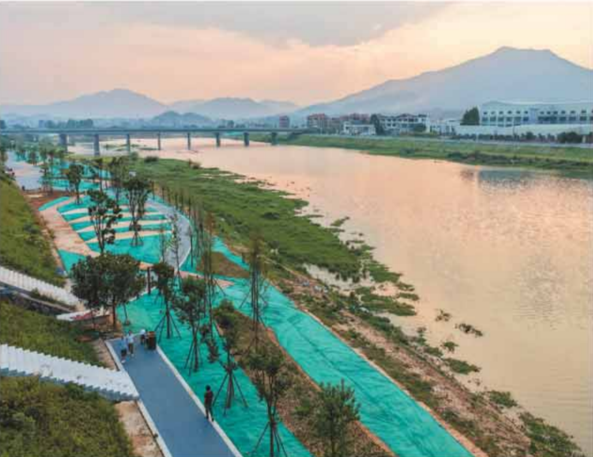
近日在福建省南安市洪厝镇，晋江防洪提升工程南安洪厝段建设进入收尾攻坚阶段。在筑牢水安全屏障的同时，盘活滨水空间赋能乡村产业，走出防洪保安、生态提质、富民兴村的协同发展之路。