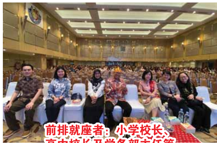
前排就座者：小学校长、高中校长及学务部主任等