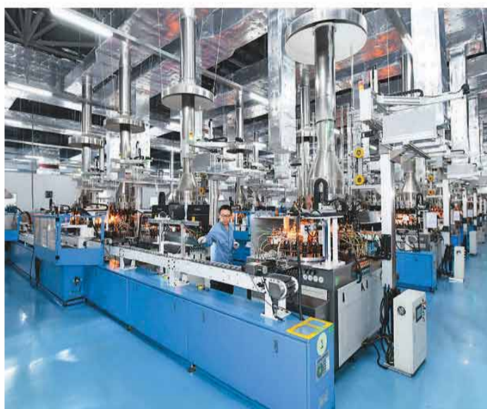
近年来，河北省沧州市以产业集群化、高端化、数字化为方向，发展壮大特色县域经济，培育出绿色铸造、医药包装材料、包装机械设备等48个特色产业集群。图为工人在沧州高新技术产业开发区一家医药包装材料生产企业的车间内工作。新华社记者 杨世尧摄

作为中欧班列“东通道”的重要节点，满洲里铁路口岸运行持续向好。截至目前，该口岸累计完成进出口货运量967.87万吨，同比增长1.2%，创历史新高。绥芬河铁路口岸充分发挥通道枢纽作用，通过优化班列作业流程，全力压缩车辆周转时长，不断提升国际物流大通道的保障能力。同江铁路口岸提升作业计划精度，提高口岸运输效率，实现中欧班列“快装快卸、优进优出”。