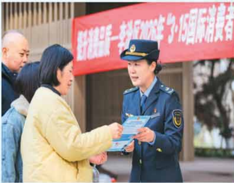
山东省青岛市李沧区，市场监管管理局工作人员为市民普及各类消费维权知识。

尤其是事前防范，消费者要选择正规平台和商家，查看资质证照，仔细阅读合同条款，不轻信口头承诺，同时关注商品评价和投诉记录，避开高风险商家。”朱龙意建议。