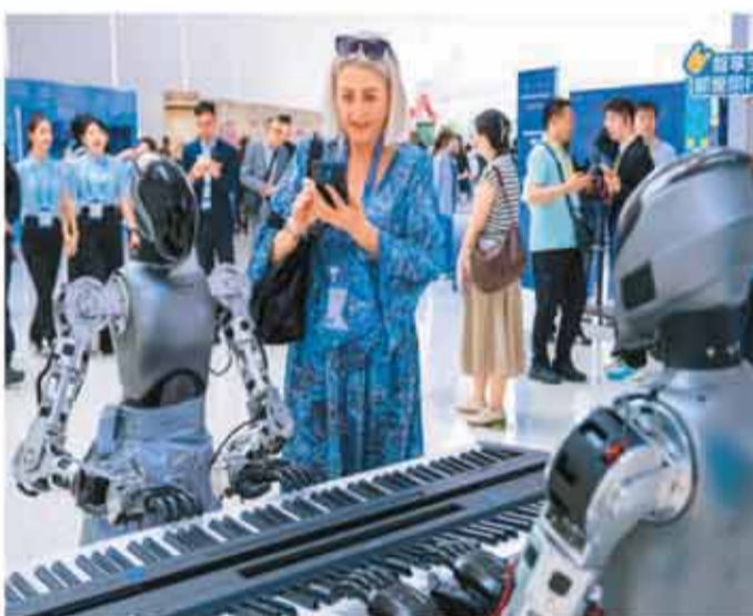
灵心巧手·灵心乐团机器人乐队在会场表演，仿生灵心巧手完成四手联弹，引来嘉宾欣赏拍照。

控制、酒店AI助理，数智居住环境为游客打造“智能住宿”体验；智能伴游、3D导览、游览深度定制，带领游客“智慧游览”；机器人乐队、机器人舞团，为游客奉上精彩的“科技汇演”；数字艺术体验、光科技互动、SoReal科幻乐园和亮马河国际风情水岸游船，带来光影视听的“沉浸体验”；智能导览、智能画布，实时生成全息影像，借助智能科技实现创意无限的“智能创作”；机器人厨师、数智化后厨，加上全城美食智能导航，打造“智享美食”生活场景；无