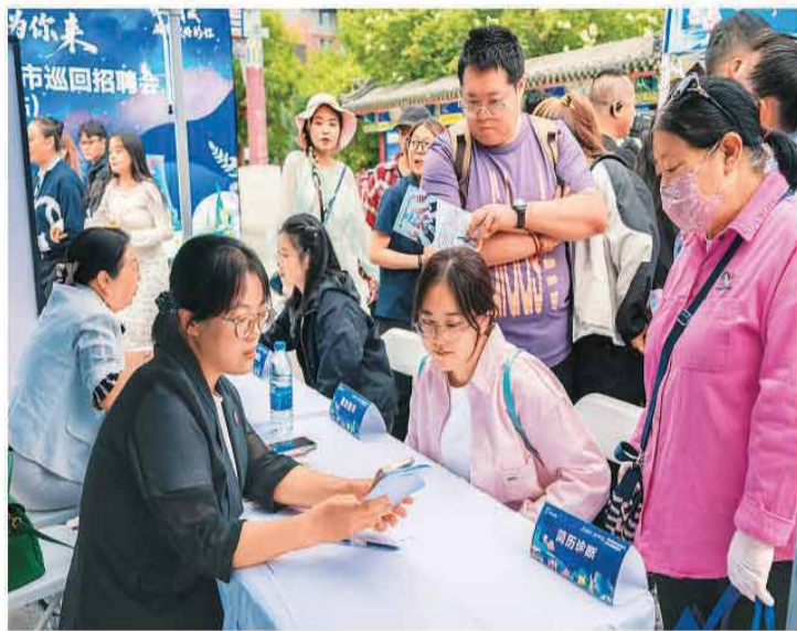
在内蒙古自治区呼和浩特市2026年高校毕业生系列巡回招聘活动现场，工作人员为求职者提供简历诊断服务。

例如，安徽围绕新兴产业发展需求，推动重点企业、产业园区及行业协会联动，动态更新新能源汽车、新材料、高端装备制造等产业人才需求清单。重庆聚焦智能网联新能源汽车、数字经济、低空经济、先进材料