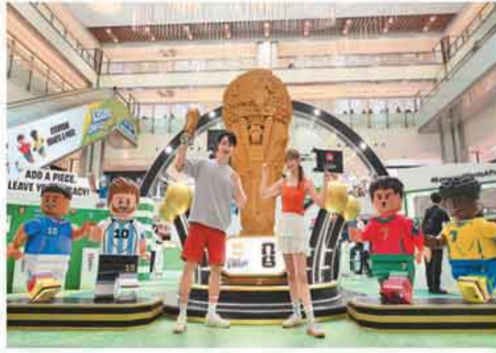
在国际足联世界杯即将到来之际，香港沙田一家商场举办活动，展示以15万块乐高积木，拼出3米高的世界杯奖杯“大力神杯”，现场还设有多个体验区，供民众参与足球互动、拍照“打卡”。图为活动现场。

据介绍，本届赛事还配套开展“寻根嘉庚故里”两岸青年参访、同期举办第二十一届集美（端午）诗会等活动。“嘉庚杯”“歌贤杯”海峡两岸龙舟赛于2006年创办，已成长为标志性文化体育盛会。本届赛事由国家体育总局社会体育指导中心、中国龙舟协会、政协厦门市委员会、厦门市海外联谊会、厦门市集美区人民政府主办。