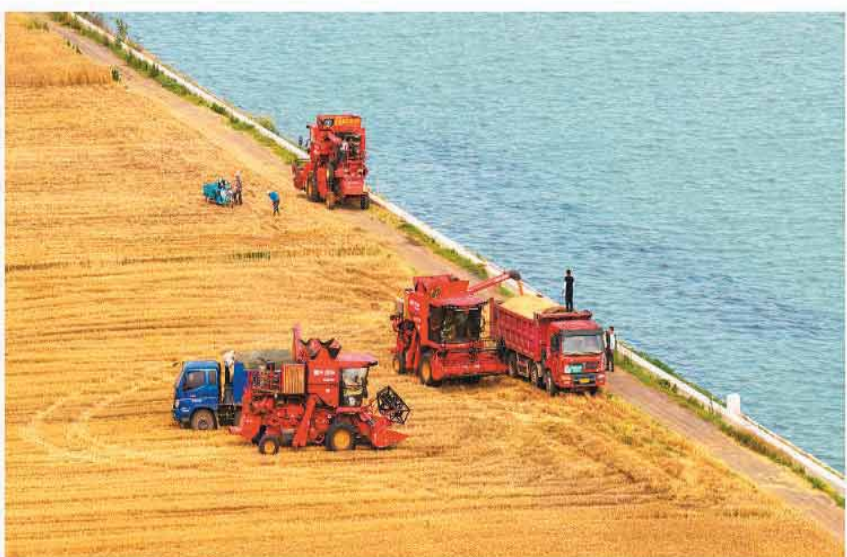
近日,山东省枣庄市小麦进入集中收获期,在峰城区古邵镇京杭大运河两岸的麦田里,多台联合收割机抢抓晴好天气,开展机收作业,确保颗粒归仓。