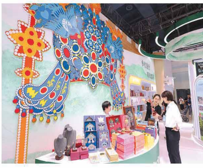
6月5日至7日，2026北京国际文旅消费博览会在北京国家会议中心二期举行。本届博览会设置专业交易展、特色主题展、大众体验展，促进全球文旅资源链接。图为工作人员在博览会上介绍文创产品。

《方案》从统筹空间布局、扩大覆盖范围、聚焦重点突破、推动业态升级、推动服务升级、推动管理升级、加强要素保障等方面提出了21项措施。海南将实施清单管理，指导各市县建立健全一刻钟便民生活圈建设管理清单，精准诊断居民需求与供给短板，形成业态配置清单和发展指引，全面补齐“一店一早”“一菜一修”“一老一小”“一收一洗”等业态，推动标准化、智能化改造升级。