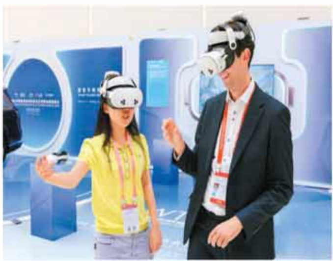
嘉宾通过水晶石·VR混合现实设备，体验北京三山五园的历史场景。