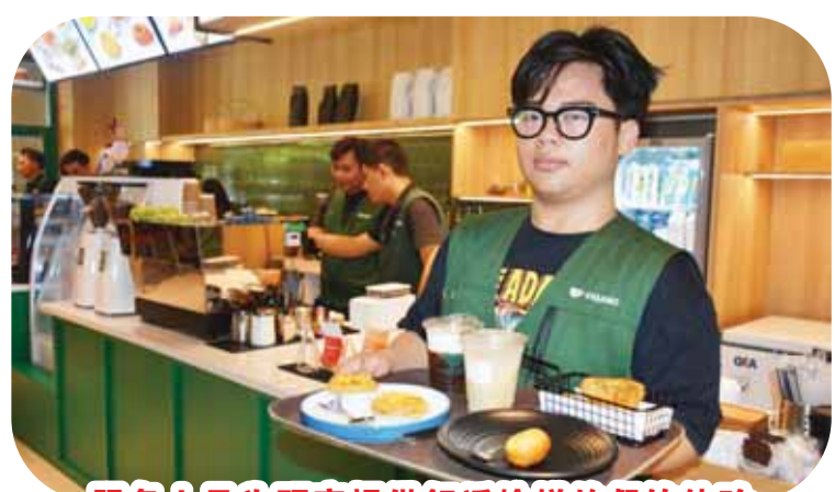
服务人员为顾客提供舒适愉悦的餐饮体验