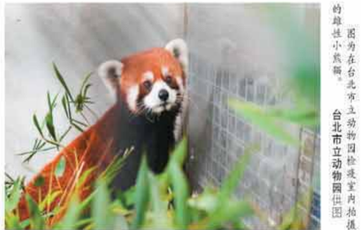
图为在台北市立动物园检疫室内拍摄的雌性小熊猫。

本报台北6月7日电（记者任成琦）由上海动物园赠送台北市立动物园的两只小熊猫，6日凌晨抵达台北。