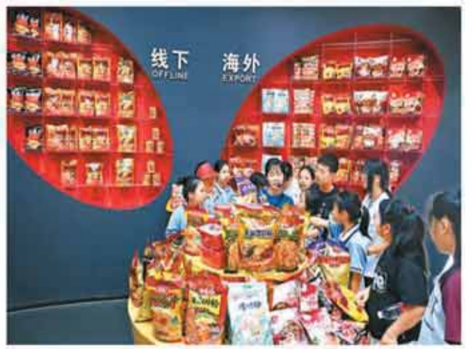
在广西柳州螺蛳粉产业园，来自南宁市宾阳县宾州第四小学的学生在螺蛳王螺蛳粉公司参观多款产品。

柳州市现有工业旅游示范点14个，其中国家工业旅游示范基地2家、国家4A级工业旅游景区8家，覆盖汽车、日化、食品加工等多个行业。柳州市文化广电和旅游局有关负责人表示，“十五五”期间，柳州市将持续打造工业旅游新场景，推动“工业+文旅”深度融合。