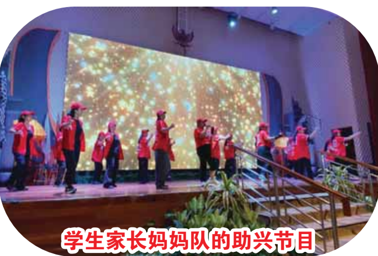
学生家长妈妈队的助兴节目