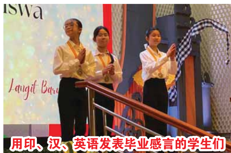
用印、汉、英语发表毕业感言的学生们