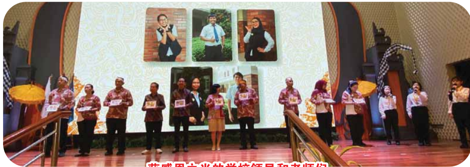
获感恩之光的学校领导和老师们