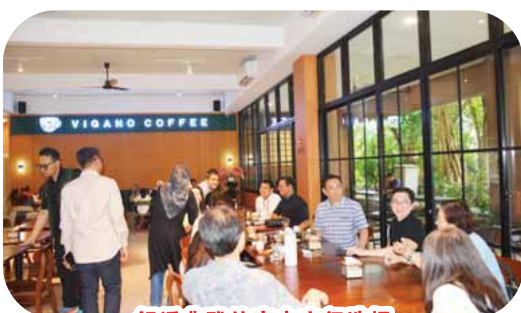
舒适典雅的室内空间选择