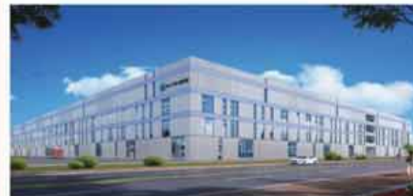
建滔（開平）新一代信息技術產業園項目效果圖。