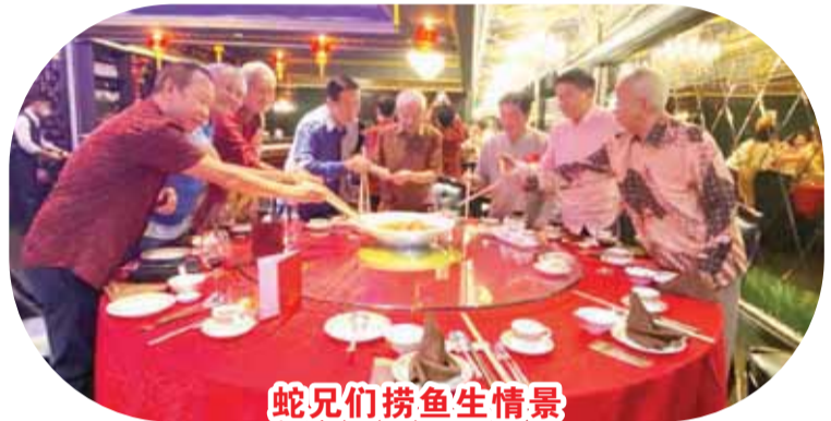
蛇兄们捞鱼生情景