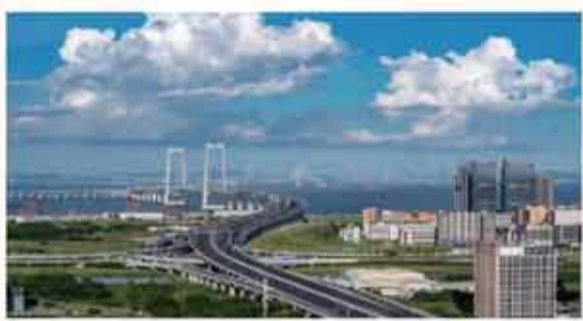
深中通道。

嶺南春早，潮涌灣區。 “十五五”開局啓新程，江門以粵港澳大灣區重要節點城市、中國著名僑都的站位與擔當，鑄定目標、起而行之，向全市發出“展現新作為、幹出新業績、創造新輝煌”的動員令，以區位好、產業好、園區好、服務好、生態好的鮮明優勢，積極融入大灣區一體化發展，一座通江達海、實業興旺、平臺堅實、服務優質、宜居宜業的現代化之城，正成為八方客商投資興業、安居樂業的灣區熱土。