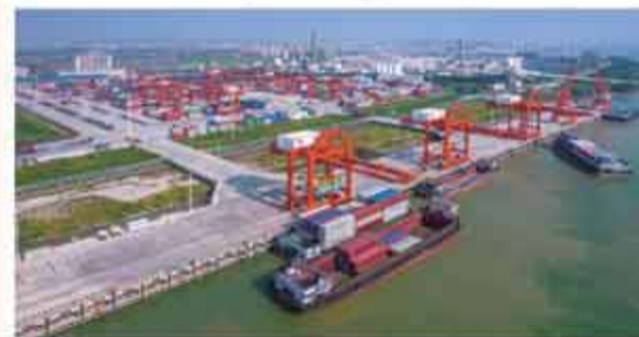
江門高新港。