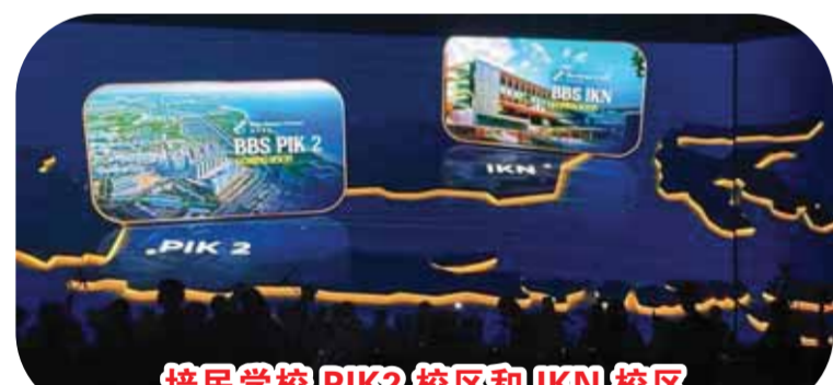
培民学校 PIK2 校区和 IKN 校区