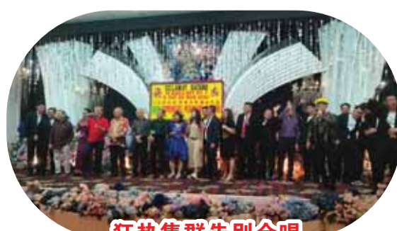
狂热集群告别合唱