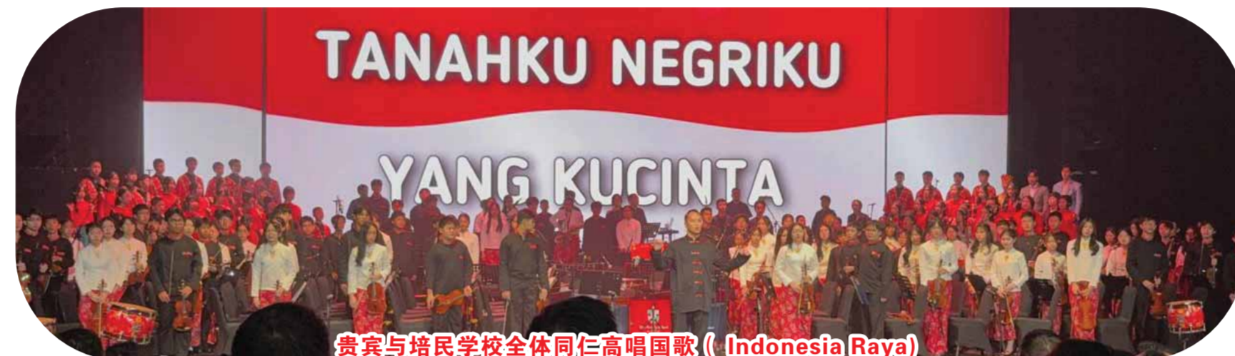
贵宾与培民学校全体同仁高唱国歌 (Indonesia Raya)

以及每一位学子。他阐释“星光传承”的真谛：星光不为耀己，而是在黑暗中为他人指引方向。这亦是培民的核心使命——不仅培育学术