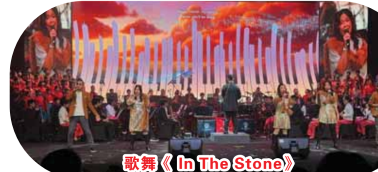
歌舞《In The Stone》