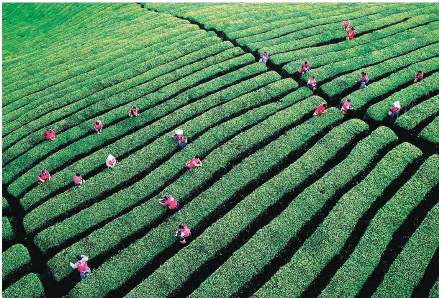
又是一年春茶季,全国各地的茶农陆续开启春茶采摘。图为近日在四川省泸州市纳溪区打古镇普照山茶园,采茶工人正忙着采摘春茶。

香港正以前所未有的决心和速度,驶向绿色航运的深蓝海域。这不仅是对国家“双碳”战略的积极响应,更是香港巩固提升国际航运中心地位、实现高质量发展的必由之路。