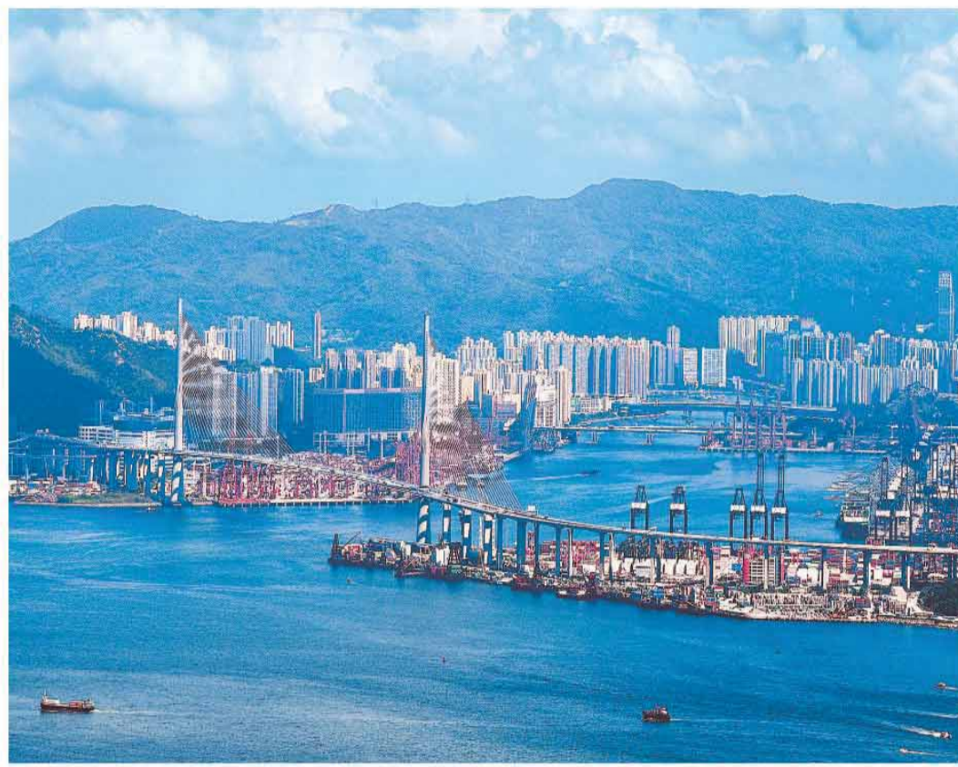
图为香港货柜码头。

《绿色船用燃料加注行动纲领》确立了五个策略方向和十项具体行动,设定了明确的阶段性目标:到