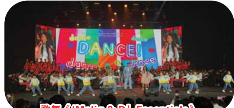
歌舞《(Maliq & D' Essentials)》