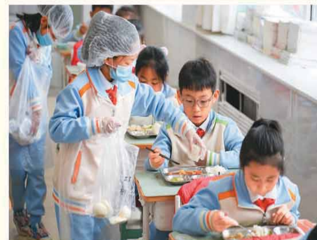
右图：首都师范大学附属小学某班分餐员分发馒头。