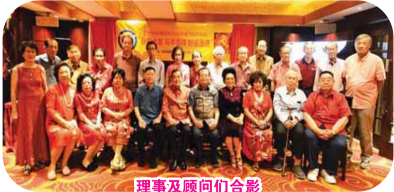
理事及顾问们合影