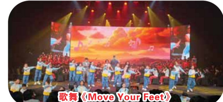
歌舞《Move Your Feet》