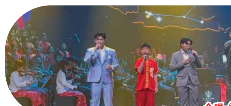
合唱《Go The Distance》