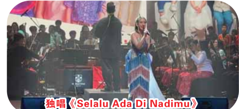
独唱《Selalu Ada Di Nadimu》