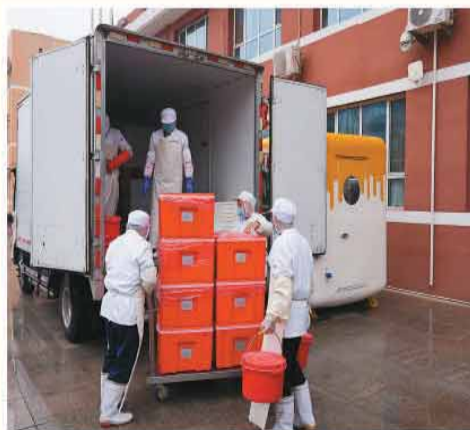
上图：首都师范大学附属小学工作人员将食堂做好的饭菜装车，准备送往该校初明校区。