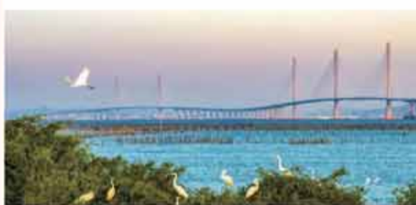
黃茅海跨海通道。