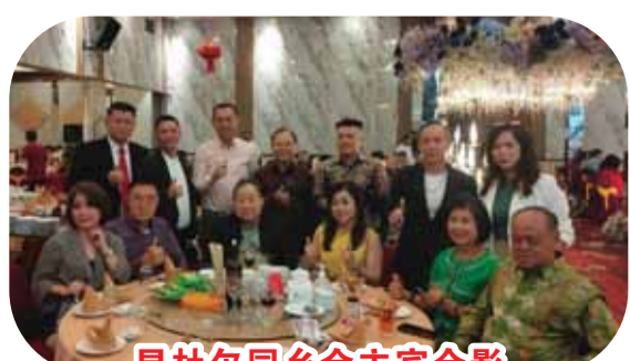
昆杜尔同乡会主宾合影