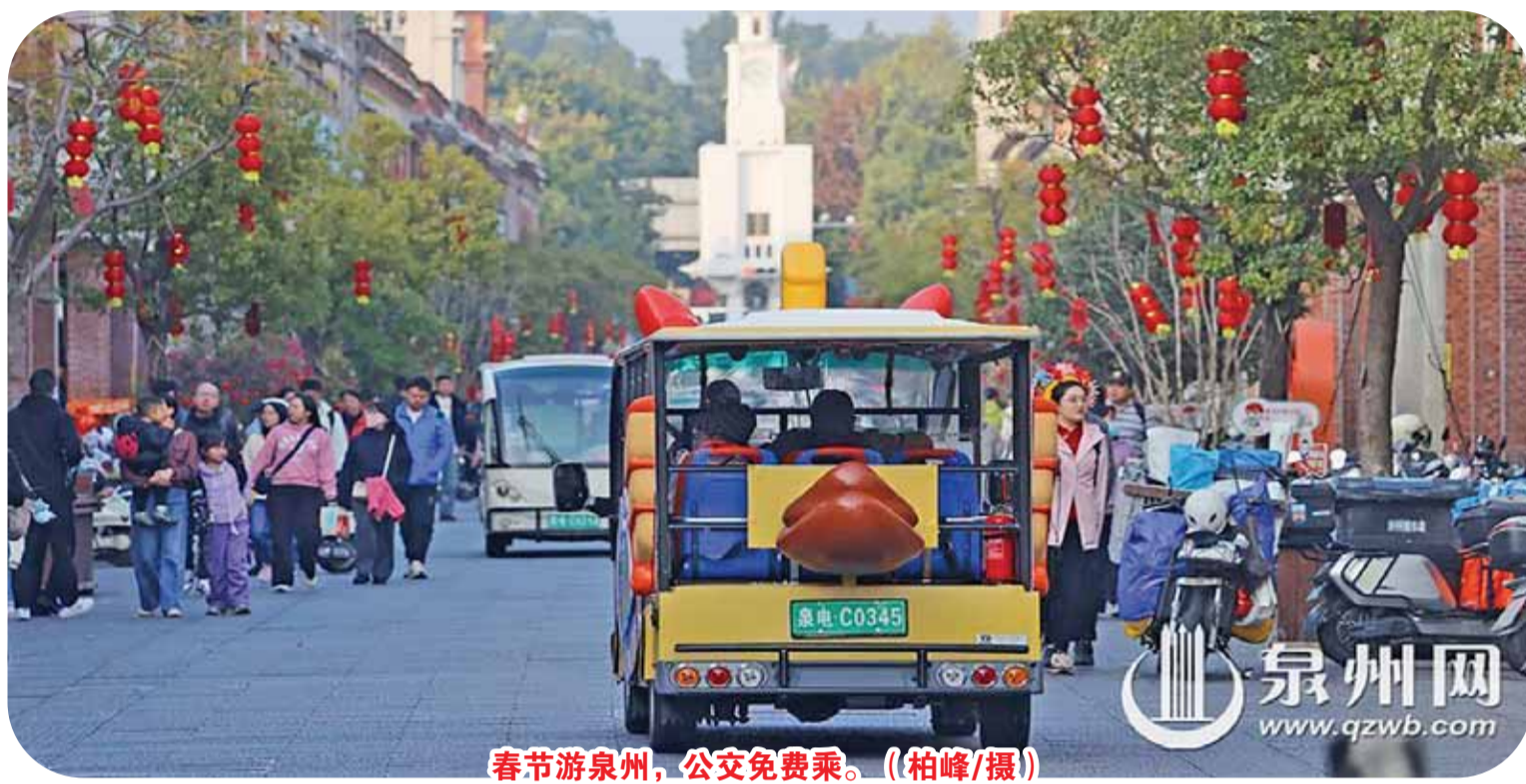
春节游泉州,公交免费乘。

公厕的“体面”,更成为打动人心的细节。奎霞巷的公厕被三角梅层层包裹,“远看像个很美的