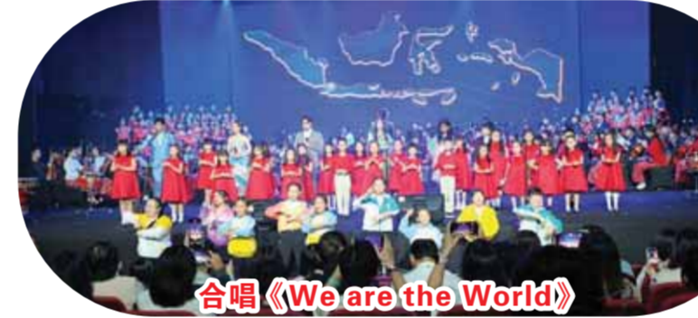
合唱《We are the World》