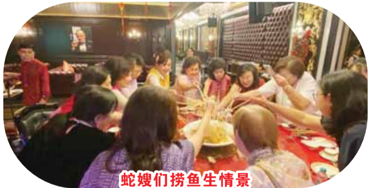
蛇嫂们捞鱼生情景