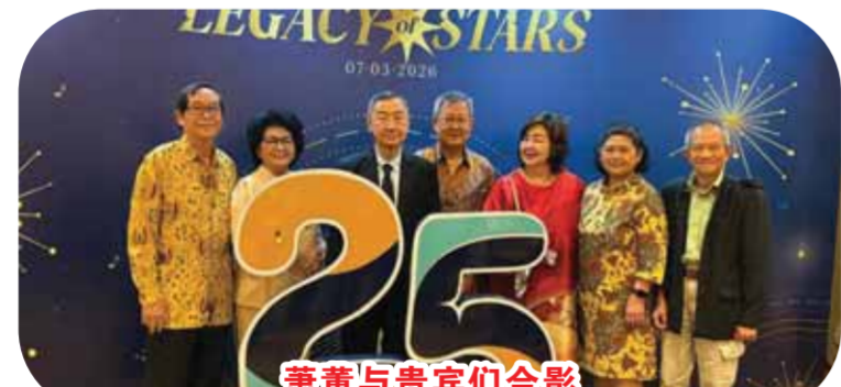
萧董与贵宾们合影