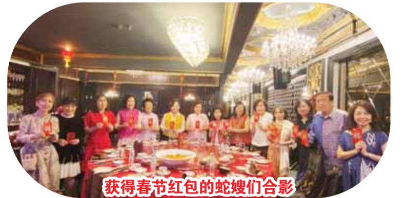
获得春节红包的蛇嫂们合影