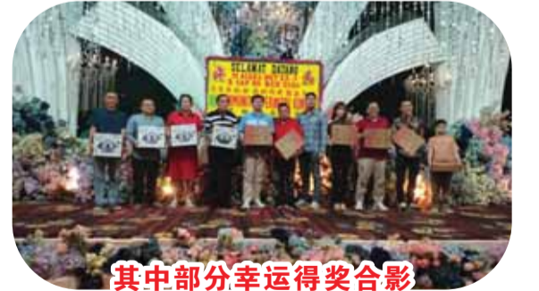
其中部分幸运得奖合影