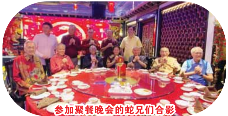
参加聚餐晚会的蛇兄们合影