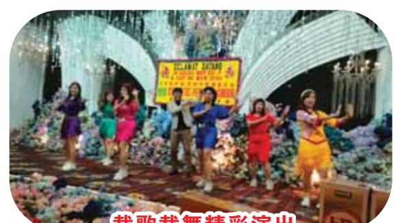
载歌载舞精彩演出