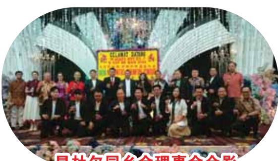
昆杜尔同乡会理事会合影