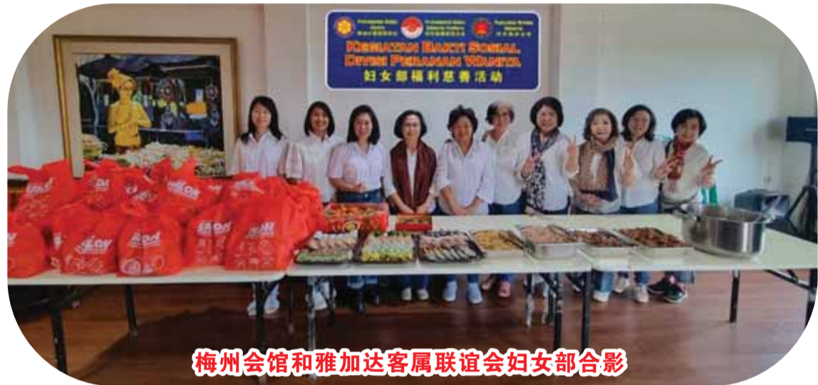
梅州会馆和雅加达客属联谊会妇女部合影