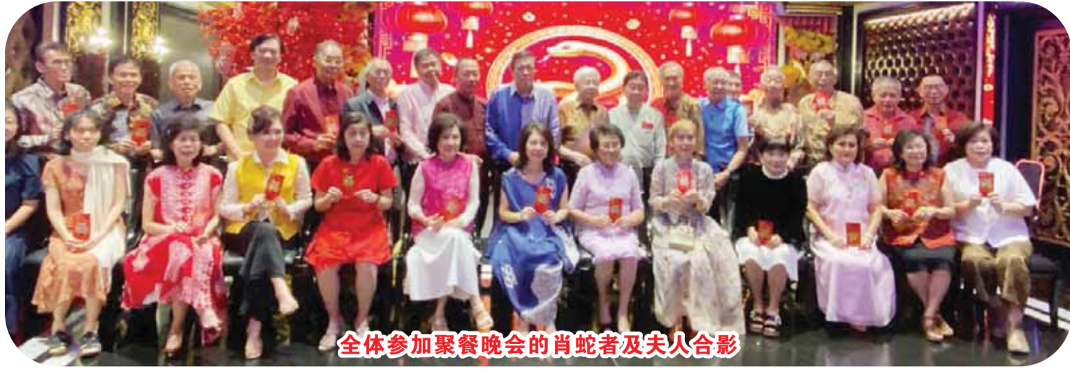
全体参加聚餐晚会的肖蛇者及夫人合影

今年2026年也不例外，于3月8日晚6时，雅加达肖蛇联谊会在太阳城国际酒楼举行新春聚餐联欢活动。