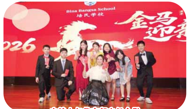
主持人与华文部主任合影