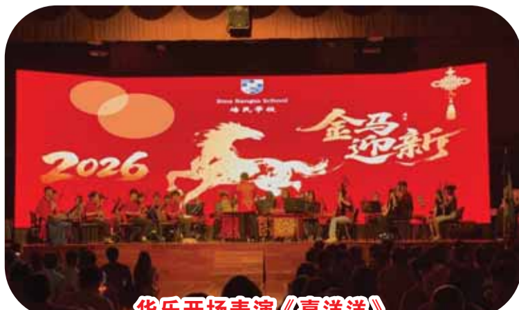
华乐开场表演《喜洋洋》