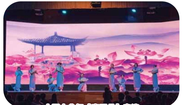
中国古典舞《寄明月》表演