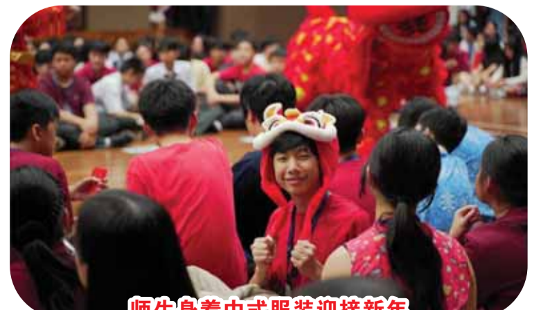
师生身着中式服装迎接新年