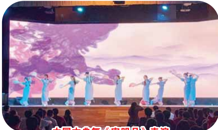
中国古典舞《寄明月》表演