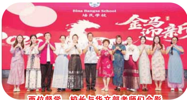
两位督学、校长与华文部老师们合影

当日12时30分，备受期待的2026华人新年庆祝会正式拉开帷幕，为全体师生及家长送上诚挚的马年祝福。本次庆祝会以“2026金马迎新”为主题，节目形式多元、内容丰富，既展现浓厚的传统年味，也融入当代学生的生活元素，处处洋溢着青春气息。整场表演涵盖三句半、歌曲演唱、舞蹈、相声、时装秀与互动游戏等环节，节目