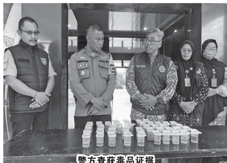
警方查获毒品证据