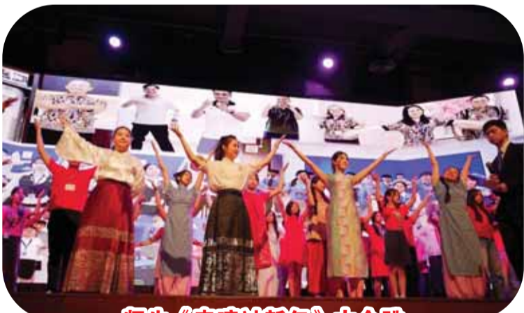
师生《来嘛过新年》大合跳