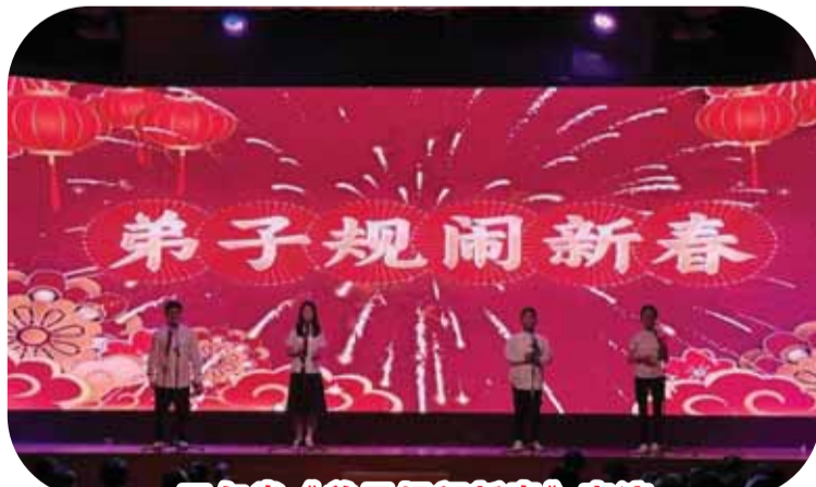
三句半《弟子规闹新春》表演