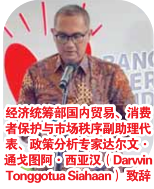
经济统筹部国内贸易、消费者保护与市场秩序助理代表、政策分析专家达尔文·通戈图阿·西亚汉 (Darwin Tonggotua Siahaan) 致辞