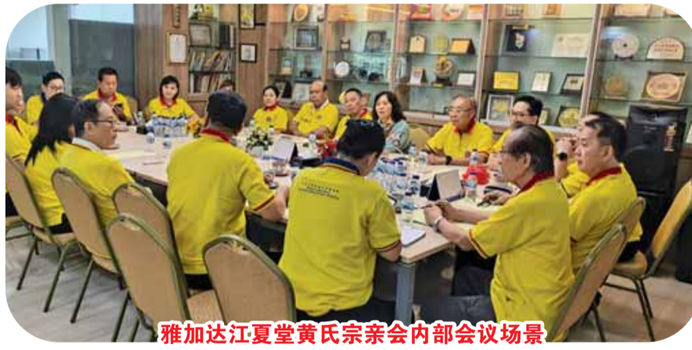
雅加达江夏堂黄氏宗亲会内部会议场景