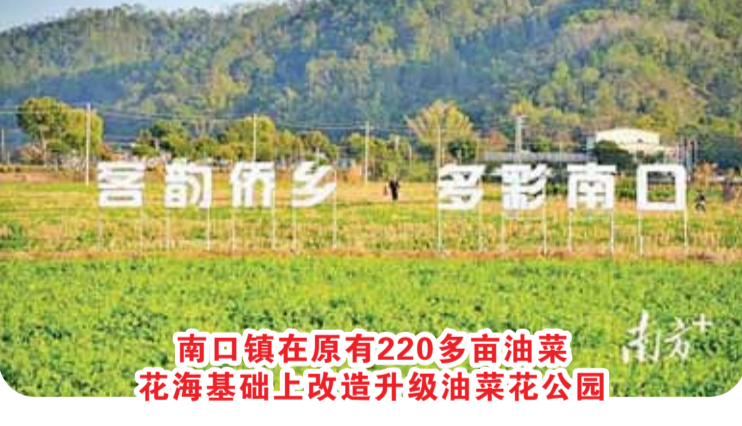
南口镇在原有220多亩油菜花海基础上改造升级油菜花园。