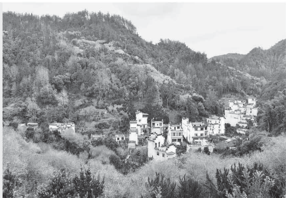
近日，安徽省黄山市歙县雄村镇棠花渔村的梅花竞相绽放，与徽派村落民居相映成趣，吸引游客赏花游玩。

“市场监管总局将以放心消费集聚区建设为载体，出台放心消费标准、放心消费主体培育等政策文件，培育一大批带动面广、显示度高的放心商圈、放心市场、放心景区，让消费者可感可及。”邓志勇说。