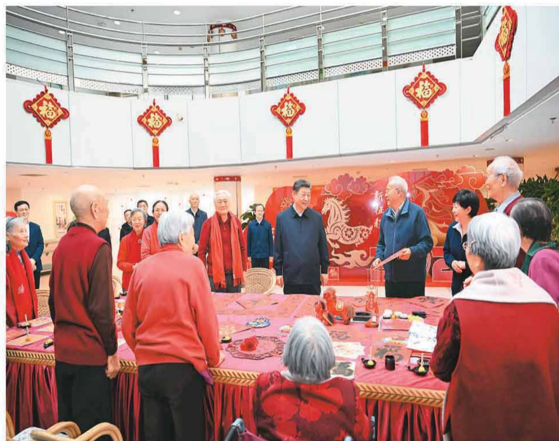
2月9日至10日, 中共中央总书记、国家主席、中央军委主席习近平在北京考察看望慰问基层干部群众。这是10日上午, 习近平在东城区隆福寺街区考察时, 向全国各族人民和香港同胞、澳门同胞、台湾同胞、海外侨胞致以美好的新春祝福。