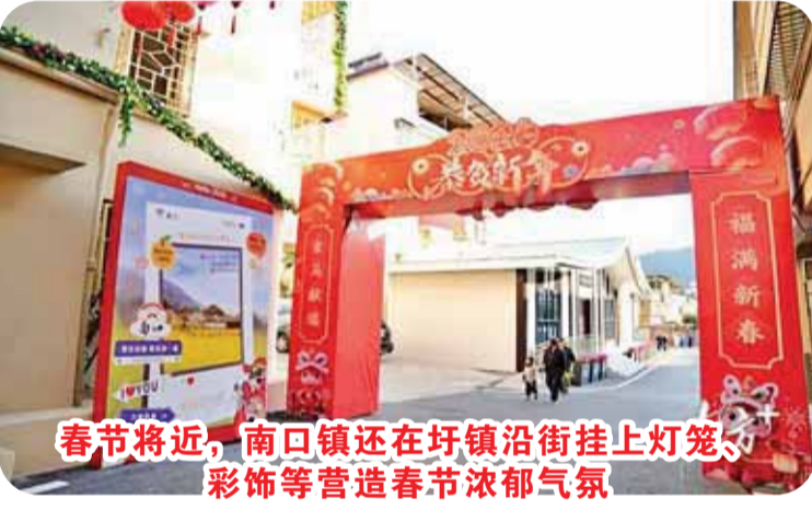
春节将近，南口镇还在圩镇沿街挂上灯笼、彩饰等营造春节浓郁气氛。

走进圩镇，新意扑面而来：沿街农房外立面焕然一新，融入“南洋窗花”“客家山墙”等元素的窗花与墙绘，讲述着南口的客侨故事。自2025年9月启动风貌提升工程以来，南口镇连片改造了56栋、约1.7万平方米农房，以点带面扮靓了街