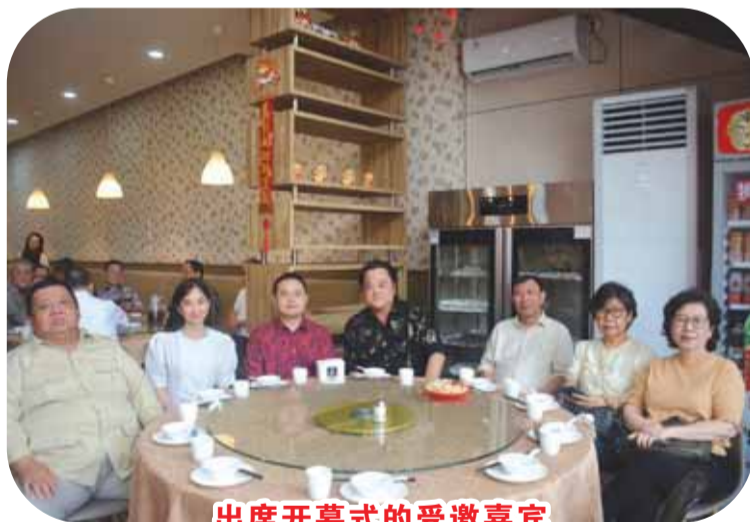
出席开幕式的受邀嘉宾