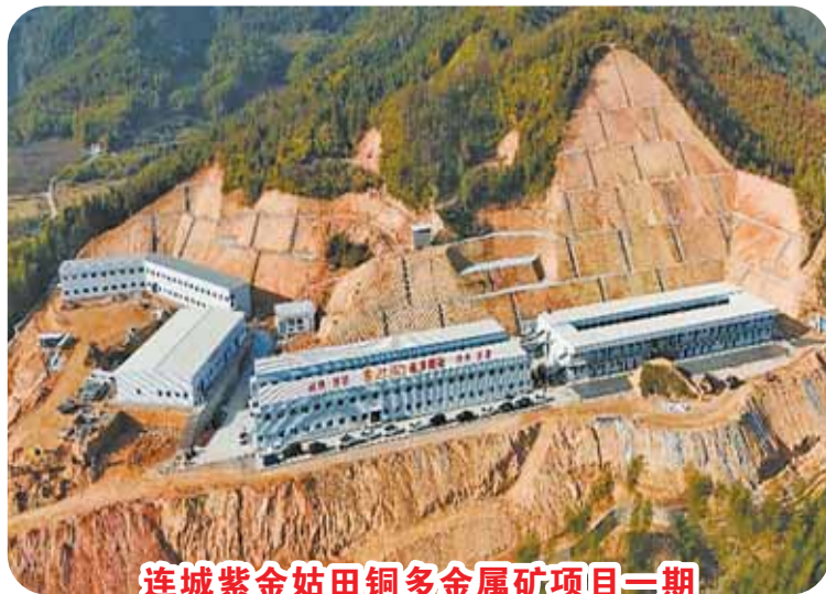
连城紫金姑田铜多金属矿项目二期

产业链生态体系。新型显示产业实现“三个100”里程碑式突破——集聚企业126家、建成百万平方米标准厂房、营收规模突破百亿元。