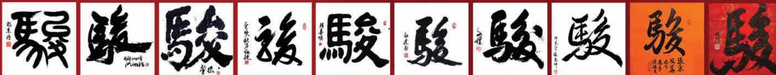
胡素丹 阮渊椿 董樵 方副捷 张喜顺 白建南 歐陽文植 林惠卿 饒韵芝 劉皓怡