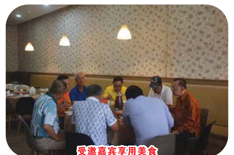
受邀嘉宾享用美食