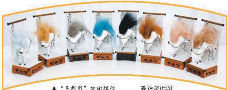
▲“马彪彪”软陶摆件。

两年马年来临之际，各类生肖马为核心元素的文创产品受到欢迎。从博物馆与品牌的跨界联名产品，到原创设计师以马为灵感的独立创作，再到非遗传承人用传统技艺呈现的骏马形象……丰富多样的马年文创产品，为即将到来的新春佳节增添了浓厚的文化氛围与情感温度。