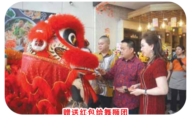
赠送红包给舞狮团