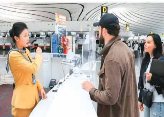
▲大兴机场工作人员为外籍旅客提供问询服务。

春运大幕下，大兴机场用AI翻译器架起沟通桥梁，用3分钟快速办卡打通出行脉络，用全流程爱心陪伴守护特殊需求，让每一位外籍旅客都能在跨越山海的旅程中，感受到“中国速度”背后的“中国温度”。