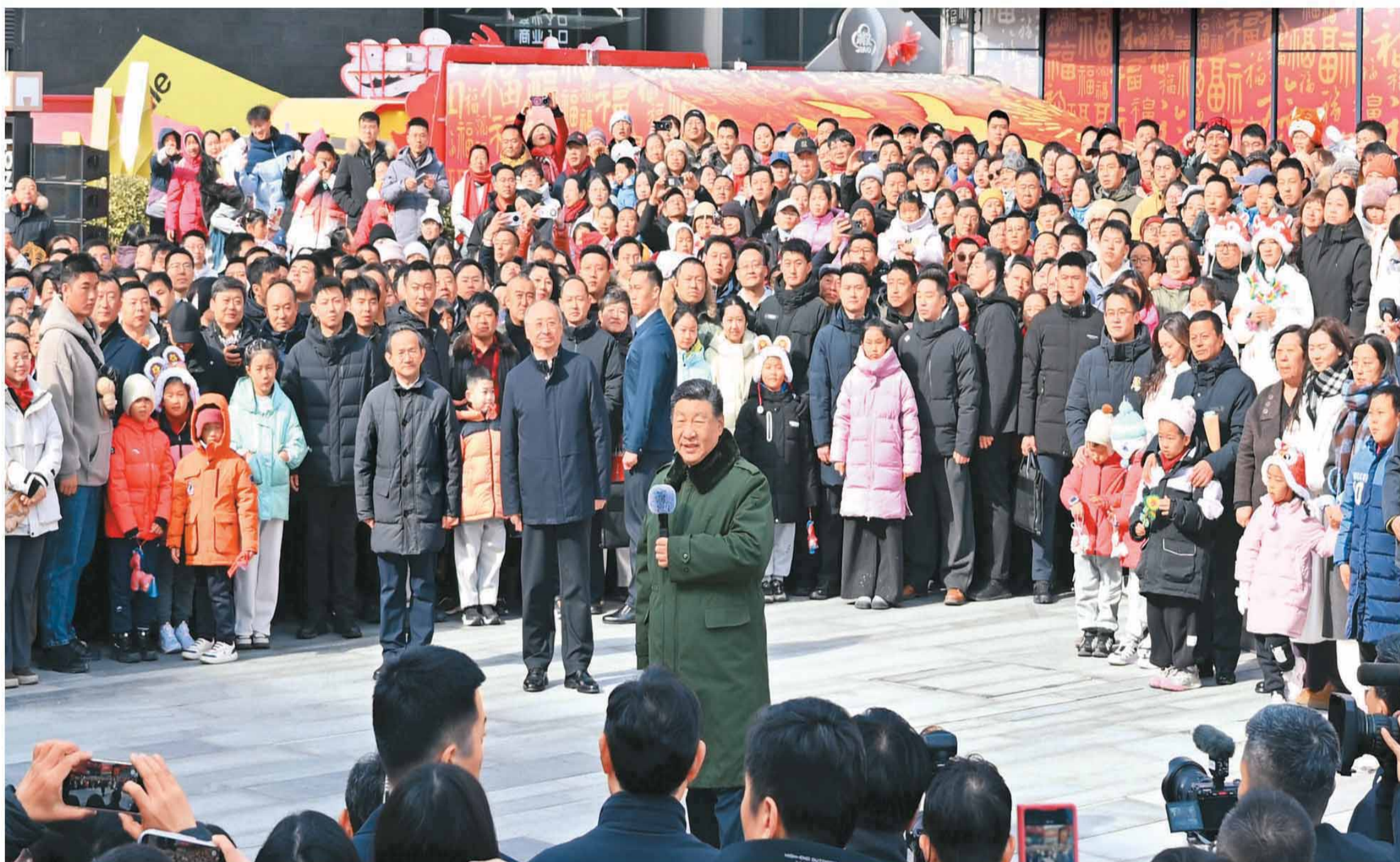
图①：2月9日至10日，中共中央总书记、国家主席、中央军委主席习近平在北京考察并看望慰问基层干部群众。这是10日上午，习近平在东城区隆福寺街区考察时，向全国各族人民和香港同胞、澳门同胞、台湾同胞、海外侨胞致以美好的新春祝福。