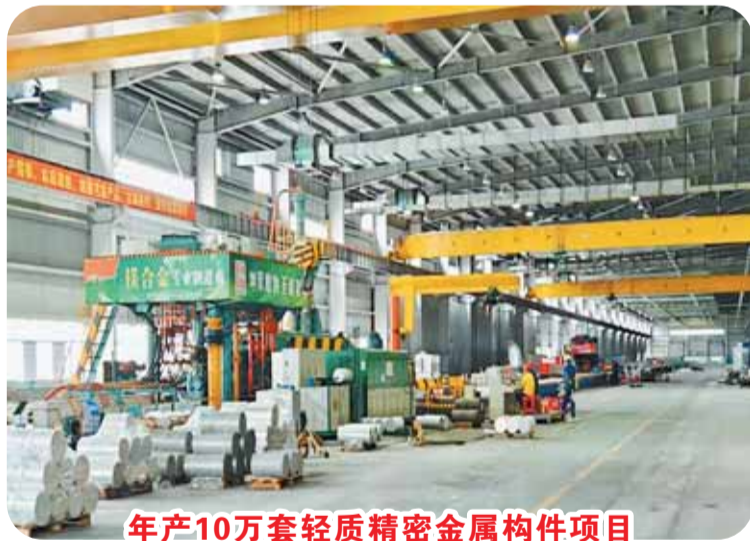
年产10万套轻质精密金属构件项目