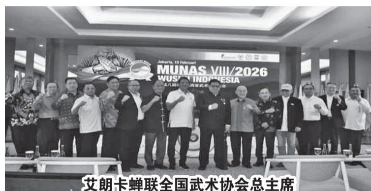
艾朗卡蝉联全国武术协会总主席

们的成就非凡，他们的自律精神也非凡。武术运动员的能力也是很均匀的。正是这一点激励着我继续前进，因为在地方上的年轻人勤奋努力，充满热情。