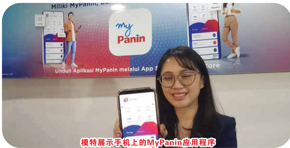
模特展示手机上的MyPanin应用程序