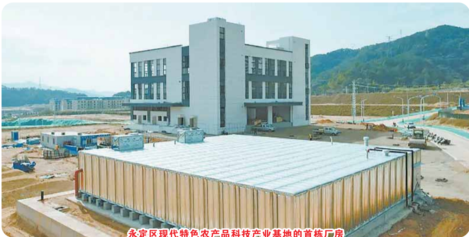
永定区现代特色农产品科技产业基地的首栋厂房

机制保障持续完善，发展生态不断优化。深入实施“永商回永”工程，集成推出新型工业化“十一条措施”“人才新政28条”等政策包，柔性引进高层次人才。建立重大项目审查评估与全生命周期跟踪