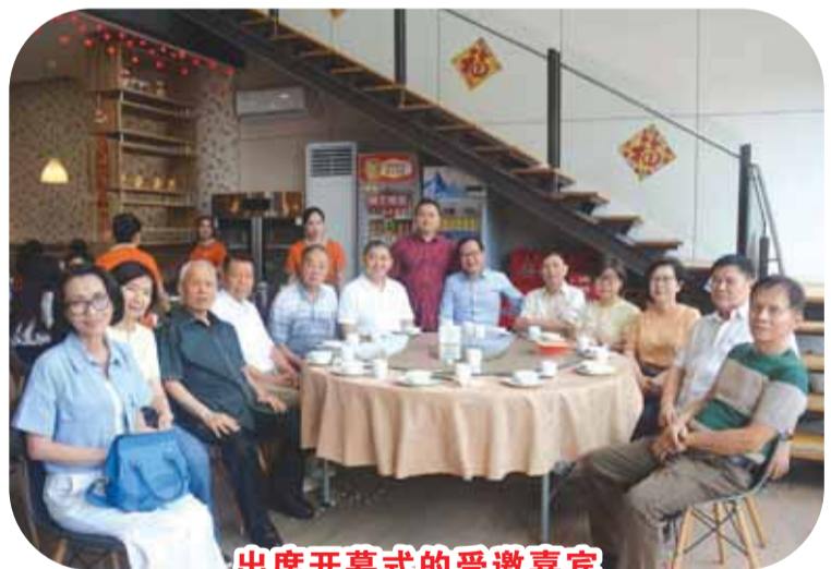
出席开幕式的受邀嘉宾