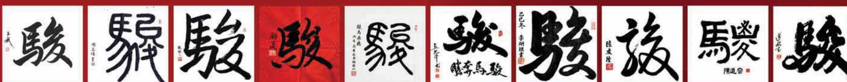
王玉斌 周玉娟 饒韻人 鄺寶成 鄺寶成 丘思千 李炯琪 陳慶隆 陳道容 張道欽