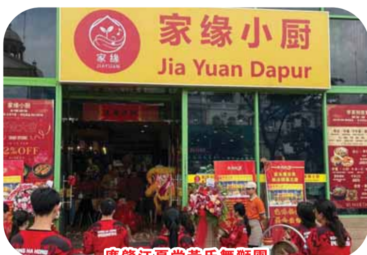
广肇江夏堂黄氏舞狮团