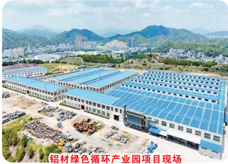
铝材绿色循环产业园项目现场