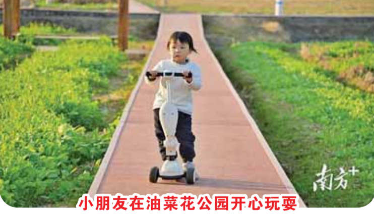
小朋友在油菜花园开心玩耍。

区风景线。而在美丽乡镇入口通道，一位可爱的“形象大使”正迎接着八方来客——这便是南口镇的专属IP“侨侨”。