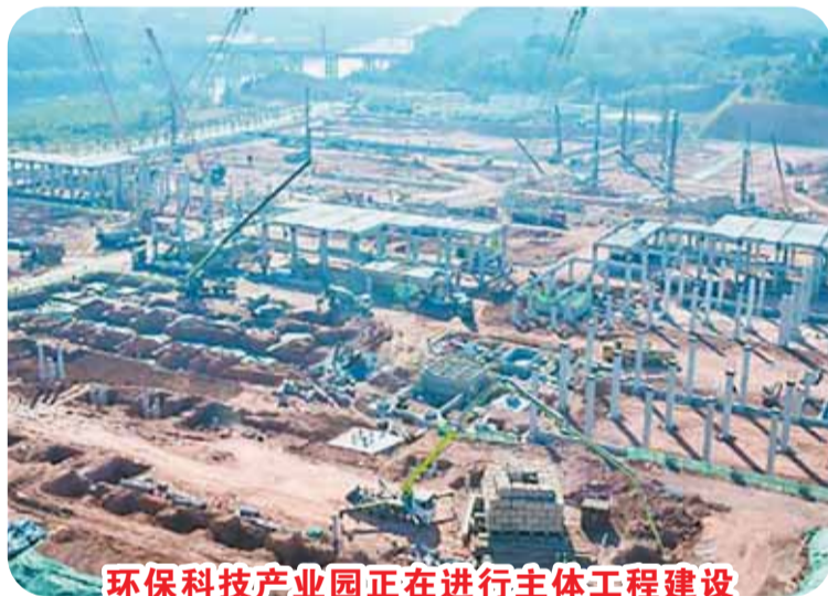
环保科技产业园正在进行主体工程建设