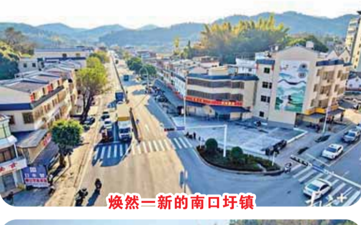
焕然一新的南口圩镇。