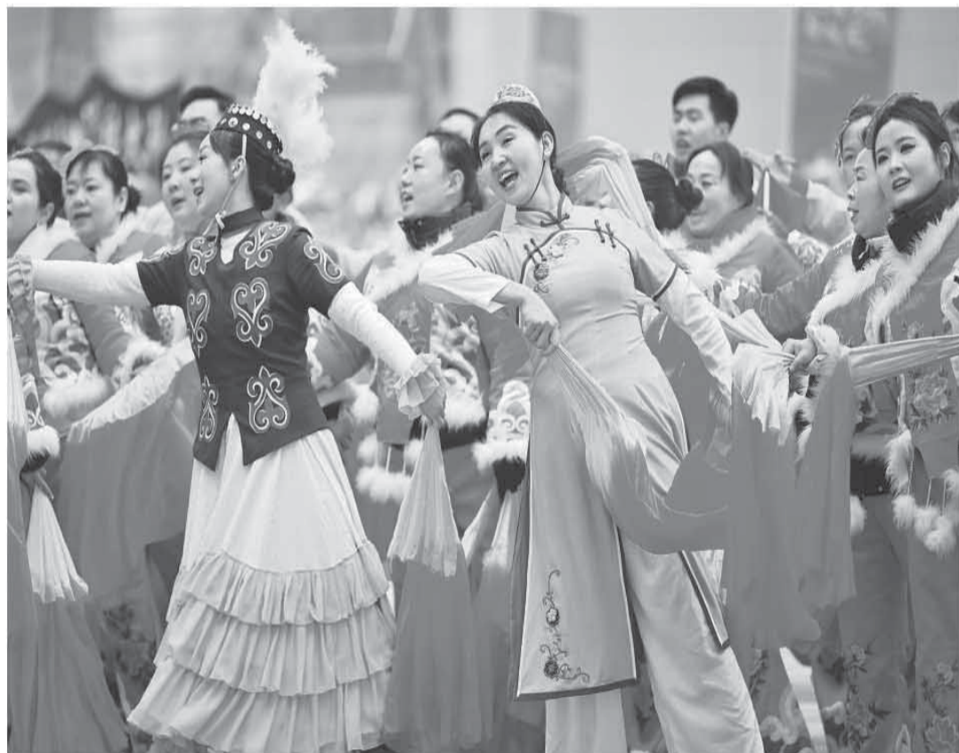
2月10日，第二届“打起手鼓舞起龙”乌鲁木齐社火展演活动在新疆乌鲁木齐文化中心启动。共有100余支队伍、7500余名民间艺术演员参演，掀起新春民俗文化活动热潮。图为社火队员挥舞彩扇，腾跃起舞。

爱心热情服务群众，有的扎根社区治理解决居民急难愁盼，有的奔赴乡村振兴一线带领群众共同富裕，有的用“绣花”功夫传承民族文化，有的精益求精锤炼焊接技术，有的坚守三尺讲台，用音乐点亮乡村学生成长梦想，有的积极响应“到祖国最需要的地方去”的号召，建功西部、报效祖国……他们的先进事迹，集中展现了新时代中国青年昂扬向上的精神风貌和强国青年的责任担当。 广大青年表示，“最美高校毕业生”的成长历程表明，只要有志向就会有事业，只要有本事就会有舞台。要以“最美高校毕业生”为榜样，勇担使命，找准定位，扎实奋斗，把个人的理想追求融入党和国家事业之中，为党、为祖国、为人民多作贡献。有关部门负责人和企业代表表示，要切实做好高校毕业生就业工作，采取有效措施，千方百计帮助高校毕业生就业，热情支持高校毕业生在各自工作岗位上为党和人民建功立业。 发布仪式现场播放了“最美高校毕业生”先进事迹的视频短片，多角度讲述了他们的学习、工作方法以及生活感悟。中央宣传部、人力资源社会保障部负责同志为他们颁发“最美高校毕业生”证书。