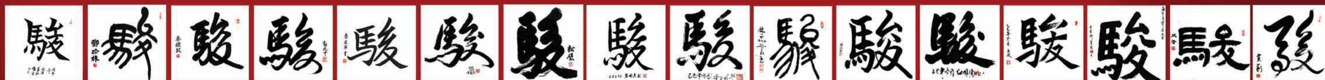
倪政漢 鄧珍珠 蔡婉紋 郭杞雲 李友寧 黃慧琴 周松壁 張婉英 李玉明 林志萱 林光榮 紀國彪 趙立俊 許菁菘 成浩 黃莉