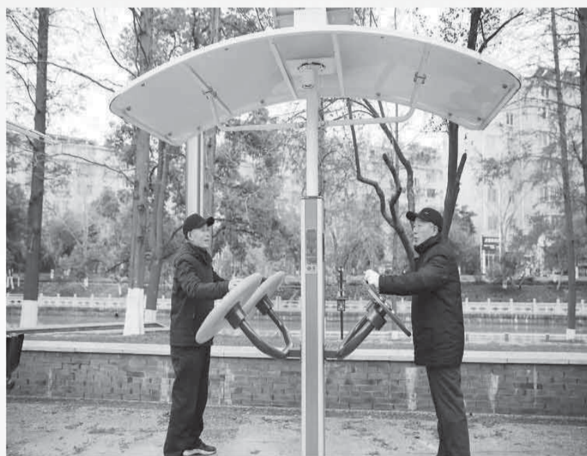
▲江苏省如皋市如城街道秀水社区，老人在使用智能体育设施健身。