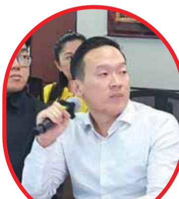
經貿部主席張清文致詞