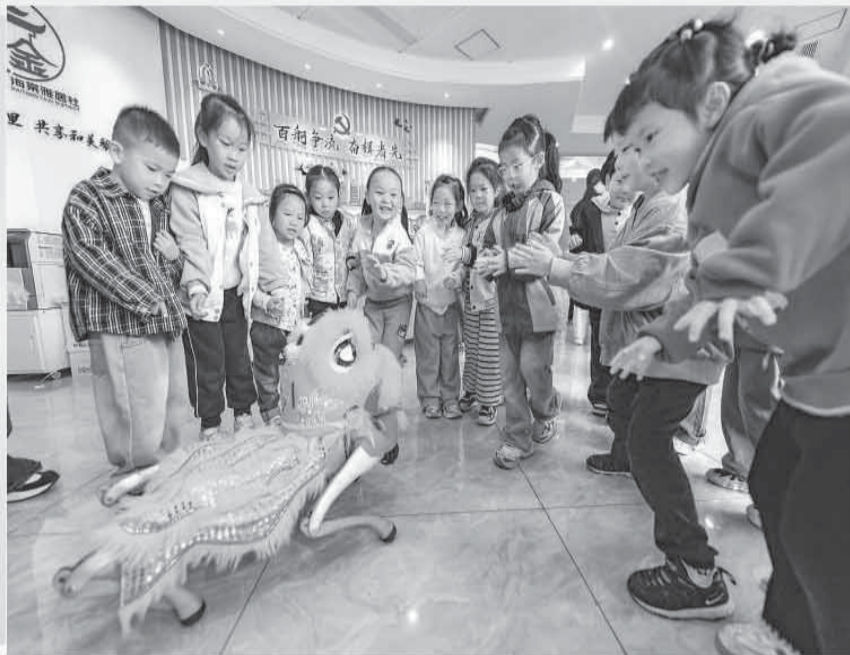
▲浙江省金华经济开发区马鞍山社区活动室里，小朋友与智能机器人互动。

这些被称为“智慧小屋”或“AI驿站”的新空间，虽然面积不大，却依靠科技赋能实现了服务功能的显著升级，让家门口的幸福感越来越强。