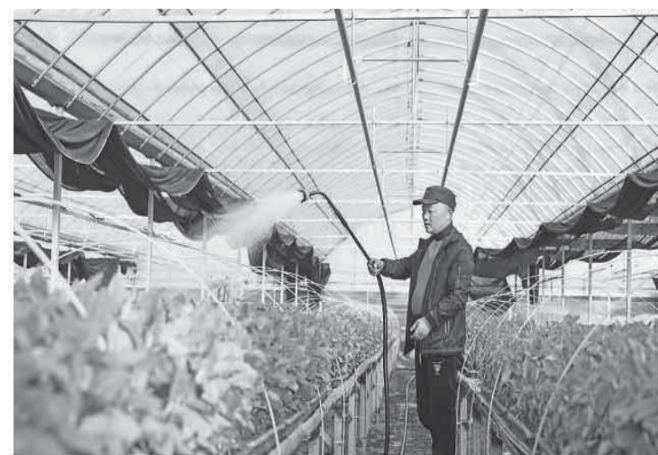
近日，浙江省台州市仙居县台湾农民创业园一家蔬菜育苗基地温室大棚里，农民忙着为蔬菜幼苗浇水。近年来，仙居县立足区域农业生产特色，培育优质蔬菜幼苗，带动农民增收。

活动现场，“赛马会优秀运动员奖励计划”向获奖健儿颁发奖金。自2023年至今，香港赛马会已透过该计划发放超过8700万港元现金奖励。