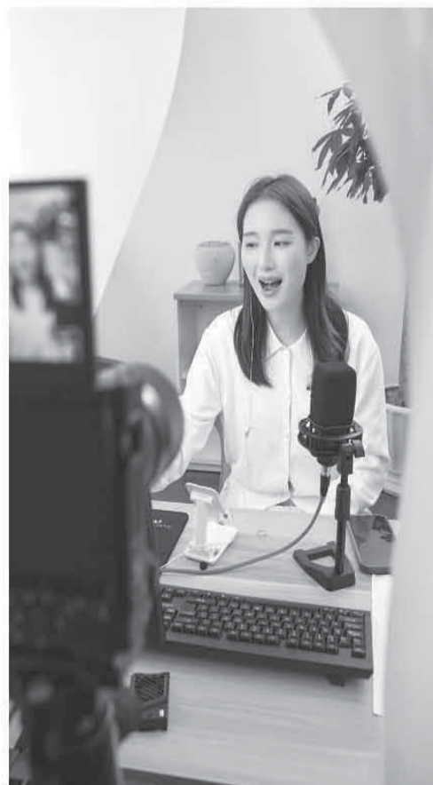
▲美声女高音朱琳直播中。