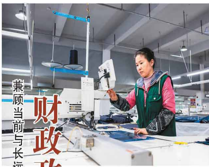
兼顾当前与长远，加大逆周期调节力度