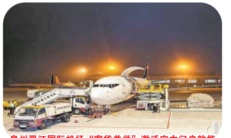
泉州晋江国际机场“客货并举”激活空中门户效能