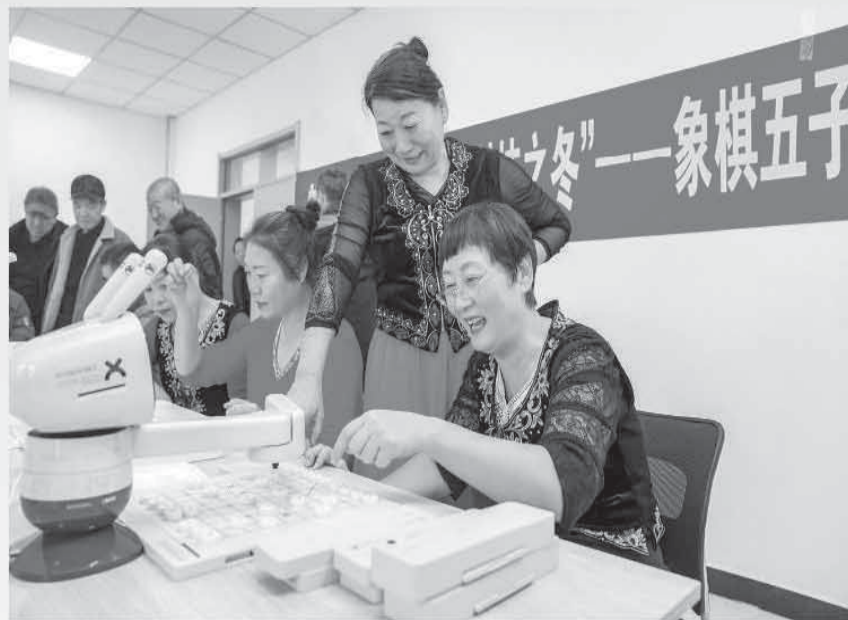
▲新疆维吾尔自治区乌鲁木齐市文林路社区，居民与AI下棋机器人对弈。