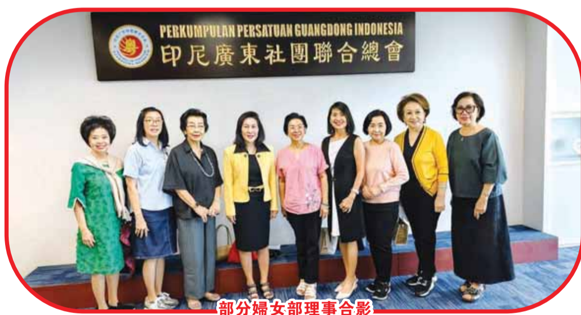
部分婦女部理事合影