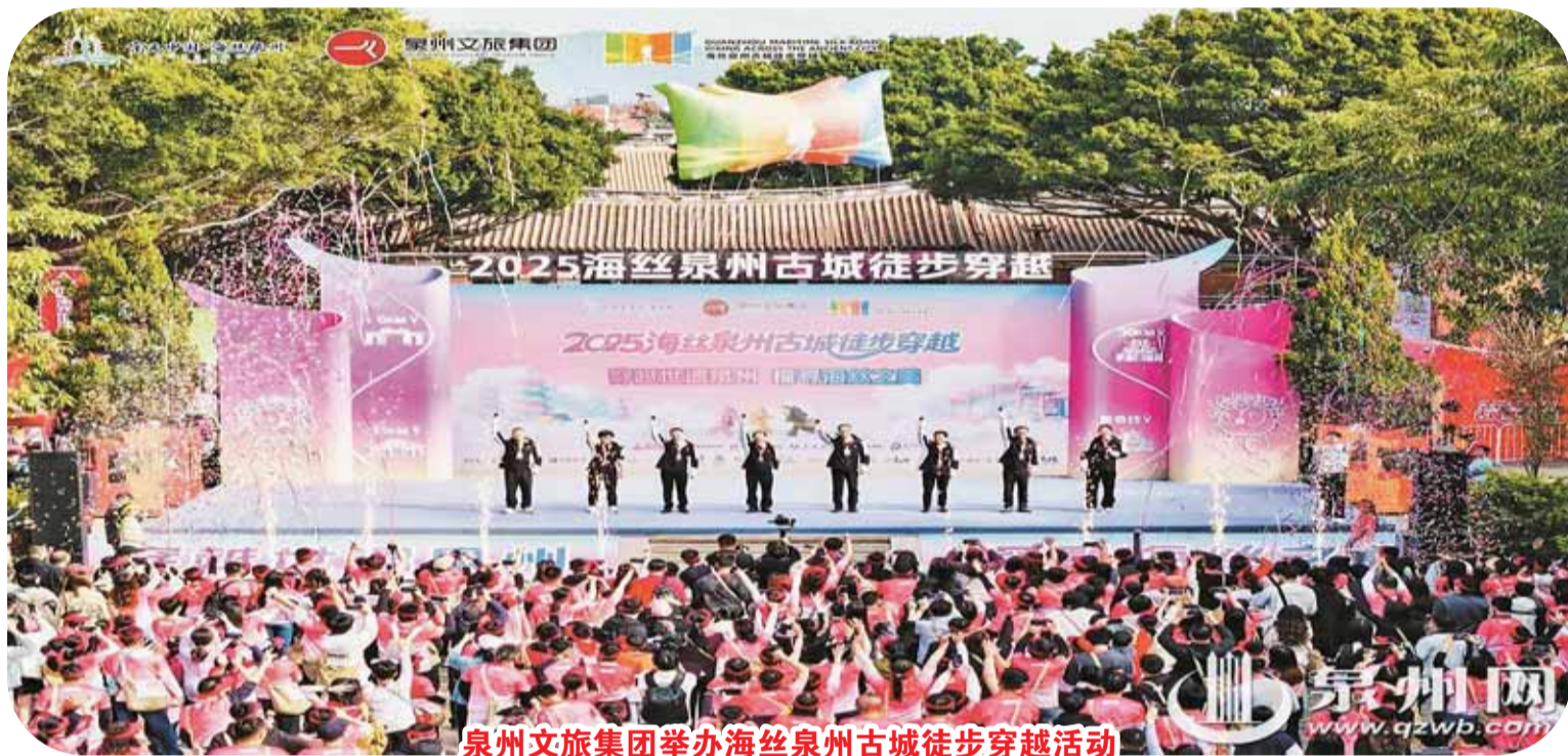
泉州文旅集团举办海丝泉州古城徒步穿越活动

军”为定位,连续6年跻身全国城投企业百强,连续2年蝉联中国服务业企业500强、福建企业100强,荣登2024年度全国AAA级城投公司综合实力百强榜第18名。