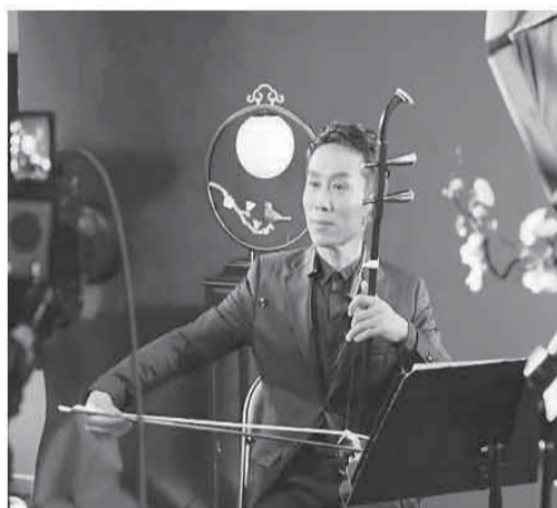
▲中央民族乐团二胡首席金玥正在直播。