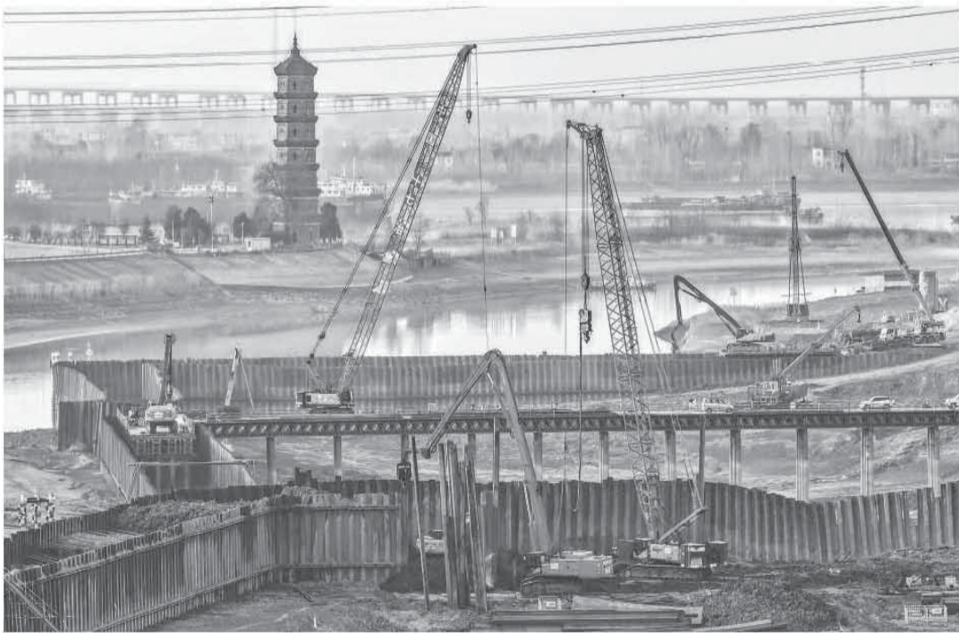
安徽省马鞍山市当涂县近期抢抓冬修水利窗口期，统筹推进各类水利工程建设，全面提升防灾减灾能力，优化水生态环境。图为当涂县姑茨河当涂闸枢纽工程现场，机器轰鸣、车辆穿梭，一派忙碌景象。

成的单壁碳纳米管的存在。 研究表明，这些碳纳米管的形成可能与月球历史上微陨石撞击、火山活动及太阳辐照等多因素协同作用下的铁催化过程密切相关，展现了自然界在极端条件下合成关键材料的能力。 这是吉林大学科研团队在嫦娥五号月球样品中发现少量石墨烯后，又一重要发现。相关研究成果于近日发表在学术期刊《纳米快报》上。