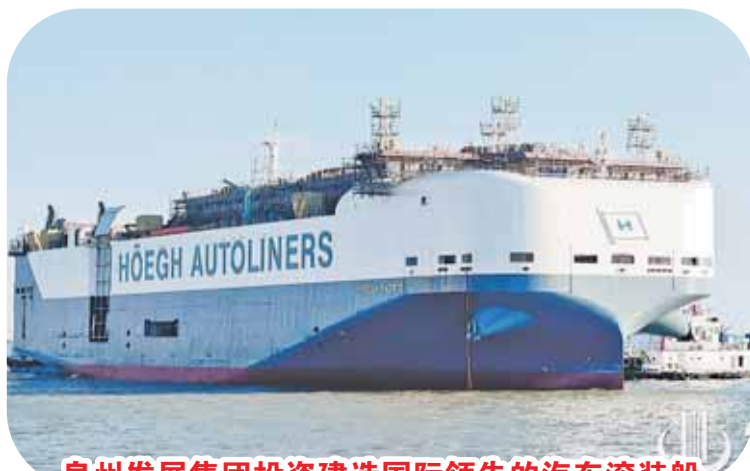
泉州发展集团投资建造国际领先的汽车滚装船