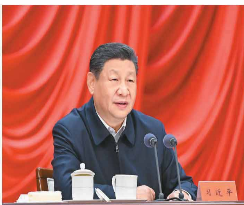
1月20日,省部级主要领导干部学习贯彻党的二十届四中全会精神专题研讨班在中央党校(国家行政学院)开班。中共中央总书记、国家主席、中央军委主席习近平在开班式上发表重要讲话。

■要把学习贯彻党的二十届四中全会精神不断引向深入,更好统一思想、凝心聚力,在党中央坚强领导下扎实做好各项工作,努力实现“十五五”良好开局 ■制定和实施五年规划是我们党治国理政一条重要经验,是中国特色社会主义制度一个重要政治优势,有利于实现党的领导,有利于集中力量办大事,有利于前瞻性把握战略问题,有利于保持事业连续性。在制定实施五年规划的长期实践中,我们党创造积累了丰富经验,包括坚持党中央集中统一领导,坚持从实际出发,坚持全国一盘棋,坚持发扬民主、集思广益,坚持规划法定原则等。我们要坚定制度自信,不断结合新的实际把这一优势发扬光大 ■党的二十届四中全会对“十五五”时期经济社会发展作出战略部署,要全面深刻准确领会和把握。全面,就是要以全局视野领会全会精神,将各项部署作为一个整体来把握,不能顾此失彼。深刻,就是要知其然又知其所以然,既明白是什么,又明白为什么、怎么做,真正理解透彻。准确,就是要精准把握政策界限和尺度,做到该为的必须为、能做的努力做、不该做的决不为 ■我国发展处于战略机遇和风险挑战并存、不确定难预料因素增多的时期。我们分析形势,既要把各种因素考虑周全,又要善于把握其中一些关键因素如国际形势、新一轮科技革命和产业变革等的新变化。要胸怀全局、登高望远,在战略上保持定力,在战术上精心运筹,不断增强我国发展的确定性和可持续性 ■建设现代化产业体系、实现产业体系整体跃升,是“十五五”时期的重要战略任务。各地区各行业要找准定位,发挥比较优势,形成上下游产业相互衔接、各展其长、同向发力的生动局面。要保持制造业合理比重,大力发展先进制造业,因地制宜发展新质生产力,推动科技创新和产业创新深度融合,要建设现代化基础设施 ■我国人口多、市场大、产业全、发展动能强,有条件加快构建新发展格局。要坚持以内大循环为主体,正确处理消费和投资、需求和供给的关系,坚持惠民生和促消费、投资于物和投资于人紧密结合,努力提高国民经济循环质量和效率,让内需成为经济发展的主动力。要以做强国内大循环提升扩大高水平对外开放的自主性,以拓展国际循环增强国内改革发展的活力,努力实现内外联通、互促共进 ■经济和社会协调发展相辅相成,必须协调并进。要把改善民生作为促进社会发展的重点,在发展的同时稳步提高人民生活品质。要坚持党建引领,强化法治保障,夯实基层基础,切实提高社会治理水平。要统筹发展和安全,有效防范化解各类风险,切实维护国家和社会稳定 ■要坚持科学决策、民主决策、依法决策,编制好国家和地方“十五五”规划纲要及专项规划。地方规划和专项规划要与国家总体规划衔接好,体现国家总体规划的精神和要求,同时要因地制宜制宜,把需要和可能统一起来,确保定了就做得好、能落地见效 ■顺利完成“十五五”时期目标任务,必须着力提高党领导经济社会发展能力和水平。各级干部特别是领导干部要进一步加强学习,钻研党的创新理论,提高专业素养,增强实干本领。要树立和践行正确政绩观,坚持从实际出发,按规律办事,自觉为人民出政绩、以实干出政绩。要大力弘扬斗争精神,勇于挺身而出、迎难而上,善于战风险、迎挑战、克难关。要保持反腐败高压态势,一步不停歇、半步不退让,一体推进不敢腐、不能腐、不想腐