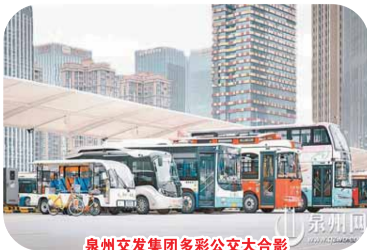
泉州公交集团多彩公交大合影