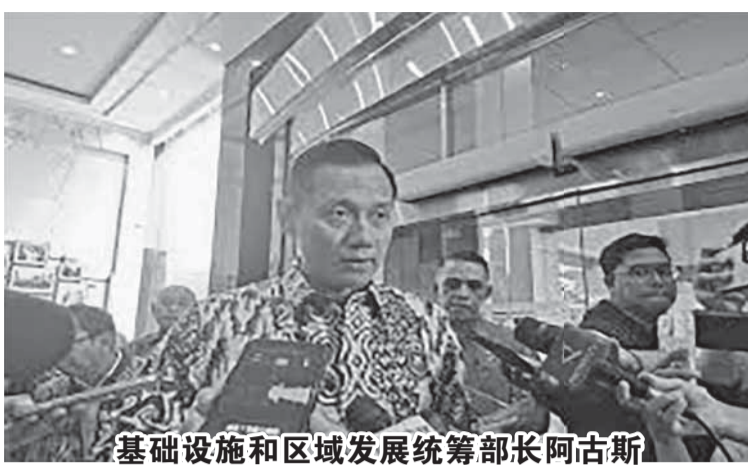
基础设施和区域发展统筹部长阿古斯

决方案必须对各方有利，尤其是已有计划将其与泗水连接。国家在场，政府在场，解决方案必须对各方都有利，因为我们当然希望雅万高铁或印尼-中国高铁公司能够良好运作并取得成功，最终也能获得发展。当然不会仅依靠万隆，我们希望这列高铁的发展也能延伸到泗