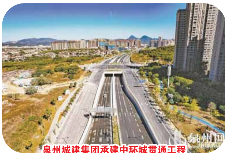
泉州城建集团承建中环城贯通工程

泉州水务集团聚焦“城市市政公共服务和民生保障服务提供商”战略定位,水利原水、城乡供水、市政排水、生态环保、工程建设、数智科技、股权投资、城市运营等八大业务板块协同发力,综合排名进位至全省水务企