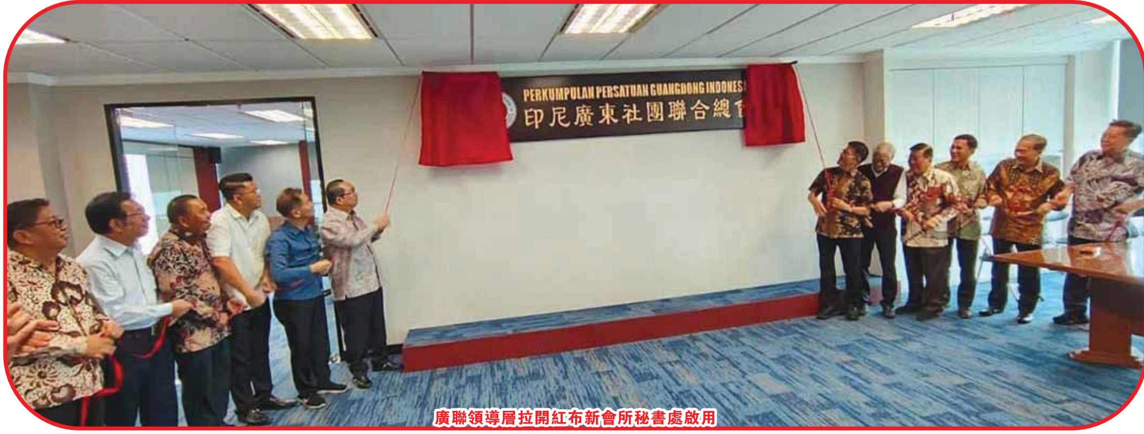
廣聯領導層拉開紅布新會所秘書處啟用