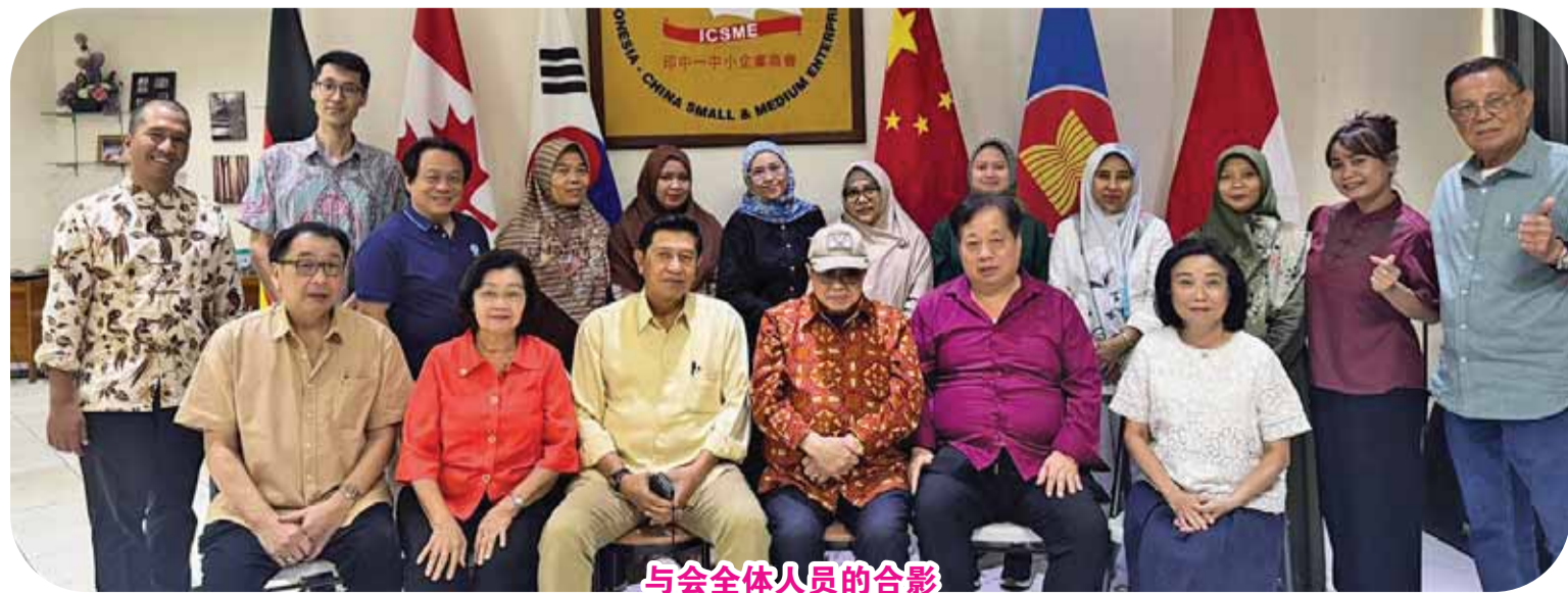
与会全体人员的合影

日益明显。根据投资部长公布的数据，非爪哇地区投资持续上升。这意味着我们印中“一带一