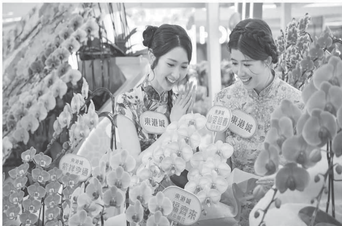
1月20日，香港一家商场举办第20届新春花展记者会。该花展以“花开千载迎新春”为主题，展出逾百种贺年花，迎接马年新春。图为两名模特置身于年花之中。