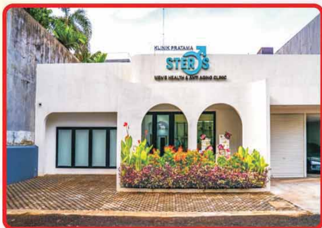
STEROS 抗衰老與健康診所

Jl. Dharmawangsa xvii 38b RT.09 RW. 04 Kelurahan Cipete Utara, Kecamatan Kebayoran Baru, Jakarta Selatan 12110 No. HP : 082171777007