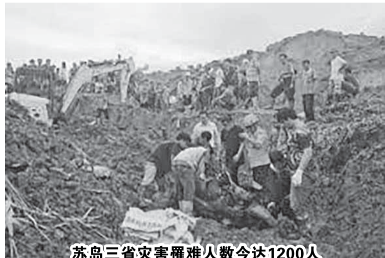
苏岛三省灾害罹难人数今达1200人

迪(Prasetyo Hadi)表示，上述28家公司存在多项违规行为。他说：“上述企业在已获许可证范围以外区域开展活动、并在被禁止的区域如森林保护区内营业，以及未履行对国家的相关义务，如未缴纳税款等。” 撤销许可证是普拉博沃总统主持与相关部委、机构以及森林治理工作组(Satgas PKH)于1月19日举行的局部内阁会议后作出的决定。在会议上，工作组汇报