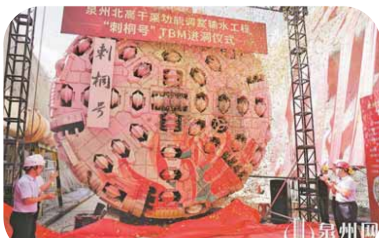
泉州水务集团承建的北高干渠工程之刺桐号TBM进洞仪式

业前三。泉州晋江国际机场以“客货并举”战略激活空中门户效能,2025年完成旅客吞吐量超885万