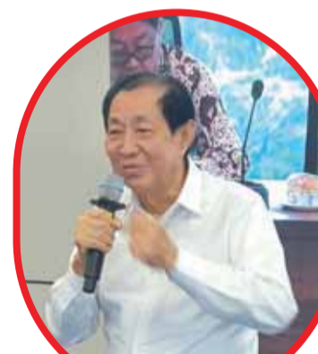
旅遊部梁偉強致詞