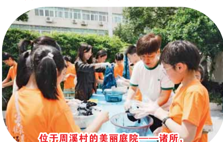
位于周溪村的美丽庭院——诸所，常态化开展非遗体验活动。