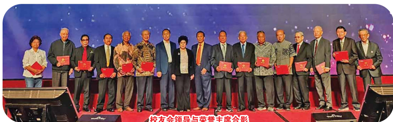
校友会领导与荣誉主席合影

职典礼。华中校友会第六届理事会在第五届理事会的坚实基础,接下了领导校友会这个艰巨而光荣的任务,以团结的精神、强大的决心和顽强的意志,不负期望,迈步向前。今天的就职典礼,就显示了第六届理事会向全体校友表决心和郑重承诺。为了举办这次庆典大会,我们尽力筹备,努力工作,尽量做到完美。可是限于水平出现了许多不足之处以及招待不周,我们谨此向大家致以真诚的歉意,请你们给与谅解和多多包涵。