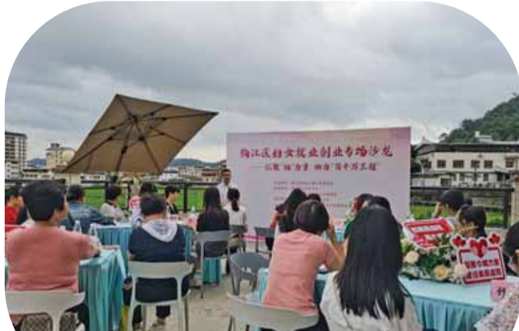
梅江区妇女就业创业专场沙龙活动在阁公岭村“美丽庭院”示范户中举行。

梅江区坚持引导人人参与、户户受益、家家美丽，将一方方庭院打造成为幸福的小天地，同时以“庭院+文化”“庭院+经济”为路径，拓展“