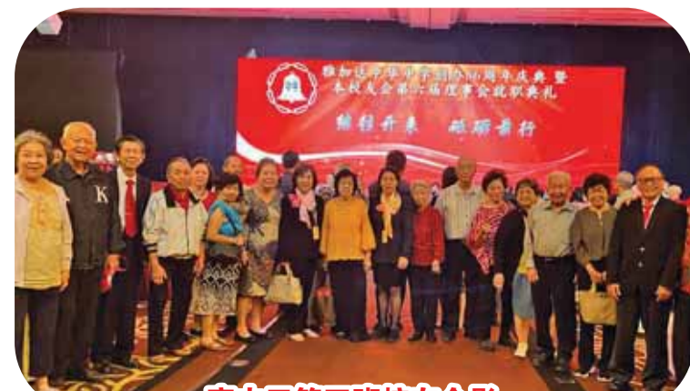
高中三第四班校友合影