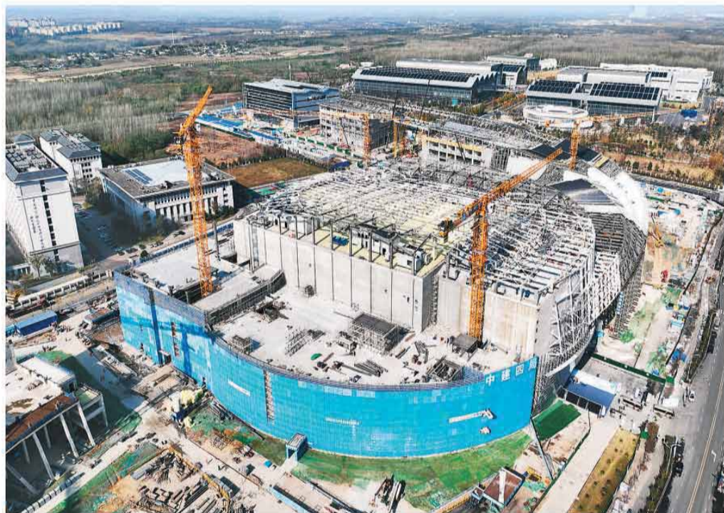
紧凑型聚变实验装置（BEST）建设现场。

根据国际科学计划，等离子体物理研究所将面向全球开放包括BEST在内的多个核聚变大科学装置平台，设立开放科研基金、资助高频次专家互访交流。来自法国、英国、德国等10余个国家的聚变科学家共同签署《合肥聚变宣言》，该宣言倡导开放共享与合作共赢精神，鼓励各国的科研人员到中国开展聚变合作研究。