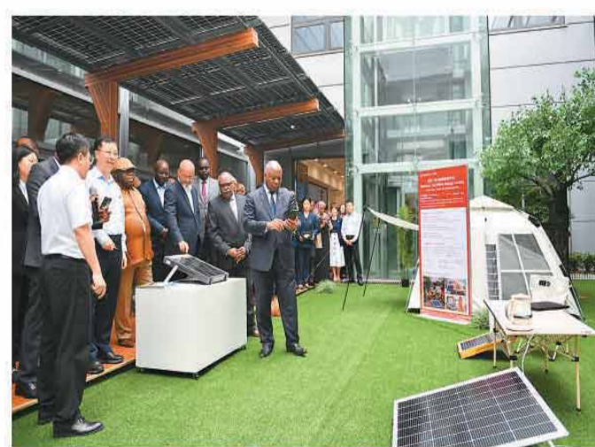
非洲驻华使节代表团在位于湖南株洲的三一氢能（株洲）有限公司参观。