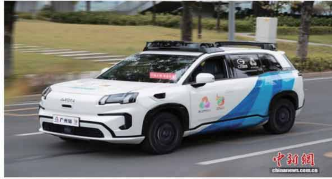
11月2日，在廣州參與火炬傳遞的無人駕駛車。