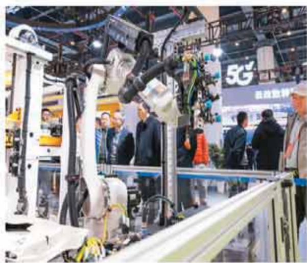
日前,参观者在2025中国5G+工业互联网大会展厅观看展出的一款柔性制造岛式工作站。