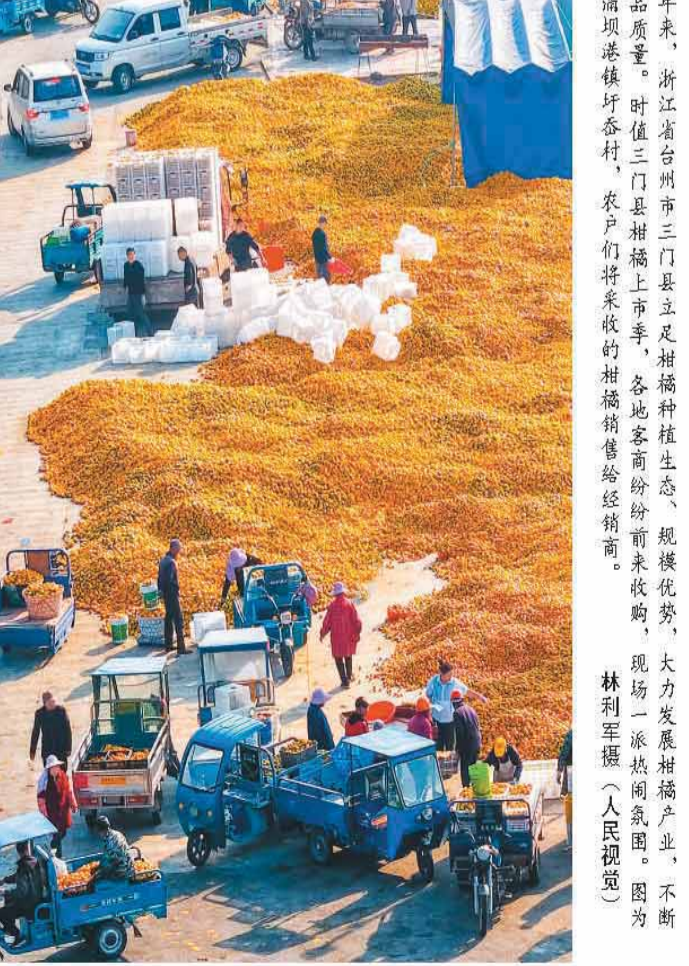
近年来, 浙江省台州市三门县立足足相种植生态、规模优势, 大力发展相福产业, 不断提升农产品质量。时值三门县柑橘上市季, 各地客商纷纷前来收购, 现场一派热闹氛围。图为三门县浦坝港镇圩村, 农户们将采收的柑橘销售给经销商。