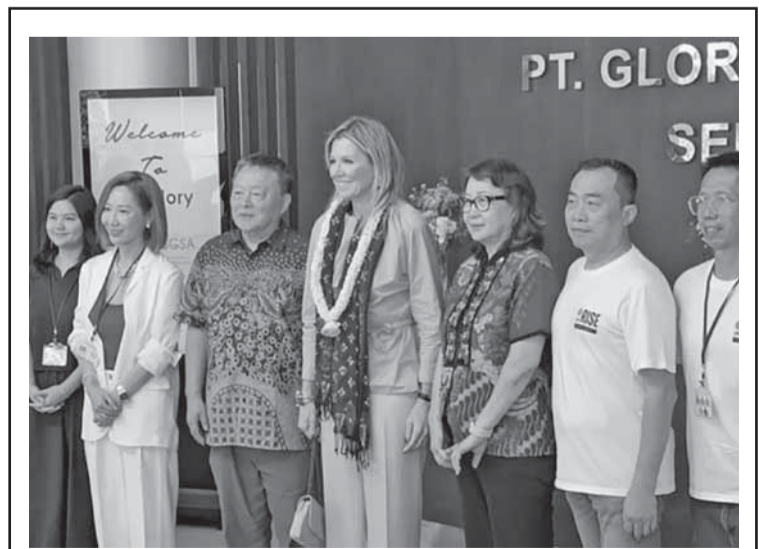
荷兰马克西玛王后参观斯拉根成衣工厂 11月25日，荷兰马克西玛王后 (Maxima Zorreguieta Cerrut) 赴中爪哇省斯拉根 (Sragen) 县参观其中一家成衣工厂。