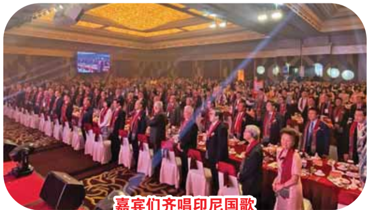
嘉賓們齊唱印尼國歌