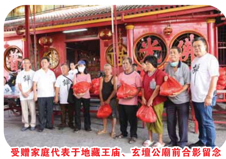
受赠家庭代表于地藏王庙、玄坛公廟前合影留念

为确保分发过程高效有序, 主办方进行了细致的准备工作, 提前向受助居民发放了领取券。22日上午9时起, -