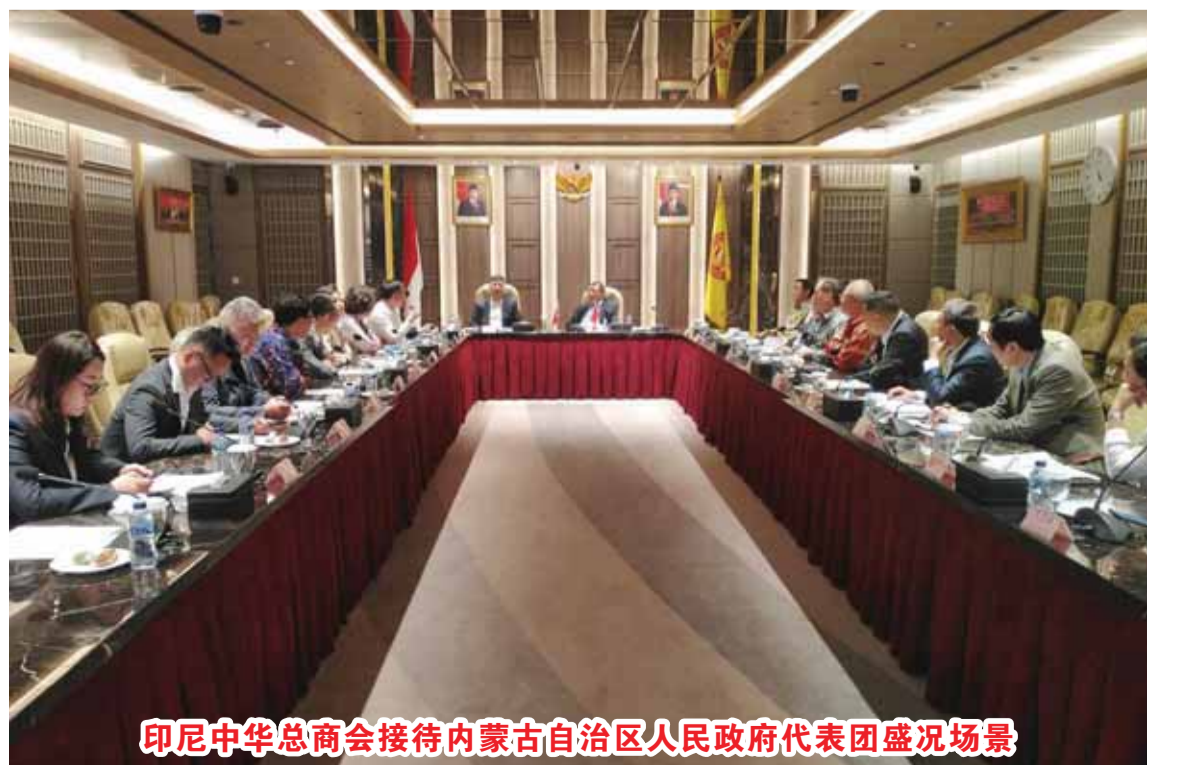
印尼中华总商会接待内蒙古自治区人民政府代表团盛况场景