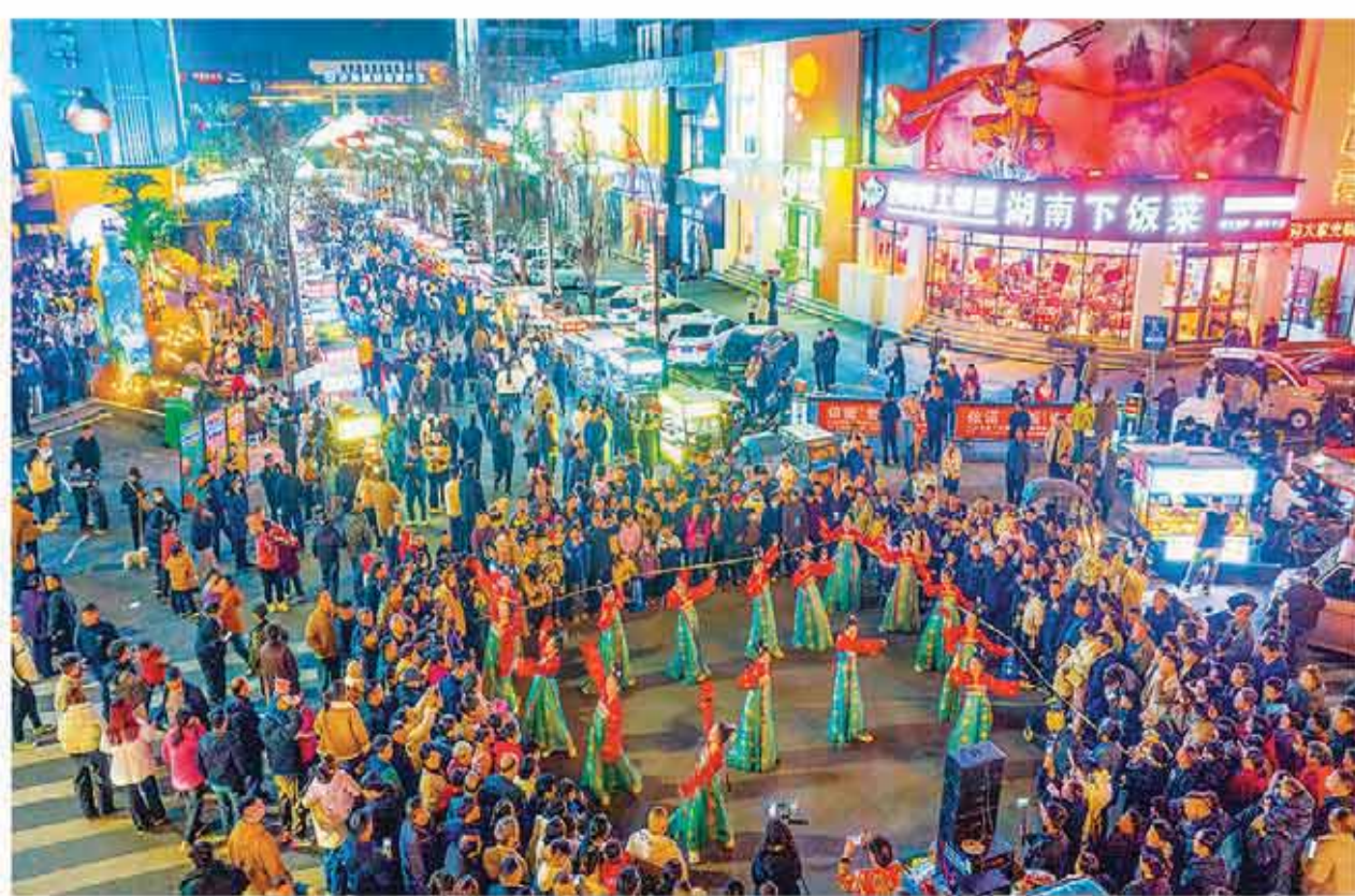
河南省洛阳市栾川县充分发挥文旅产业优势,打造提升了风凰天街、伊水路“一街三巷”等特色商业街区,通过植入音乐演出、街头演艺等元素,丰富消费场景,激活城市“夜经济”。图为近日,经过提升改造的栾川县罗庄美食街正式开街,现场人潮涌动,热闹非凡。

为进一步加强对关联交易的风险防控和合规管理,公告列明了属于关联交易价格明显偏低正当理由的四种情形。对于不在“正当理由”之列的情形,主管税务机关可以按规定调整纳税人的应税产品销售额。公告还同步明确了减免资源税的计算方法和管