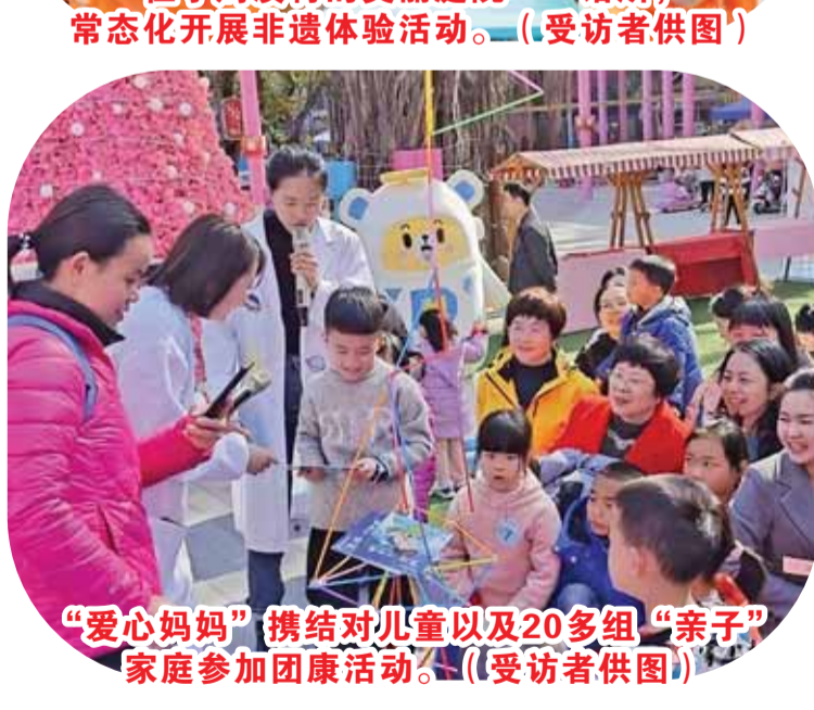
“爱心妈妈”携结对儿童以及20多组“亲子”家庭参加团康活动。

美丽庭院+”建设内涵，实现庭院“一时美”到“持续美”，让“庭院”成为“百千万工程”的幸福密码。截至目前，全区建设“美丽庭院”共856户，积极开展“美丽庭院”系列活动30多场次，约2600人参与。 一系列亮眼成绩随之而来：全区获评省级“美丽庭院”称号10户、省级“美丽庭院”村1个、省级“美丽庭院”特色村1个，以及市级“美丽庭院”20户、区级“美丽庭院”35户。如今，“美