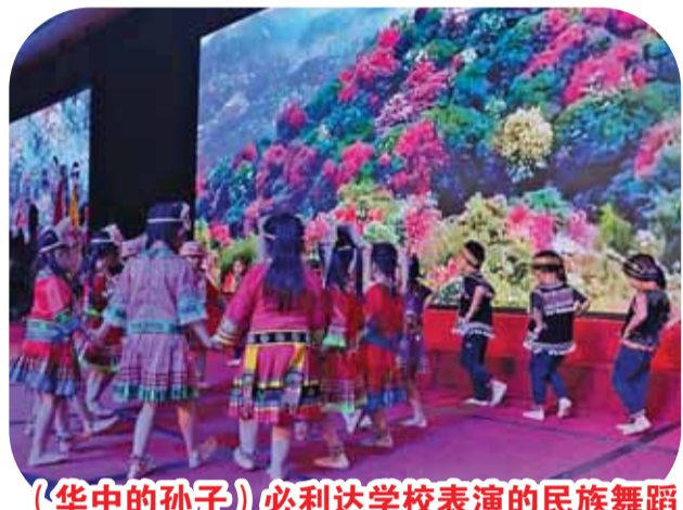
(华中的孙子)必利达学校表演的民族舞蹈