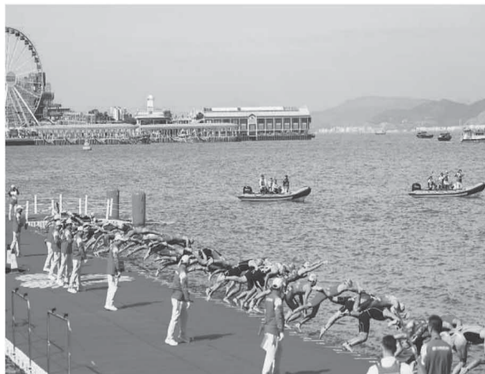
第十五届全国运动会铁人三项女子、男子个人比赛近日先后在香港中环海滨—维多利亚港举行。参赛选手需在维多利亚港游泳1.5公里，上岸后进行40公里的自行车赛，最后跑10公里到终点。选手比赛时途经多个香港地标，包括香港会议展览中心、特区政府总部、立法会综合大楼、香港摩天轮等。图为男子个人赛参赛选手跳入维多利亚港，开始游泳项目的竞速。

据悉，“书写抗战系列活动：民族浩气 翰墨千秋——2025两岸书画作品公益展”北京展将持续至12月7日。台湾展已于9月18日至10月13日在台中逢甲大学成功举办。