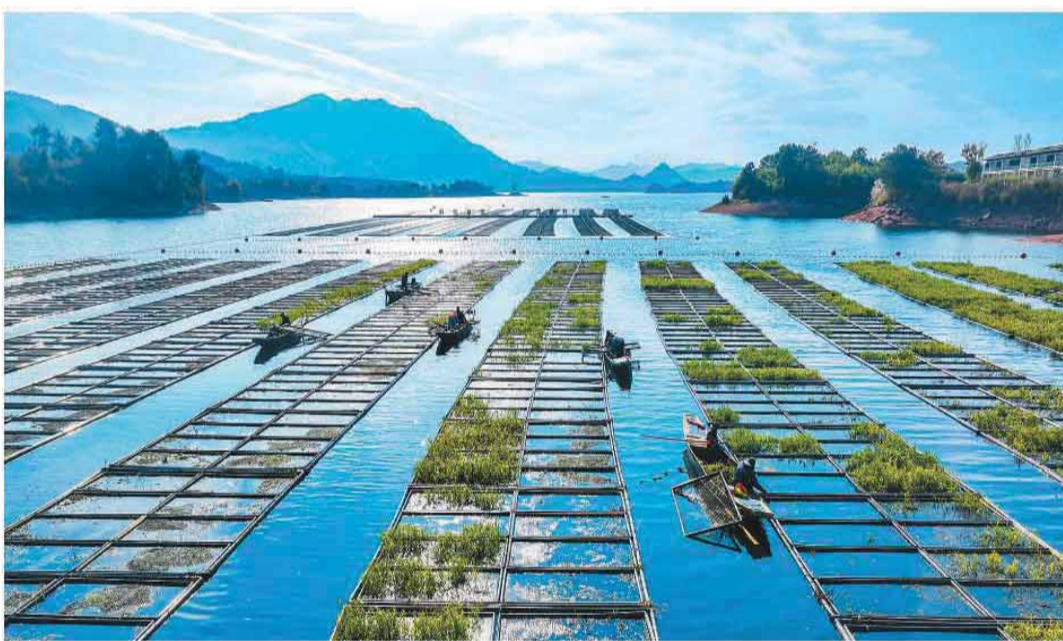
为保护千岛湖生态环境,浙江省杭州市淳安县积极运用生态浮岛水上植物无土栽培技术,增强上层水体的净化能力,进一步提升千岛湖水质。图为11月18日,淳安县千岛湖镇坪山水域生态浮岛上,工作人员在清理空心菜、修整加固浮床,为接种冬季水芹菜作准备。

坚持把马克思主义法治理论同中国法治建设具体实际相结合、同中华优秀传统文化相结合,创造性提出了关于全面依法治国的一系列新理念新思想新战略,形成了习近平法治思想。2020年11月召开的中央全面依法治国工作会议,确立了习近平法治思想在全面依法治国工作中的指导地位,这是我国