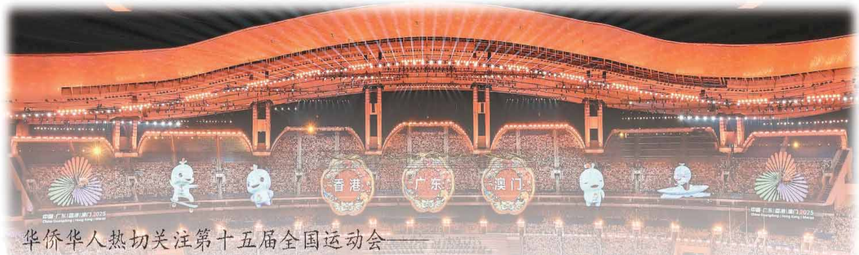
华侨华人热切关注第十五届全国运动会

据介绍，本次世界海南乡团联谊大会共有来自世界20多个国家和地区的3000多名海南乡亲出席，大会除了传承海南文化、共叙乡情外，也举办了多项专场活动，促进海南和东盟经贸合作。（据中新网电）