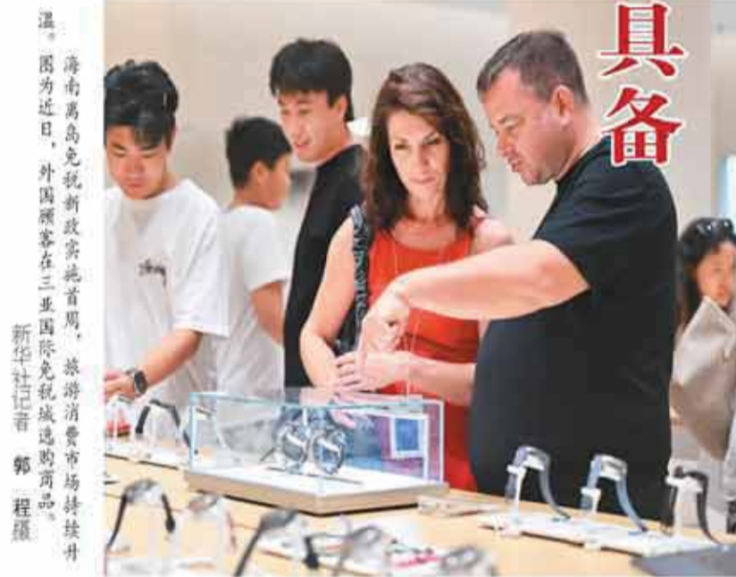
海南离岛免税新政实施首日，游客在免税店购物。图为近日，外国游客在三亚国际免税城选购商品。

潘城说，将扎实推进各项政策制度落地见效，加强政策宣传解读，助力更多市场主体享受政策红利，深入参与海南自由贸易港建设，全面做好监管模式准时切换准备，有效衔接封关前后政策，确保封关运作平稳有序，开局良好。