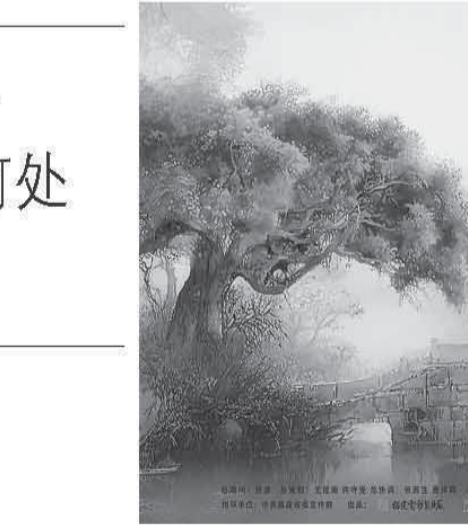
▲观众在现场体验古籍抄写。

如今的文澜阁《四库全书》，早已跨越时空界限。在第五单元“文澜重光，典藏全球”展区，可以见到文澜阁《四库全书》影印本“化身百千，遍藏四海”的新征程以及“四库学”研究的丰硕成果。从国家版本馆、国家图书馆到美国斯坦福大学、英国贝尔法斯特女王大学，文澜阁《四库全书》影印本已入藏全球上百家重要机构，成为中外文化交流的金色名片。