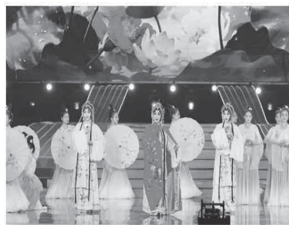
▲《举世无双·2025稀有剧种盛典》苏剧演出现场。