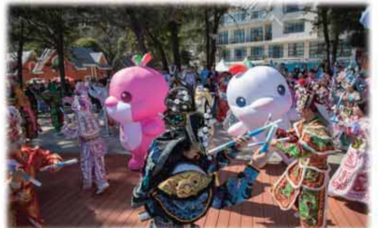
憨憨的大湾鸡与英姿飒爽的英歌很配。