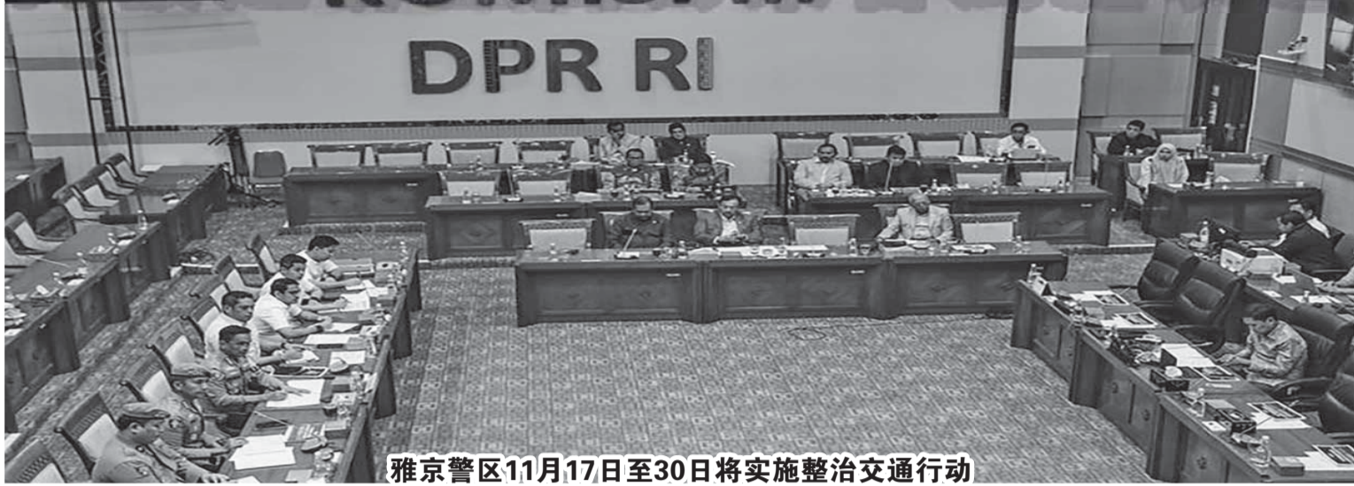
雅京警区11月17日至30日将实施整治交通行动

率。因此，鉴于刑事法典实施44年来未见重大变化，完成此次修订非常重要。如果这个问题在持续了近两年的进程中并没有获得解决，那么已经存在了44年的问题就不可能再解决了。刑事法典的修订是多方参与，旨在使刑事法典适