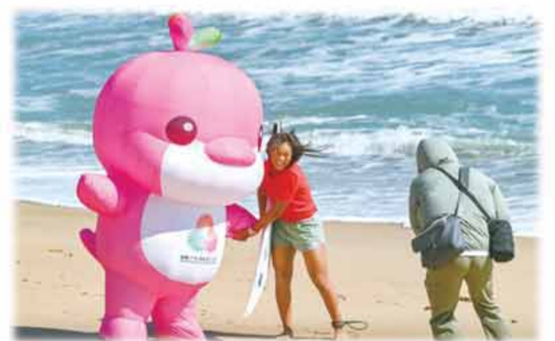
沙滩上,“喜洋洋”和“乐融融”为运动员们加油鼓劲。