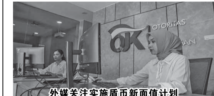
外媒关注实施盾币新面值计划

【本报讯】金融服务权威机构(OJK)强调对于面临支付网贷债务困难的人们采取合作态度的重要性。建议公众不要逃避，而是开放并直接与贷款公司沟通，以避免收债员在现场追债。