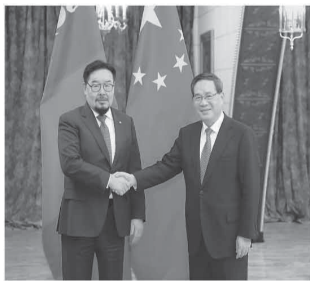
当地时间11月18日下午，国务院总理李强在莫斯科会见蒙古国总理赞登沙特尔。

本报莫斯科11月18日电（记者陈尚文、肖新新）当地时间11月18日下午，国务院总理李强在莫斯科会见蒙古国总理赞登沙特尔。