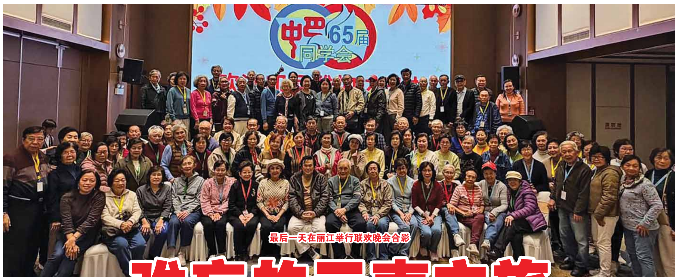
最后一天在丽江举行联欢晚会合影