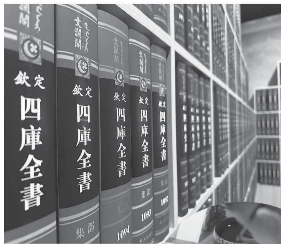
▲特展展示的文澜阁《四库全书》影印版。

作为中国古代规模最大的文献集成，《四库全书》不仅囊括了从先秦至清代乾隆以前中国历史上的主要典籍，而且涵盖了中国传统学术文化的各个学科门类各个专门领域，历来有“典籍总汇、文化渊藪”的美誉。