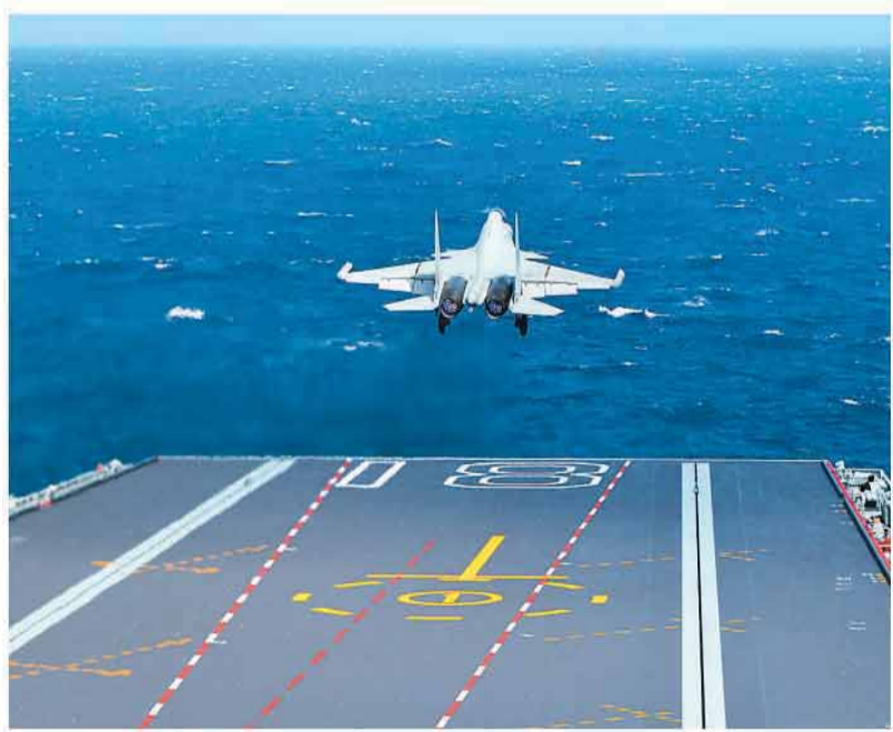
图为歼-15DT舰载机弹射起飞。