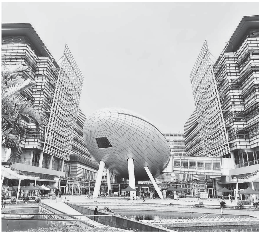
位于香港新界沙田区白石角吐露港沿岸的香港科学园，是香港最大的科技研发及企业孵化基地。

香港另一科创“重镇”香港数码港，对香港荣登《2025年世界数码竞争力排名》全球第四位也表示欢迎，认为这标志着香港已跻身全球最具数码竞争力的经济体前列。“数码港人工智能超算中心将提升两倍算力，数码港第五期