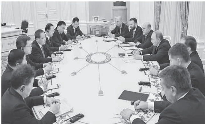
当地时间11月18日下午，国务院总理李强在莫斯科克里姆林宫会见俄罗斯总统普京。

本报莫斯科11月18日电（记者于宏建、陈尚文）当地时间11月18日下午，国务院总理李强在莫斯科克里姆林宫会见俄罗斯总统普京。