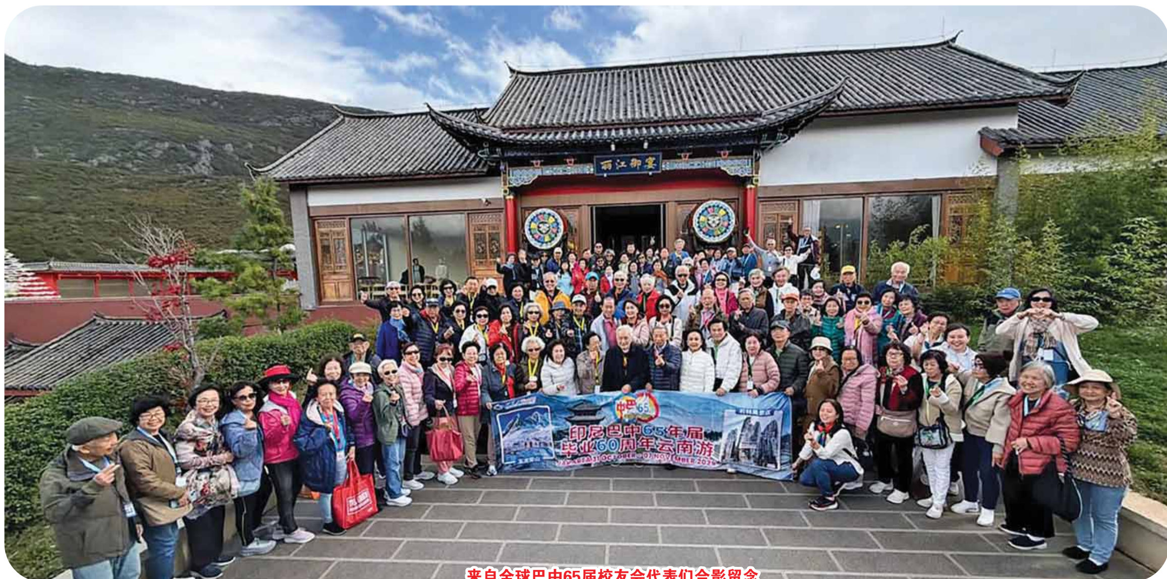
来自全球巴中65届校友会代表们合影留念