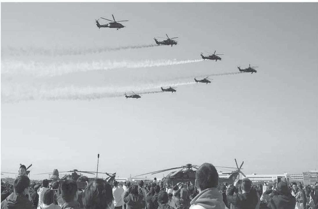
10月18日，第七届中国天津国际直升机博览会迎来公众开放日，陆军“风雷”飞行表演队进行特技飞行表演，为现场观众献上一场视觉盛宴。