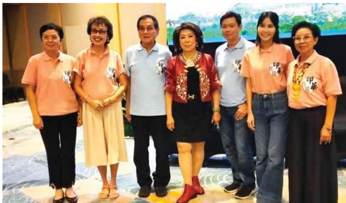
香港著名作家东瑞也在印华作协于楠榜举办的文学讲座会上成为主讲人