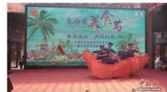
圖為2025英德華僑茶場文化藝術節暨東南亞美食嘉年華現場。