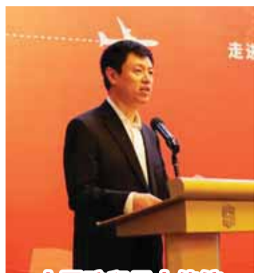
中国驻印尼大使馆陈武参赞致辞