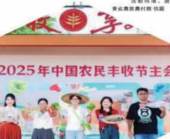
活動現場。

廣東省慶祝2025年中國農民豐收節主會場活動9月28日在肇慶高要舉行，集中展現廣東深入實施“百縣千鎮萬村高質量發展工程”取得的農業發展新成就、農村面貌新變化和農民幸福新生活。 活動現場打造了“豐收集市”，設置廣東21個地市農特產品展區、肇慶8縣(市、區)產品展區和高要產品展區，讓民衆“一站式”嘗遍嶺南“豐”味。肥美的高桂蝦、奇香的菠蘿蜜、咸甜兩味的賀家糕……各地“土特產”集中亮相，通過現場電商、媒體的直播鏡頭拓展銷路。