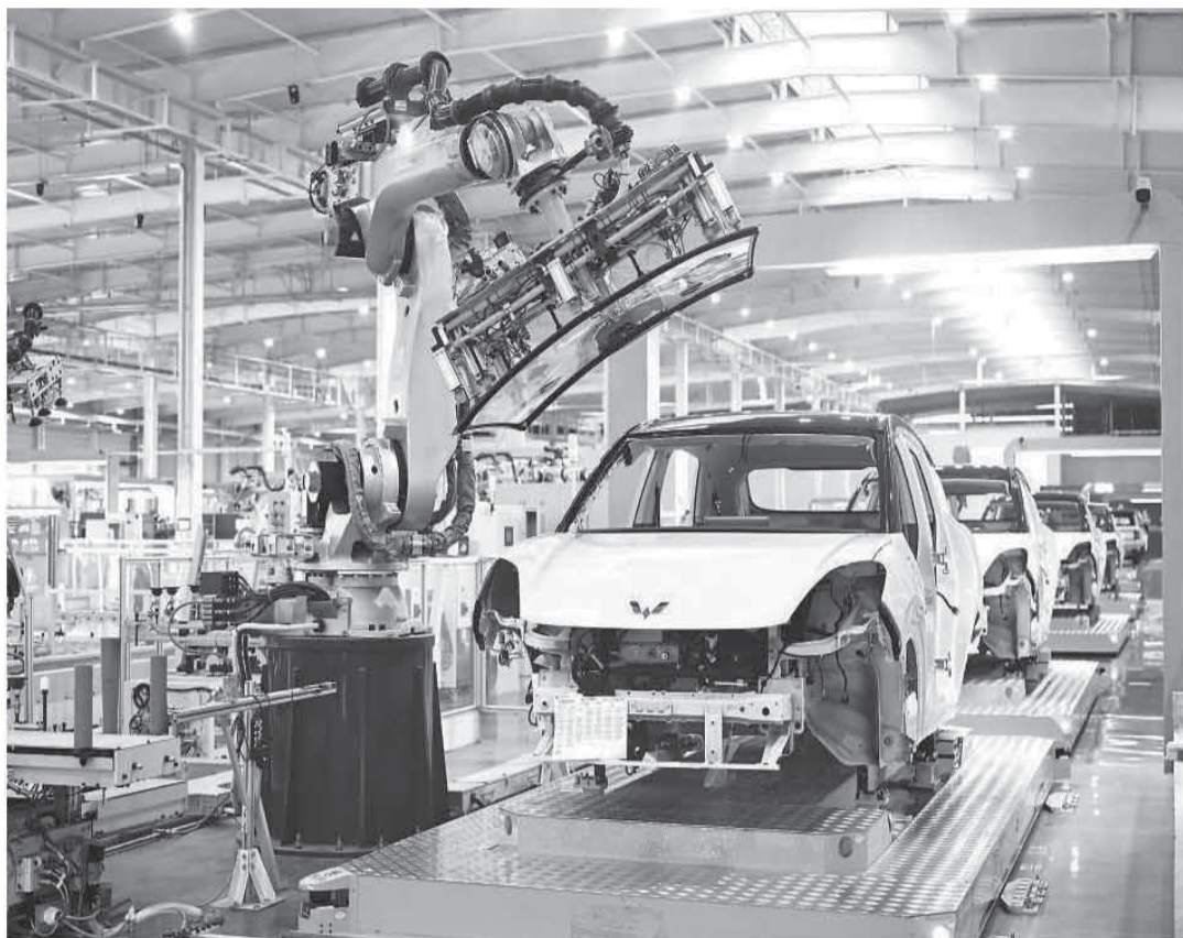
9月9日，广西柳州上汽通用五菱智能岛式制造工厂里忙碌的自动化生产线。