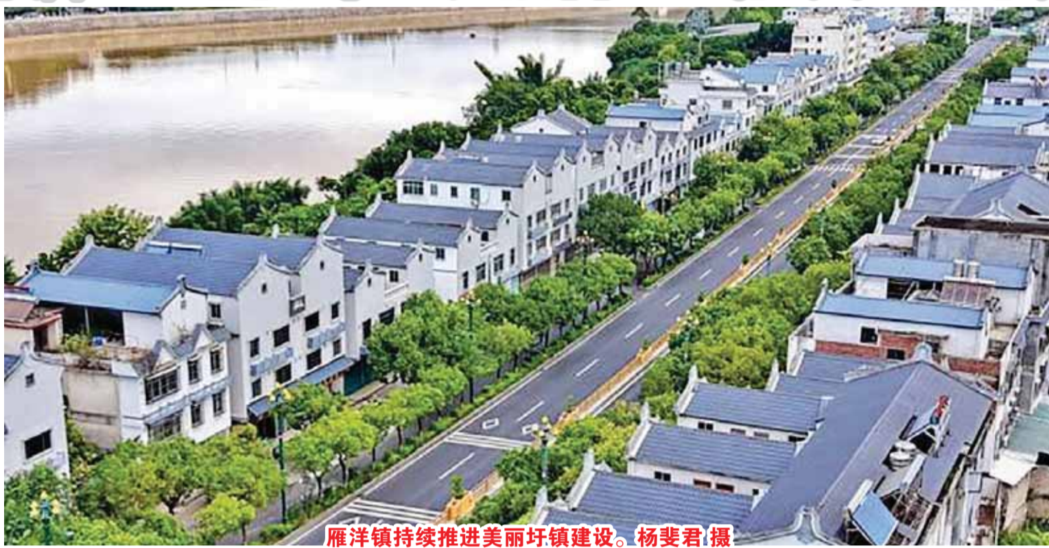
雁洋镇持续推进美丽圩镇建设。