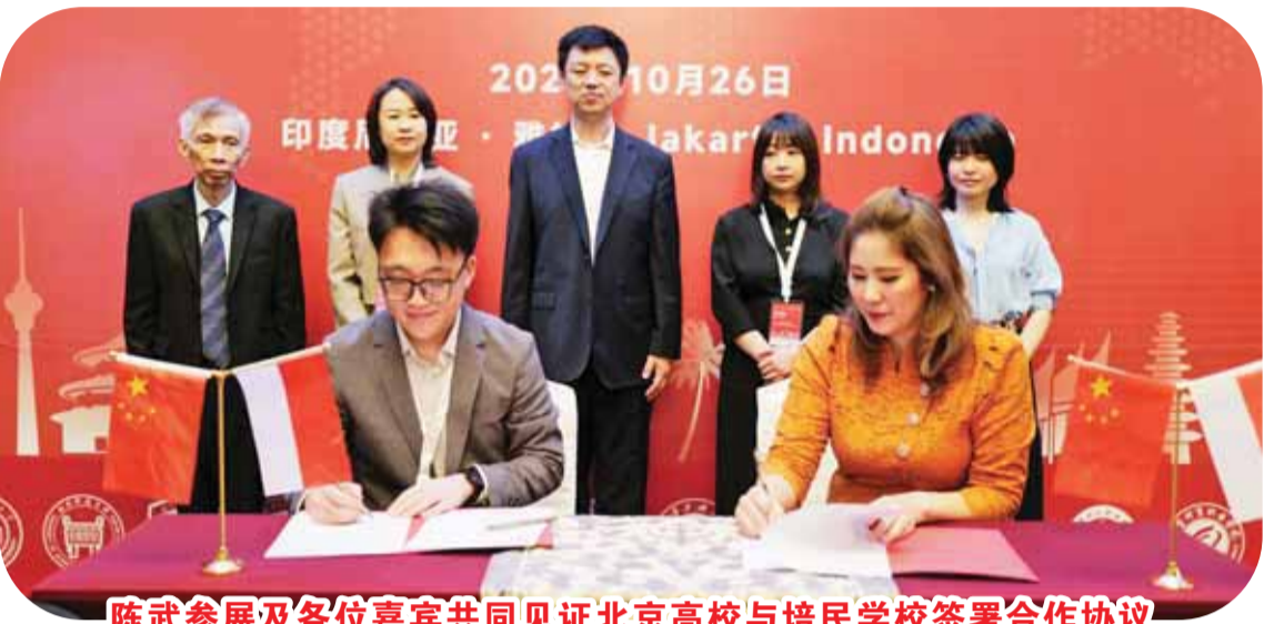
陈武参展及各位嘉宾共同见证北京高校与培民学校签署合作协议

2025年10月26日，印尼第十届HSK留学中国与就业展暨“留学北京”专题教育展在雅加达隆重开幕。此次展会由汉考国际、北京市教育委员会、北京市国际教育交流中心联合主办、印尼雅加达华文教育协调机构（简称“雅协”）承办，北京大学、清华大学、北京师范大学等近30所中国高校和中资企业参展，吸引了2800名来自印尼全国各省市的HSK考生、中文学习者、家长及社会各界人士前来。 开幕式上，中国驻印尼大使馆陈武参赞在致辞中肯定了展会的十届成果，印尼HSK留学中国与就业展从首届的蹒跚起步到如今的规模盛大，现已