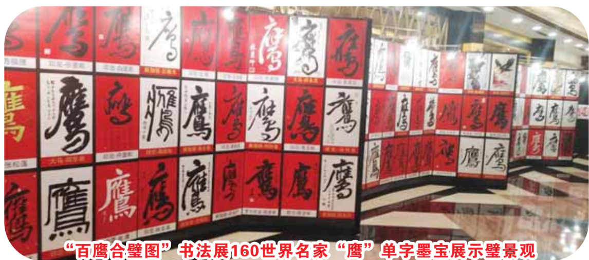
“百鹰合璧图”书法展160世界名家“鹰”单字墨宝展示壁景观