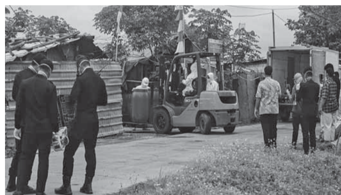
万丹省芝甘德工业区22家受辐射工厂完成清理

【本报讯】铯137处理工作组 (CS-137) 继续加强万丹省西冷县 (Serang) 芝甘德 (Cikande) 工业区和住宅区的缓解和净化工作。