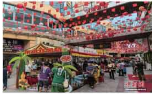
圖為2025英德華僑茶場文化藝術節暨東南亞美食嘉年華現場。

2025英德華僑茶場文化藝術節暨東南亞美食嘉年華(以下簡稱“活動”)10月1日在清遠英德市東華鎮開幕。活動現場，隨著印尼馬魯古民族舞的激昂鼓點響起，現場氛圍瞬間被點燃。英德千島彩虹藝術團的舞者們身著艷麗民族服飾，以原始靈動的舞姿再現印尼海島風情；領舞藝術中心的傣族舞則以柔美身段勾勒出中華多元文化的交融之美；男生獨唱《梭羅河》旋律悠揚，將歸僑的鄉愁與眷戀娓娓道來。10餘個文藝節目輪番上演，生動再現了歸僑們“將他鄉藝術融入家鄉，使之成為新故鄉一部分”的文化融合歷程。