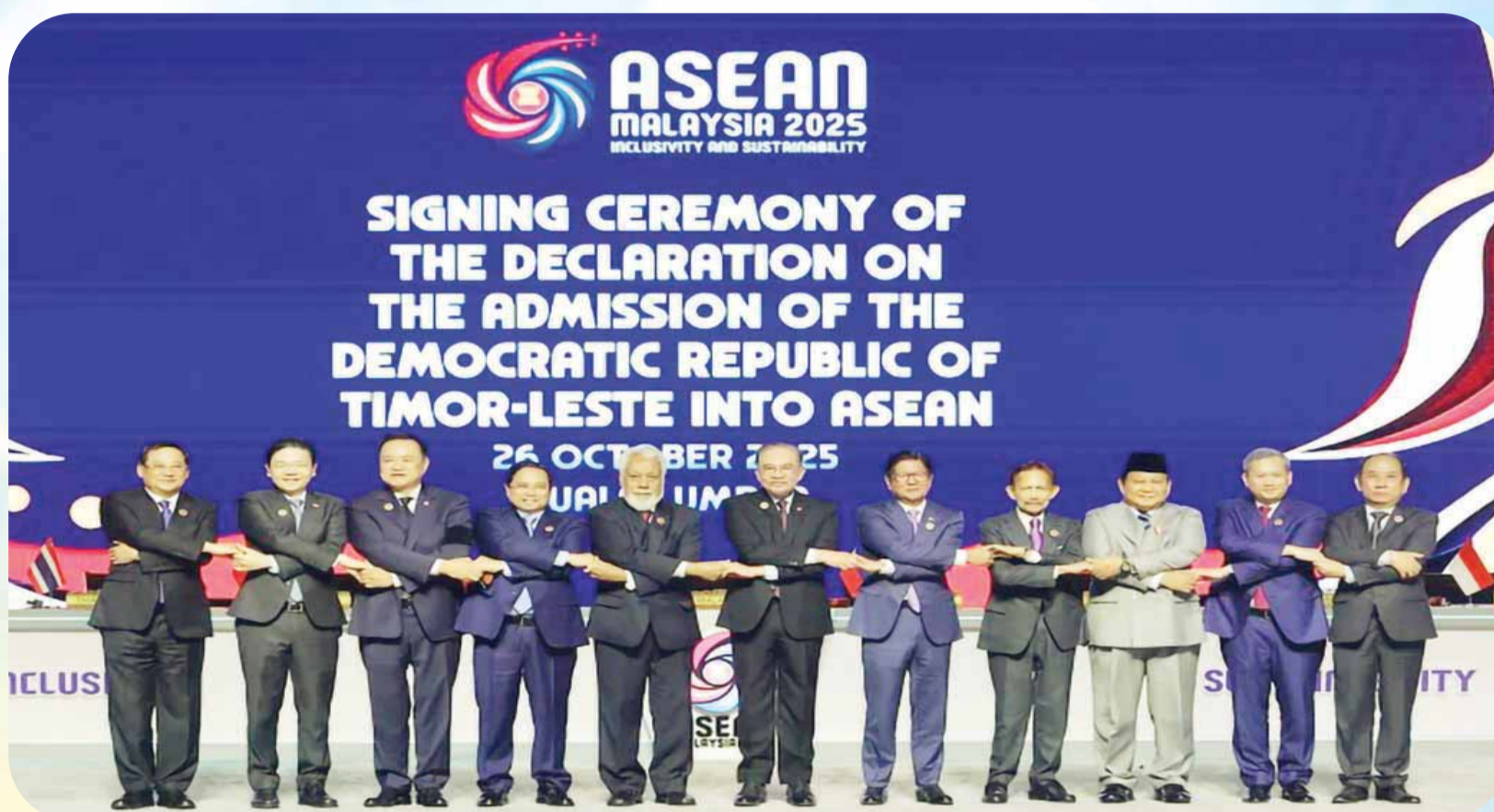
東帝汶總理沙納納·古斯芒(左五)與東盟各國領導人合影。出席者包括印尼總統普拉博沃·蘇比安托、新加坡總理黃循財、越南總理範明政、柬埔寨總理洪瑪內、馬來西亞總理安瓦爾、菲律賓總統小馬科斯、文萊蘇丹哈桑納爾·博爾基亞以及老撾總理宋賽·西潘敦。