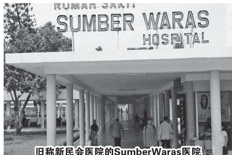
旧称新民会医院的SumberWaras医院

区省长普拉莫诺确保雅加达专区省政府在雅加达西区 Sumber Waras 医院拥有的土地不再存在法律问题。这片土地具有明确的法律地位，很快就会用于建设A型医院。