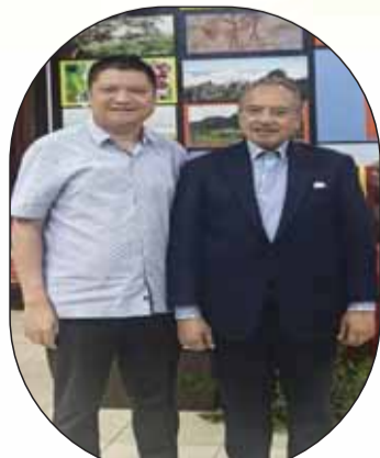
黎發芳第一副總理和李飈董事長合影留念