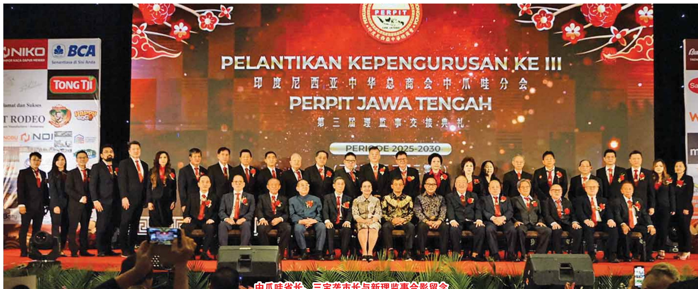
中爪哇省长、三宝壟市长与新理监事合影留念