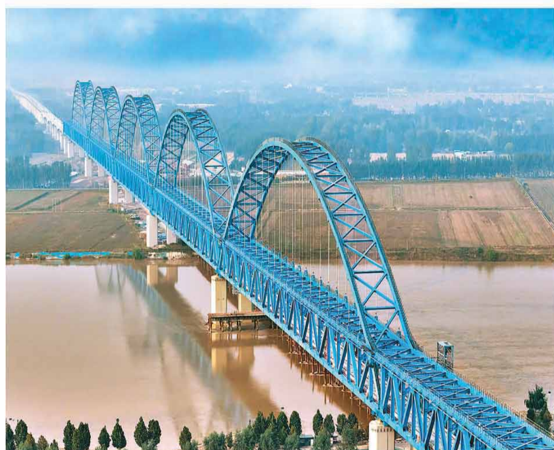
京港高铁(安)商(丘)段黄河特大桥位于山东省梁山县与河南省台前县之间。近日,随着最后一块CRTSⅢ型无砟轨道板顺利铺设就位,该桥无砟轨道工程全部完工,为后续铺轨作业奠定坚实基础。

当14亿多人民的磅礴力量被激发出来、汇聚起来,以中国式现代化全面推进强国建设、民族复兴伟业必将不断开创新局面。