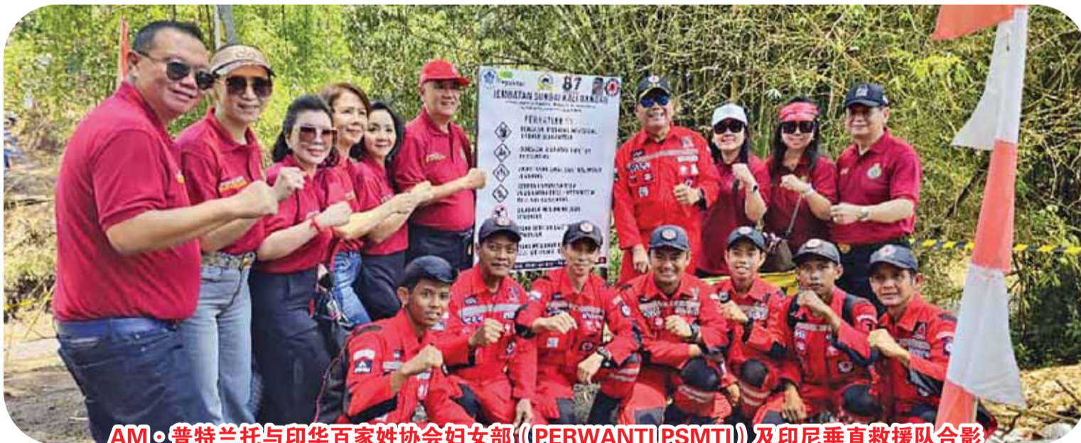
AM·普特兰托与印华百家姓协会妇女部((PERWANTI|PSMTI))及印尼垂直救援队合影