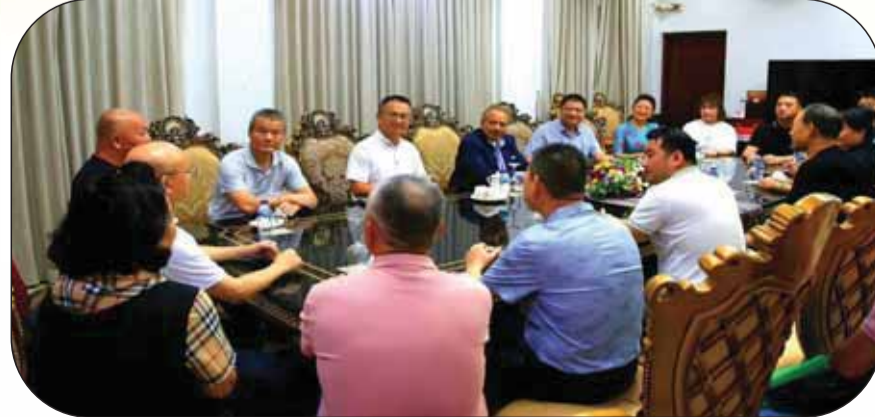
黎發芳第一副總理親切接見李飈 熊文勝何城坤等率領的經貿代表團一行 在總理府合影留念