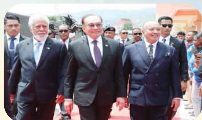
馬來西亞總理安瓦爾對東帝汶進行國事訪問，抵達帝力機場時受到東帝汶總理沙納納·古斯芒及第一副總理黎發芳的熱烈歡迎。