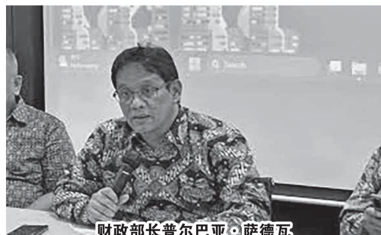
财政部长普尔巴亚·萨德瓦

的问题引起的。在上层，问题通常是由于电信公司 (Telkom) 的互联网网络仍然不是最佳的，这会导致超时或用户侧的登录问题。