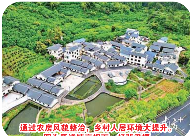
通过农房风貌整治，乡村人居环境大提升。图为雁洋镇高视下。杨斐君摄