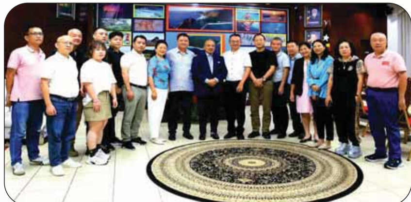
黎發芳第一副總理親切接見李飈 熊文勝何城坤等率領的經貿代表團一行 在總理府合影留念