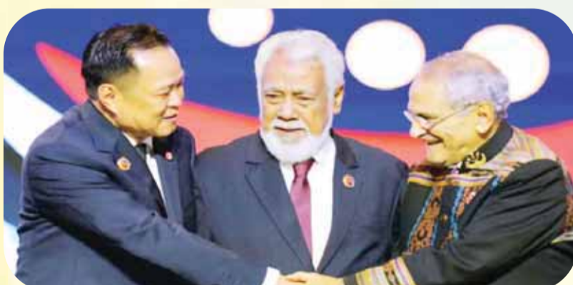
東盟秘書長高金洪在吉隆坡第四十七屆東盟峰會上，向東帝汶總理沙納納·古斯芒及總統奧爾塔表示祝賀，慶賀東帝汶正式成為東盟成員國。