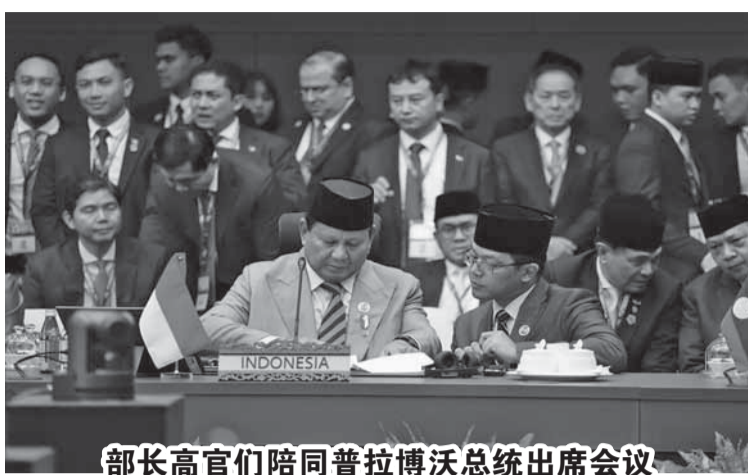
部长高官们陪同普拉博沃总统出席会议

峰会上鼓励的信息之一是东盟作为面对地缘政治条件和保护主义的基础的中心地位和团结精神。我国还强调了东盟在各种挑战中确保其人民福祉的重要作用。东盟必须能够保持地区稳定，同时成为地区经济增长的主要驱动力。因此，东盟国家之间的贸易需要加强，投资增加，所有区域的社区和商业行为者必须平等地感受到经济一体化的好处。贸易部长陪同普拉