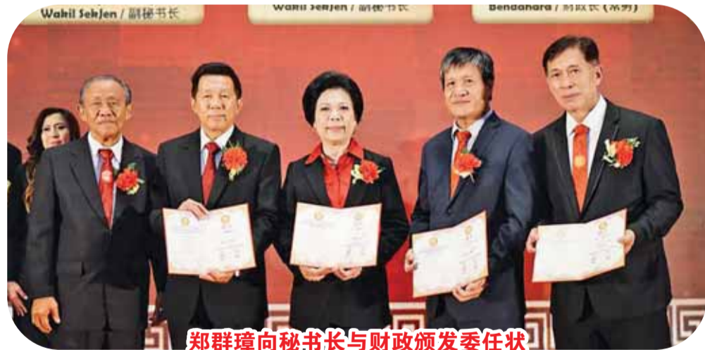
郑群璋向秘书长与财政颁发委任状