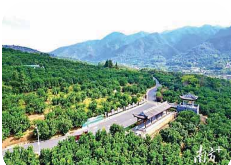
雁洋镇正推动农文旅深度融合。图为金柚公园。