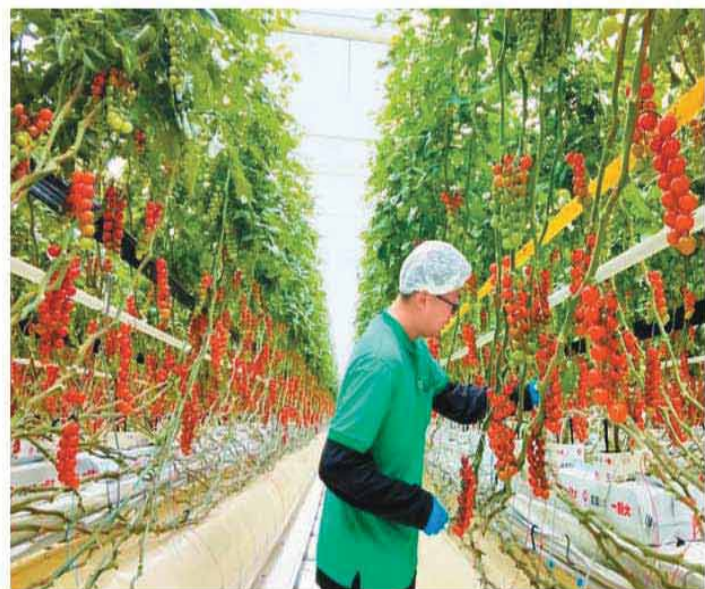
山东省东营市利津县大力发展现代农业，建成智慧农业产业园，实现无土栽培、滴箭灌溉、熊蜂授粉等多项技术突破，较传统大田种植节水节肥效果显著。截至今年8月底，园区农作物产量达1600吨，有力带动当地农民增收。图为工作人员在采摘樱桃番茄。

根据《报告》，“十五五”期间，全国电气化率将以年均约1个百分点的增幅保持增长态势，预计到2030年，全国电气化率将达到35%左右，超出OECD（经济合作与发展组织）国家平均水平8至10个百分点。