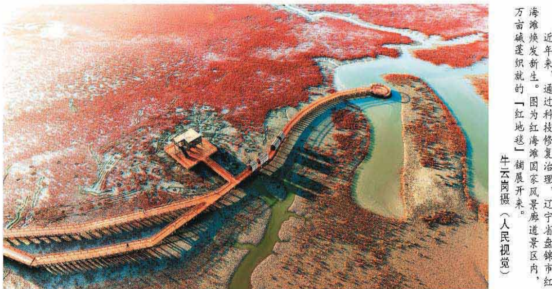
近年来,通过科技修复治理,辽宁省盘锦市红海滩焕发新生。图为红海滩国家风景廊道景区内,万亩碱滩织就的“红地毯”“铺展开来”。