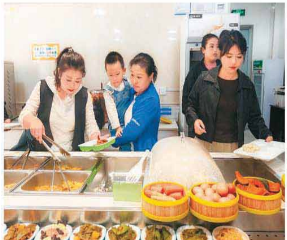
吉林省临江市创新社区服务模式，打造一刻钟便民生活圈，目前已覆盖全市22个社区。图为市民在临江市建设街道社区餐厅用餐。

商务部表示，将与有关部门一起，把居民所需所盼、急难愁盼作为便民生活圈建设的出发点和落脚点，努力把便民的“需求清单”转化为“满意清单”，真正把一刻钟生活圈建成社区居民生活的“幸福圈”。