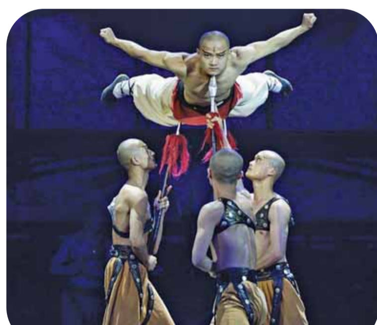
爆款舞台功夫剧《功夫传奇2》剧照。

由中国旅游集团倾力打造的爆款舞台功夫剧《功夫传奇2》,将于10月1日在泉州古城西街钟楼旁的泉州影剧院震撼上演。《功夫传奇》全球演出已超万场,有着成熟的艺术水准和广泛受众。这场融合国际IP基因与本土文化精髓的视听盛宴,将为市民游客带来别样的假期文化体验。