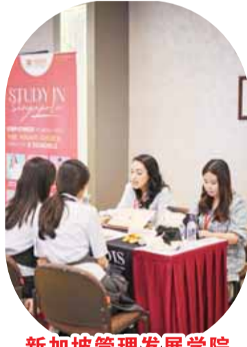
新加坡管理发展学院