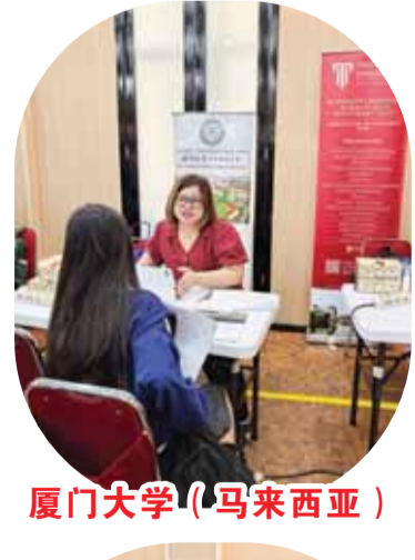
厦门大学(马来西亚)