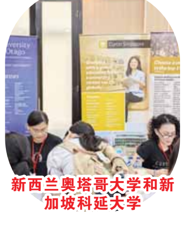
新西兰奥塔哥大学和新加坡科廷大学