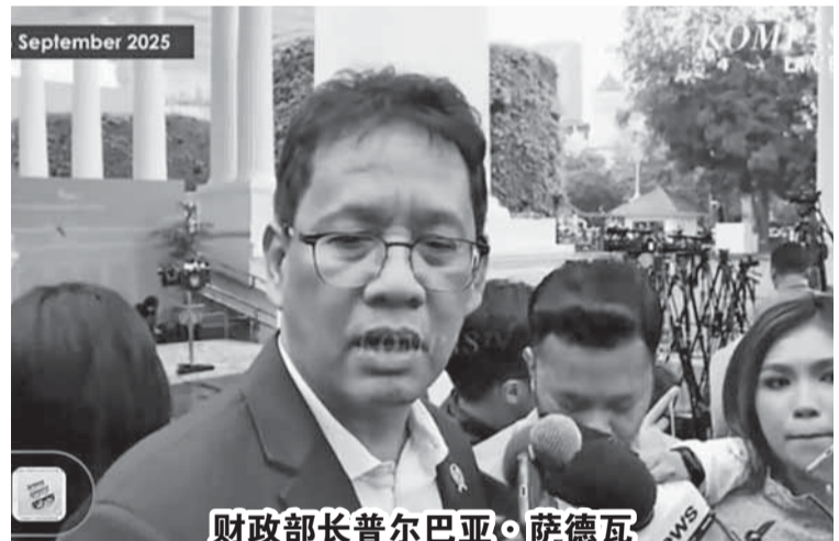
财部长普尔巴亚·萨德瓦

【本报讯】财部长普尔巴亚·萨德瓦(Purbaya Yudhi Sadewa)于9月23日强调，200名逃税者在下周之内务必向国家缴纳纳税义务。