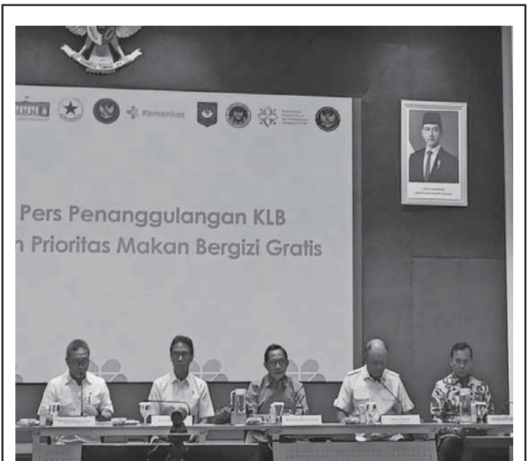
商讨食物中毒事件应对方案 9月28日，内政部长迪托 (Tito Karnavian) 声称，他已经与全国各地的省区和市县区首长举行会议，商讨关于某些免费营养餐厨房造成食物中毒事件的应对方案。