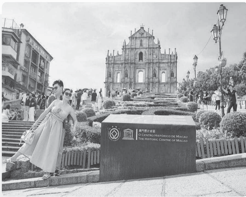
▲ 游客在澳门大三巴牌坊前游览。 ▼ 游客在澳门历史城区游览。