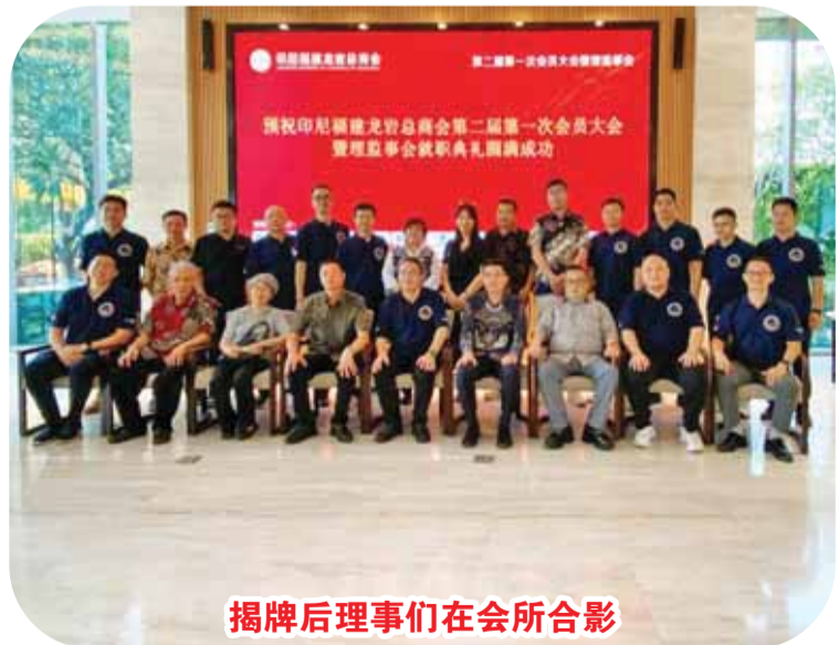
揭牌后理事们在会所合影