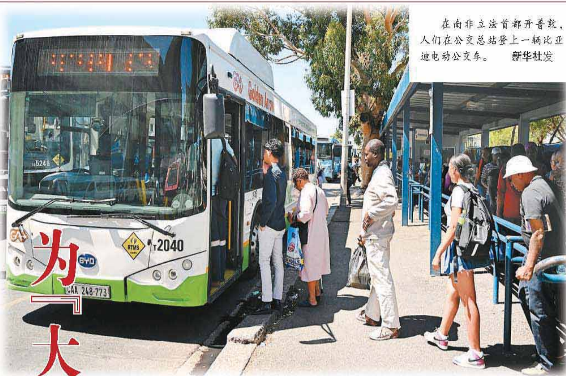
在南非立法首都开普敦，人们在公交总站登上一辆比亚迪电动公交车。

全球治理倡议的提出正当其时。因为全球南方崛起是一个公认的事实，此时中国提出全球治理倡议更有底气。发展中国家如果能够更好地相互抱团、集体行动，有利于真正改变全球治理中的不公平现象，在全球发展各领域里发出更多声音。