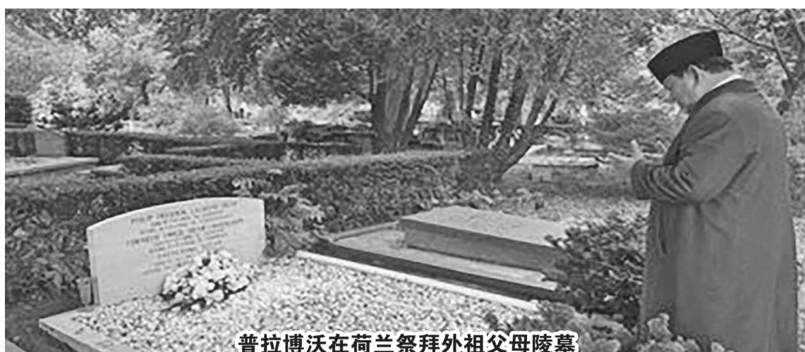
普拉博沃在荷兰祭拜外祖父母陵墓

普拉博沃写道，在对荷兰王国进行正式国事访问的间隙，我争取时间前往海牙的 Oud Eik en Duinen 公墓祭拜外祖父母。在这里，躺着我的外祖父母，是我母亲多拉·玛丽·西雷加尔的父母，即已故的菲利普·弗雷