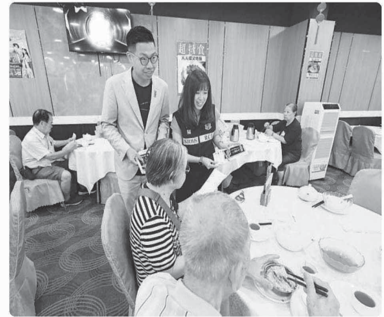
▲ 工作人员在餐厅向市民宣传控烟措施。

“‘无烟香港’已是社会主流呼声，相关控烟措施是保护下一代的重要举措。”香港特区政府医务局局长卢克敏表示，特区政府将确保各项控烟措施落实到位，进一步减少烟草使用、降低二手烟危害，同时在学校和社区加强控烟宣传教育，减轻烟草对公众健康的威胁。期待同社会各界一道，共同推动实现“无烟香港”的愿景。