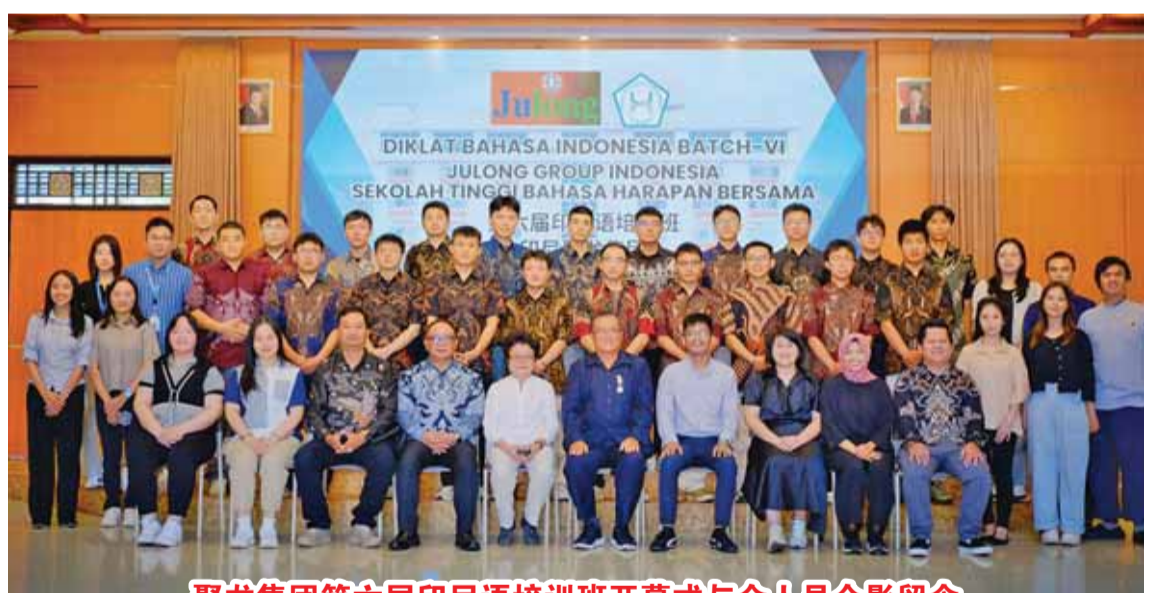
聚龙集团第六届印尼语培训班开幕式与会人员合影留念