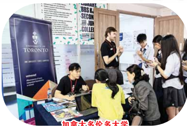
加拿大多伦多大学