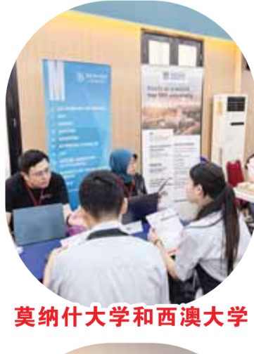
莫纳什大学和西澳大学