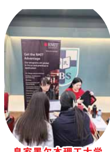
皇家墨尔本理工大学