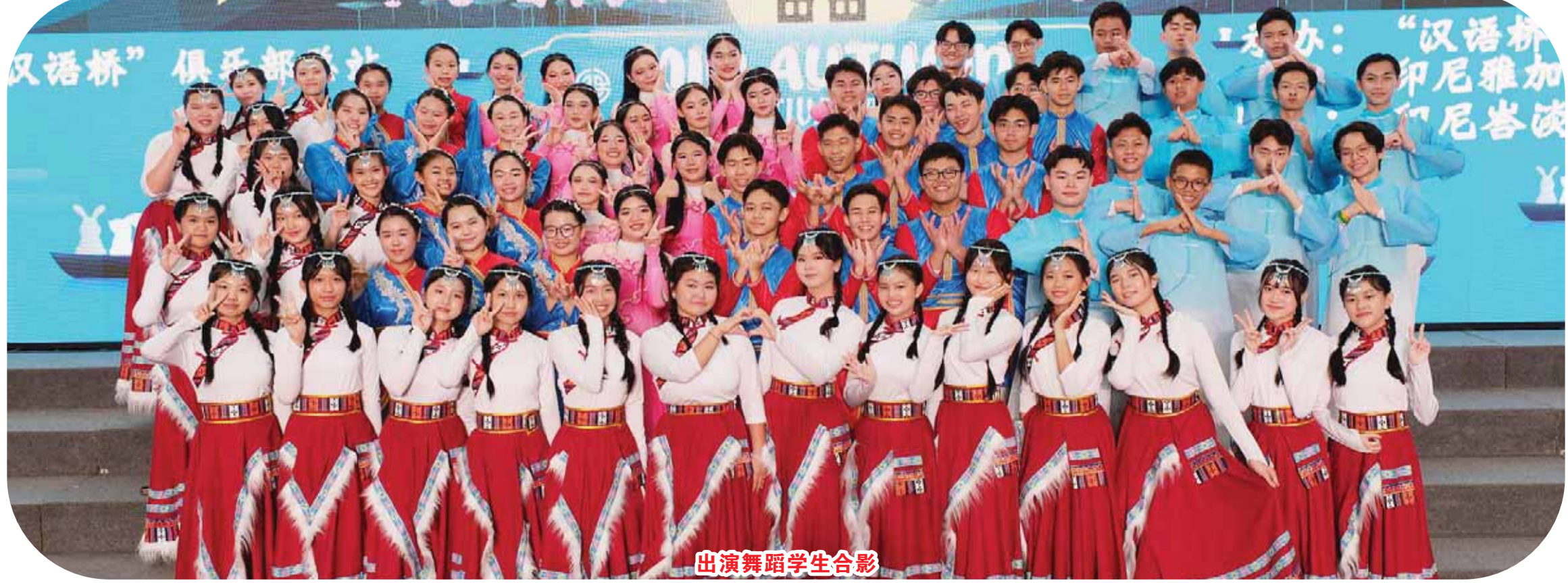
出演舞蹈学生合影