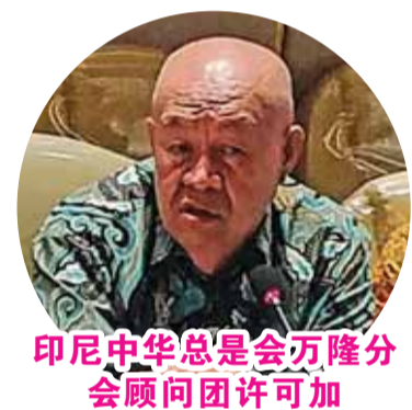
印尼中华总会万隆分会顾问团许可加