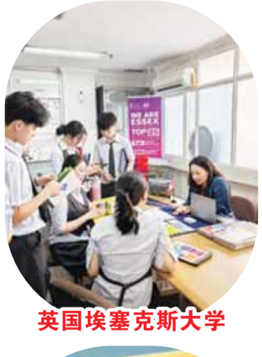
英国埃塞克斯大学