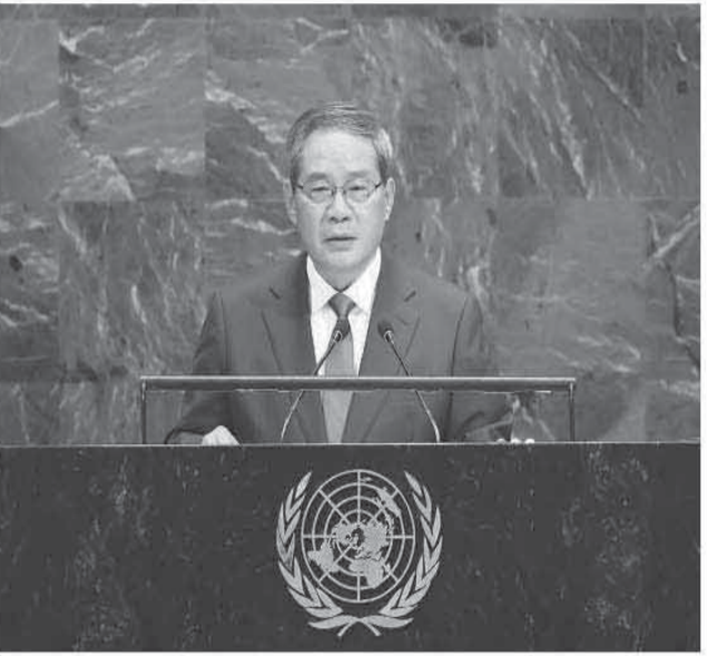
当地时间9月26日,国务院总理李强在纽约联合国总部出席第80届联合国大会一般性辩论并发表讲话。