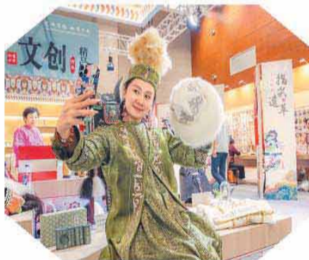
9月22日，游客在敦煌文博会上的一个展览现场身穿民族服饰自拍。