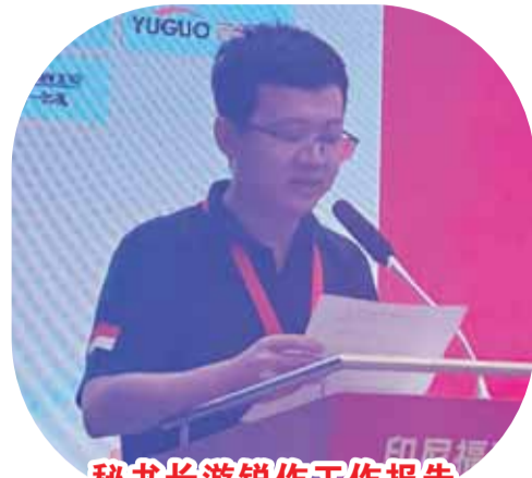
秘书长游锐作工作报告