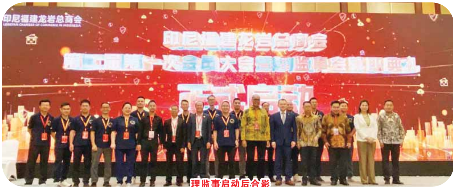
理监事会启动后合影