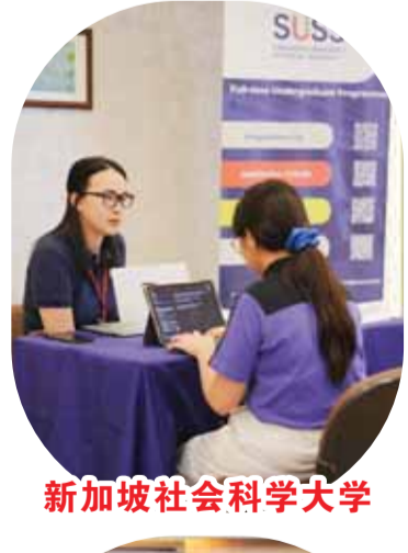
新加坡社会科学大学