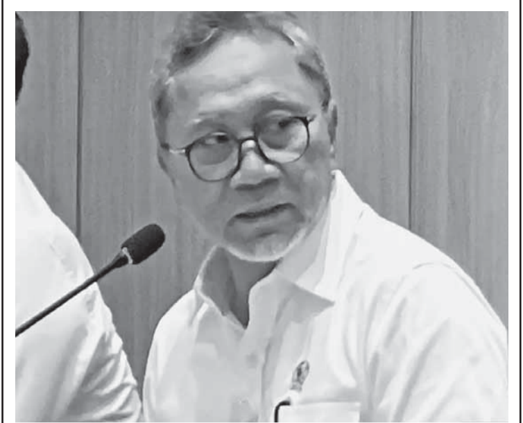
政府关闭造成人们中毒的免费营养餐厨房 9月28日，粮食统筹部长祖基菲 (Zulkifli Hasan) 声称，政府已经关闭了造成人们食物中毒的免费营养餐厨房。

拿大承诺将对印尼大约90.5%商品取消进口关税，而印尼也将对加拿大85.8%商品给予零关税。因此到了2030年期间，预计印加全面经济伙伴关系协定的实施，印尼对加拿大的出口值将达到118亿美元或约合197.7万亿盾，国内生产总值将增加0.12%，以及投资也增长0.38%。 除了为经济带来效益之外，上述自贸协定也将确保监管透明、保护投资，并加强中小微企业的作用、数字市场、知识产权以及可持续贸易等领域的合作。 (Sm)