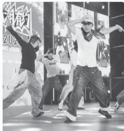
▼ 两岸高校青年街舞大赛现场。

活动中，来自台湾的青年舞者还参加了台湾大师沙龙活动，并来到中山陵、秦淮风光带、门东、夫子庙等地参访，在交流中增进理解、深化友谊。