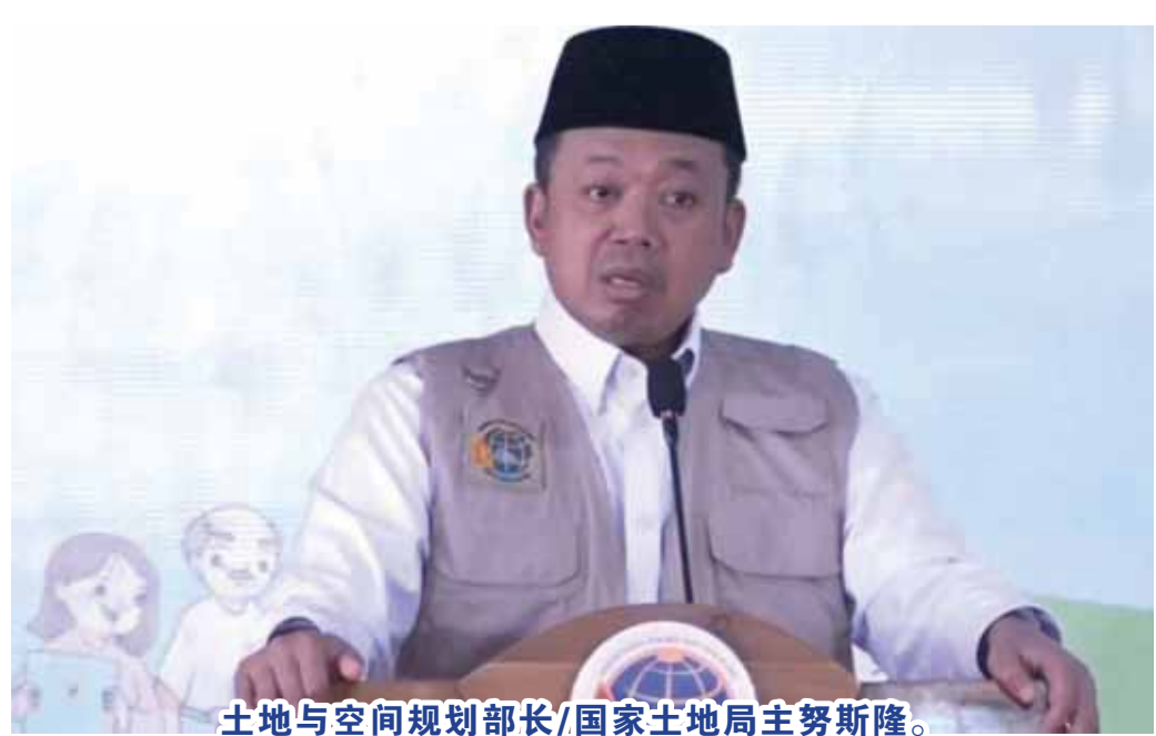
土地与空间规划部长/国家土地局主努斯隆。