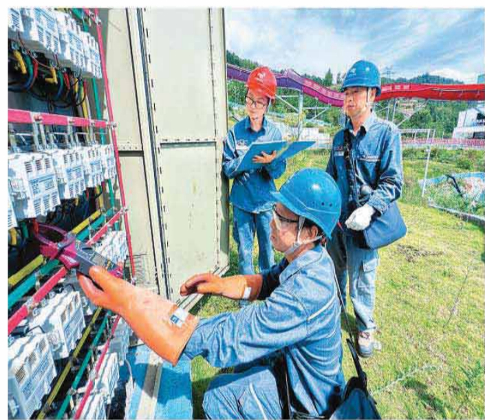
国庆、中秋假期临近，南方电网贵州供电局组织运维人员对旅游景区、充电站以及550余条重点线路进行巡视、维修，全力保障人民群众安全稳定用电。图为在贵阳市息烽县南山驿站巡视微水上游，该供电局工作人员对配电箱进行检测。

数据显示，1—8月，全国新增发电装机容量达34516万千瓦，比上年同期多投产13520万千瓦。其中风电新增装机5784万千瓦，比上年同期多投产2424万千瓦；太阳能发电新增装机23061万千瓦，比上年同期多投产9062万千瓦。1至8月，太阳能、风电新增装机合计超2.8亿千瓦。