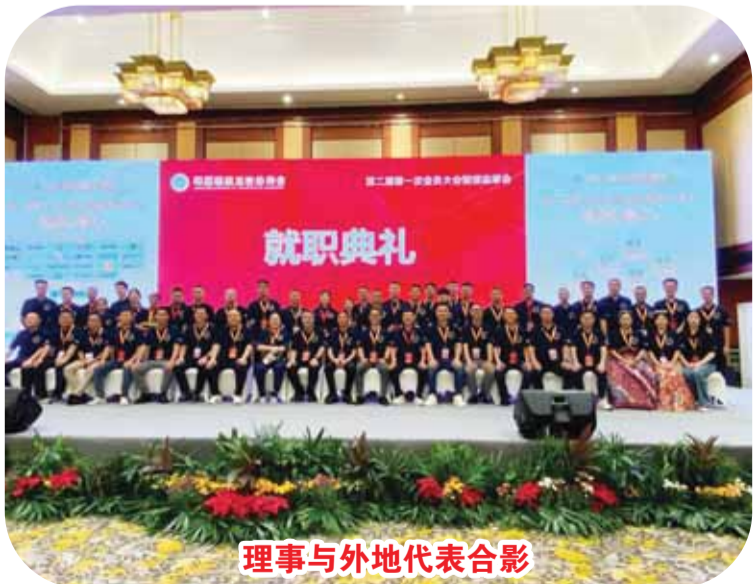
理事与外地代表合影