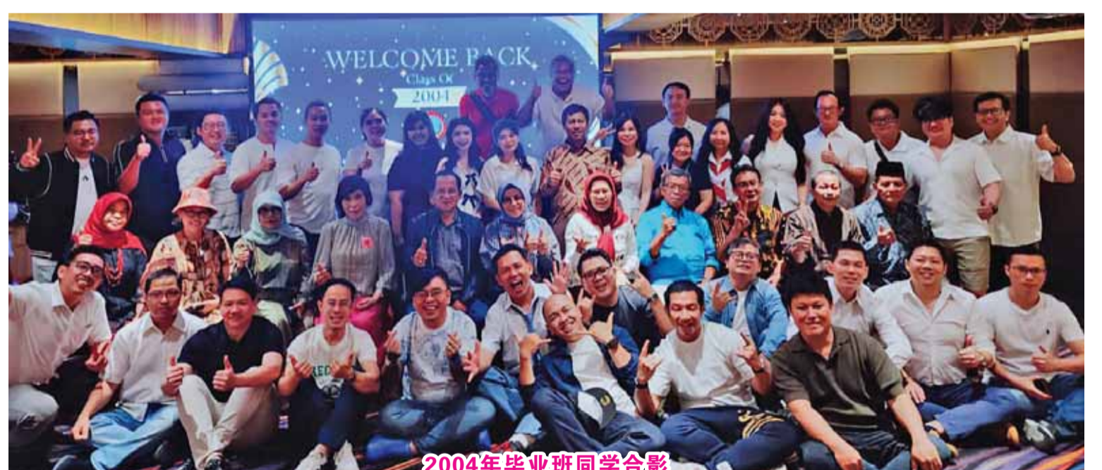
2004年毕业班同学合影

晚会节目丰富多彩, 有趣味游戏和幸运抽奖。老师们在和谐愉快氛围中与昔日的学生交流, 几个同学都说: “老