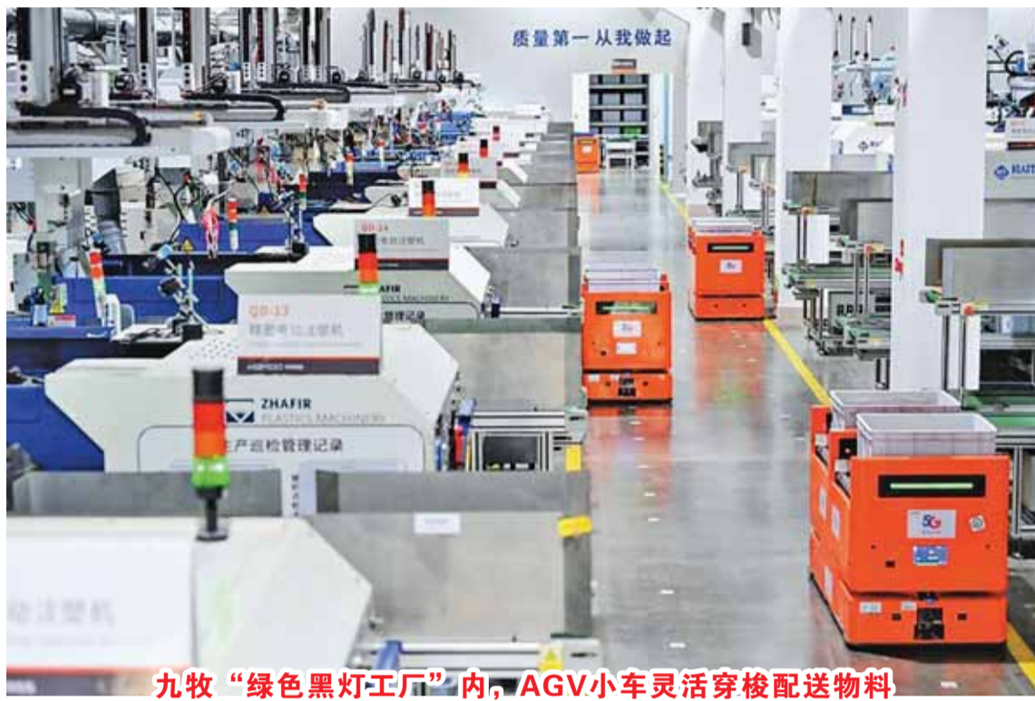
九牧“绿色黑灯工厂”内，AGV小车灵活穿梭配送物料

传统产业的创新实践，正是南安筑强科创平台、深化院企合作、释放人才创新动能的生动缩影。近年来，南安创新政校企产学研合作模式，揭牌科技人才创新中心、华侨大学南安智能制造研究院暨福建省工程硕博联合培养