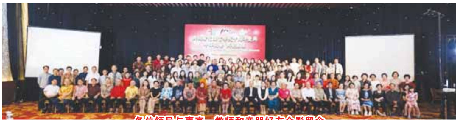
各位領導與嘉賓、教師和親朋好友合影留念

言學院的領導和教師及所有行政人員、學生會成員等等都出席了本次活動，大家歡聚一堂，共同見證這一具有里程碑意義的時刻。由於局勢有些波動，有的單位或友好人士不得不取消出席，但都特地寄來了賀信和祝福花牌，真情實意令人感動。 慶典在莊嚴的禱告儀式中拉開序幕，隨後全場齊唱印度尼西亞國歌和共同希望語言學院校歌，悠揚的旋律回蕩在禮堂，点燃了現場每個人的熱情。 學生合唱團領唱國歌校歌後，接着為大家獻唱了《世界贈予我的》與中印文版的《椰島之歌》，然後大家合影留念。這時，一個設計精美的十周年生日蛋糕被緩緩推到舞台中央。蛋糕造型別致雅觀，象征著學院十年的輝煌歷程與美好未來。學院領導和嘉賓一起上前，圍繞著共同切下蛋糕，與現場嘉賓分享甜