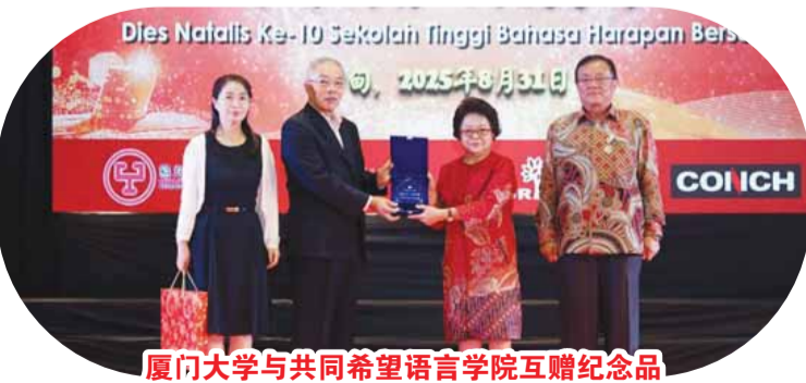
廈門大學與共同希望語言學院互贈紀念品