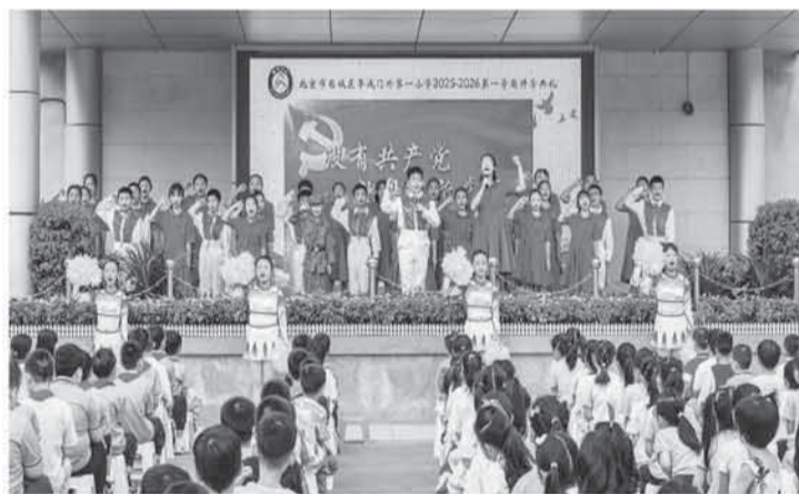
9月4日，北京市西城区阜成门外第一小学举行开学典礼。阜成门外一小建校75周年一直坚持以德育人，这是开学典礼上学生们正在演唱《没有共产党就没有新中国》。