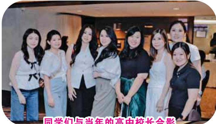
同学们与当年的高中校长合影