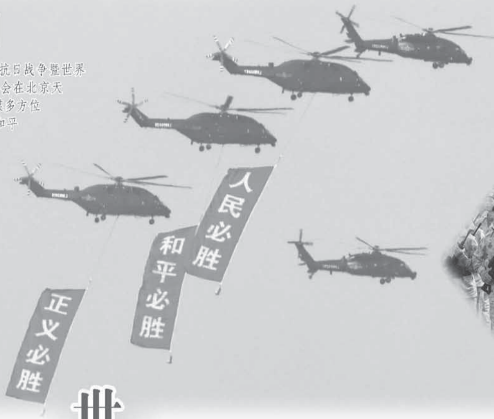
左图：接受检阅的空中梯队从空中飞过。

9月3日，纪念中国人民抗日战争暨世界反法西斯战争胜利80周年大会在北京天安门广场隆重举行。众多外媒多方报道了此次活动。中国维护和平的坚定承诺、维护全球稳定的强大能力以及共建人类命运共同体的美好向往引发各方赞誉。