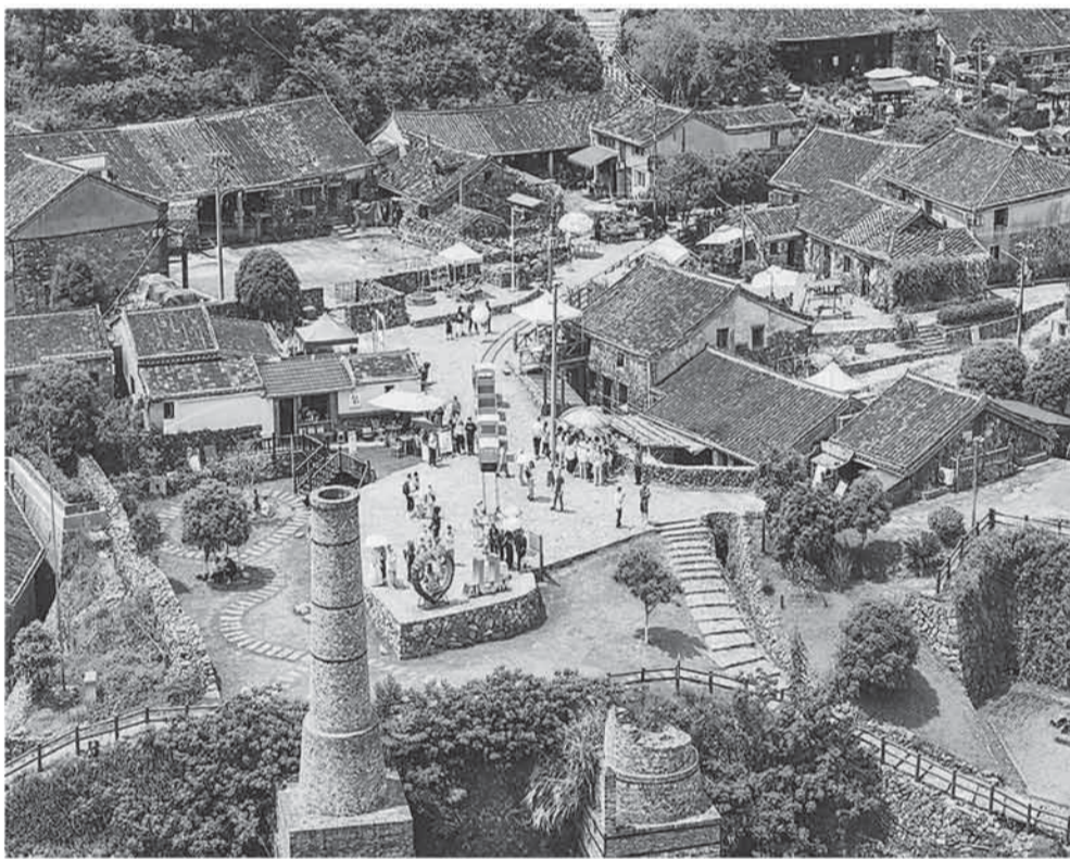
右图：这是拍摄于2025年“五一”假期的福德湾矿村。众多游客慕名来看石头屋和煅烧炉，听矿工号子，品尝鲜美肉燕。

村民留守。当矾山少了繁荣时的人来人往，游客还未慕名而至，街上的老式宾馆就明显冷清了许多。从我工作的社区回到驻地，要走过一条长长的柏油路，到了晚上7时，街上就空无一人。镇上只有1家奶茶店、2个小超市和4家饭馆。打开外卖软件，仅能看到2个商家入驻。对于刚来到这里的我，说心里没有失落，那肯定不是真实的想法。