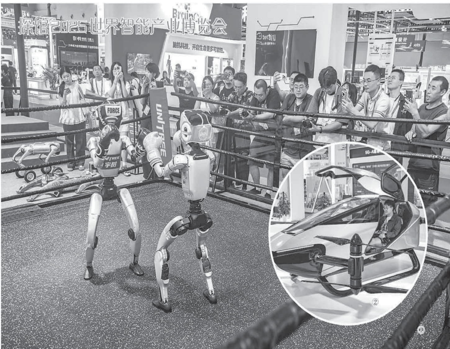
2025世界智能产业博览会于9月5日至8日在重庆举行。本届智博会设立智能网联新能源汽车、数字城市、智能机器人、智能家居、低空经济5大主题板块。这些板块分别聚焦智慧生态、城市治理、特种应用、生活场景及飞行技术，通过实景演示与专业活动，为观众呈现智能产业前沿成果与技术转化路径。 图①：9月4日，媒体记者和嘉宾在2025世界智能产业博览会宇树科技展厅观看机器人拳击赛。 图②：9月4日，媒体记者在2025世界智能产业博览会会场参观体验智能电动垂直起降飞行器。

厚重的历史记忆、鲜活的青春故事、昂扬的奋斗精神，开学季，这堂课汇聚穿越时空的精神力量，启发我们：最好的铭记是传承，最好的传承是奋斗。