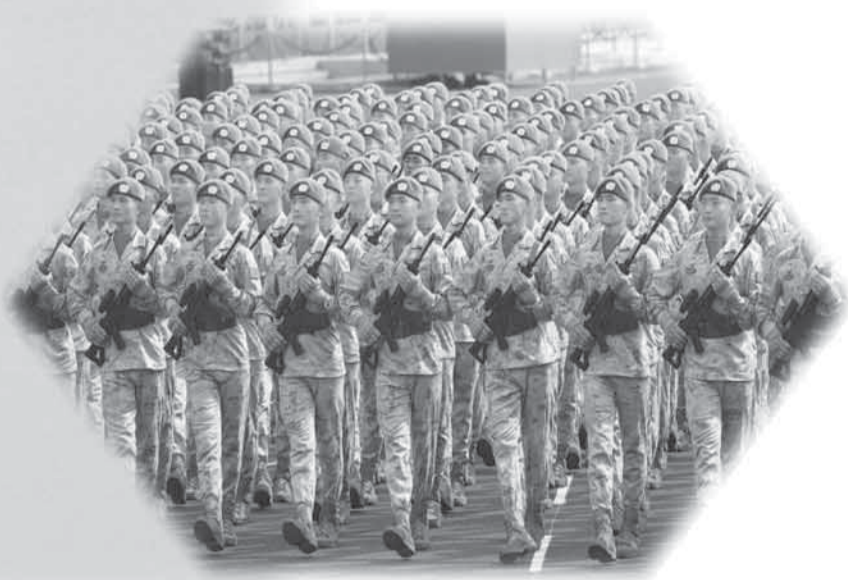
下图：图为维和部队方队接受检阅。