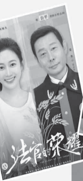
图2：《法官的荣耀》海报。