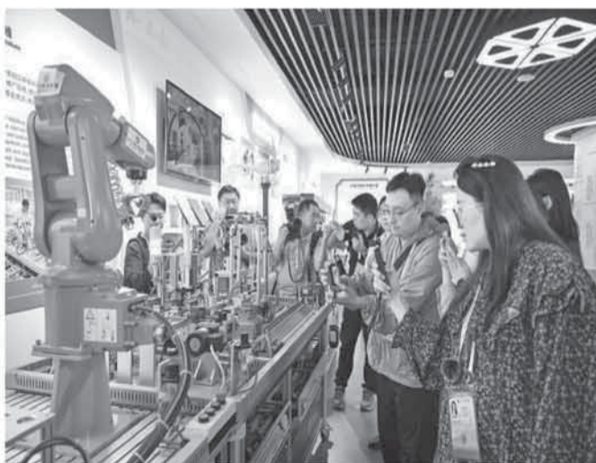
八月二十八日至三十日，上合组织天津媒体新闻中心安排多场城市参访活动。图为媒体记者在天津轻工职业技术学院鲁班工坊体验了解工业机器人工人实训设备。

以中国古代杰出工匠鲁班命名的国际合作项目，将中国职业教育的经验和成果与世界各国人民共享，是中国职业技术教育“走出去”的有益尝试。