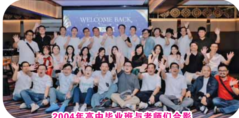
2004年高中毕业班与老师们合影