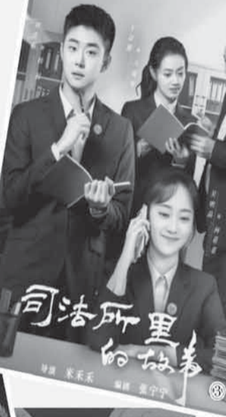
图3：《司法所里的故事》海报。