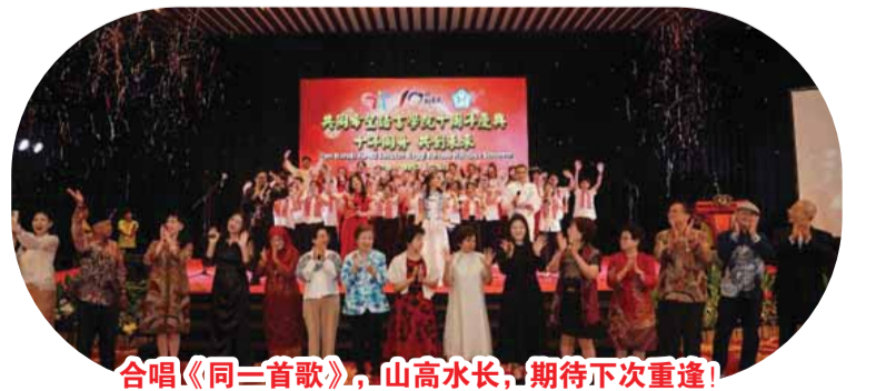
合唱《同一首歌》，山高水長，期待下次重逢！