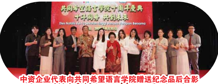
中資企業代表向共同希望語言學院贈送紀念品後合影