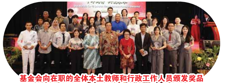
基金會向在職的全体本土教師和行政工作人員頒發獎品