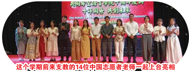
這個學期前來支教的14位中國志願者老師一起上台亮相