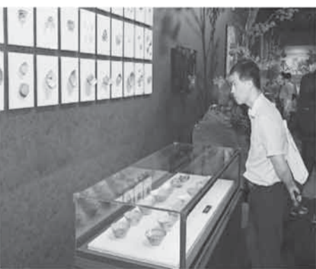
观众在东北抗联遗址出土文物特展上参观。

本报（记者郑智文）日前，东北抗联遗址出土文物特展在位于北京市的中国共产党历史展览馆开展，首次集中展出东北抗联遗址出土文物。