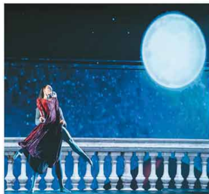
为庆祝中意建交55周年，全球首部改编自意大利文艺复兴时期诗人但丁同名诗作的音乐剧《神曲》，于9月4日至7日在香港上演，为观众带来跨越七个世纪的视听盛宴。图为在香港理工大学拍摄的意大利音乐剧《神曲》。

台湾美食交流团表示，通过此次交流活动，不仅了解到遂昌的特色美食，更发现这里美食产业发展的广阔前景。未来将以更大规模的厨师团队开展更深层次交流，共同策划两岸美食体验活动，让更多食客领略两岸饮食文化的魅力。