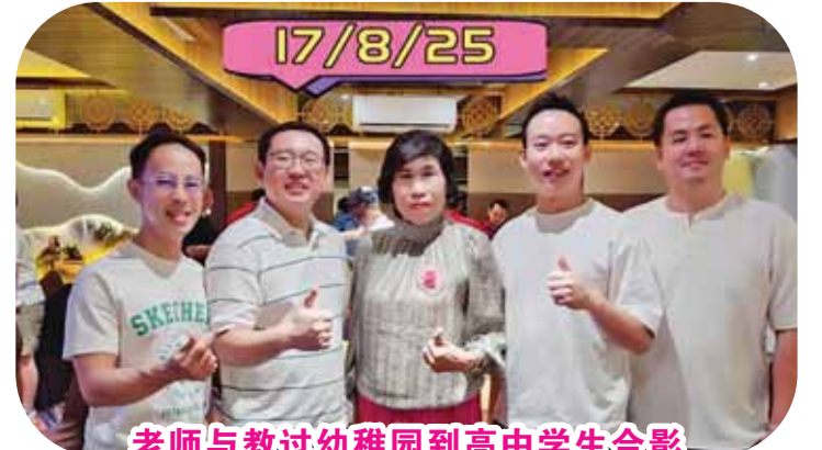
老师与教过幼稚园到高中学生合影