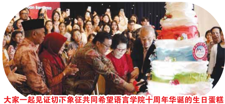
大家一起見證切下象征共同希望語言學院十周年華誕的生日蛋糕

楊兆驥先生和陳洪煊先生等等先行者，為不能共享今日之喜悅而深以為憾。 致辭環節結束後，慶典進入頒獎儀式，學院領導為本土教師及所有工作人員頒發獎項，表彰他們多年來的辛勤付出與卓越貢獻。 本次慶典充滿了友好與合作的氛圍。學院與廈門大學代表和各中資企業代表互贈紀念品，這些紀念品不僅承載著雙方深厚的情誼，更象征著未來攜手共進、共同發展的美好願景。此外，印華作協袁寬主席向學院舉行贈書儀式，借此機會推動各方進一步深化合作，共同探索教育發展的新路徑。 本次慶典各個環節由豐富多彩的文艺表演串聯，合唱團演唱、三族舞蹈、書法、詩歌朗誦、對唱、傳統樂器、潮劇等异彩紛呈的表演，不僅展現了共同希望語言學院學生积极向上的精神風貌，更體現了學校重視培養綜合素質、重視各民族文化融合的教育方針。學生們精彩的表演贏得了現場觀眾的陣陣掌聲，將慶典氣氛一次次推向高潮。學生會工作團隊的高效率協作精神也令嘉賓贊賞不已。 慶典在《同一首歌》的旋律中落下帷幕，但共同希望語言學院的故事還在繼續書寫。相信在未来的日子裡，學院將帶著十年的榮耀與夢想，繼續揚帆遠航，創造更加輝煌的明天。 文稿：傅琳涵