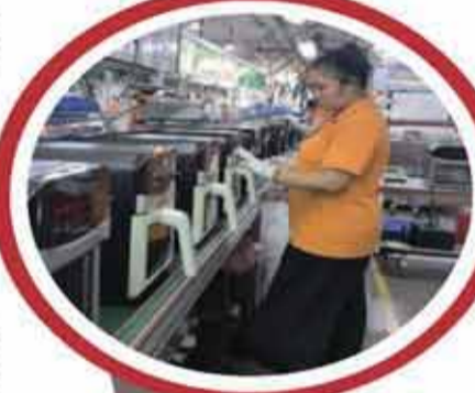
貝爾斯頓車間生產的空氣炸鍋銷往全國各地。

在新的市場環境下，江門的外貿企業正推動自身從傳統代工向“智造品牌”的轉型升級。這個過程中，一批企業正從國際市場的“幕後英雄”華麗轉身為國內消費的“臺前明星”，在內外貿協同發展中創造新