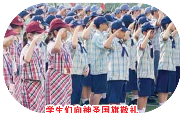
學生們向神聖國旗敬禮