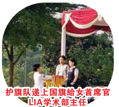
護旗隊送上國旗給女首席官LIA學術部主任