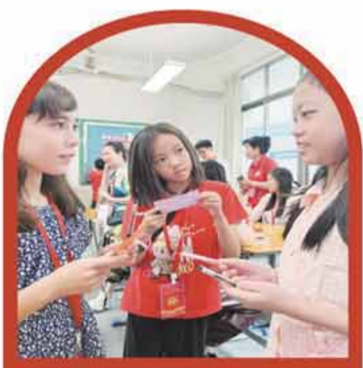
華裔青少年相互用中文交流。