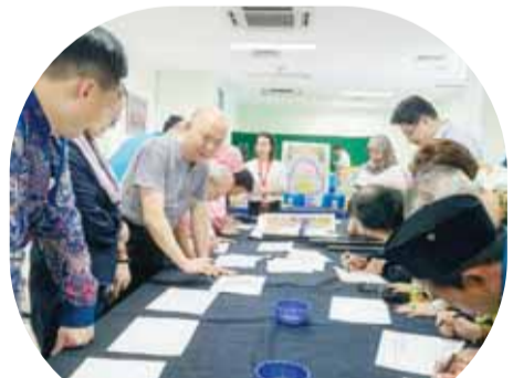
与会嘉宾现场尝试书写阿拉伯文