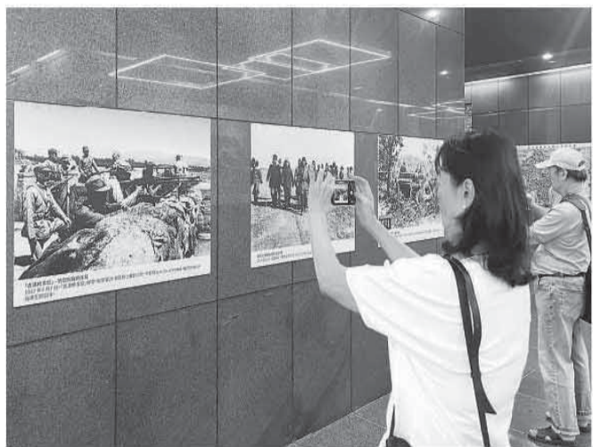
图为台北市市民在参观“抗战胜利暨台湾光复80周年”纪念图片特展。

由台湾社会共好论坛、台湾统一联盟党主办的纪念抗战胜利暨反法西斯战争胜利80周年座谈会8月16日在台北举行。多位台湾抗日先辈后代家属代表出席座谈会，分享了先辈们多年英勇不屈抗击日寇的经历。