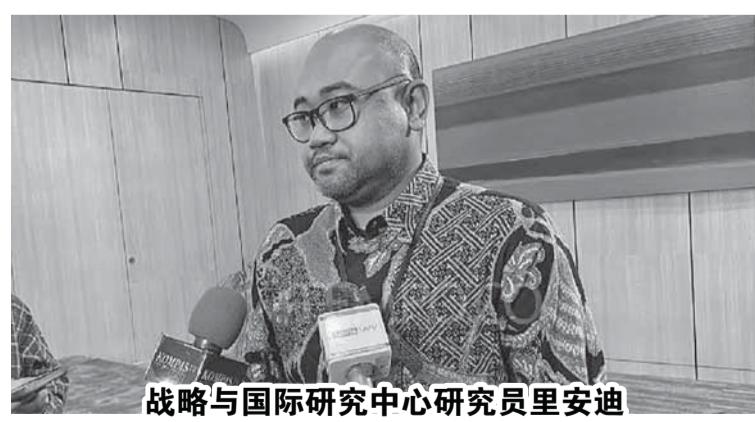
战略与国际研究中心研究员里安迪

达南达拉投资局的大部分资产以国家银行的第三方基金形式进入。此外，并非所有达南达拉投资局资产都是生产性资