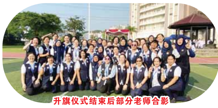
升旗儀式結束後部分老師合影