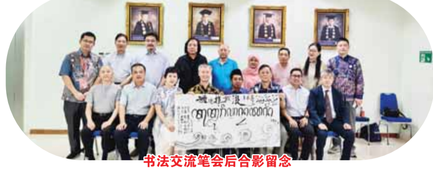
书法交流笔会后合影留念