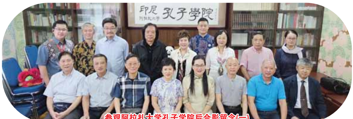
参观阿拉扎大学孔子学院后合影留念(一)