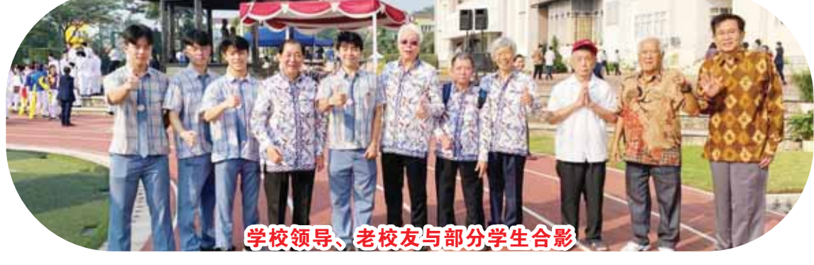
學校領導、老校友與部分學生合影