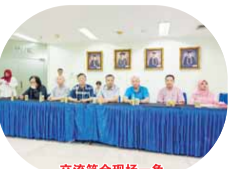
交流笔会现场一角