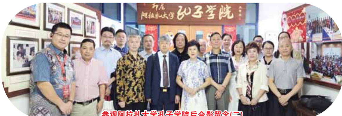
参观阿拉扎大学孔子学院后合影留念(二)