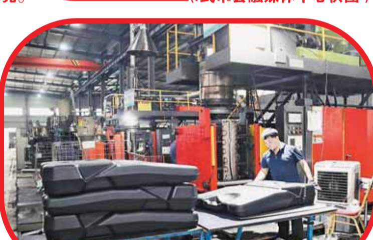
福建康莱宝运动用品有限公司生产车间