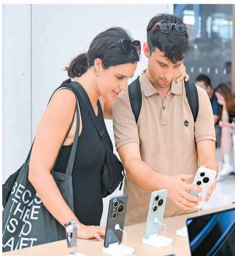
▲今年上半年，上海海关共核准离境退税申请单6.4万单，比去年同期大幅增长1.4倍。图为7月17日，两名西班牙游客在位于上海市南京路步行街的华为商店里浏览手机产品。

比分别增长94.6%和93.2%。”国家税务总局副局长王道树介绍，离境退税“即买即退”服务措施在全国范围内推广，将退税办理效率提升40%以上，有力支持了入境旅游。