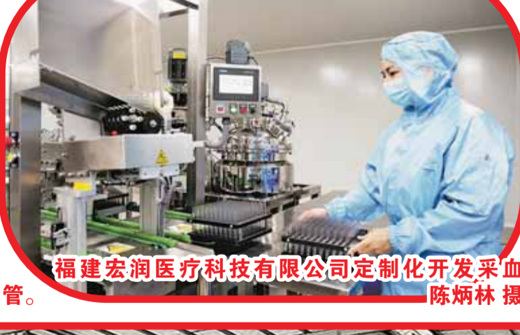
福建宏润医疗科技有限公司定制化开发采血管。