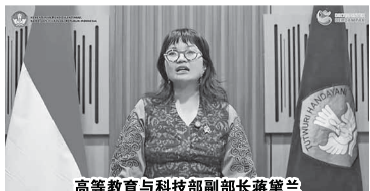
高等教育与科技部副部长蒋黛兰

【本报讯】高等教育与科技部副部长蒋黛兰回应13个院校被列入研究成果清单，其完整性受到2024年研究诚信风险指数的质疑。