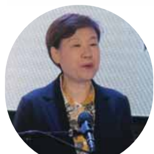
中国工信部国际经济技术合作中心郑红主任致辞