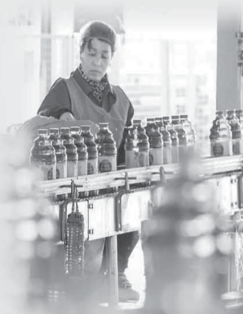
▲在河北省晋州市一家果品深加工企业，工人在果汁生产线上工作。

在果汁领域，近年来应用NFC、HPP工艺生产的产品很受欢迎，出现了很多爆款，比如2022年，盒马推出一款红心苹果汁，用新技术保留了红心苹果明艳的红色，又辅以富士苹果调配口感，最大程度保留了苹果的原本风味。再比如盒马今年新推出的HPP shot系列，其中姜黄生姜柠檬汁是这个系列的头号新品，由于生姜、姜黄、柠檬的风味比较特殊，这款饮品与普通果蔬汁饮料在口感上差异明显，令不少消费者直呼“上头”，因此被制成单瓶仅有100ml的shot装，上线1个月来，已成为盒马复购率最高的冷藏饮品。