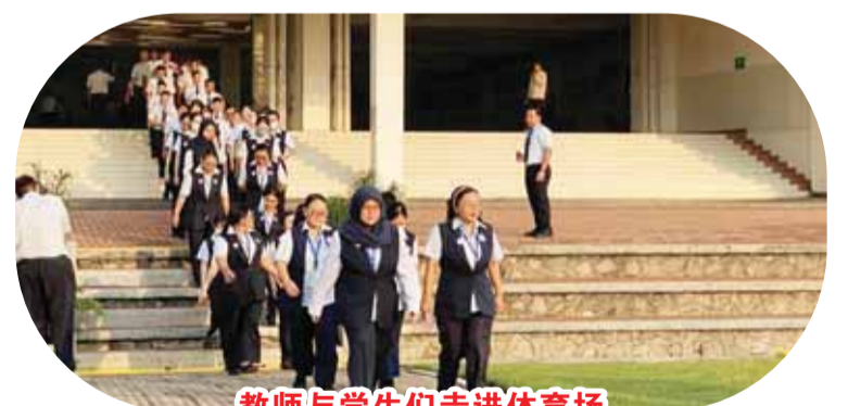
教師與學生們走進體育場