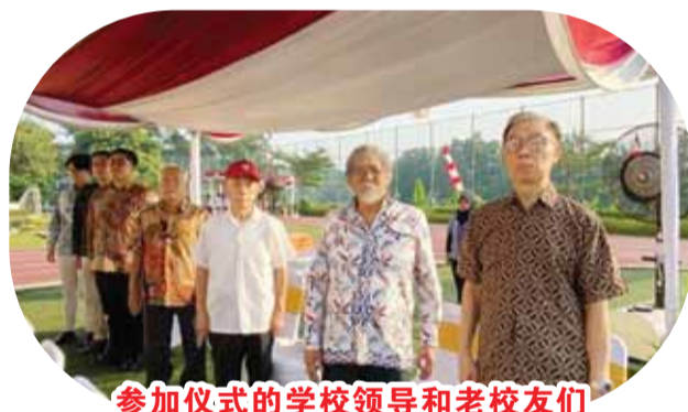
參加儀式的學校領導和老校友們