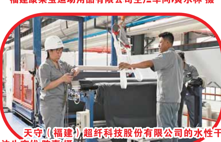
天守(福建)超纤科技股份有限公司的水性干法生产线