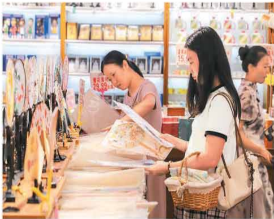
▲浙江省杭州市，游客在清河坊历史文化街区购物。

数增长。数字技术与消费场景深度融合，数字服务供给持续优化创新，通讯信息类服务消费增长态势良好。