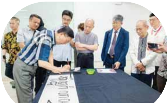
宣家鑫副主席在作品上题字