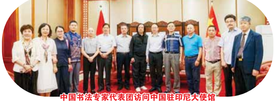
中国书法专家代表团访问中国驻印尼大使馆