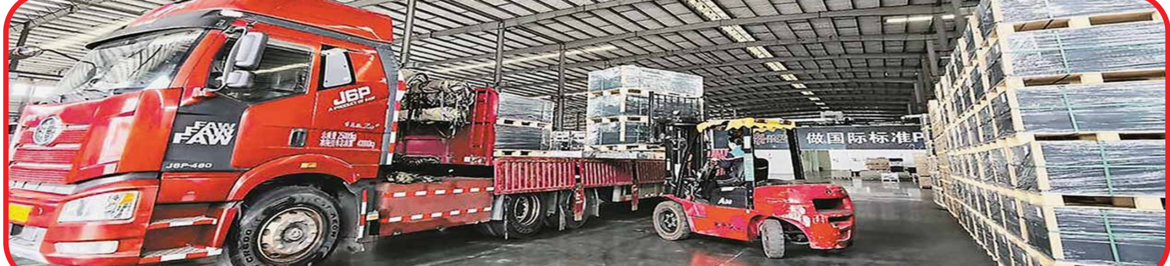
福建燧塑光电科技有限公司生产的PC板材装车发往粤港澳大湾区。(资料图片)