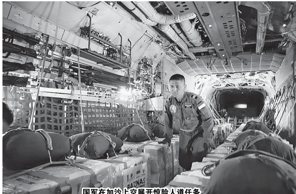
国军在加沙上空展开惊险人道任务