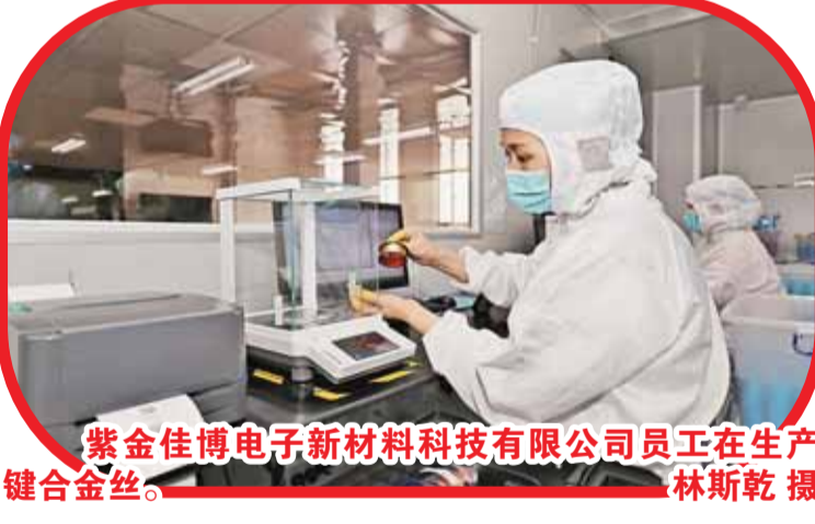
紫金佳博电子新材料科技有限公司员工在生产键合金丝。