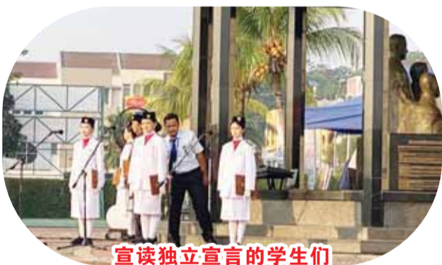
宣讀獨立宣言的學生們