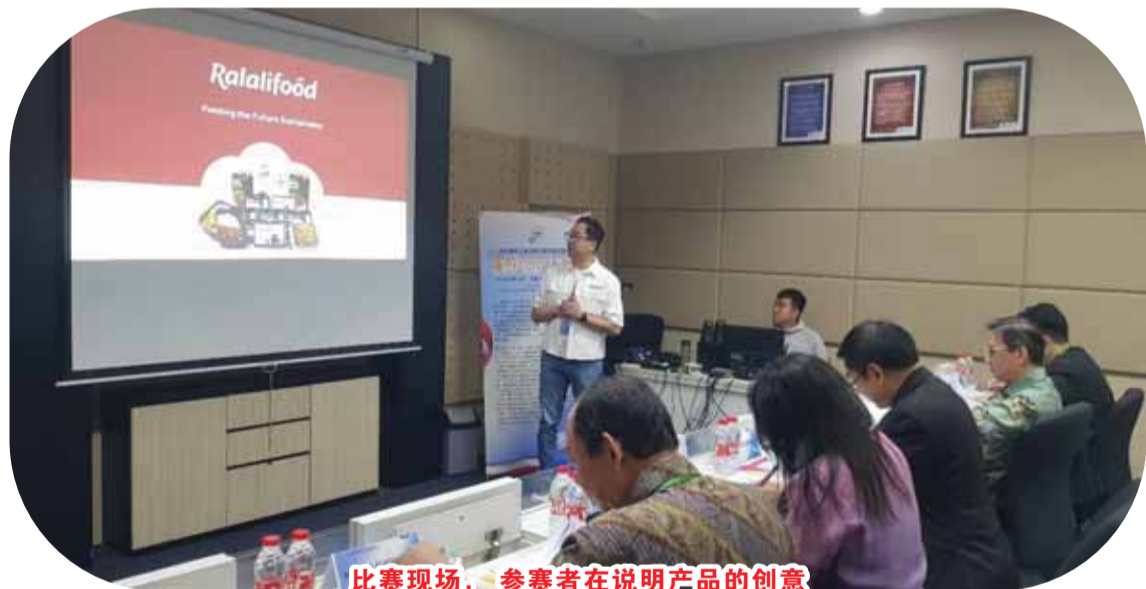
比赛现场, 参赛者在说明产品的创意