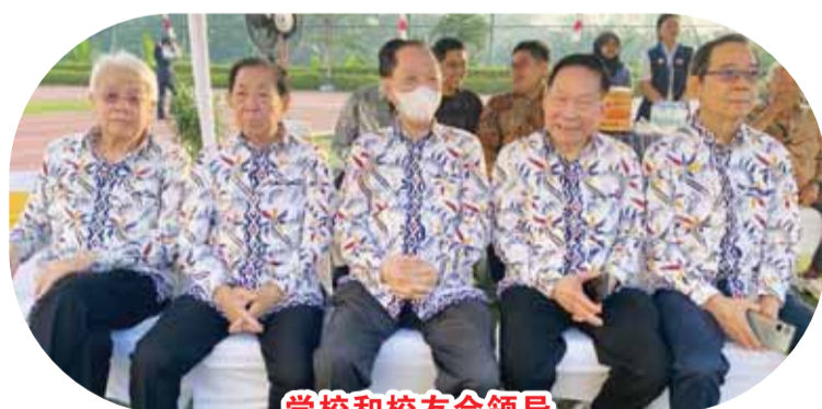
學校和校友會領導