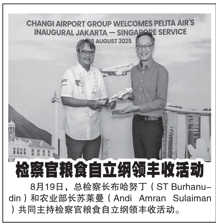
检察官粮食自立纲领丰收活动

他也称, 实施免费营养餐计划带动了商业领域, 因为许多餐馆、咖啡馆乃至酒店都将其厨房的作用改为符合免费营养餐的需求。他说: “如果一家餐馆一般只有大约500名的顾客, 如今已成为执行营养餐服务单位的餐馆能提供3500份营养餐, 而且不需要供应停车场。营养餐直接送往学校或家里, 提供给孕妇、哺乳妇女及幼童。” 有关方面正在加速核实和验证合格的营养餐服务单位, 每天计有多达200家至300家受到核实。达丹就此事确认国家营养机构将持续严守标准的规则, 保障营养餐的良好质量。他说: “我们提高其营养标准, 包括选择良好质量的原材料, 缩短烹煮时间、筹备时间及运行时间。包括送往学校等, 所化的时间必须少于4个小时。” (Ing)