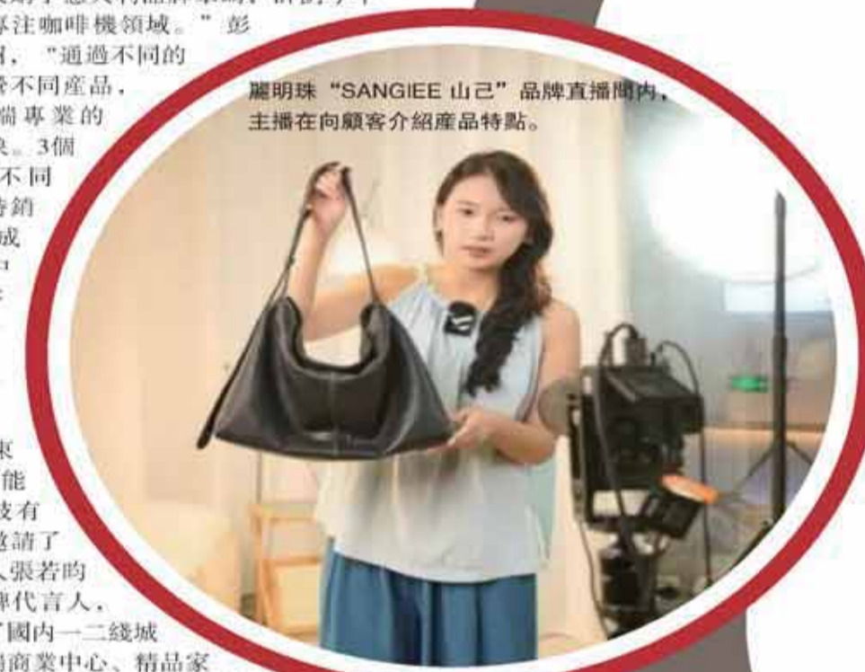
麗明珠“SANGIEE山己”品牌直播間內，主播在向顧客介紹產品特點。