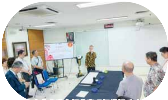
印尼永安药业游永辉董事现场讲解爪哇文(一)