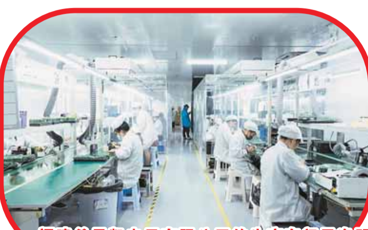
福建希恩凯电子有限公司的生产车间干净明亮。

砥砺前行、乘势而上，在顺势而为中实现政企共为，以面对未来奋发的有为的冲劲再创新业绩，这是龙岩专精特新企业发展的姿态。