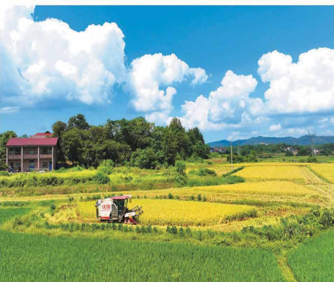
近日,湖南省衡阳市种植的中稻次第成熟,当地农民抢抓晴好天气开展机收、晾晒工作,确保粮食颗粒归仓。图为衡阳市祁东县灵官镇,当地村民驾驶农机在收割稻谷。

干部理论轮训、部队思想政治教育和院校政治理论教学,要把学习《习近平论强军兴军(四)》作为重要内容,列入学习计划,在学懂弄通做实上下功夫。要结合集中开展政治整训,在学悟思想中加强政治锻造、思想改造,进一步解决好理想信念、党性修养、官德人品等思想根源问题,坚决有力纯正政治生态,巩固人民军队纯洁光荣。领导干部要带头真学真懂真信真用,注重运用自身学习成果为官兵搞好宣讲辅导,各级政治工作部门要加强对学习的指导和督促检查,广大理论工作者要加强体系化学理化研究,军队新闻媒体要加大宣传力度、生动反映部队学习贯彻成效,推动理论武装走深走实。要大力弘扬理论联系实际的学风,立牢以实际成效检验学习成果的导向,切实把学习成效转化为奋力攻坚、奋斗强军的生动实践,全面提高履行新时代使命任务能力,以优异成绩迎接建军100周年。