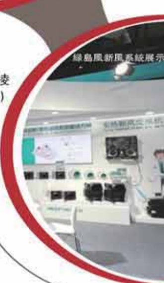
綠島風新風系統展示。