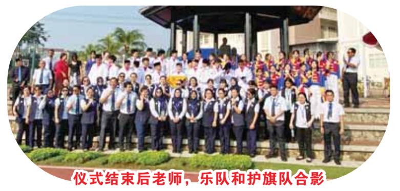
儀式結束後老師、樂隊和護旗隊合影