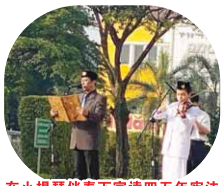
在小提琴伴奏下宣讀四五年憲法