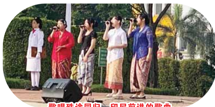
歌唱殊途同歸，印尼前進的歌曲