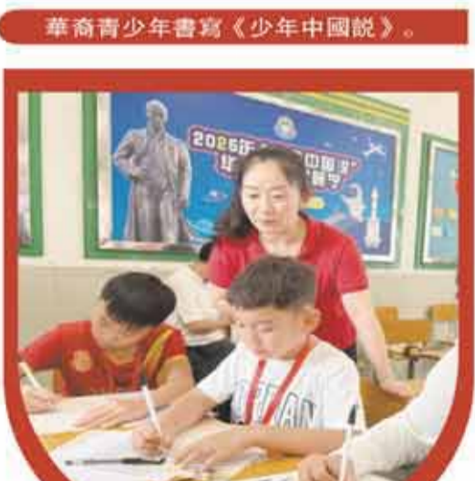
華裔青少年書寫《少年中國說》。

漫步崖門古炮臺、京梅村，于歷史遺迹中探尋歲月沉澱的故事；走進梁啟超故居紀念館，聆聽先賢事跡；探訪華僑華人博物館、長堤歷史文化街區，在展品與街巷間追溯僑鄉往事……日前，來自14個國家和地區、20所華校的20名華裔青少年齊聚江門，在2025年“少年中國說”華裔新生代中文朗誦大賽研學營裏共赴一場中華文化體驗之旅。