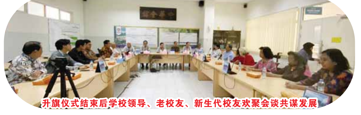
升旗儀式結束後學校領導、老校友、新生代校友歡聚會談共謀發展