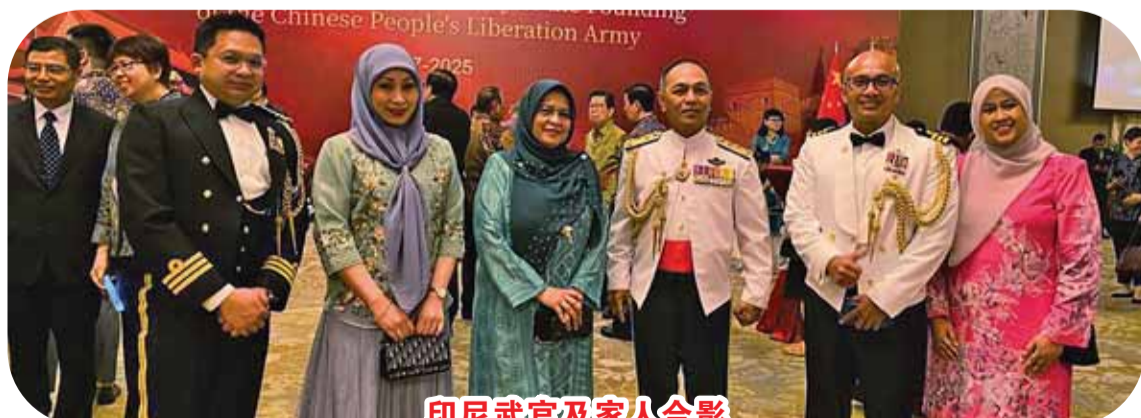
印尼武官及家人合影