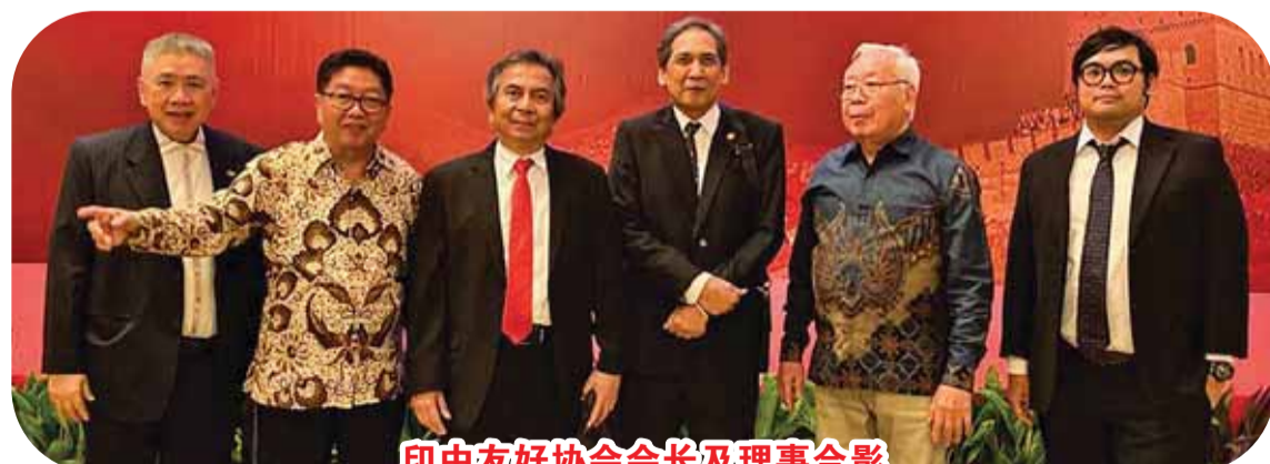
印中友好协会会长及理事合影