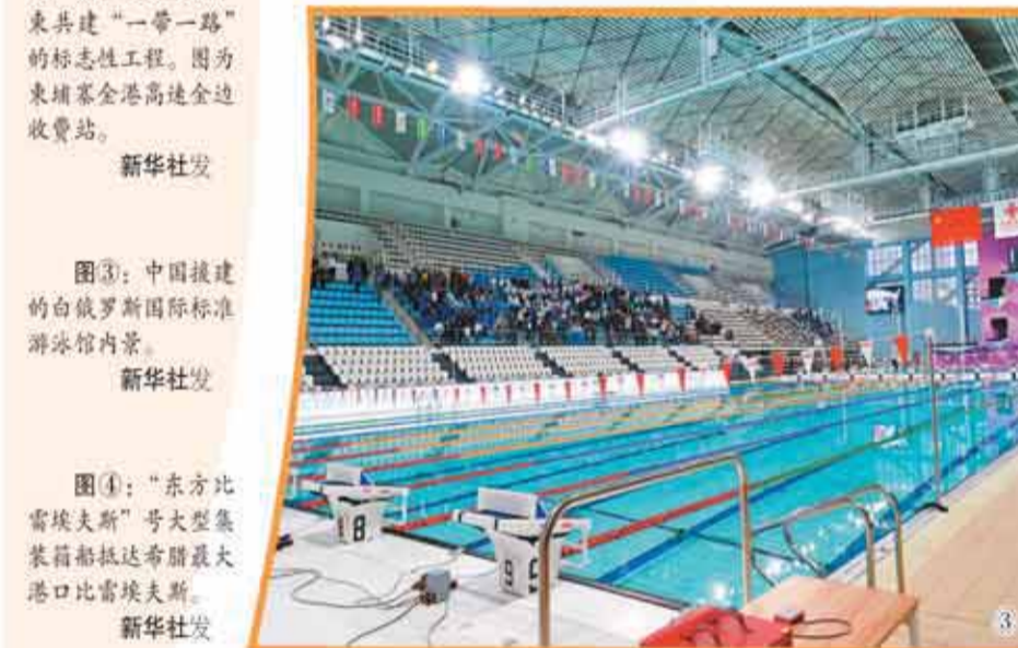
图③：中国援建的白俄罗斯国际标准游泳馆内景。