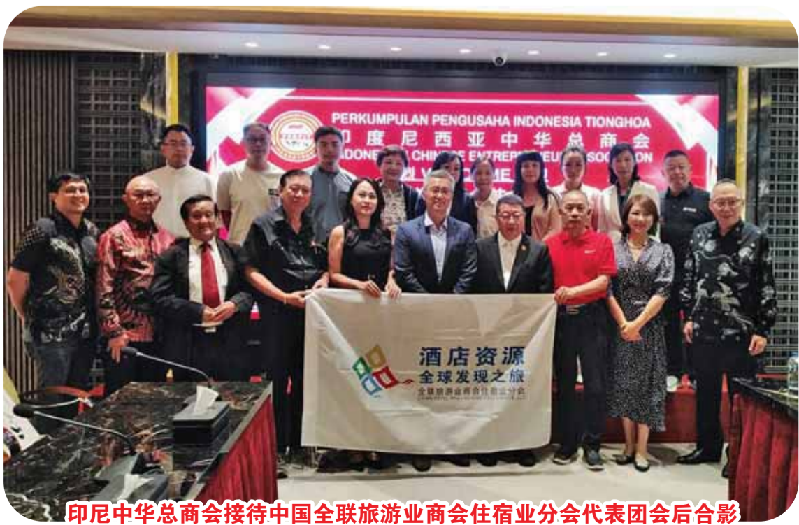
印尼中华总商会接待中国全联旅游业商会住宿业分会代表团会后合影