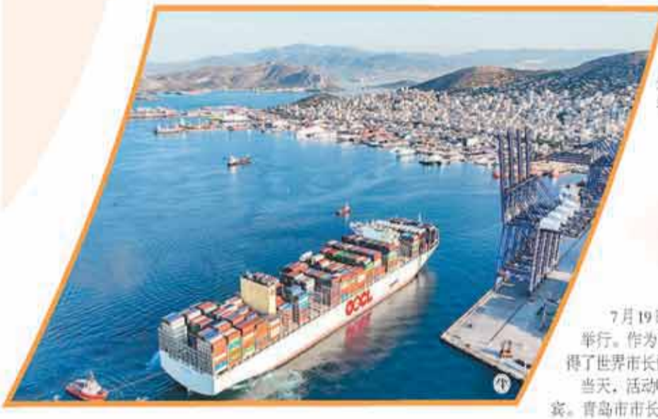
图④：“东方比雷埃夫斯”号大型集装箱船抵达希腊最大港口比雷埃夫斯。新华社发