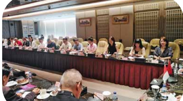
中国全联旅游业商会住宿业分会来访代表团于会场席间

旅游业作为印尼经济的重要支柱之一,2024年,印尼接待外国游客超过1390万人次,同比增长19.05%,创下五年来新高。2025年前五个月,国际游客人数达563万,同比增长7.44%,国内旅游也同样活跃。住宿业作为旅游