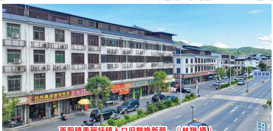
西阳镇美丽圩镇入口旧貌换新颜。

走进城北镇环市北路，广东春天汽车集团有限公司下属子公司——梅州春天新能源科技发展有限公司的新能源汽车体验中心项目正如火如荼建设。该项目计划总投资4亿元，分两期建设，主要有新能源汽车体验中心、商超、品牌展示销售区、汽车生活体验区等四个核心功能区域，兼具新能源汽车展示发布、试驾体验、销售维修，以及基于5G技术的智能网联汽车测试和体验等功