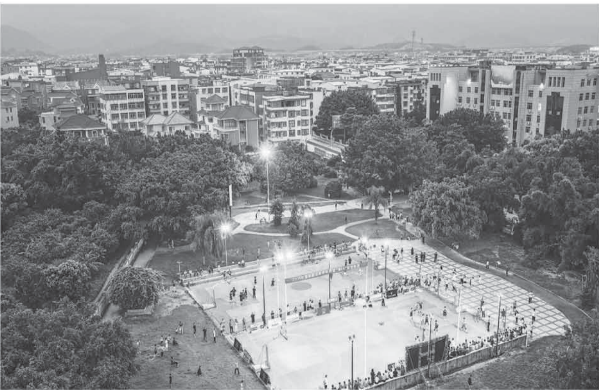
近日，夏季“渔BA”篮球联赛在福建省福清市渔溪镇火热开赛。本次比赛为期21天，吸引15支球队的200多名职工、渔民等业余篮球爱好者参与，共赴这场乡村体育盛会。图为夏季“渔BA”篮球联赛比赛现场。