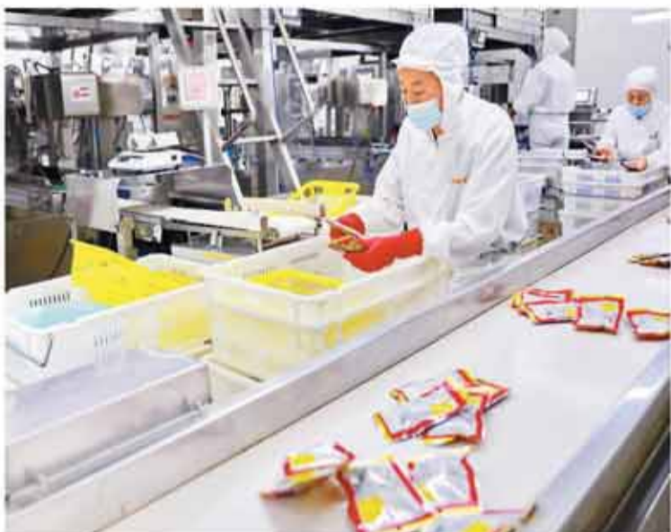
近年来，河北省秦皇岛市海港区大力发展深加工产业，积极探索跨境电商新模式，实现板栗深加工产品全年不间断生产、销往海外市场。图为在位于海港区海滨路街道的秦皇岛富源食品有限公司内，员工在板栗加工生产线上忙碌。

今年以来，外汇形势复杂多变，风险挑战明显增加。在此背景下，跨境资金流动风险如何？“从人民币汇率看，保持基本稳定。”李斌说，今年上半年，人民币兑美元汇率升值1.9%，在7.15—7.35之间双向浮动，既在合理均衡水平上保持了基本稳定，也发挥了调节宏观经济和国际收支自动稳定器的作用。