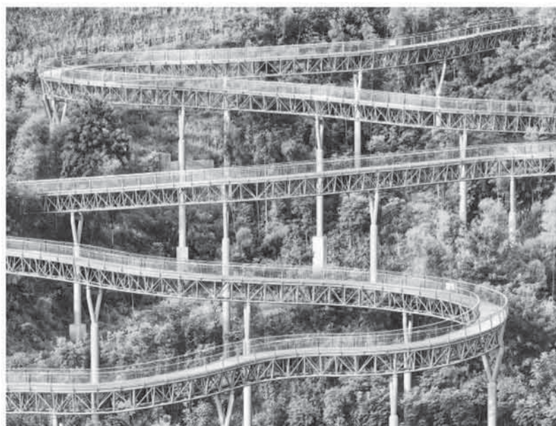
江西省赣州市崇义县城市森林空间创新土方开挖方式，使用装配式钢结构连接，打造“漂浮森林走廊”，同时通过提升钢格栅孔隙率、采用昆虫友好型LED照明设施，保护生物多样性，打造“城林共生”的绿色地标。 图为崇义县城市森林空间钢格栅建造景观。

“在大暑节前，村里要演十天的戏，这段时间，村民还会准备好免费的白粥和小菜给客人吃。现在举办‘送大暑船’的费用，也是村民捐助的，有人捐钱，也有人捐米。”“送大暑船”的路上，沿途各村的村民还准备了免费的饮料茶水。”椒江区政协文史专员金勇说，“送大暑船”可以称得上是一场渔民的“夏季嘉年华”。