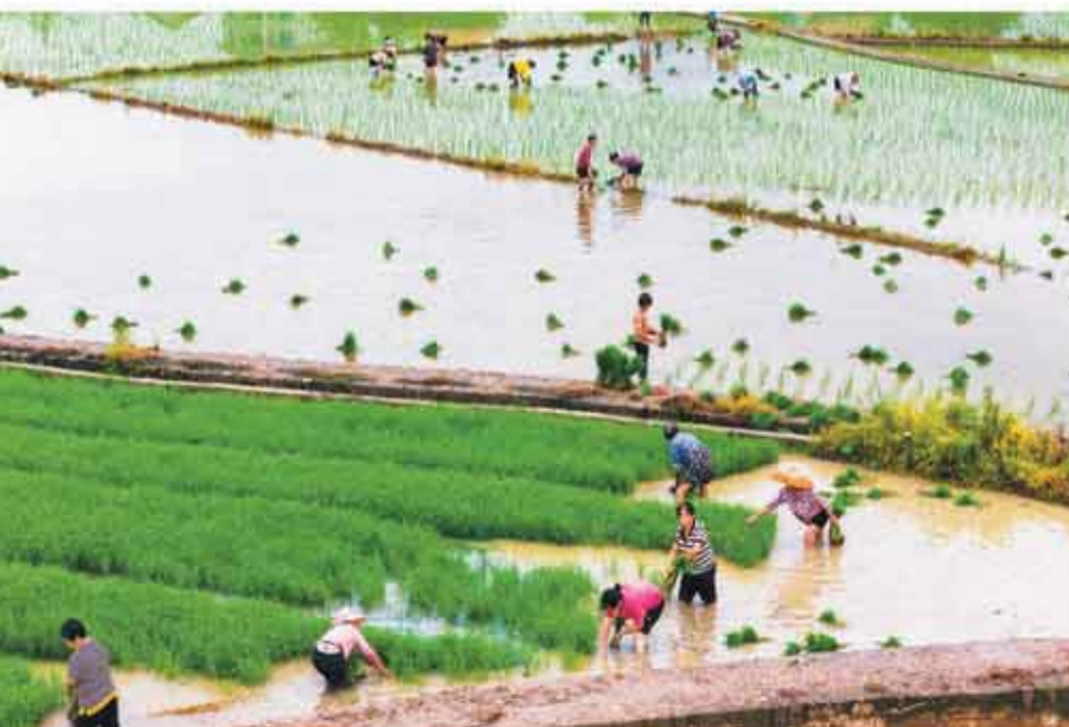
七月二十二日迎来今年夏季的最后一个节气大暑,湖南省娄底市农民纷纷抢抓农时,收割早稻、种植晚稻,助力全年粮食丰收。图为在娄底市娄山区杉山镇,农民抢抓晚稻插秧。

本报北京7月22日电(记者王云杉)记者从国家数据局获悉:国家数据局指导合肥、成都等7个城市建设数据标注基地,先行先试探索数据标注产业发展经验。截至今年上半年,7个数据标注基地建设数据集524个,服务大模型163个。高质量数据集是经过采集、加工等数据处理,可以直接用于开发和训练人工智能模型,能够有效提升模型性能的高质量数据集。据了解,国家数据局着力构建“部门协同、央地联动”的工作机制,全面加速高质量数据集建设和应用落地,组织开展生态培育专项行动,主要包括三个方面:一是组织开展高质量数据集典型案例征集和示范推广,挖掘医疗、工业、交通等重点领域标杆实践;二是定期举办技术交流会议,围绕数据标注、合成、高质量数据集建设方法论等开展深度研讨;三是搭建常态化供需对接平台,促进数据供给方、技术提供方、场景应用方精准匹配。