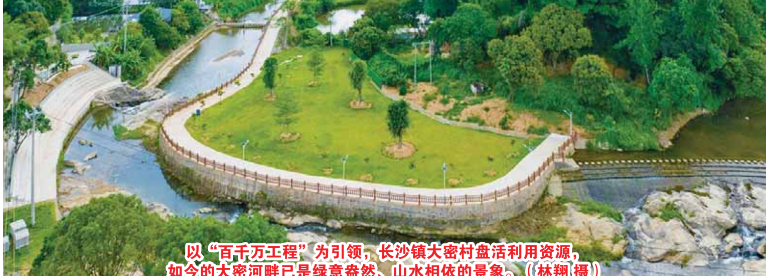
以“百千万工程”为引领，长沙镇大密村盘活利用资源，如今的大密河畔已是绿意盎然、山水相依的景象。