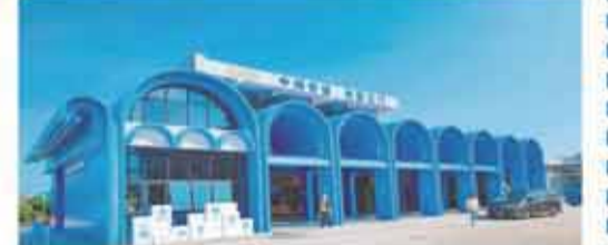
改造後的西部沿海高速上川服務區,不僅實現功能升級,更將助農展銷、休閒娛樂集於一體。

“樂驛”便利店內,鄉村優質農產品專櫃格外引人注目,五指毛桃、豬仔薯、海島紫菜等僑鄉風味農產品琳琅滿目,供司乘旅客任意挑選。衛生間設施全面升級,還加裝了遮陽避雨設施;新增的兒童活動區更是為家庭客群提供了一個歡樂玩耍的好去處。來到這個濱海服務區,吃飯、休息、游玩等功能一應俱全,“微改造、大提升”名副其實。(文/圖 畢鬆杰 肖珍)