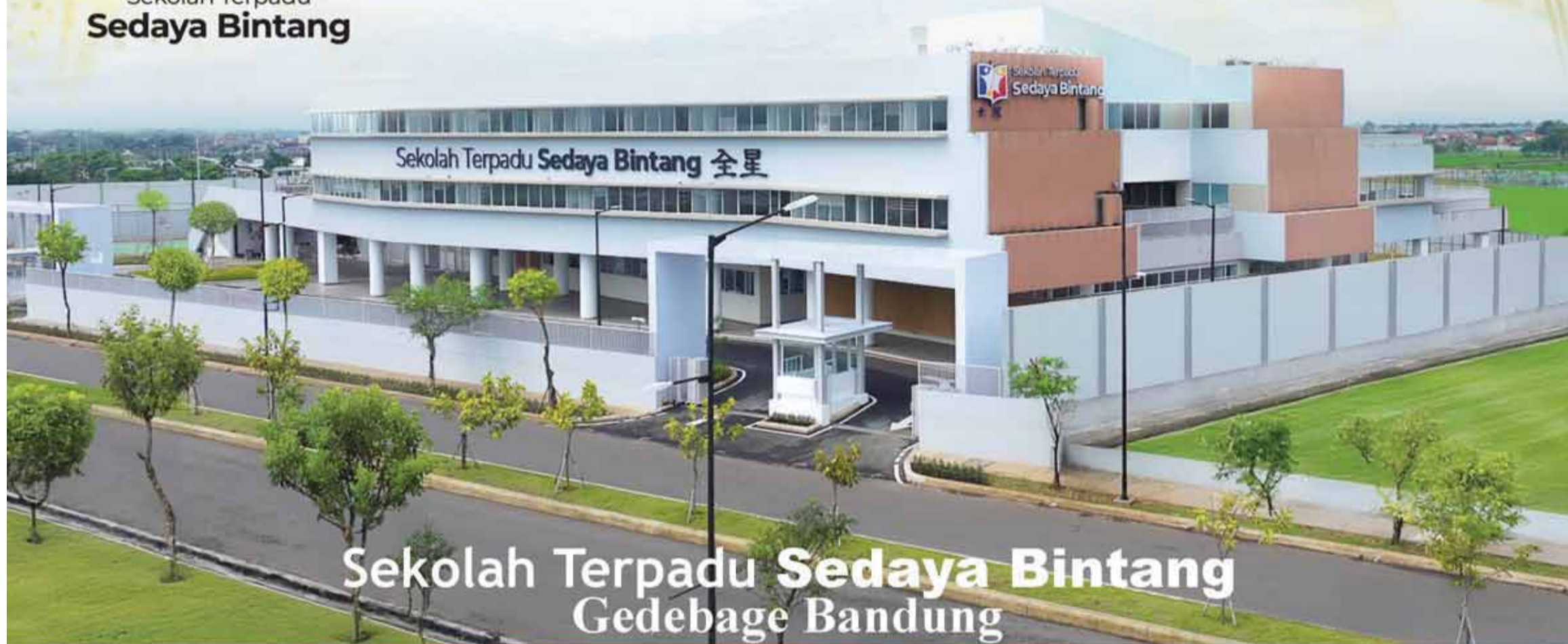
Sekolah Terpadu Sedaya Bintang Gedebage Bandung