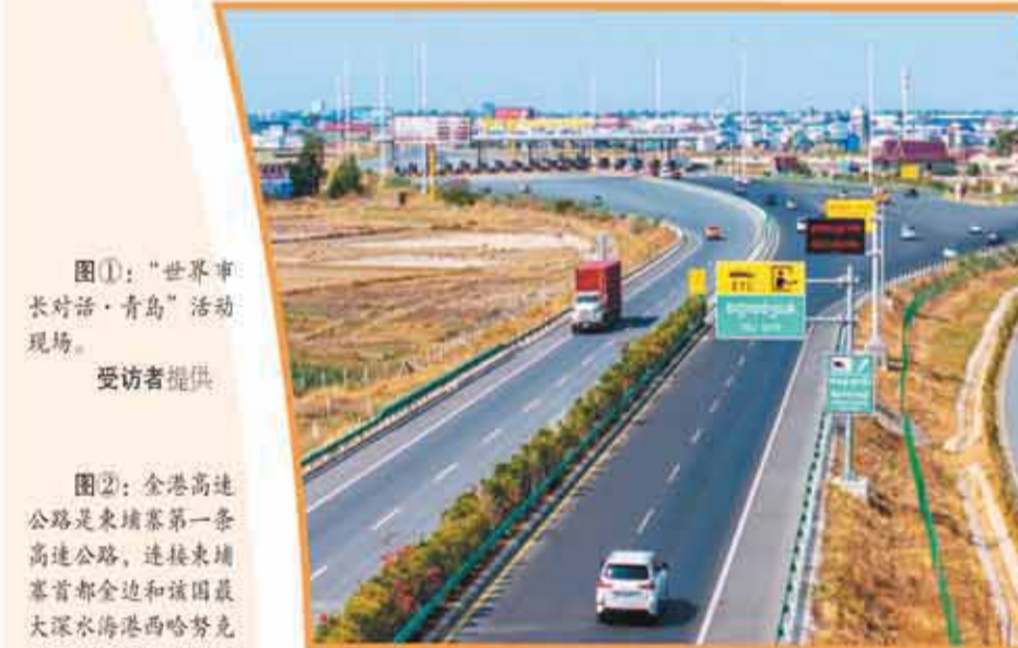
图②：全港高速公路是柬埔寨第一条高速公路，连接柬埔寨首都金边和该国最大深水海港西哈努克港，如今已打造成中柬共建“一带一路”的标志性工程。图为柬埔寨金边高速公路收费站。