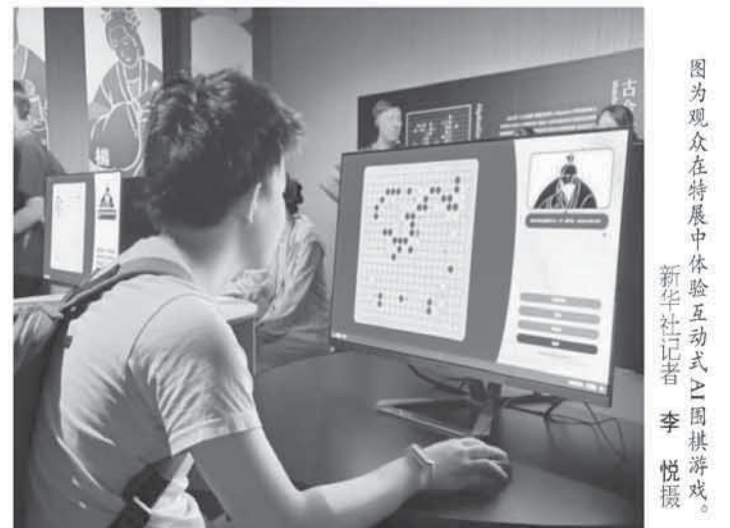
图为观众在特展中体验互动式之围棋游戏。