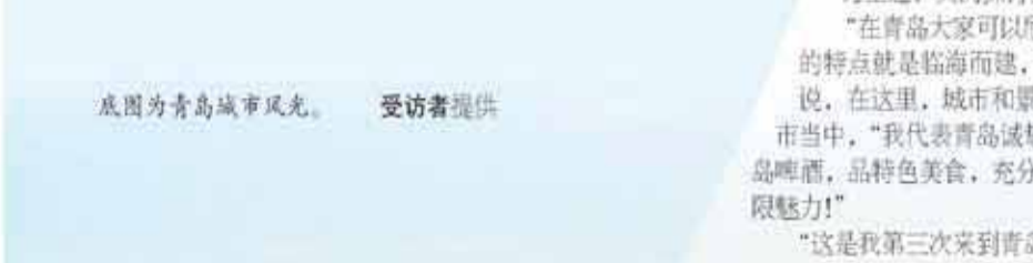
底图为青岛城市风光。