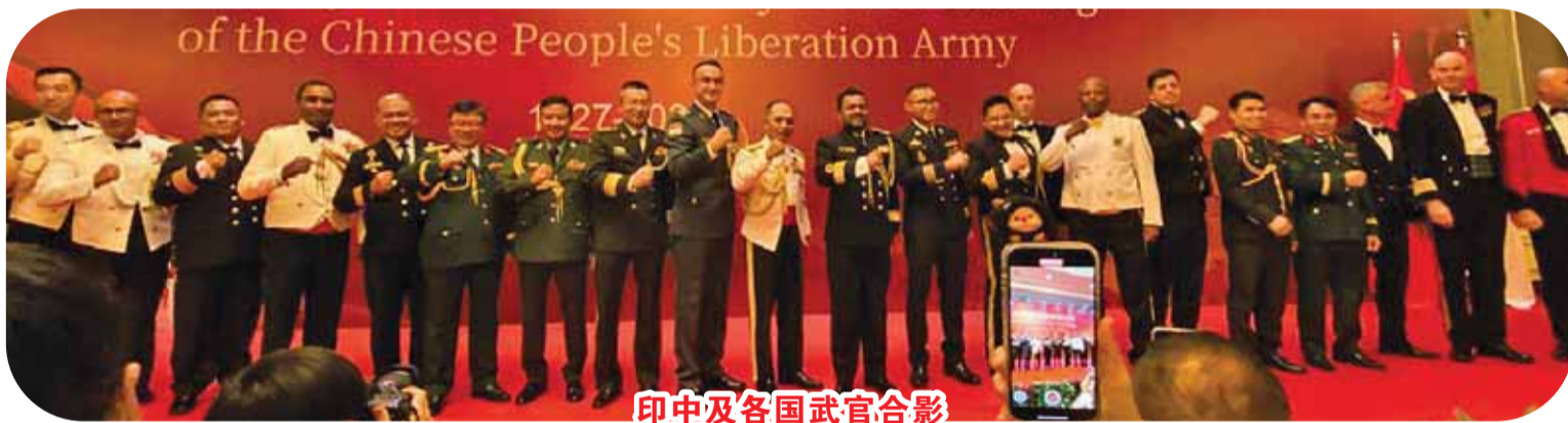
印中及各国武官合影

周年。在此，我向长期以来关心支持中国人民解放军建设和中印尼两国两军关系的各界人士，致以最诚挚的感谢和最崇高的敬意！