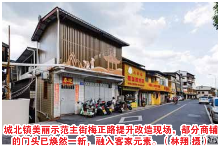
城北镇美丽示范主街梅正路提升改造现场，部分商铺的门头已焕然一新，融入客家元素。