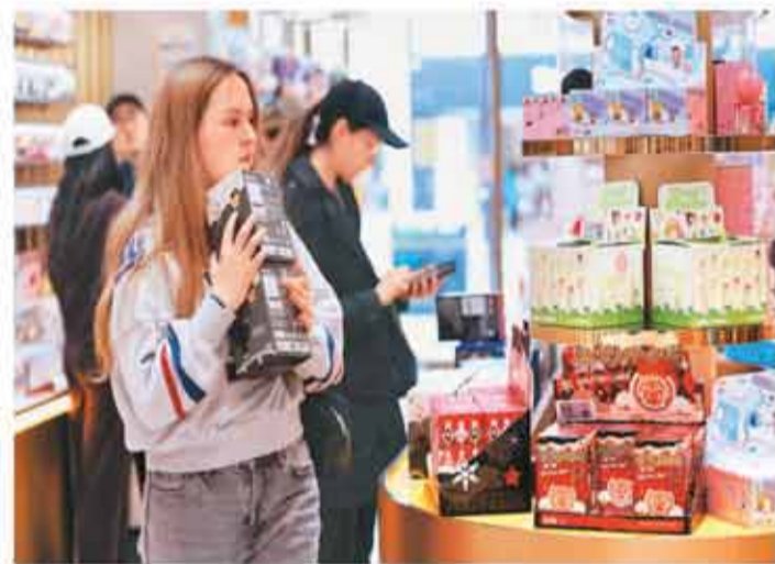
顾客在泡泡玛特英国伦敦牛津街店内选购。

答:很多企业想快速做大市场,我们想的是如何先做好。慢就是快,少就是多,要聚焦一件事慢慢做。出海是一个系统工程,语言、文化、法规等都得去适应。我们开店数很少,而且全是直营。今年海外估计有200家店,我们自己建团队,在当地雇人自己管,这是比较慢和笨