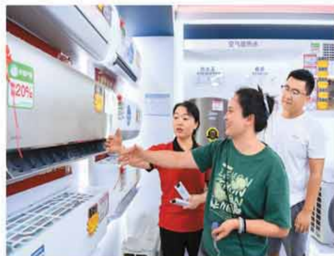
今年以来，江西省宜春市积极推进消费品以旧换新活动，消费市场活力持续释放，掀起夏季消费热潮。图为7月21日，消费者在宜春市袁州区下湖街道东湖社区的一家家电卖场内选购空调等家电产品。

齐烯烃产业链关键环节，与原油、甲醇、聚丙烯等品种形成协调效应，进一步丰富产业链相关板块衍生品类型，为产业企业提供更加多元化的风险管理工具，持续提升产业链韧性。同时，能够进一步完善定价机制，提升能源化工产品定价影响力。