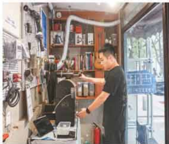
随着咖啡的普及程度越来越高，咖啡产业链上的职业分工不断精细化。图为在辽宁省沈阳市和平区一家咖啡店，一名咖啡加工工人在烘焙咖啡豆。

“新职业和新工种创造出更多高质量的就业岗位，让劳动者有了更广阔、更多元的职业发展路径。总的看，很多新职业的岗位需求和人才供给，都在快速增长。但是，一些领域人才缺口依然较大。”王瑞君说，新职业发布后，人社部还将会同相关部门制定职业标准和评价规范，加强新职业培训和评价工作，引导人才培养和市场需求对接、与社会发展同步。