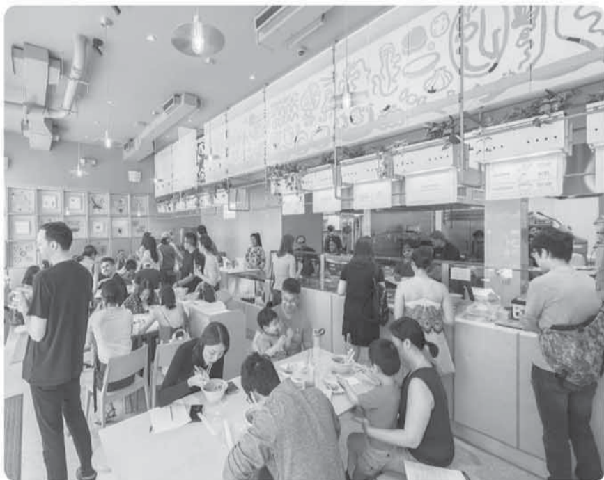
食客在君子食堂门店用餐。