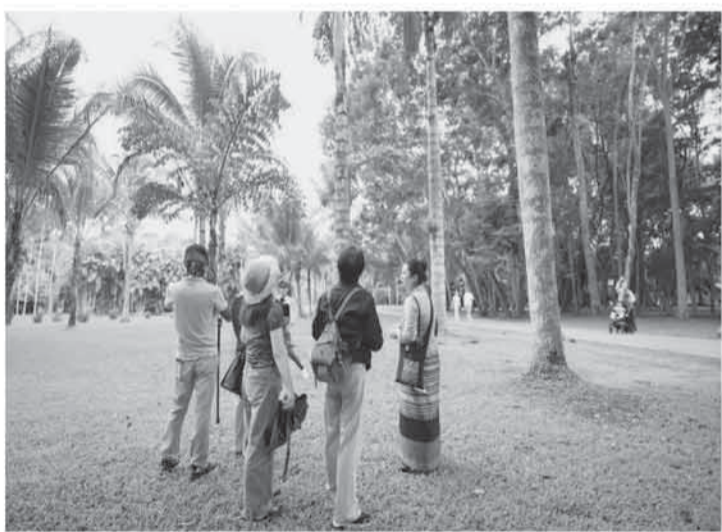
讲解员（右一）在中国科学院西双版纳热带植物园向游客讲解热带雨林中常见的鸟类和植物。

在中老边境的热带雨林深处，潺潺山泉旁藏着一处“观鸟秘境”。清晨，清脆的鸟鸣声此起彼伏，摄影爱好者们在此架起“长枪短炮”，静静等待鸟儿翩跹而至。