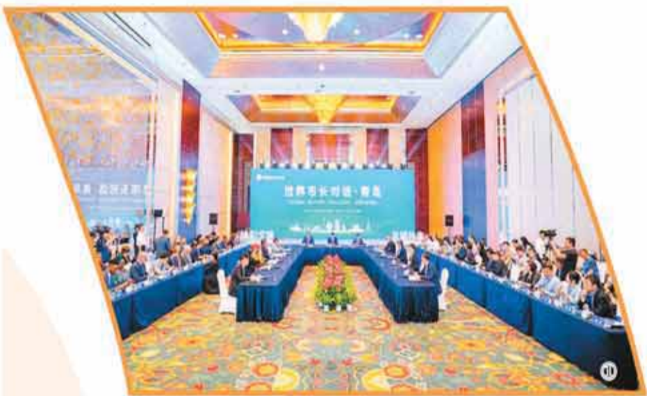
图①：“世界市长对话·青岛”活动现场。