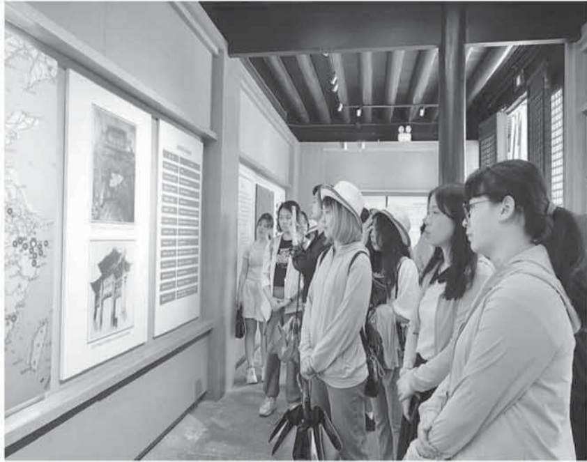
图为在宁波“阳明文化研习营”活动中，两岸青年在研习营中，刘子琳摄

一些实习活动还融入了文化体验环节。作为2025陕台文化交流周系列活动之一的台湾青年实习就业研习营近日走进陕西，60余名研习营成员前往西安交通大学、黄帝陵、秦始皇帝陵博物院、陕西历史博物馆等地参观，感受陕西深厚的历史底蕴和人文魅力。之后，他们将