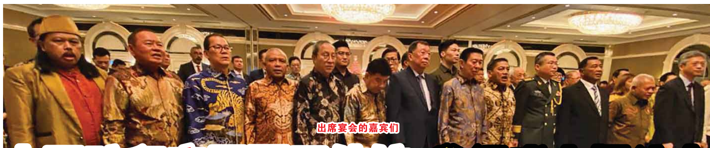
出席宴会的嘉宾们