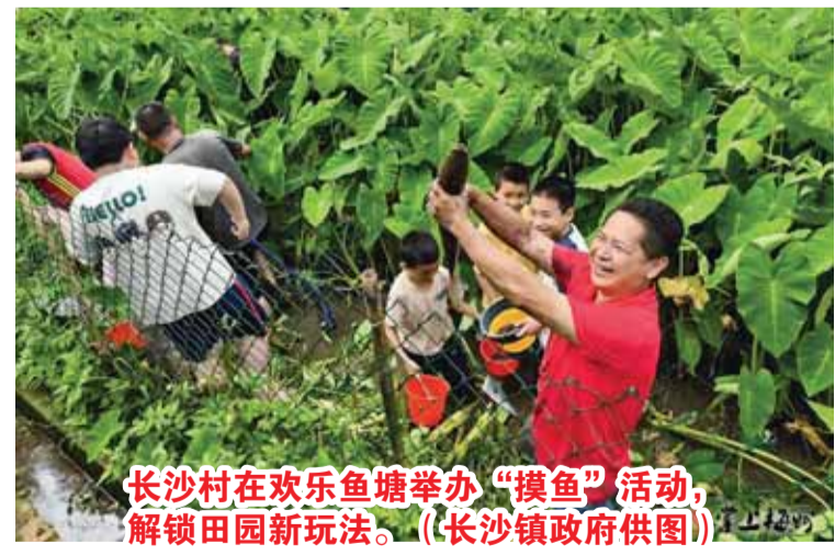
长沙村在欢乐鱼塘举办“摸鱼”活动，解锁田园新玩法。