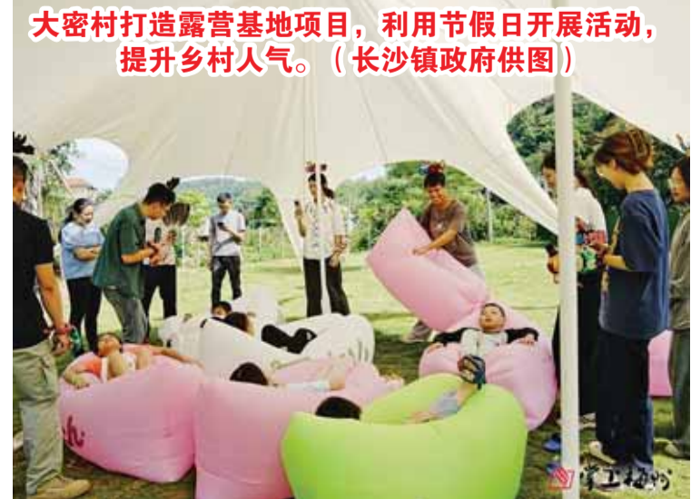
大密村打造露营基地项目，利用节假日开展活动，提升乡村人气。