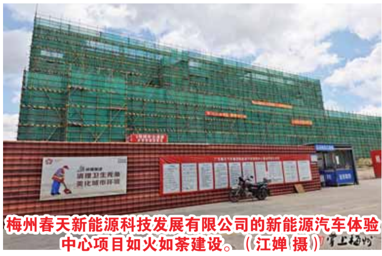
梅州春天新能源科技发展有限公司的新能源汽车体验中心项目如火如荼建设。(江婵摄)

文/梅州日报记者:江婵 图/梅州日报记者:林翔 特约记者:钟戈 陈绮冰 陈鸿 通讯员:吴文斌 陈润梓