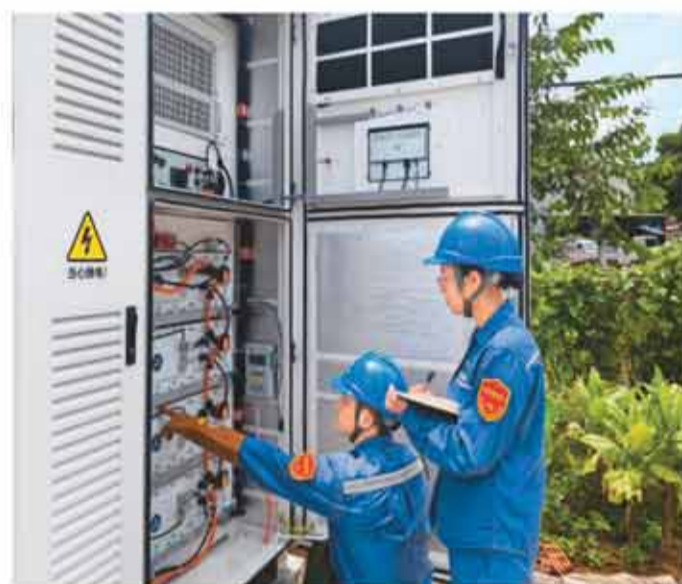
日前，随着广西玉林北流长塘村钠离子分布式储能等项目整体投产，长塘村已初步建成具备分布式特征的村级“源网荷储”融合一体化配电网。图为在长塘村，南方电网广西玉林供电局的工作人员对钠离子分布式储能装置进行投运前检查。

上半年，人民币各项贷款新增12.92万亿元，显示金融体系对实体经济信贷支持保持较高水平。其中，企事业单位贷款是信贷增长主体，上半年本外币企事业单位贷款增加11.5万亿元，主要是中长期贷款增加7.08万亿元，表明金融持续为实体经济提供稳定的资金来源。